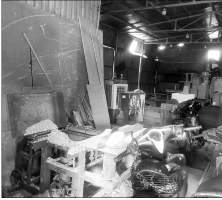
Xưởng gỗ tại lô đất 27, đường Nguyễn Sắc Kim, phường Hòa Xuân trong quá trình hoạt động xịt sơn PU gây ô nhiễm môi trường.

Người dân sinh sống tại tổ dân phố 74, phường Hòa Xuân (quận Cẩm Lệ) phản ánh, xưởng sản xuất gỗ tại lô đất 27, đường Nguyễn Sắc Kim, trong quá trình hoạt động xịt sơn PU phát tán mùi hôi, bụi bặm, gây ô nhiễm môi trường, ảnh hưởng nghiêm trọng đến cuộc sống và sức khỏe các hộ dân xung quanh. Người dân đề nghị chính quyền địa phương kiểm tra, xử lý dứt điểm tình trạng này.