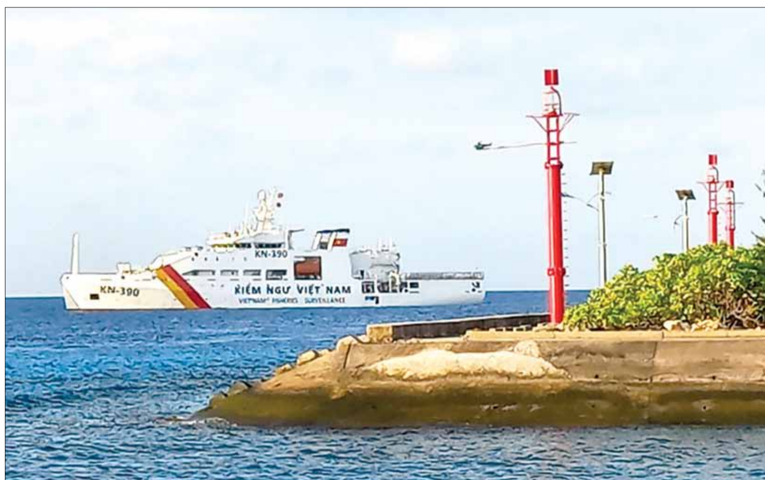
Tàu KN 390 khởi hành từ Quán cảng Vùng 3 Hải quân đưa đoàn công tác số 5-2024 neo đậu bên ngoài đảo Song Tử Tây, quần đảo Trường Sa.

Năm 2024, năm thứ 2 thành phố Đà Nẵng đóng vai trò cầu cảng đường thủy đưa các đoàn đại biểu trong nước ra thăm quần đảo Trường Sa. Tiếp tục các cuộc hải trình vươn ra biển đảo, thêm lục địa của Tổ quốc, từ ngày 5 đến 11-4-2024, tàu Kiểm ngư (KN 390) đã có chuyến hải trình đưa Trường Sa về gần với đất liền, đất liền gần với Trường Sa. Tổ quốc nhìn từ biển hiện hiện từ sức sống Trường Sa, tinh thần Trường Sa, ý chí Trường Sa vẹn nguyên tâm khảm cho mỗi ai vinh dự đặt chân đến nơi này.