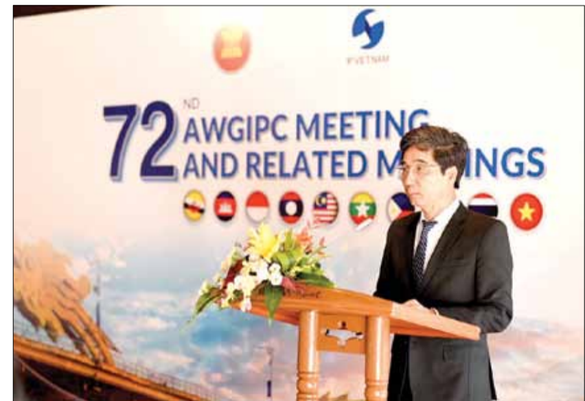
Phó Chủ tịch UBND thành phố Trần Chí Cường phát biểu tại Cuộc họp AWGIPC 72 tổ chức tại Đà Nẵng trong sáng 22-4.

qua, ASEAN đã đẩy mạnh hợp tác về sở hữu trí tuệ giữa các nước thành viên cũng như mở rộng quan hệ