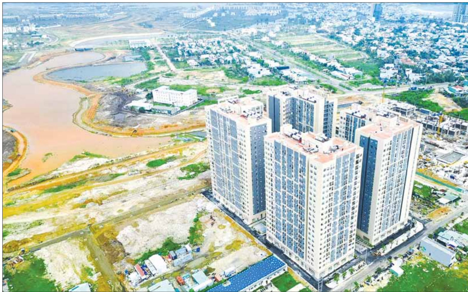
Số lượng căn hộ chung cư nhà ở xã hội được mở bán nhiều từ đầu năm 2023 đến nay là một điểm sáng của thị trường bất động sản Đà Nẵng. TRONG ẢNH: Dự án Khu chung cư nhà ở xã hội tại Khu đô thị xanh Bàu Tràm Lakeside (phường Hòa Hiệp Nam, quận Liên Chiểu) do Công ty CP Đầu tư Sài Gòn - Đà Nẵng làm chủ đầu tư.