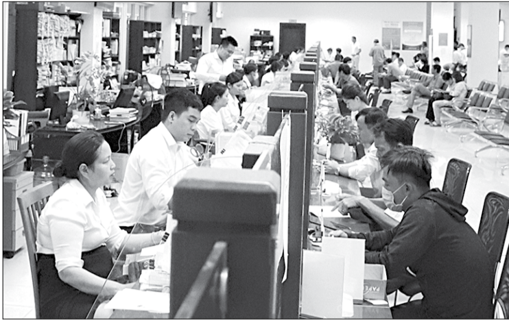
Tăng cường đạo đức công vụ là nhiệm vụ thường xuyên nhằm siết chặt kỷ cương, kỷ luật hành chính.

- Thời gian qua, thành phố triển khai thực hiện Chỉ thị số 29-CT/TU của Thành ủy về việc tiếp tục đẩy mạnh cải cách hành chính, tăng cường kỷ luật, kỷ cương, xây dựng đội ngũ cán bộ, công chức, viên chức (CBCCVC) gắn với học