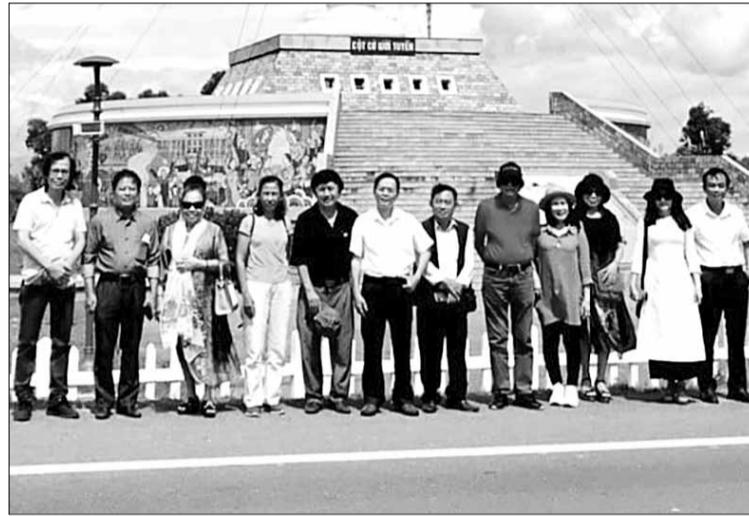
Đoàn nhà văn Đà Nẵng đi thực tế sáng tác tại Quảng Trị vào tháng 5-2022.

Hơn 22 năm qua, nhiều tác phẩm của các tác giả là Hội viên Hội Nhà văn thành phố thường xuyên ra mắt bạn đọc gần xa với nhiều tác phẩm