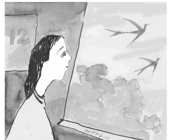
Minh họa: HOÀNG ĐẶNG

Cuối năm, ta xếp lại gọn gàng những dở dang, bỏ