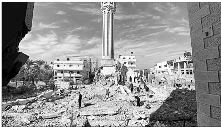
Đại thánh đường Omari, nhà thờ Hồi giáo lớn nhất và cổ nhất ở Gaza đã trở thành đống đổ nát sau đợt không kích của Israel tuần qua.

Từng bị phá hủy vì động đất và chiến tranh, từng nhiều lần được phục dựng, tòa thánh đường Omari có một lịch sử tồn tại vô cùng phong phú và phức tạp, trải