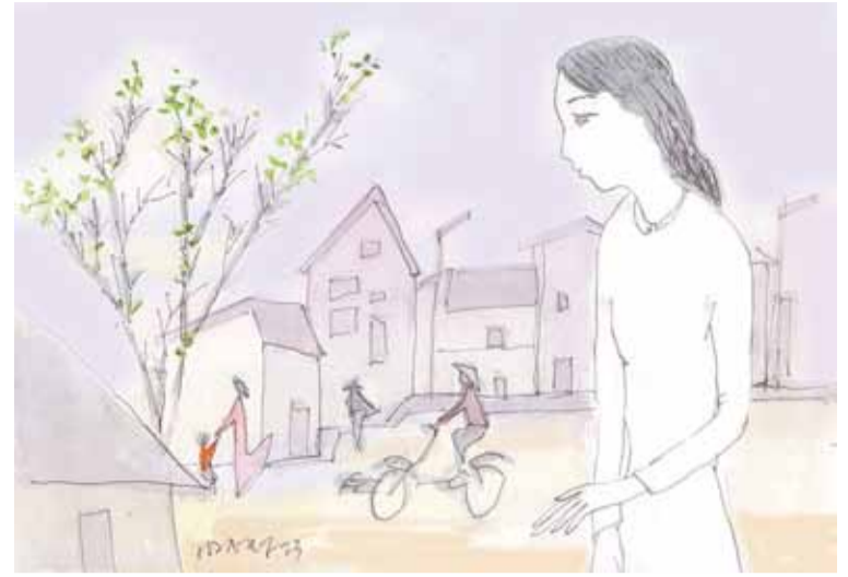
Minh họa: HOÀNG ĐẶNG

Những khoảng giao của đất trời đang dần diễn ra. Những chậu hoa hồng ta trồng ở trước sân sáng nay đã thấy chúng bung sắc, dấu còn khép nép bởi cái lạnh, nhưng mùi