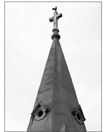
Tượng Gà trống Gaulois trên đỉnh tháp chuông Nhà thờ Con Gà Đà Lạt.