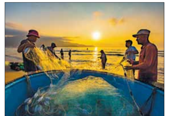
Thời gian kéo lưới rừng ngư dân thường chọn vào sáng sớm và có thể kéo dài đến chiều tối, tùy thuộc vào thời tiết nên không cố định thời gian trong ngày.