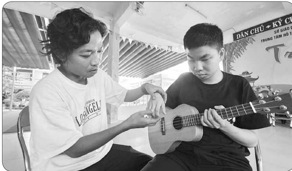
Anh Hy cho rằng, khi những đôi tay non nớt mò mẫm theo từng nốt nhạc rồi cất lên thành tiếng có thể giúp các em mở cửa tâm hồn về một thế giới tươi đẹp.