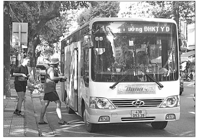
Du khách nước ngoài sử dụng xe buýt trợ giá tại Đà Nẵng.

Chuyến tàu xe làm tôi nhớ về năm tháng ấu thơ bên gia đình ở ngã ba Huế - cửa ngõ vào thành phố. Năm đó, tôi từng lóc cóc dậy từ 2 giờ sáng để ngồi cạnh xem mẹ nướng bánh tráng bán cho khách trên mấy chuyến xe Bắc - Nam, rồi chờ mấy đoàn tàu đi ngang phố nhà. Nó cũng tựa tựa cảm giác của “Hai đứa trẻ” mà nhà văn Thạch Lam viết. Mỗi chuyến hành trình như thế mang theo thứ ánh sáng của những miền đất khác. Mãi về sau, khi có nhiều dịp thức giấc nửa đêm trên một