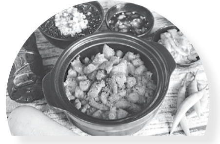
Thố cơm gà áp chảo hấp dẫn tại Tiệm ăn Chợ Lớn.

Nhắc đến Tiệm ăn Chợ Lớn (Đà Nẵng), hẳn thực khách sẽ nghĩ ngay đến những thố cơm nóng giòn, đậm