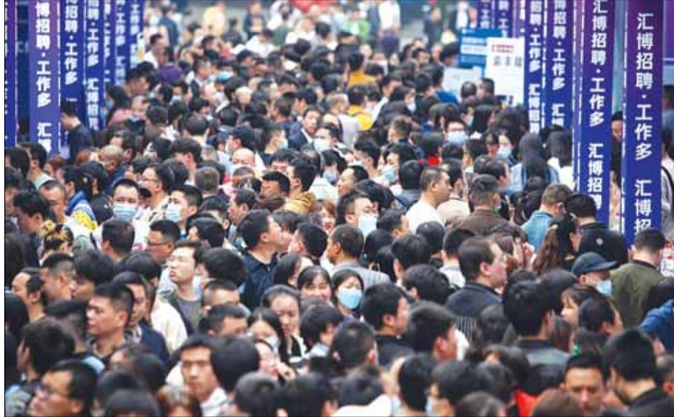
Người trẻ tìm kiếm việc làm tại Chợ việc làm ở thành phố Trùng Khánh, phía tây nam Trung Quốc.