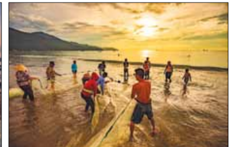
Kéo rừng cần có sức khỏe, kiên trì, kết hợp sức mạnh của cả tập thể.