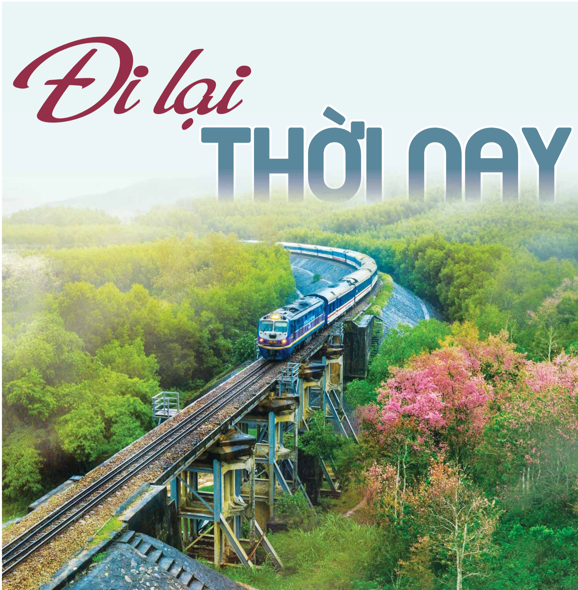
Hành trình bằng tàu lửa giờ đây đã nhanh hơn và từng bước trở thành chuyến đi để thưởng ngoạn, ngắm cảnh.