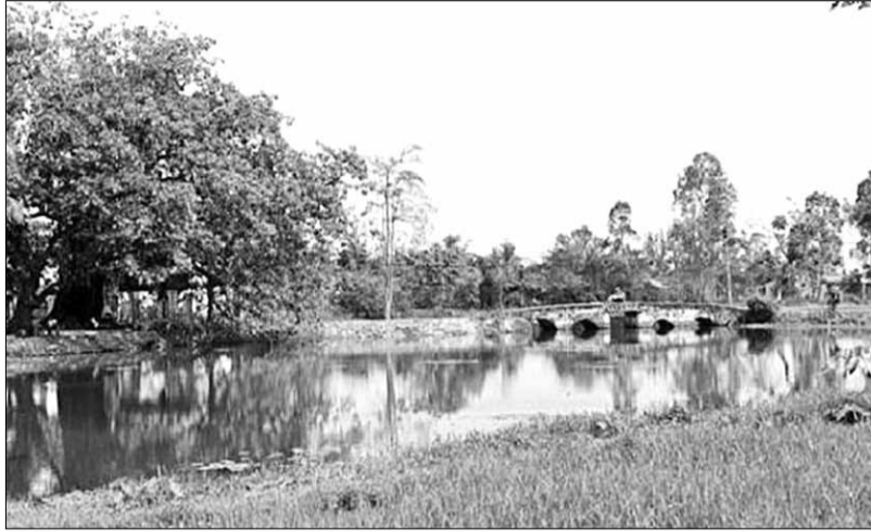
Một đoạn của Hà Khê nơi có cầu Hà Kiều bắc qua.

Đến thời nhà Nguyễn, làng Hà Lam mới được xác định cụ thể. Theo Địa bạ triều Nguyễn soạn trong khoảng 1812-1818, Hà Lam là một trong 29 làng của tổng Phú Mỹ Trung, huyện