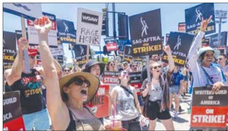
Một cuộc đình công của các thành viên Hiệp hội điện ảnh và truyền hình Mỹ diễn ra ở Hollywood, California.

Trong thỏa thuận này, hai bên thống nhất về mức lương tối thiểu, với mức tăng khoảng 8%. Con số này thấp hơn so với mong muốn ban đầu của các diễn viên nhưng là mức tăng lớn nhất trong nhiều thập kỷ. Ngoài ra, SAG AFTRA