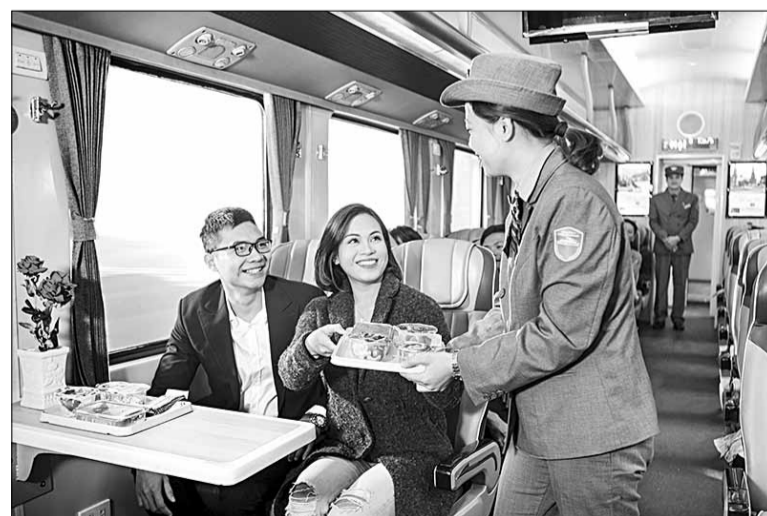
Thời gian qua, ngành đường sắt có nhiều cải thiện về dịch vụ, thiết kế điểm dừng để tàu hỏa không chỉ là phương tiện vận tải, mà còn là trải nghiệm du lịch thú vị.

mới về đến quê nhà Quảng Bình. Đó là chuyến tàu của những năm 2000, thời điểm tôi đang là sinh viên học tập tại Huế. Vào những dịp lễ, Tết hay nghỉ hè, có khi, để