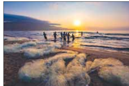
Trung bình, mỗi lần kéo như vậy sẽ mất khoảng 2-3 giờ đồng hồ.

Để hành nghề lưới rừng, ngư dân phải sắm tấm lưới dài, mắt lưới nhỏ. Hai người phụ trách công việc thả tấm lưới đó từ bờ ra biển khoảng 1,5km, rồi thả vòng theo hình bán nguyệt sao cho lưới vừa giáp vào bờ. Khi lưới đã được giăng ra ngoài biển, mọi người trên bờ chia thành 2 tốp, mỗi bên 6 - 8 người cầm dây rừng kéo lên, các loại cá biển sẽ lọt vào trong lưới.