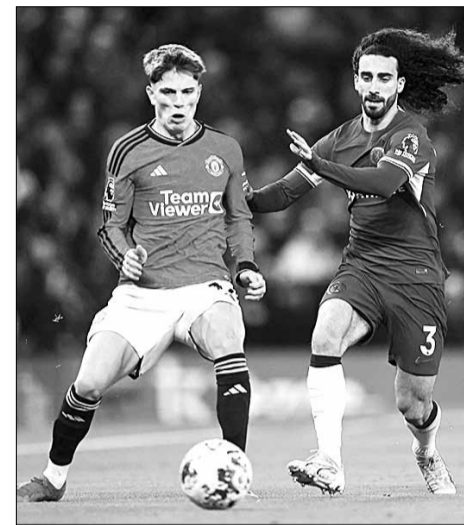
M.U và Chelsea cần nhiều điều phải làm trong phần còn lại của mùa giải.

Giữa tuần trước, M.U đã bại Chelsea 2-1 trong một trận đấu được đánh giá hay nhất của họ từ đầu mùa, ngay sau đó là "cú ăn 3" danh hiệu cá nhân tại Premier League tháng 11 với "Cầu thủ của tháng" thuộc về cựu đội trưởng Harry Maguire, "HLV của tháng" thuộc về ông thầy Erik ten Hag và "Bàn thắng của tháng" dành cho pha ngã bàn đền ấn tượng của Alejandro Garnacho. Nhìn những thông tin này, ai cũng nghĩ đó là tín hiệu cho thấy Quỷ đỏ chính thức trở lại đường đua top 4 và xa hơn, có thể là những danh hiệu.