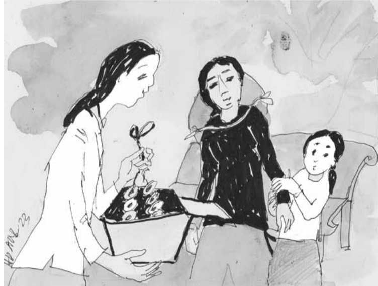
Minh họa: HOÀNG ĐẶNG

Thanh đưa tay chỉnh lại cổ áo len, phủi chút bụi trên quần jeans.