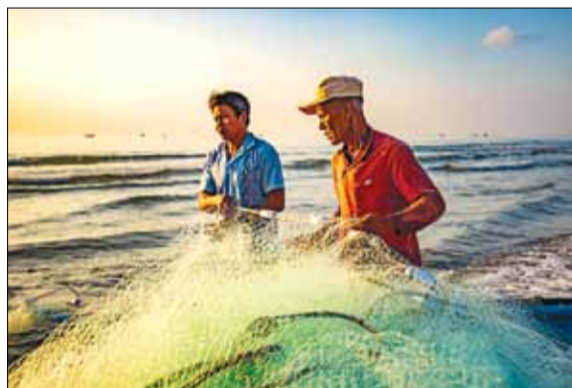
Nghề kéo lưới rừng đỡ nặng nhọc hơn nên đa số những người tham gia đều là phụ nữ hoặc người đã lớn tuổi.

Kéo lưới rừng tại biển Mân Thái (quận Sơn Trà) là nghề rất đặc biệt bởi những người làm nghề này đa số là những ngư dân đã lớn tuổi và thời gian hoạt động chủ yếu ở trên bờ. Cứ vào những ngày biển êm, lặng sóng là từng tốp ngư dân lại rủ nhau ra bờ biển để kéo lưới rừng. Ngư cụ phục vụ cho nghề này chỉ đơn giản là 1 tấm lưới dài vài ngàn mét, thuyền thúng và số lượng người tham gia khoảng từ 15 đến 20 ngư dân. Đà Nẵng cuối tuần giới thiệu đến bạn đọc nghề khai thác hải sản độc đáo với truyền thống lâu đời tồn tại đến ngày nay qua chùm ảnh của Minh Tú (Đà Nẵng).