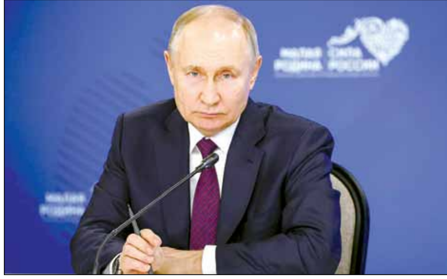
Tổng thống Nga Vladimir Putin đã thu thập được 2,5 triệu chữ ký ủng hộ của cử tri trên khắp đất nước.

Ông Putin đang được tiếp thêm sinh lực và đang hy vọng kéo dài thời gian cầm quyền 24 năm thêm 6 năm nữa nếu giành chiến thắng trong cuộc bầu cử dự kiến diễn ra từ ngày 15 đến 17-3.