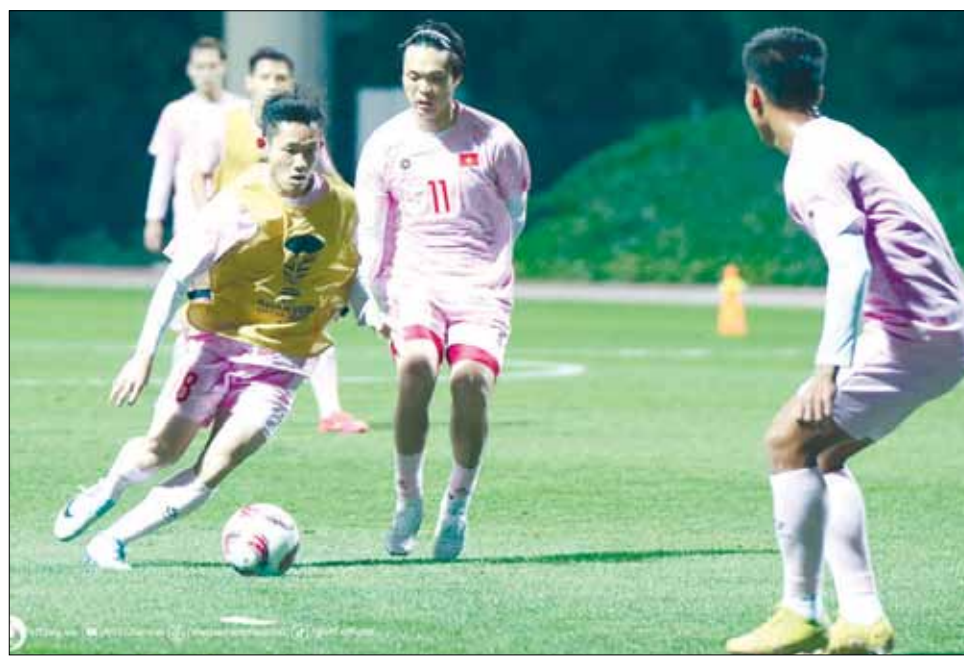
Đội tuyển Việt Nam nỗ lực tập luyện hướng đến trận đấu với Indonesia.

HLV Shin Tae-yong được kỳ vọng đưa bóng đá Indonesia vươn tầm. Tuy nhiên, từ khi đến với bóng đá xứ vạn đảo, chiến lược gia người Hàn Quốc chưa giúp Indonesia giành được danh hiệu nào. Giống như các giải đấu trải qua, Asian Cup 2023 mang đến nhiều áp lực cho HLV sinh năm 1970. Indonesia vào giải với loạt trận giao hữu thất vọng khi thua 4 trận, hòa 1 trận. Trong số này, có những trận thua đậm như: 1-5 trước Iraq, 0-5 trước Iran hay 0-4 trước Libya. Ở trận khai màn Asian Cup 2023, đội bóng này thua 1-3 trước Iraq. HLV Shin Tae Yong tìm mọi cách để giữ ghế trước áp lực từ người hâm mộ. Ông hiểu rằng, nếu thua Việt Nam, cơ hội đi tiếp sẽ không còn, đồng