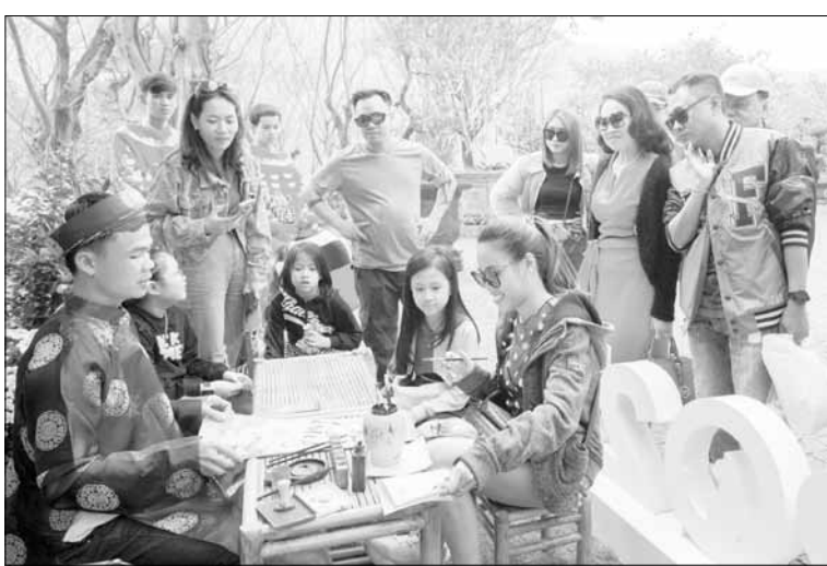
Các khu điểm du lịch đều trang trí, đầu tư thêm các hoạt động để phục vụ du khách trong dịp năm mới. TRONG ẢNH: Du khách thích thú với hoạt động viết thư pháp ngày đầu năm tại Công viên suối khoáng nóng Núi Thần Tài.

Ghi nhận tại các khu, điểm du lịch lớn như Khu du lịch Sun World Bà Nà Hills, Công viên suối khoáng nóng Núi Thần Tài, Công viên Châu Á, Da Nang Mikazuki Japanese Resorts & Spa... đều đầu tư các sản phẩm, tạo ra sự khác biệt ấn tượng dành cho du khách. Cụ thể, tại Khu du lịch Sun World Bà Nà Hills có lễ hội mùa xuân 2024 kéo dài từ ngày 20-1 đến 31-3 với chủ đề "Hội ngộ muôn sắc hoa" đem đến cho du khách những trải nghiệm giữa không gian mùa xuân rực rỡ với các loài hoa như tulip, hoa hồng, cẩm tú cầu, hướng dương... Đặc biệt, sự khoe sắc của hoa đào chuông góp phần tạo nên sức hút riêng và gia tăng sức hấp dẫn cho Bà Nà. Đến Bà Nà dịp này, du khách có thể nhìn ngắm vườn hoa tulip rực rỡ hơn 100.000 bông của hơn 10 loại khác nhau; có thể chụp ảnh (check-in) với những mô hình thiên thần mùa xuân mô phỏng các loài hoa trên đỉnh Bà Nà; trải nghiệm không gian văn hóa Tết cổ truyền Việt Nam với hình ảnh bánh chưng, pháo đỏ, mâm ngũ quả, hoa đào hay những trò chơi dân gian đậm đà bản sắc Việt (khu vực vườn Hội An); trải nghiệm gói bánh chưng ngày Tết (tại nhà hàng Beer Plaza),