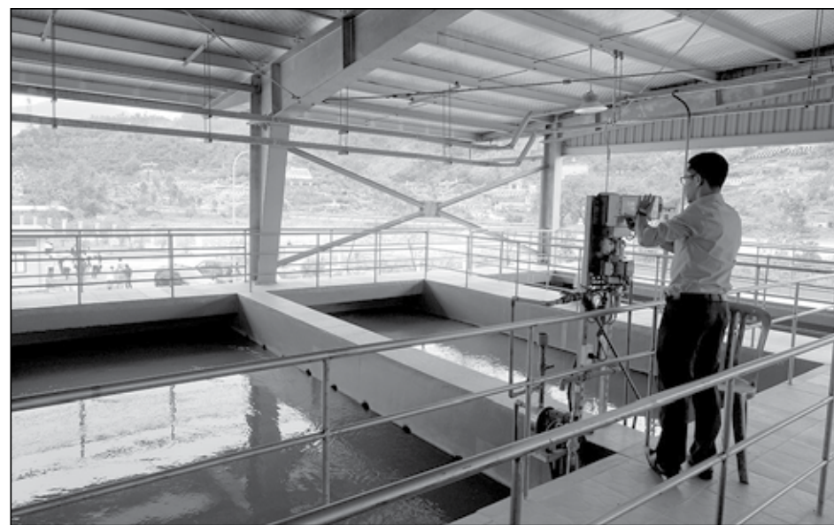
Các công đoạn xử lý nước tại Nhà máy nước Hòa Liên được điều khiển, giám sát và quan trắc tự động.

Hơn 7 tháng qua, cán bộ, nhân viên mới tổ chức bộ máy và xét tuyển dụng của Trung tâm Quản lý hạ tầng đô thị Đà Nẵng (thuộc Sở Xây dựng) đã tiếp cận kỹ thuật, làm chủ thiết bị, bảo đảm vận hành Nhà máy nước Hòa Liên (huyện Hòa Vang). Đến nay đã có hơn 6,7 triệu m 3 nước sạch được sản xuất và phát vào mạng lưới đường ống cấp nước sinh hoạt cho thành phố.