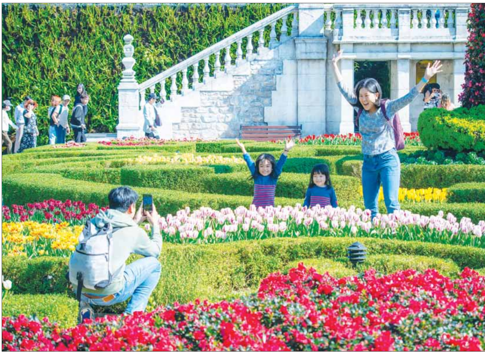
Du khách check-in vườn hoa tulip tại Khu du lịch Sun World Bà Nà Hills.