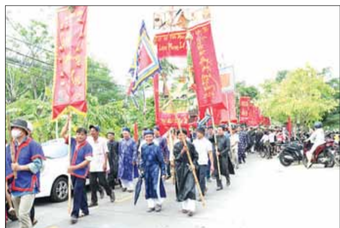
Lễ hội rước Mực Đổng làng Phong Lệ năm 2024.