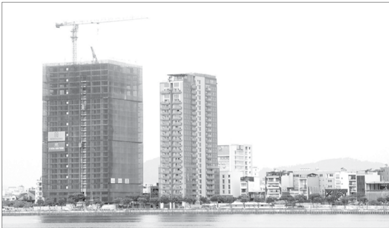
Một số dự án nhà ở được triển khai thi công ở quận Hải Châu mang lại những tín hiệu tích cực cho thị trường bất động sản Đà Nẵng.

Sở Xây dựng cũng chủ động theo dõi, giám sát chặt chẽ tình hình hoạt động của các dự án nhà ở xã hội trên địa bàn thành phố; đồng thời, xét duyệt 25 hồ sơ đủ điều kiện thuê nhà ở xã hội, 84 hồ sơ đủ điều kiện mua nhà ở xã hội, góp phần giải quyết nhu cầu nhà ở cho người dân và người lao động trên địa bàn thành phố. Cùng với đó, sở thường xuyên theo dõi, nhắc nhở yêu cầu các chủ đầu tư triển khai tiến độ các dự án theo đúng kế hoạch; khuyến cáo các tổ chức, cá nhân tham gia giao dịch bất động sản tìm hiểu kỹ tình trạng pháp lý dự án, chỉ thực hiện giao dịch tại các dự án bất động