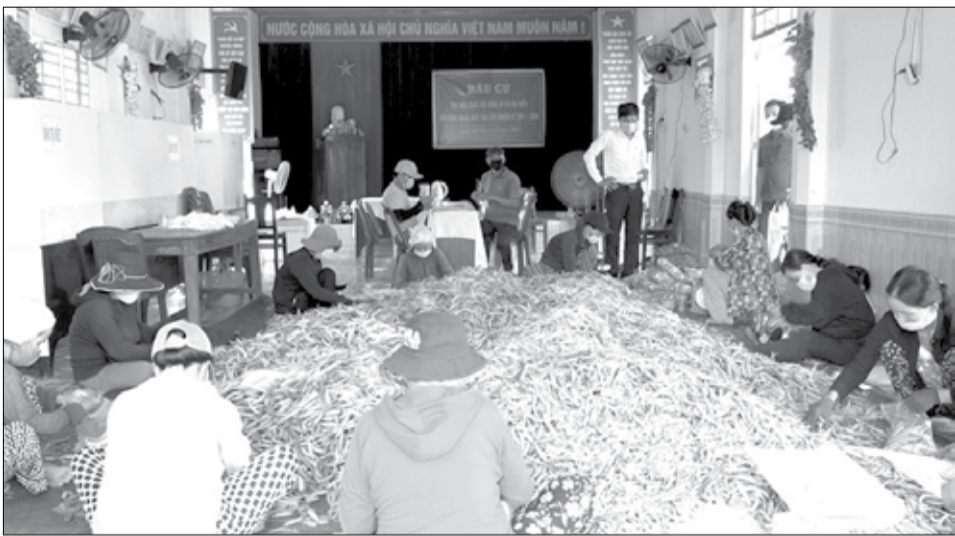
Hoạt động của tổ dân phố, thôn trên địa bàn thành phố ngày càng được nâng cao. TRONG ẢNH: Người dân thôn Bò Bẩn, xã Hòa Phong, huyện Hòa Vang phân loại ở trước khi đưa ra thị trường tiêu thụ. Ảnh: H.N

Bà Lan nói mình may mắn khi được kế thừa những “thành tựu” mà người tiền nhiệm đã làm và thấy ở nơi nào có cách làm hay liền đưa về áp dụng để tổ 90 ngày càng vững mạnh hơn. Là địa bàn khu chung cư, mỗi hộ đông 80.000 - 100.000 đồng/năm để chi trả cho người dọn vệ sinh, lau chùi hành lang mỗi tuần hai lần; thay bóng đèn bị cháy đọc hành