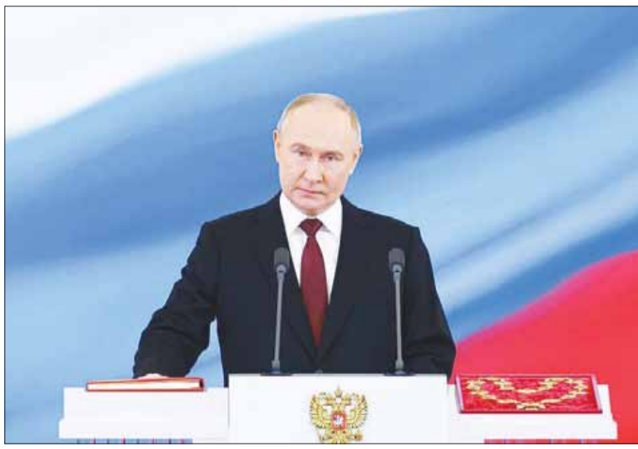
Tổng thống Nga Vladimir Putin tuyên thệ trong lễ nhậm chức tại Điện Kremlin ngày 7-5.

Về mối quan hệ với phương Tây, ông Putin tuyên bố Nga không loại trừ đối thoại với phương Tây. "Chúng tôi không từ chối đối thoại với các nước phương Tây. Sự lựa chọn là của họ: họ có ý định tiếp tục cố gắng kiểm chế sự phát triển của Nga, tiếp tục chính sách gây áp lực không ngừng mà họ đã theo đuổi trong nhiều năm hay tìm kiếm con đường hợp tác và hòa bình, chúng ta sẽ chiến thắng các cuộc thảo luận về các vấn đề an ninh