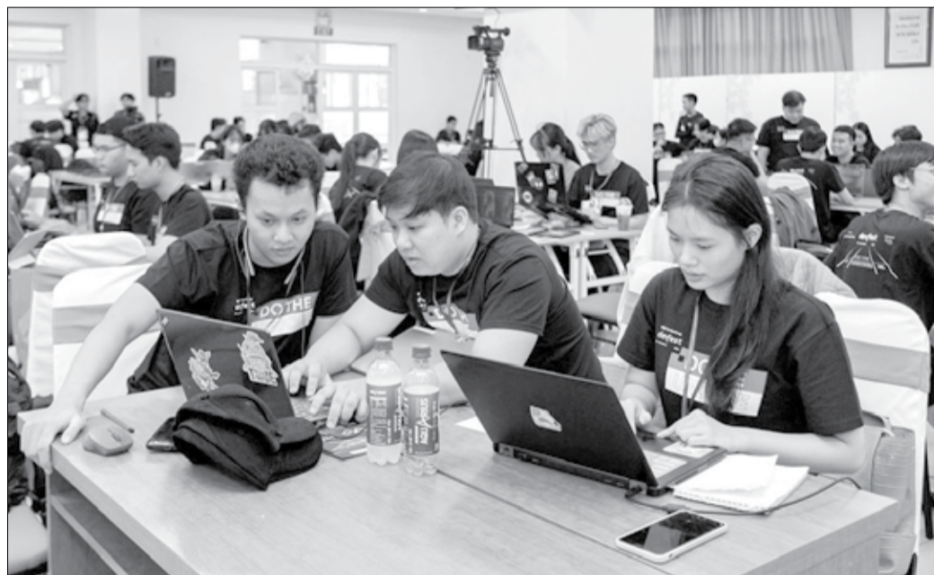
Các lập trình viên tham gia cuộc thi AI Hackathon do Vườn ươm doanh nghiệp Đà Nẵng phối hợp với Google Developer Group MienTrung và Sở Khoa học và Công nghệ tổ chức cuối năm 2023. Ảnh: M.Q

Đà Nẵng cũng là điển hình về triển khai dịch vụ công trực tuyến với mục tiêu 100% thủ tục hành chính đủ điều kiện cung cấp trực tuyến sẽ đưa lên cung cấp trực tuyến, tạo thuận lợi nhất cho người dân sử dụng. Đến nay đã có 98% tổng số thủ tục hành chính đã được cung cấp là dịch vụ công trực tuyến toàn trình. Thành phố đã ban hành nghị quyết về chính sách giảm lệ phí khi thực hiện dịch vụ công trực tuyến, giảm đến 50% thời gian xử lý hồ sơ trực tuyến so với trực tiếp... Đặc biệt, Đà Nẵng đã triển khai tích cực nhiệm vụ được Ủy ban Quốc gia chuyển đổi số giao thành phố chủ trì là "Tổ chức triển khai mô