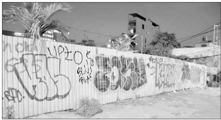
Vẽ bậy trên tường tôn đường Võ Nguyên Giáp.

Tình trạng vẽ bậy, bôi bẩn lên tường, cửa cuốn của nhà dân, lên các tủ điện, cột điện, chân cầu, dây tôn rào các công trình dọc đường, đặc biệt là nhà chờ xe buýt... đang xảy ra ngày càng nhiều trên địa bàn thành phố.