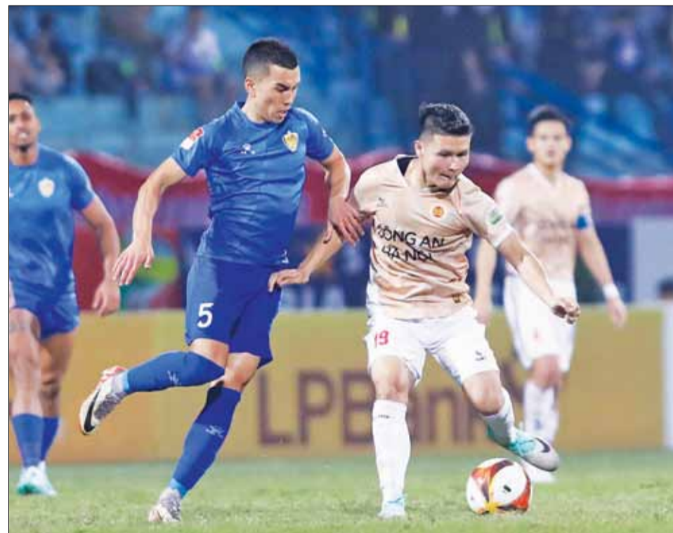
17 giờ ngày 8-5, trên sân Hòa Xuân, Quảng Nam (bên trái) tiếp Công an Hà Nội tại vòng 17 V-League.