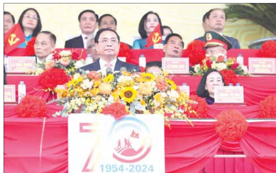
Thủ tướng Chính phủ Phạm Minh Chính trình bày diễn văn kỷ niệm.