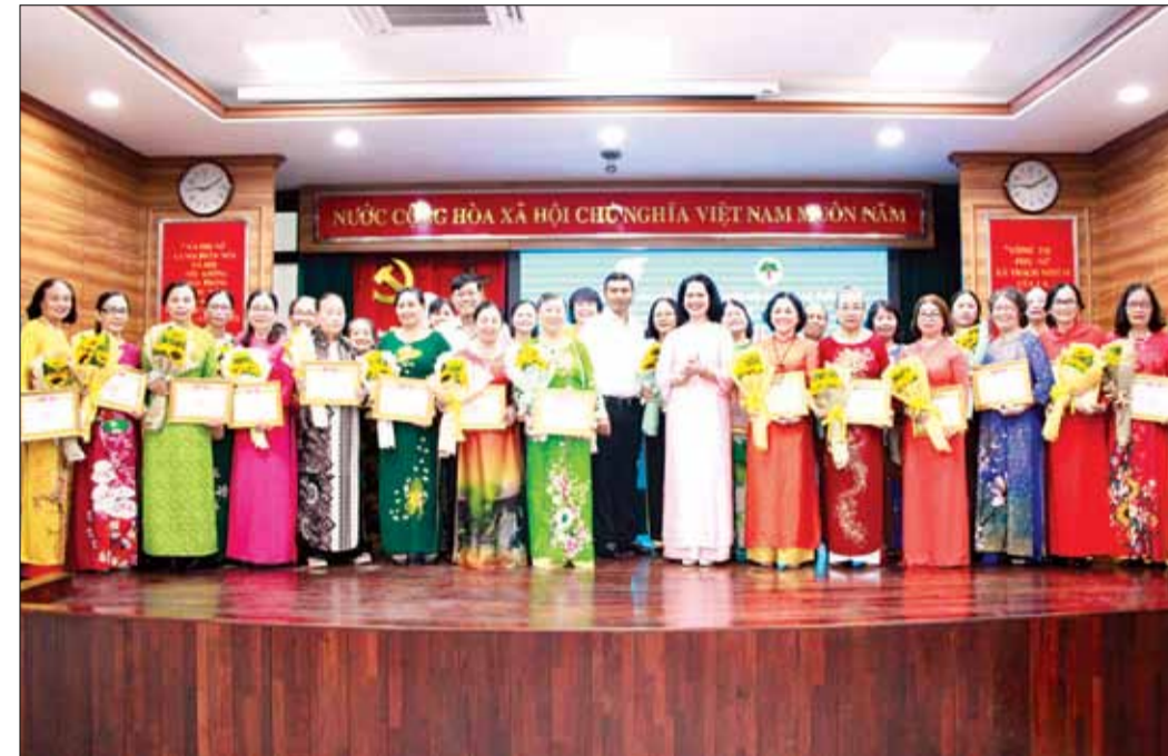
Phó Chủ tịch Thường trực UBND thành phố Hồ Kỳ Minh (giữa) tặng giấy khen cho các phụ nữ tiêu biểu.

Ngày 15-5, phát biểu tại hội nghị biểu dương "Phụ nữ cao tuổi tiêu biểu trong xây dựng gia đình văn hóa, ấm no, hạnh phúc" năm 2024 do Hội Liên hiệp Phụ nữ (LHPN) phối hợp Hội Người cao tuổi thành phố tổ chức, Phó Chủ tịch Thường trực UBND thành phố Hồ Kỳ Minh cho biết, những năm qua, Hội LHPN và Hội Người cao tuổi thành phố có chương trình phối hợp đồng viên, khích lệ phụ nữ cao tuổi phát huy vai trò "Tuổi cao - Gương sáng" trong nhiều lĩnh vực