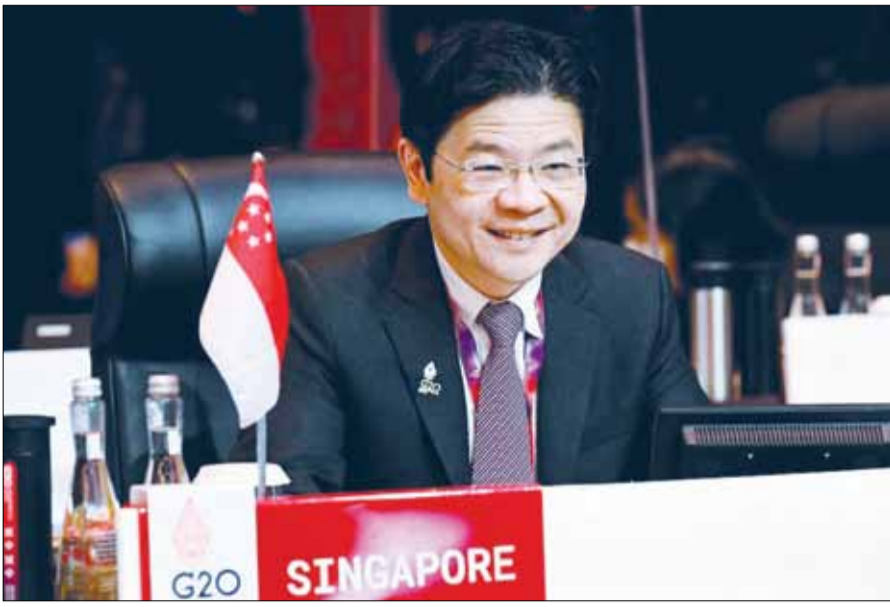
Phó Thủ tướng kiêm Bộ trưởng Tài chính Hoàng Tuấn Tài trở thành Thủ tướng mới của Singapore.

Ngày 15-5, Phó Thủ tướng kiêm Bộ trưởng Tài chính Lawrence Wong (Hoàng Tuấn Tài) chính thức trở thành Thủ tướng mới của Singapore, đánh dấu sự chuyển giao lãnh đạo lần đầu tiên trong gần 20 năm tại quốc đảo sư tử.