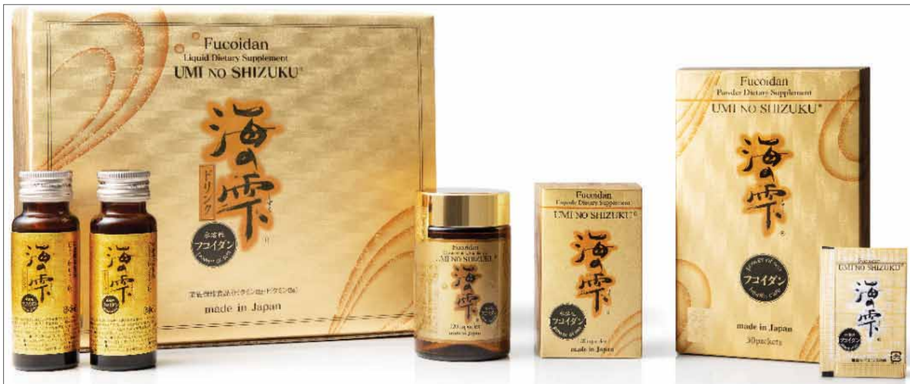
Sản phẩm Fucoidan Umi No Shizuku được nhập khẩu trực tiếp từ Nhật Bản.

Công ty mẹ của Umi No Shizuku - Kamerycah Foods là một trong những nhà sản xuất thực phẩm biển hàng đầu của Nhật bản với hơn 40 năm lịch sử, chuyên cung