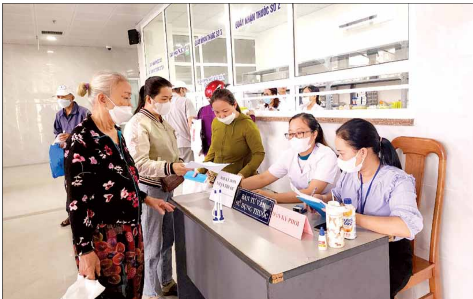
Người dân làm thủ tục đăng ký khám, chữa bệnh tại Trung tâm Y tế quận Cẩm Lệ.