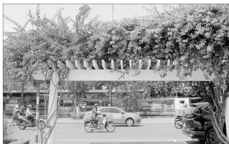
Tại tuyến đường Bạch Đằng (quận Hải Châu), nơi thu hút nhiều du khách ghé qua, những giàn hoa giấy kết thành từng chùm to với đa dạng sắc màu (hồng, đỏ, cam, trắng) tạo nên khung cảnh yên bình, sinh động, tràn đầy sức sống.