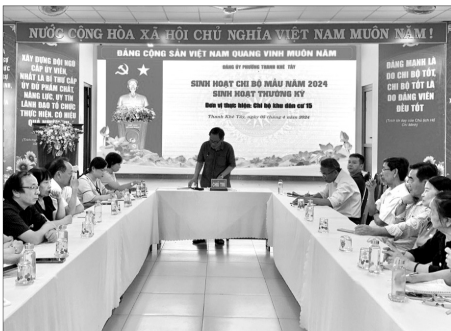
Chi bộ Khu dân cư 15 (phường Thanh Khê Tây) tổ chức sinh hoạt chi bộ mẫu năm 2024. Ảnh: T.P

Chất lượng sinh hoạt chưa tốt do chưa bảo đảm thời gian, nội dung; cách thức chuẩn bị và tổ chức, điều hành sinh hoạt chưa phù hợp dẫn đến chưa phát huy hiệu quả vai trò hạt nhân lãnh đạo toàn diện của chi bộ... Nhận diện rõ những hạn chế đó, Đảng ủy phường Thanh Khê Tây (quận Thanh Khê) tổ chức mô hình sinh hoạt chi bộ mẫu, từ đó rút kinh nghiệm trong toàn Đảng bộ phường về nâng cao chất lượng sinh hoạt chi bộ. Đây là phường đầu tiên ở quận Thanh Khê thực hiện mô hình này.