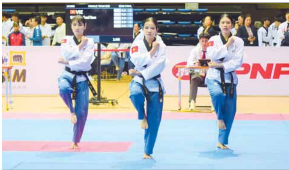
Các vận động viên đội tuyển Taekwondo Việt Nam tranh tài nội dung quyền đồng đội nữ tại giải vô địch Taekwondo châu Á 2024.

Giải vô địch Taekwondo châu Á 2024 đang diễn ra kịch tính, hấp dẫn tại Cung thể thao Liên Sơn (Đà Nẵng) và mở cửa tự do cho khán giả vào sân theo dõi, cổ vũ. Đây là lần thứ tư Việt Nam là chủ nhà và là lần đầu tiên giải đến với Đà Nẵng.