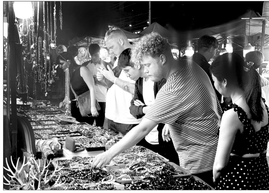
Ngành du lịch đã rất nỗ lực thu hút đa dạng các thị trường khách đến Đà Nẵng trong thời gian qua. TRONG ẢNH: Khách quốc tế tham quan, mua sắm tại chợ đêm Sơn Trà.

Những tháng đầu năm 2024, sự tăng trưởng của các thị trường khách du lịch quốc tế, cùng với việc thu hút liên tục các đoàn khách MICE (du lịch kết hợp hội nghị, hội thảo) lớn đến Đà Nẵng, ngành du lịch thành phố kỳ vọng du lịch sẽ có sự khởi sắc đáng kể trong năm nay.