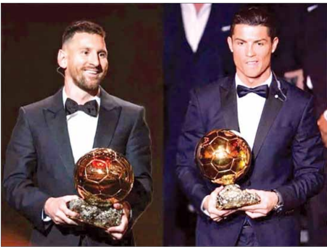
Messi và Ronaldo cùng không có tên trong danh sách đề cử Quả bóng Vàng 2024.

Như vậy, sau hơn 20 năm liên tục có tên trong danh sách đề cử, kỷ nguyên của Messi và Ronaldo có thể nói là đã kết thúc. Năm 2004, Ronaldo lần đầu tiên lọt vào danh sách đề cử 30 cầu thủ xuất sắc nhất thế giới khi nổi bật trong màu áo CLB Manchester United và đội tuyển Bồ Đào Nha ở kỳ EURO trên sân nhà. Trong khi đó, với trường hợp Messi, lần đầu tiên anh xuất hiện trong danh sách đề cử của France Football là năm 2006. Kể từ đó, cả hai luôn duy trì cuộc cạnh tranh không ngừng để chiếm lấy ngôi vị số 1 bóng đá thế giới. Giữa Messi và Ronaldo nắm giữ tổng cộng 13 trong số 15 giải thưởng gần đây nhất: 8 cho cựu cầu thủ Barcelona và 5 cho cựu tiền đạo Real Madrid. Năm 2022, khi Karim Benzema đang quang, có một ngoại lệ là Messi vắng mặt trong danh sách đề cử (ngược lại, anh giành giải The Best của FIFA cho màn trình diễn ở World Cup tại