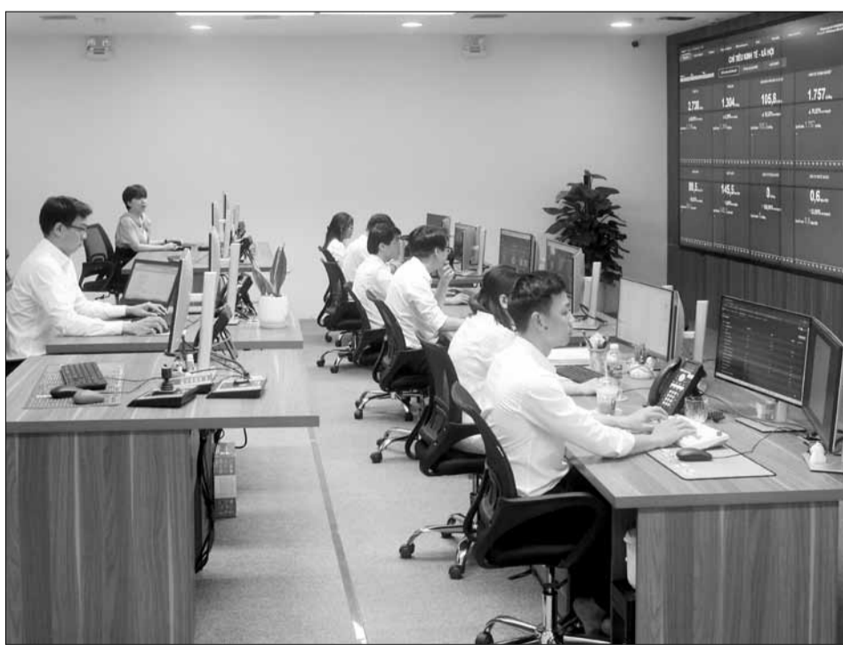
Trung tâm Giám sát, điều hành thông minh Đà Nẵng đi vào hoạt động góp phần thúc đẩy dịch vụ công trực tuyến toàn trình.

Đà Nẵng hiện có trạm cáp quang biển cấp bờ tại phường Hòa Hải (quận Ngũ Hành Sơn) với 2 tuyến cáp quang SMW và APG, với tổng dung lượng hiện tại là 55,132 Tb/s, chiếm 14,37% tổng dung