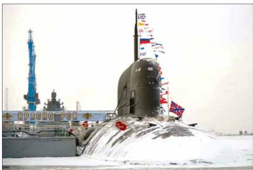
Tàu ngầm chạy bằng năng lượng hạt nhân mới Krasnoyarsk tại lễ ra mắt ở Severodvinsk, phía bắc của Nga cuối năm 2023.

Trước đó, RIA dẫn lời Chủ tịch Ủy ban Quốc phòng Hạ viện Nga Andrei Kartapolov cho biết: "Nếu chúng tôi thấy rằng thách thức và mối đe dọa gia tăng, chúng tôi có thể thay đổi một số điều trong học thuyết hạt nhân, về thời điểm và điều kiện sử dụng vũ khí hạt nhân". Tại Diễn