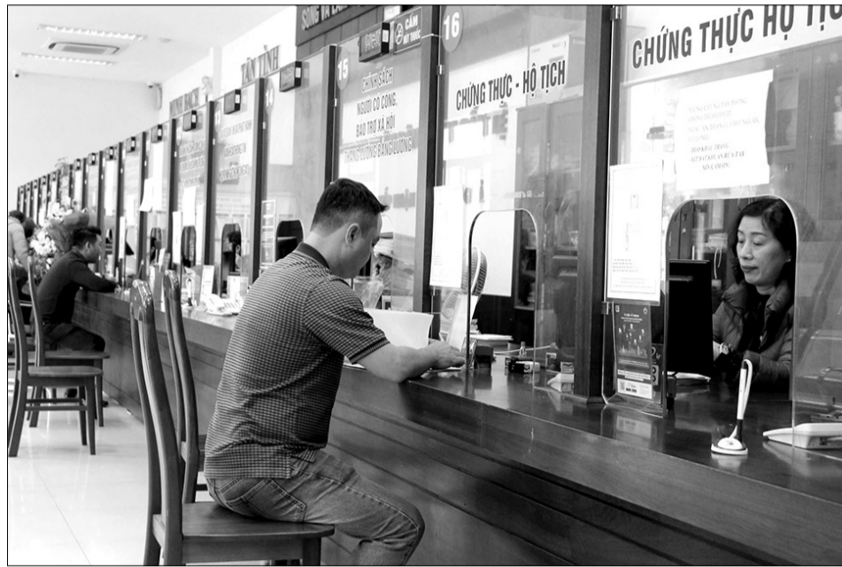
Người dân đến giao dịch tại bộ phận "Một cửa" quận Cẩm Lệ.

Từ khi Thành ủy ban hành Chỉ thị số 34-CT/TU về tiếp tục đẩy mạnh cải cách hành chính, tăng cường kỷ luật, kỷ cương, khắc phục tình trạng né tránh, đùn đẩy, không làm đúng, đầy đủ chức trách, nhiệm vụ, quyền hạn của một bộ phận cán bộ, đảng viên, công chức, viên chức trong tình hình hiện nay, nhận thức của cán bộ, công chức, viên chức quận Cẩm Lệ có nhiều chuyển biến tích cực, thể hiện rõ ở sự dám nghĩ, dám làm và dám chịu trách nhiệm, nỗ lực thực hiện và hoàn thành nhiệm vụ phát triển kinh tế - xã hội, bảo đảm quốc phòng - an ninh trên địa bàn.