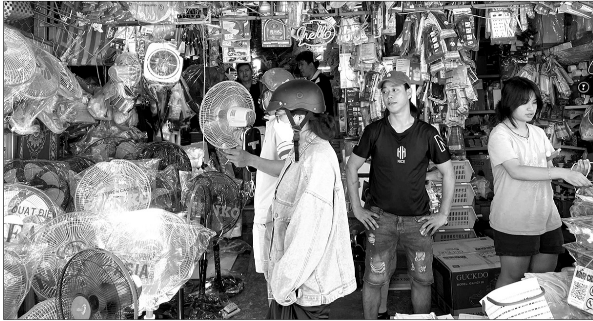
Hàng quán bán đồ gia dụng sôi động dịp đầu năm học mới. TRONG ANH: Không khí mua sắm đồ gia dụng ở chợ Bắc Mỹ An (quận Ngũ Hành Sơn).

Thời điểm này học sinh phổ thông, sinh viên, học viên các trường đại học, cao đẳng, trường nghề trên địa bàn thành phố bước vào năm học mới, theo đó hoạt động mua bán tại các chợ, cửa hàng gia dụng cũng như dịch vụ hàng ăn uống khá sôi động.