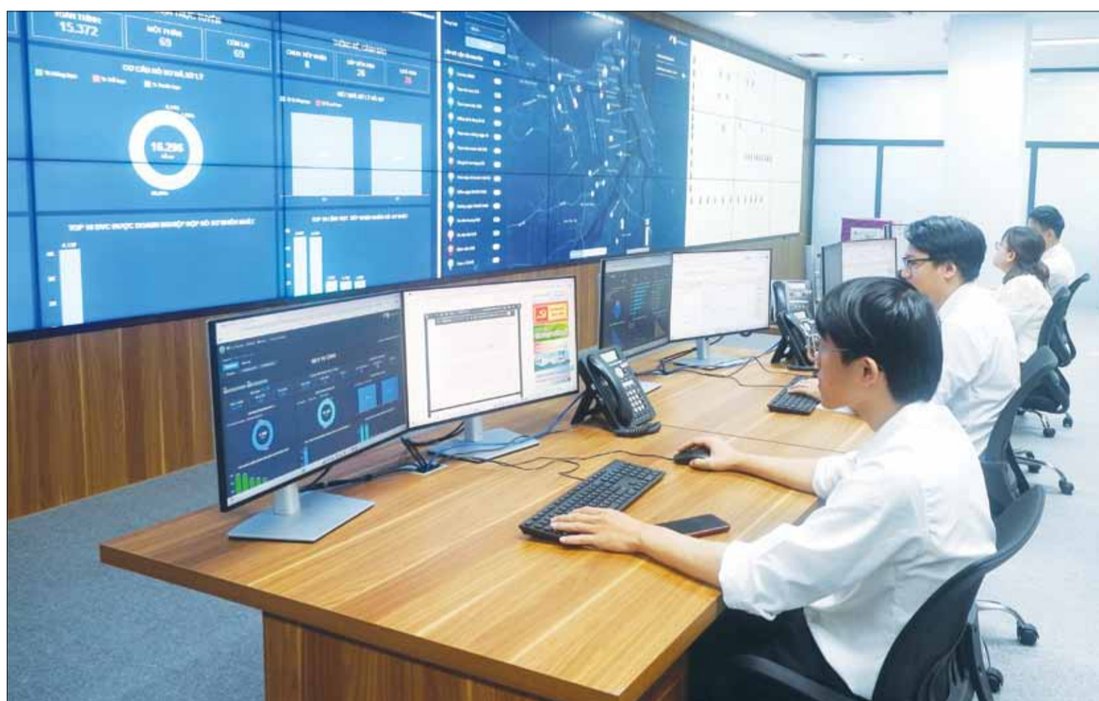
Trung tâm giám sát điều hành thông minh thành phố đi vào hoạt động góp phần thúc đẩy dịch vụ công trực tuyến toàn trình.