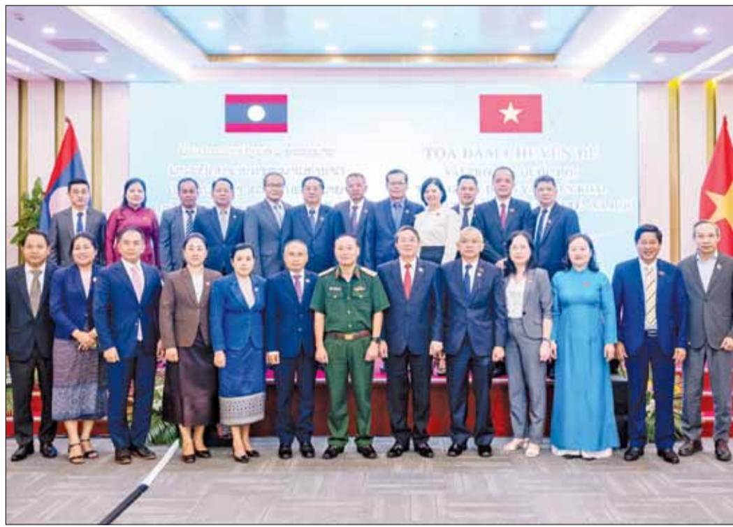
Phó Chủ tịch Quốc hội Nguyễn Đức Hải (thứ 8, bên trái) và Phó Chủ tịch Quốc hội Lào Sommad Pholsena (thứ 5, bên phải) chụp ảnh lưu niệm cùng các đại biểu tham dự tọa đàm "Vai trò của Quốc hội trong xây dựng và phát triển chính sách phát triển kinh tế - xã hội".