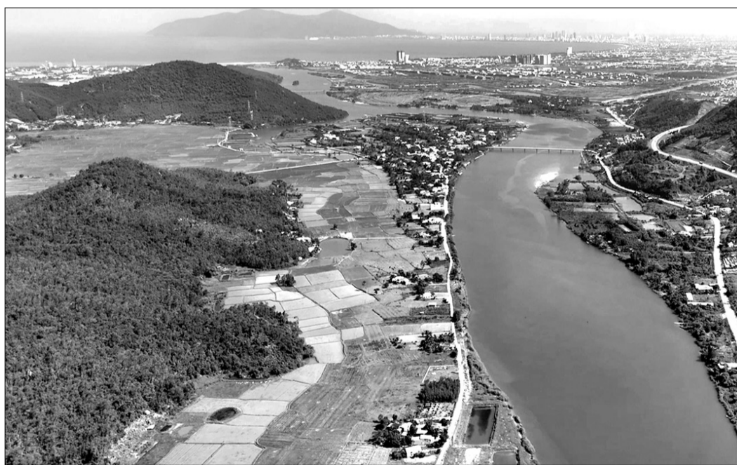
Thành phố được Quốc hội thống nhất cho thực hiện trước công tác chuẩn bị thu hồi đất để xây dựng các khu công nghiệp, trung tâm logistics... TRONG ẢNH: Khu vực xã Hòa Liên (huyện Hòa Vang), nơi dự kiến được xem xét lựa chọn để xây dựng trung tâm logistics, khu sản xuất thuộc Khu thương mại tự do Đà Nẵng.