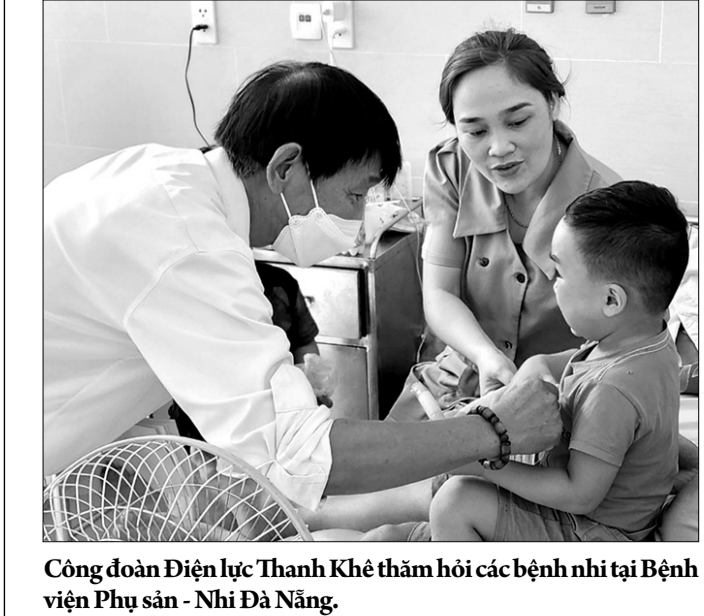
Công đoàn Điện lực Thanh Khê thăm hỏi các bệnh nhi tại Bệnh viện Phụ sản - Nhi Đà Nẵng.