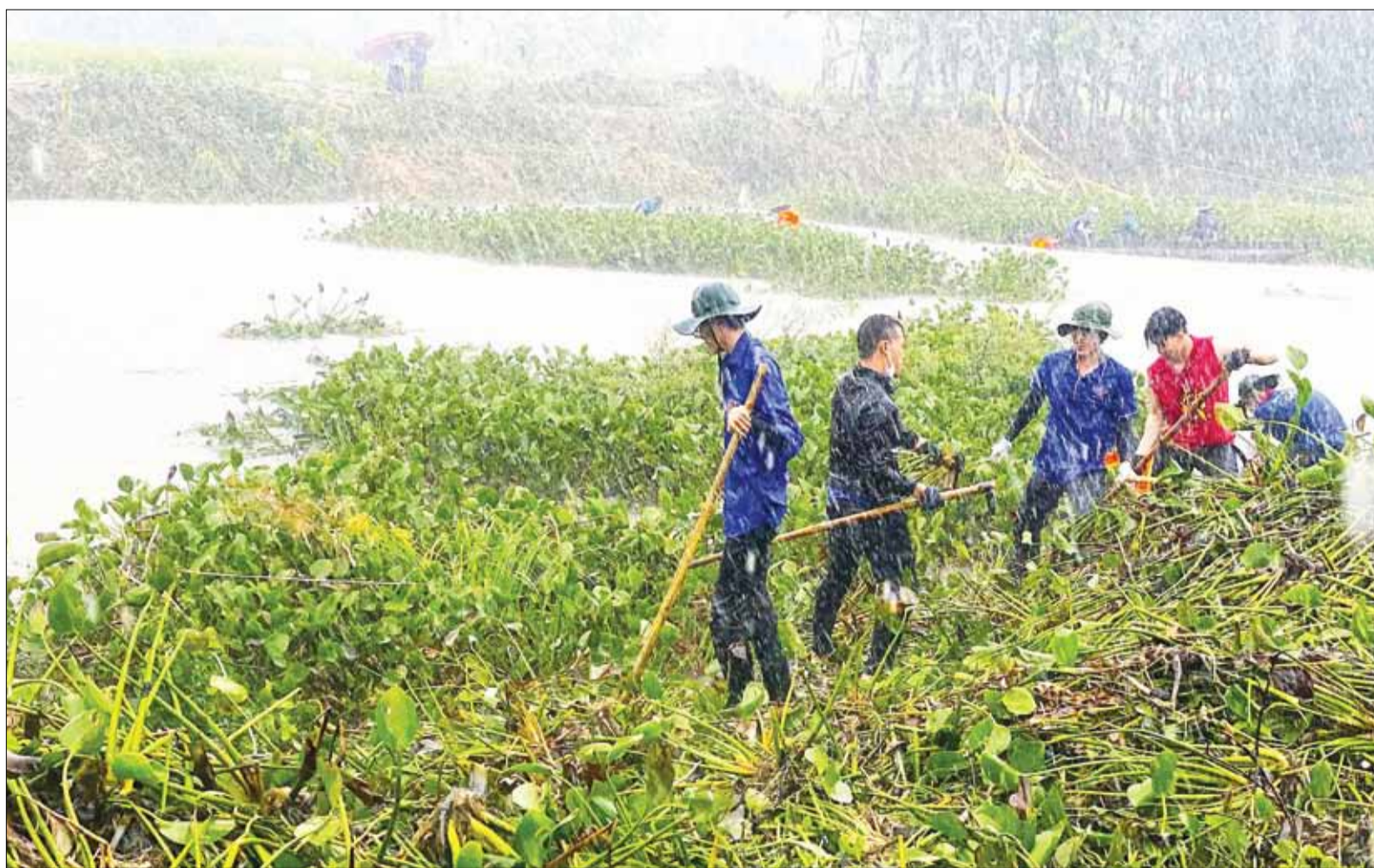
Gán 400 đoàn viên thanh niên khơi thông dòng chảy tại Bàu Tre (thôn Trước Đông, xã Hòa Nhơn, huyện Hòa Vang) trong tháng 6-2024.