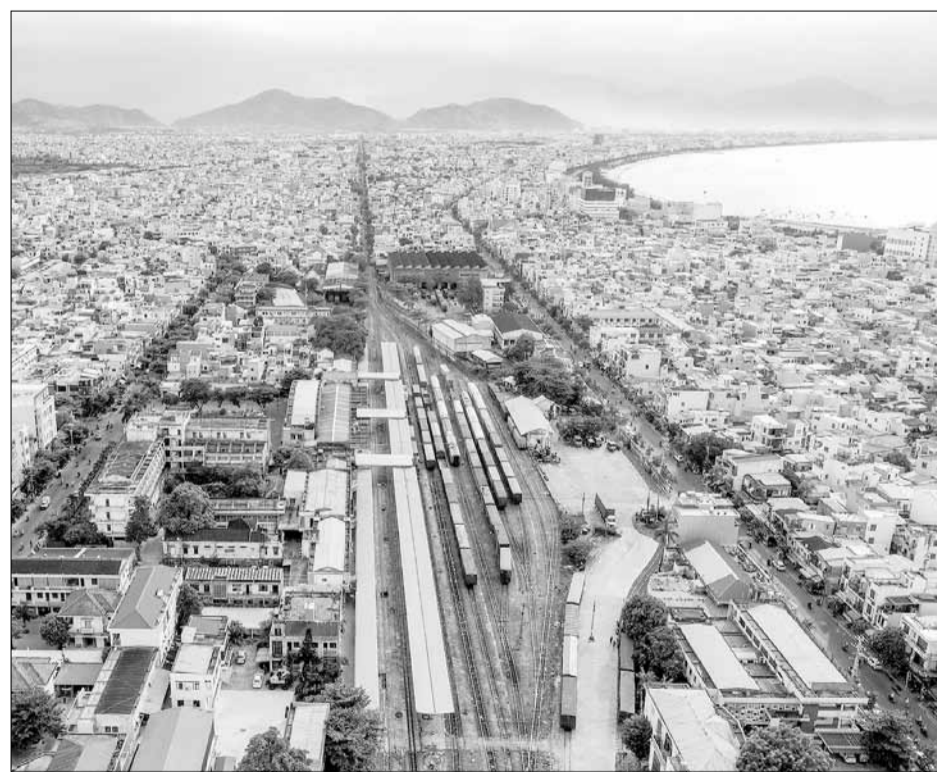
Hiện trạng ga Đà Nẵng.

Cục Đường sắt Việt Nam vừa trình Bộ Giao thông vận tải (GTVT) để xuất dự án cải tạo tuyến đường sắt qua khu vực đèo Hải Vân và di dời ga Đà Nẵng, với tổng mức đầu tư dự kiến lên đến 19.000 tỷ đồng. Dự án này được kỳ vọng sẽ khắc phục những hạn chế hiện tại, đồng thời đã phát triển cho giao thông và hạ tầng đô thị Đà Nẵng trong giai đoạn 2026-2031.