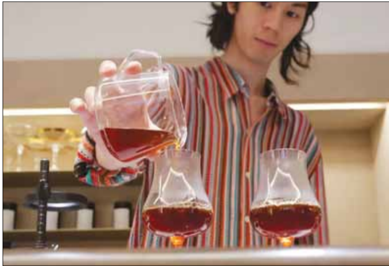
Một nhân viên pha chế cà phê pour-over tại Ignis Coffee ở Tokyo, quán nổi tiếng với các phương pháp độc đáo và những loại hạt cà phê hiếm.

Ignis Coffee, quán cà phê khai trương vào cuối năm 2020 tại khu phố Sendagi phía đông Tokyo, là một trong những điểm đến đặc biệt với phong cách tối giản nhưng vẫn nổi bật. Khách hàng đến đây để trải nghiệm những tách cà phê pour-over (cà phê pha thủ công)