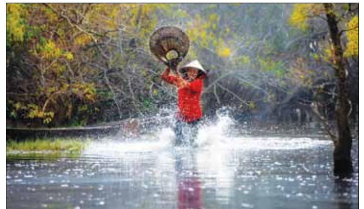
Rú Chá là đầm phá nước lợ lớn nhất khu vực Đông Nam Á với nhiều loài động thực vật phong phú, nơi cư trú của các loài thủy sinh nước lợ.

Hãy gửi cho chúng tôi những tác phẩm mà các bạn yêu thích. Địa chỉ: maichimai2611@gmail.com