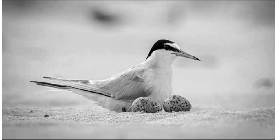
Loài Nhàn nhỏ ấp trứng tại bãi biển Đà Nẵng.

Là một nữ NAG chuyên chụp ảnh chim hoang dã ở khu vực miền Trung, chị Linh