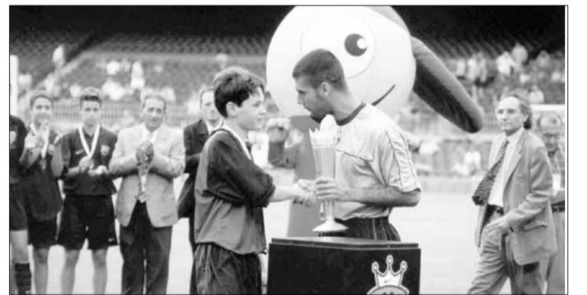
Iniesta ngày trẻ (bên trái) gặp người đàn anh Pep Guardiola tại đội trẻ Barcelona.