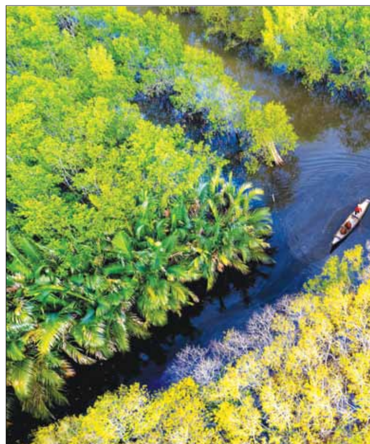
Khi thời tiết sang Thu, toàn bộ cây chá ở nơi đây sẽ chuyển từ màu xanh sang

Đà Nẵng cuối tuần mời bạn cùng chiêm ngưỡng rừng ngập mặn Rú Chá vào mùa đẹp nhất trong năm qua chùm ảnh của tác giả Nhị Văn (Đà Nẵng).