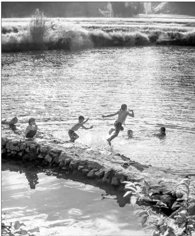
Những mùa mưa đợi cá, mùa nắng tắm sông trở thành kỷ niệm theo mình suốt đời.

Đó là bão chứ lụt thì chẳng ai nói trước được, thường thì vào cuối tháng Chín (âm lịch), sau những cơn mưa lớn kéo dài thì lụt tràn về. Không báo trước nhưng hình như ai cũng ngấm ngấm một sự mong đợi nước lụt tràn bờ. Thứ nước lên ngày đầu ấy chẳng hiểu sao được gọi là “nước bạc”, mẹ tôi nói nó độc lắm, nếu ngấm lâu thì sẽ bị “hà ăn chum”. Lũ nhỏ tụi tôi cắt mấy đoạn thân cây chuối kết lại làm bè, chống quanh vườn là một thú vui đặc biệt như tâm trạng của những người thám hiểm tìm ra miền đất mới. Còn người lớn thì chèo ghe ra sông, ra biển. Thường là vớt củi, nhưng thân cây nhỏ lệnh phênh được đem về, nhưng chẳng mấy ai dám giỡn với lũ xiết.