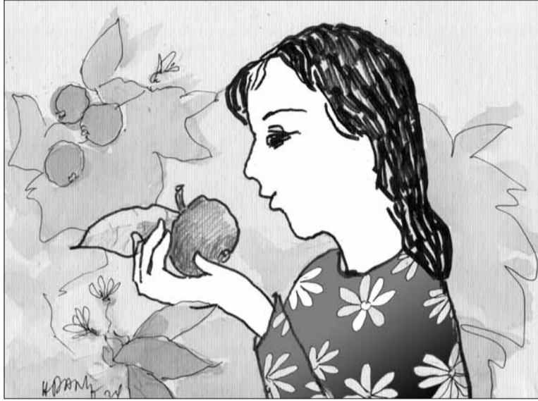
Minh họa: HOÀNG ĐẶNG

Chẳng có gì mong manh hơn một làn hương. Có lẽ vì khó nắm bắt như thế nên con người ta cứ nhớ nhung hoài không thôi. Sống giữa phố phường mà mỗi lúc nhớ quê tôi cũng cố tìm kiếm những mùi hương cố quán. Những lúc có bà con từ quê lên phố, tôi lại dấn dè mang đủ thứ từ mảnh vườn của má ở quê. Nào là mấy trái ớt xiêm cay xè, ít củ nén, lon bột nghệ... Để chiều mưa giữa phố, mình bật bếp nấu cơm chiều. Những mùi hương có thể cho mình cảm giác được quay về, được an ủi