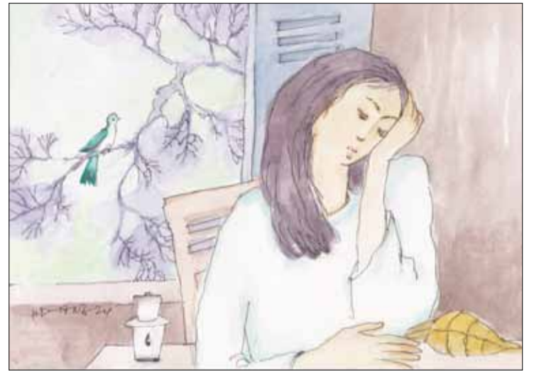
Minh họa: HOÀNG ĐẶNG

Tôi may mắn được đặt chân đến cả 5 châu, đến khắp 63 tỉnh, thành phố của đất nước mình. Dẫu là những chuyến du lịch hay công tác, thời gian ngắn hay dài, cưỡi ngựa xem hoa hay đến từng hộ gia đình, gặp gỡ, trao đổi với từng nhân vật, thì những gì đọng lại trong trí nhớ, rất rõ, vẫn là những câu chuyện buồn cảm, những số phận đáng thương, đặc biệt trong những thiên tai, bão lũ, trong vật lộn với chật vật, tù túng, khốn khó cuộc sống đời thường. Ngay cả những nhân vật thực sự nổi bật, là tấm gương sáng đi nữa, những chuyện không vui cũng hiển hiện môn một. Ví như một gương