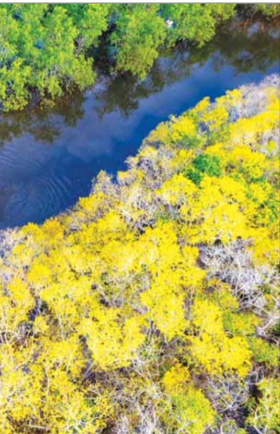
vàng tươi đầy thơ mộng.