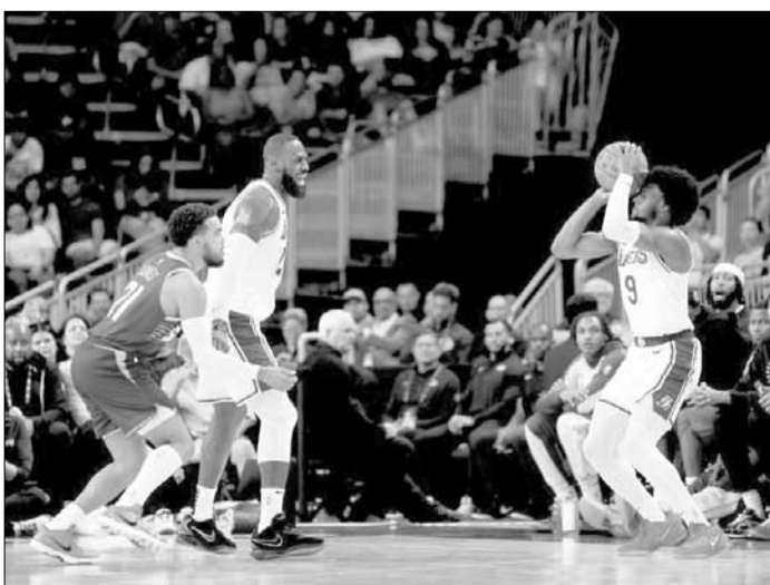
LeBron James (áo sáng, bên trái) cùng con trai Bronny James (số 9) trong một pha bóng trước Phoenix Suns.