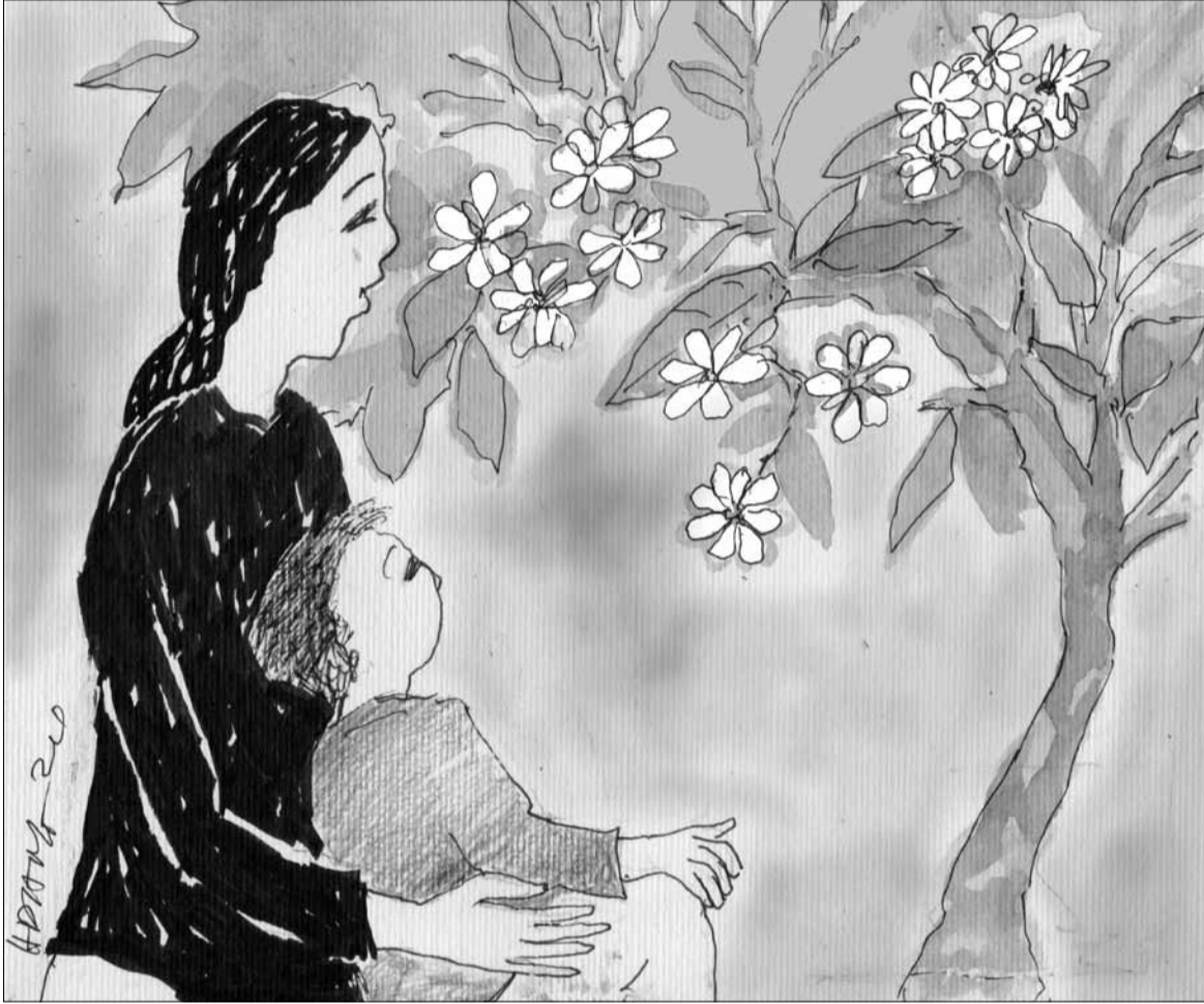
Minh họa: HOÀNG ĐĂNG

Khúc queo cua gắt, lái cẩn thận mà vẫn bị. Mũ bảo hiểm cài quai