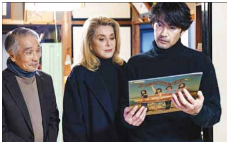
Phim điện ảnh "Spirit World" sẽ được chiếu bế mạc tại Liên hoan phim quốc tế Busan lần thứ 29.

Tuy nhiên, một trong những sự kiện được giới điện ảnh mong đợi nhất là