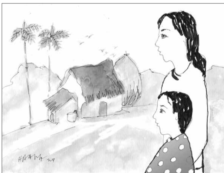
Minh họa: HOÀNG ĐẶNG

Có lần, nằm bên nhau hai vợ chồng tôi tính chuyện ngày sau. Anh nói sau này về già, khi các con đã yên bề gia thất, hai vợ chồng sẽ bán căn nhà đang ở để về quê. Mặc dù biết chồng tôi là con trai duy nhất trong nhà nên có trách nhiệm thờ cúng ông bà tổ tiên. Thế nhưng hai chữ “về quê” của chồng đối với tôi vẫn có gì xa lạ. Đơn giản vì tôi lấy chồng nhưng không ở quê chồng mà chọn một vùng đất khác để lập nghiệp, mưu sinh. Một năm vài ba lần theo chồng về quê giỗ Tết rồi lại vội vã đi, chẳng đủ để gắn kết bền chặt, thân quen. Cuối đời ai cũng muốn lá rụng về cội nên tôi hiểu mong muốn của chồng. Nhưng dù là chuyện của tương lai thì ý định bán căn nhà vẫn làm tôi lẩn tránh. Tôi nói với chồng: “Các con gọi quê hương của chúng ta với cái tên: Quê mẹ, quê cha hoặc quê nội và quê ngoại. Chứ đối với các con thì chính nơi này, ngôi nhà này mới là quê hương của chúng. Bởi chúng được sinh ra