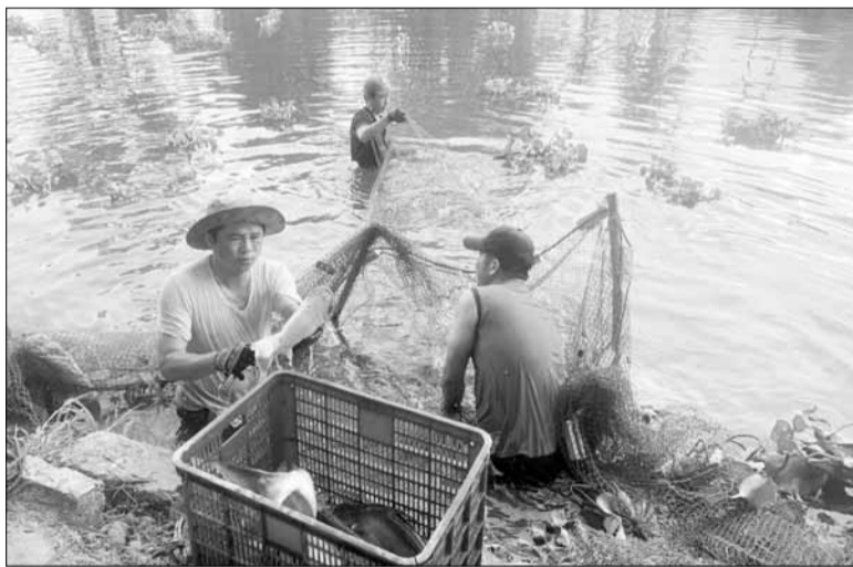
Các hộ thành viên HTX Làng Phú Sơn tranh thủ thu hoạch các loại cá trước khi mùa mưa đến.

Năm nào cũng vậy, khi mùa mưa lũ cận kề, người dân các thôn vùng ngoại thành huyện Hòa Vang lại gấp rút gom từng bó rau, lùa từng con cá nhằm tránh nguy cơ thiệt hại. Họ nói rằng, qua từng năm, mùa vụ trồng rau, nuôi cá có sự chủ động, cân đo đong đếm từ khi xuống giống nhưng không tránh khỏi những tháng mưa lụt bởi đây là thời điểm nằm giữa mùa vụ để bó rau, con cá sinh sôi phát triển.