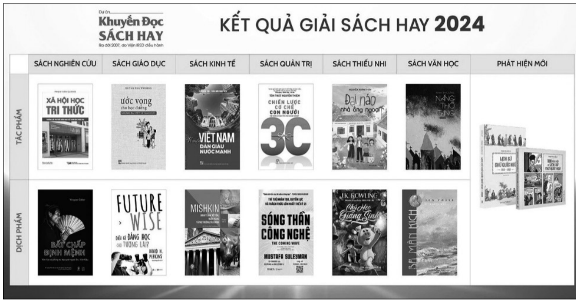
Kết quả giải Sách hay 2024.

Nhìn lại hành trình 17 năm trôi qua kể từ khi dự án Khuyến đọc sách hay ra đời (2007), đại diện cho các thành viên trong dự án, ông Giản Tư Trung tự hào vì những gì