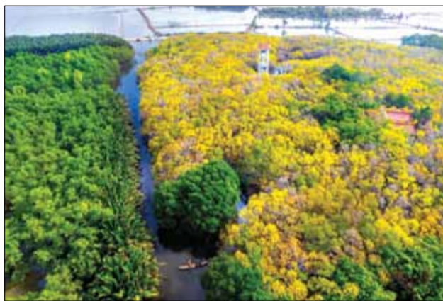
Những chùm hoa chá vàng khoe sắc giữa trung tâm rừng ngập mặn Rú Chá, soi bóng dưới dòng nước.