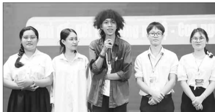
Cuộc thi tranh biện dành cho sinh viên giúp người trẻ chia sẻ quan điểm, trau dồi kiến thức và rèn luyện những kỹ năng mềm.

Kết quả chung cuộc, quán quân cuộc thi là đội ST - liên quân Trường Đại học Sư phạm và Viện Anh ngữ và Đào tạo Việt - Anh. Là đội nhỏ tuổi nhất trong