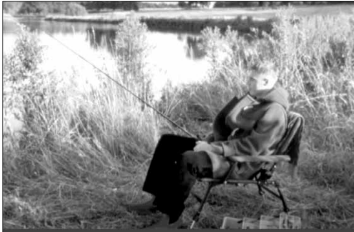
Cole Palmer trong chiến dịch quảng cáo mới của thương hiệu Burberry.

Gọi người trẻ ngồi bên hồ kia là ngôi sao lúc này thì chẳng hề ngoa bởi chàng vừa được bầu chọn “Cầu thủ xuất sắc nhất mùa 2023-2024” của bóng đá Anh - danh hiệu mà David Beckham, Wayne Rooney, Harry Kane từng đạt được. Cole Palmer đã vượt qua Jude Bellingham (đang khoác áo Real Madrid) và Bukayo Saka (Arsenal) bằng