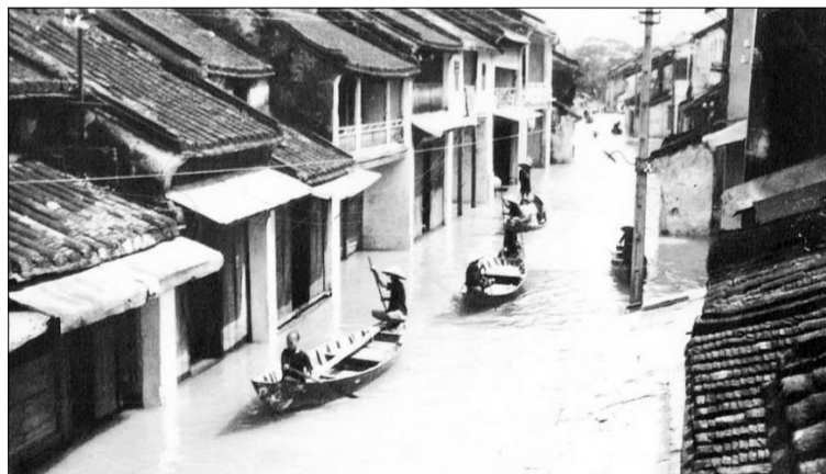
Trận đại hồng thủy năm Thìn 1964 ở miền Trung.

Hai cha con hi hụi bê những viên đá ong để kê bàn ghế lên. Chính những viên đá này đã gây nên những vết