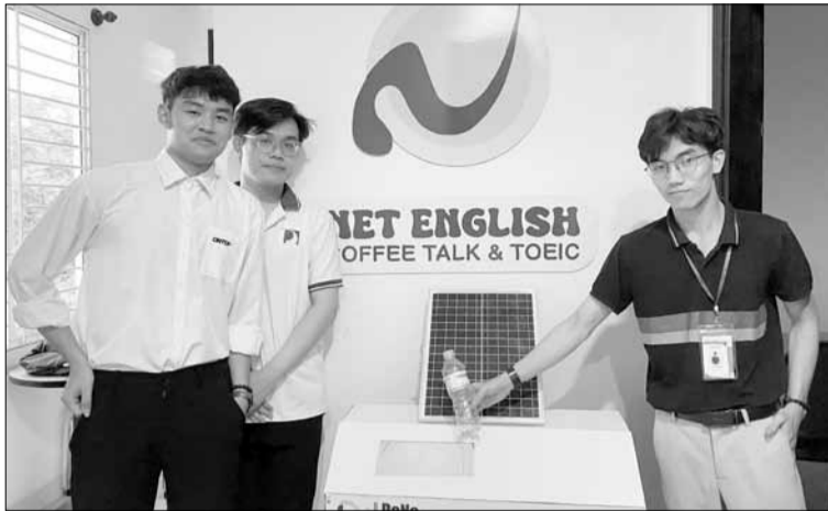
Thùng rác thông minh DANAGreen được một Trung tâm tiếng Anh sử dụng.

Trước thực trạng phân loại rác thải trong cộng đồng còn nhiều bất cập, thùng rác thông minh DANAGreen của nhóm sinh viên Trường Đại học Kinh tế (DUE) và Trường Đại học Bách khoa (DUT) thuộc Đại học Đà Nẵng, trở thành giải pháp được thị trường đón nhận.