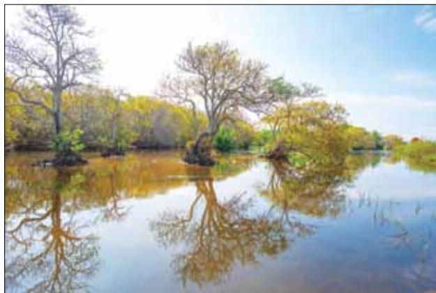
Ánh nắng ban mai hòa quyện với sắc vàng của rừng tạo nên vẻ đẹp yên bình.