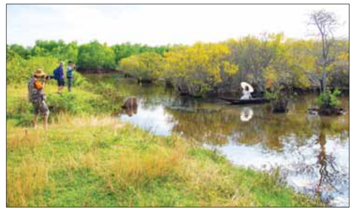
Rú Chá cách trung tâm thành phố Huế 7km, đường đi thuận tiện nên thu hút rất nhiều người dân và du khách.