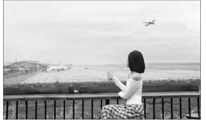
Khách ngắm những chuyến bay từ Nóc Rooftop.