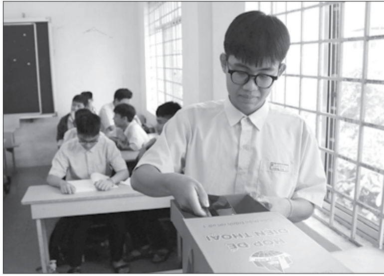
Học sinh Trường THPT chuyên Lê Quý Đôn nộp điện thoại vào đầu giờ học tại vị trí quy định của lớp.