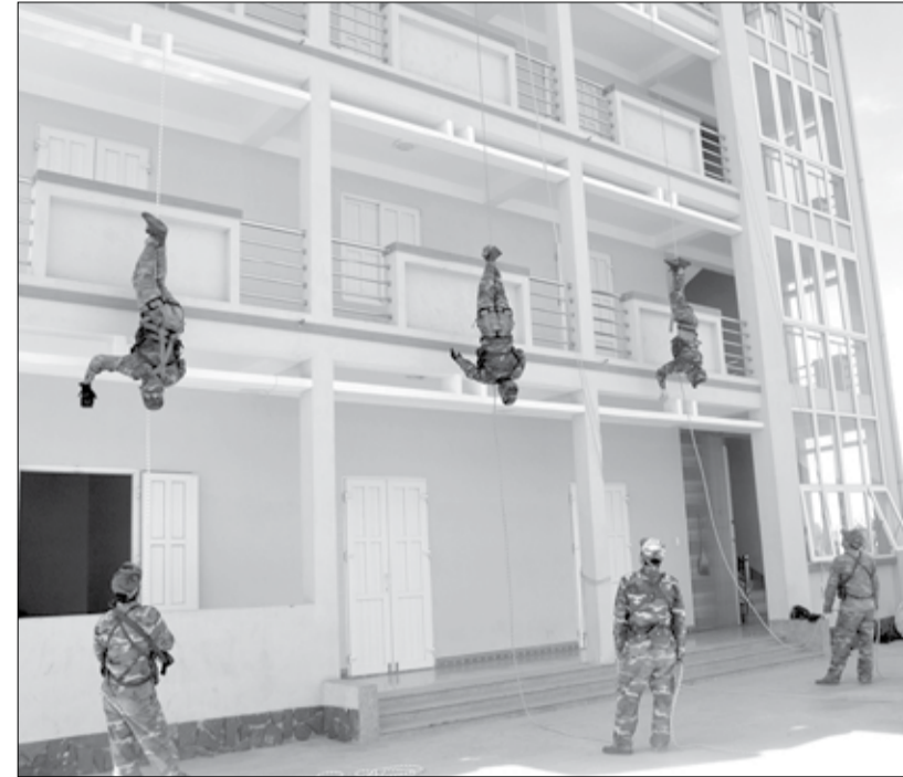
Chiến sĩ trinh sát thực hiện động tác tụt dây từ tầng 5 xuống đất.

Đặc thù lính trinh sát không những giỏi võ thuật, sử dụng thành thạo các loại vũ khí, trang thiết bị kỹ thuật mà còn đòi hỏi sự linh hoạt, nhanh nhạy, sức khỏe dẻo dai và thích ứng nhanh trước mọi tình huống. Bên cạnh các nội dung kỹ thuật và chiến thuật, lực lượng trinh sát đặc nhiệm còn tham gia huấn luyện các nội dung cơ bản như bắn súng Tiểu liên AK bài 1, bơi ếch, kỹ thuật đánh bắt