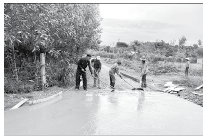
Chi hội cự chiến binh thôn Diêu Phong (xã Hòa Nhơn, huyện Hòa Vang) phối hợp thi công tuyến đườì giao thông kết, hèm trên địa bàn thôn.