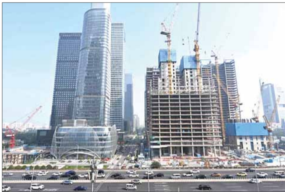
Nhiều nước có xu hướng chi tiêu ngày càng nhiều hơn. TRONG ANH: Công trường xây dựng ở Bắc Kinh (Trung Quốc) vào ngày 12-10.

IMF dự báo, nợ công được dự báo sẽ tiếp tục xu hướng tăng ở một số nền kinh tế lớn. Đáng chú ý, Mỹ có thâm hụt ngân sách có khả năng vượt quá 6% GDP trong năm nay. Theo Forbes, nợ công của Mỹ đã tăng vọt trong những năm gần đây khi vượt ngưỡng 34.000 tỷ USD đầu