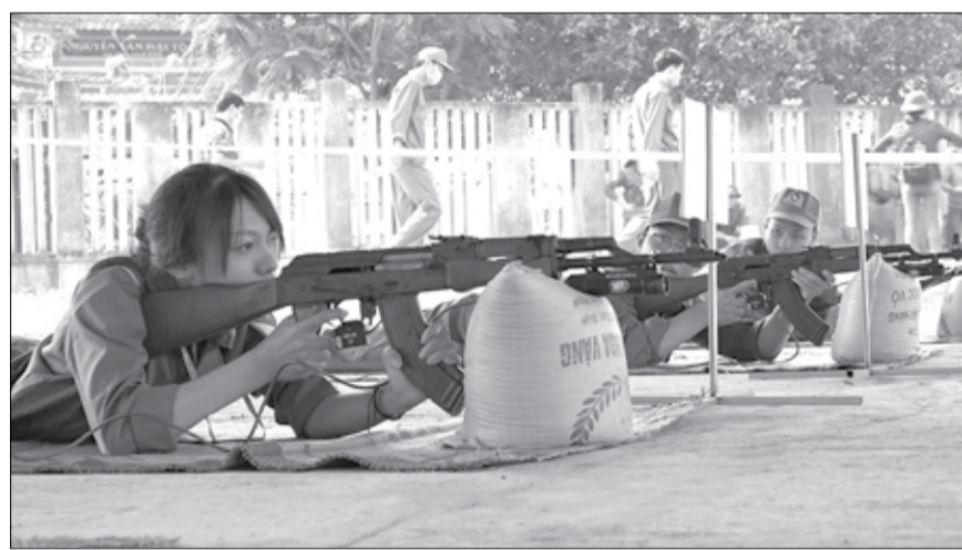
Học sinh THPT thi môn ngắm bắn súng AK trong hội thao Giáo dục quốc phòng - an ninh cho các trường THPT trên địa bàn thành phố tổ chức hằng năm.

Nhiệm vụ giáo dục quốc phòng - an ninh cho học sinh THPT rất quan trọng, nhằm tăng cường giáo dục toàn diện cho thế hệ trẻ về kiến thức, trình độ, năng lực và tinh thần sẵn sàng tham gia bảo vệ Tổ quốc, góp phần thực hiện chiến lược đào tạo con người mới của Đảng và Nhà nước.