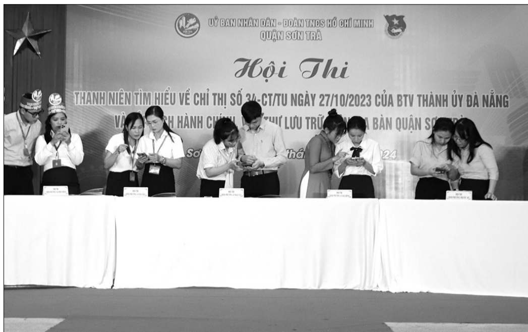
UBND quận Sơn Trà tổ chức hội thi Thanh niên tìm hiểu về cải cách hành chính; văn thư, lưu trữ và Chỉ thị số 34-CT/TU ngày 27-10-2023 của Ban Thường vụ Thành ủy.