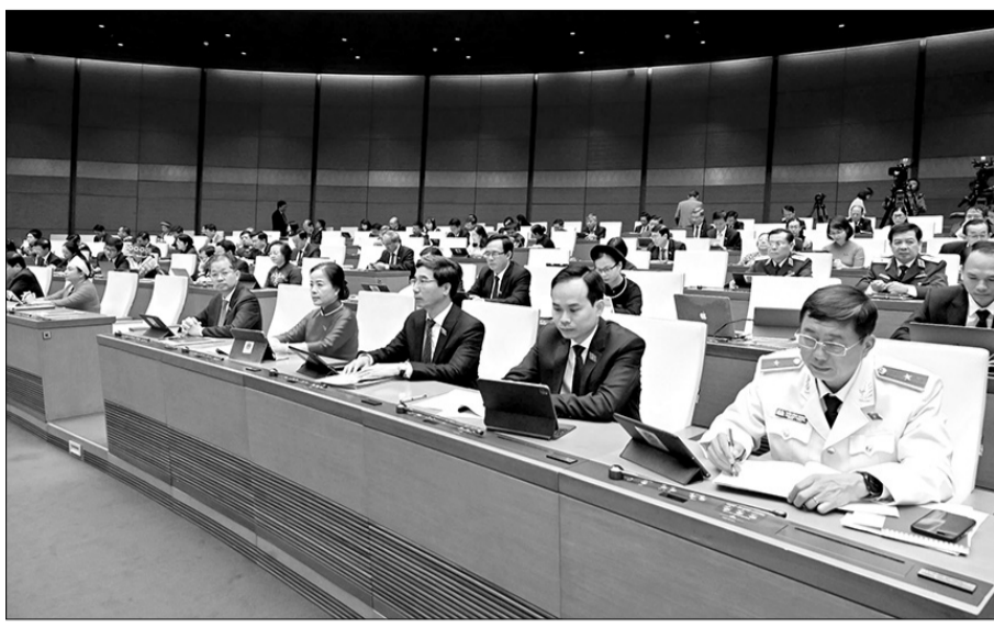
Đoàn đại biểu Quốc hội thành phố Đà Nẵng dự phiên khai mạc kỳ họp thứ 8.

Đẩy mạnh phân cấp, phân quyền với phương châm "địa phương quyết, địa phương làm, địa phương chịu trách nhiệm"; cải cách triệt để thủ