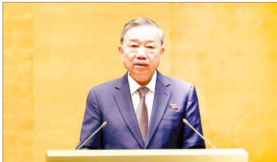
Tổng Bí thư, Chủ tịch nước Tô Lâm phát biểu tại phiên khai mạc.

Phát biểu tại phiên khai mạc, Tổng Bí thư, Chủ tịch nước Tô Lâm nhấn mạnh, đây là kỳ họp đầu tiên có trách nhiệm thể chế hóa Nghị quyết hội nghị Trung ương lần thứ 10 khóa XIII, khẩn trương đưa chủ trương của Đảng vào thực tiễn cuộc sống, giải quyết nhiều vấn đề quan trọng khác của đất nước, tạo tiền đề, chuẩn bị ngay về mọi mặt đưa đất nước bước vào kỷ nguyên mới - kỷ nguyên vươn mình của dân tộc. Tổng Bí thư, Chủ tịch nước