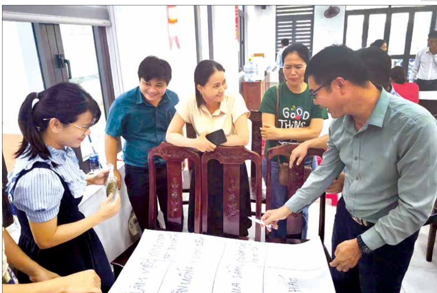
Quận Liên Chiểu tập huấn nâng cao kỹ năng quản lý, nghiệp vụ cho cán bộ công chức, viên chức.