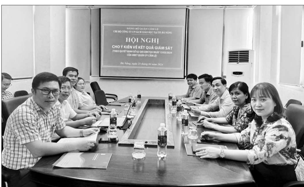
Trong nhiệm kỳ 2020-2025, Ủy ban kiểm tra Quận ủy Cẩm Lệ chủ động nắm tình hình, phát hiện, quyết định kiểm tra nhiều tổ chức đảng, đảng viên khi có dấu hiệu vi phạm. TRONG ẢNH: Chi bộ Công ty CP sách giáo dục Đà Nẵng thuộc Đảng bộ quận Cẩm Lệ tổ chức hội nghị cho ý kiến về kết quả giám sát.

Từ đầu nhiệm kỳ 2020-2025 đến nay, UBKT Quận ủy chủ động nắm tình hình, phát hiện, quyết định kiểm tra khi có dấu hiệu vi phạm đối với 2 tổ chức đảng và 24 đảng viên. Nội dung kiểm tra tập trung vào những lĩnh vực nhạy cảm, dễ phát sinh sai phạm. Qua kiểm tra, kết luận, tất cả tổ chức đảng và đảng viên đều có khuyết điểm, vi phạm. Trong đó, có 2 tổ chức đảng và 17 đảng viên vi phạm đến mức phải xem xét, xử lý kỷ luật; 7 đảng viên có vi phạm nhưng chưa đến mức phải xem xét thì hành kỷ luật, đã yêu cầu nghiêm túc kiểm điểm rút kinh nghiệm.