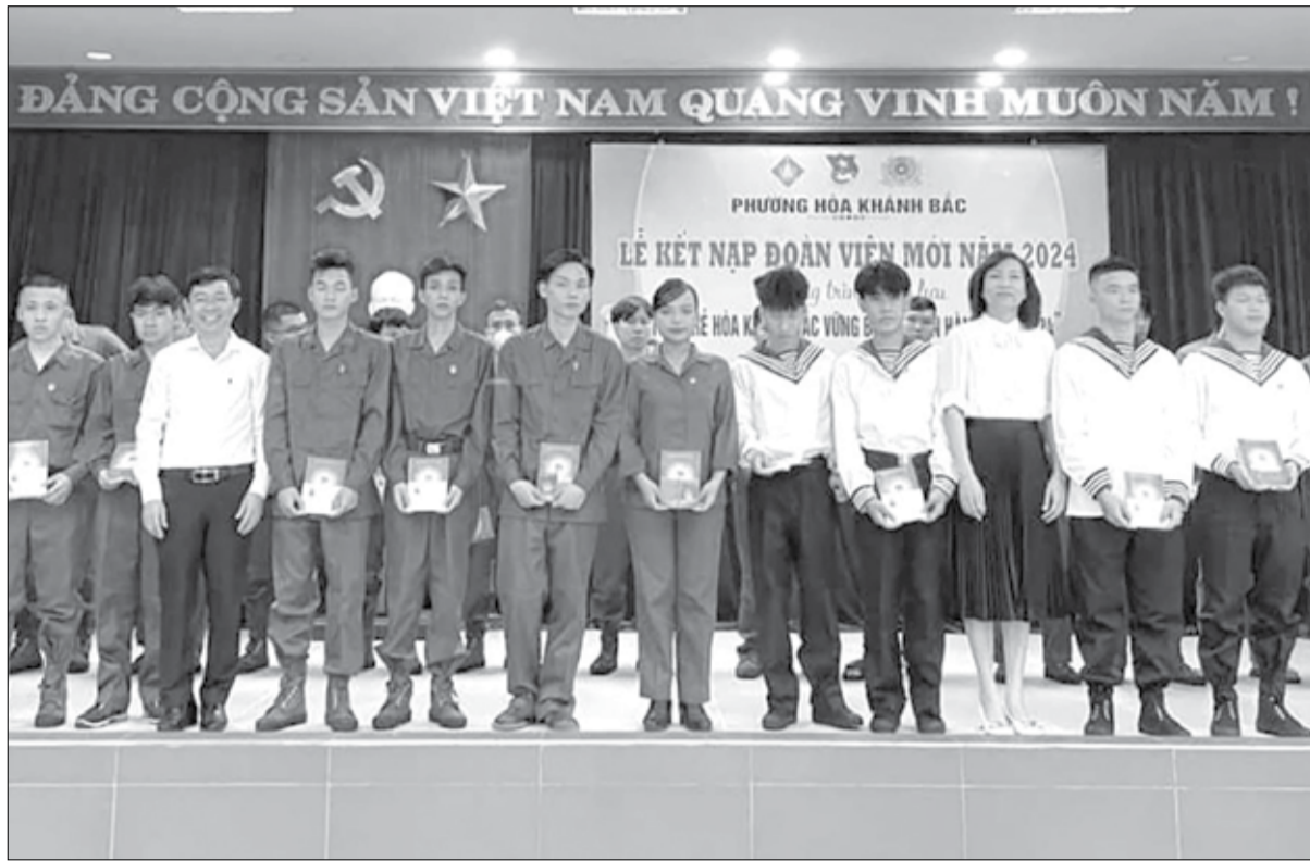
Phường Hòa Khánh Bắc (quận Liên Chiểu) tặng quà, kết nạp Đoàn cho thanh niên trúng tuyển nghĩa vụ quân sự trước ngày lên đường nhập ngũ năm 2024.

Xuất phát từ tình hình trên, cấp ủy đảng, chính quyền và hội đồng nghĩa vụ quân sự các cấp từ thành phố đến cơ sở triển khai nhiều giải pháp phù hợp, thực hiện đúng, đủ các bước xét duyệt, tuyển chọn gọi công dân nhập ngũ hàng năm bảo đảm chất lượng, hiệu quả. Việc triển khai các bước tuyển chọn thực hiện thống nhất, có sự phối hợp chặt chẽ, đồng bộ giữa các cấp, các ngành, bảo đảm công khai, dân chủ, công bằng,