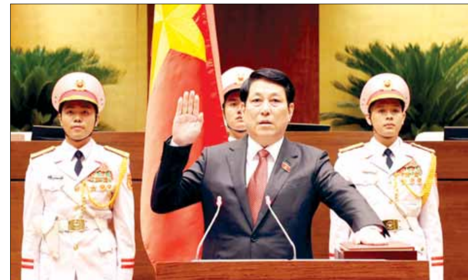
Chủ tịch nước Lương Cường tuyên thệ nhiệm chức trước Quốc hội và đồng bào cử tri cả nước.

Sau lễ tuyên thệ, Chủ tịch nước Lương Cường có bài phát biểu trước Quốc hội. Đồng chí Lương Cường sinh ngày 15-8-1957. Quê quán: Phường Dữu Lâu, thành phố Việt Trì, tỉnh Phú Thọ. Chuyên môn, nghiệp vụ: