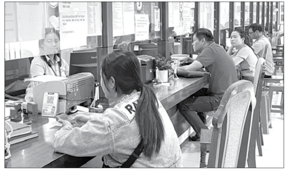
Cán bộ bộ phận "Một cửa" UBND quận Ngũ Hành Sơn tích cực hướng dẫn công dân các thủ tục liên quan.