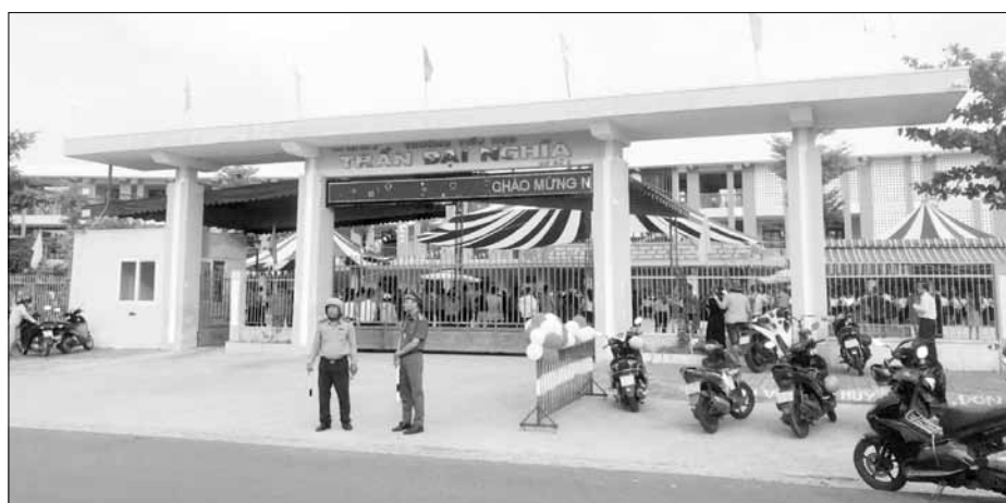
Lực lượng chức năng túc trực hướng dẫn phụ huynh, học sinh dừng đỗ xe đúng quy định tại Trường Tiểu học Trần Đại Nghĩa.

Tiếp tục đẩy mạnh thực hiện Chỉ thị số 31/CT-TTg ngày 21-12-2023 của Thủ tướng Chính phủ về tăng cường công tác bảo đảm trật tự an toàn giao thông (TTATGT) cho lứa tuổi học sinh trong tình hình mới; chỉ đạo của lãnh đạo Bộ Công an; kế hoạch của UBND thành phố và Ban An toàn giao thông (ATGT), vào đầu năm học, Sở Giáo dục và Đào tạo (GD&ĐT) đã chỉ đạo các đơn vị, trường học trên địa bàn thành phố phối hợp và mời Phòng Cảnh sát giao thông, Công an thành phố, Công an quận, huyện tổ chức tuyên truyền, giáo dục pháp luật về TTATGT cho cán bộ, giáo viên và học sinh, sinh viên, sinh viên. Trong đó có nhiều hình thức như tuyên truyền, giáo