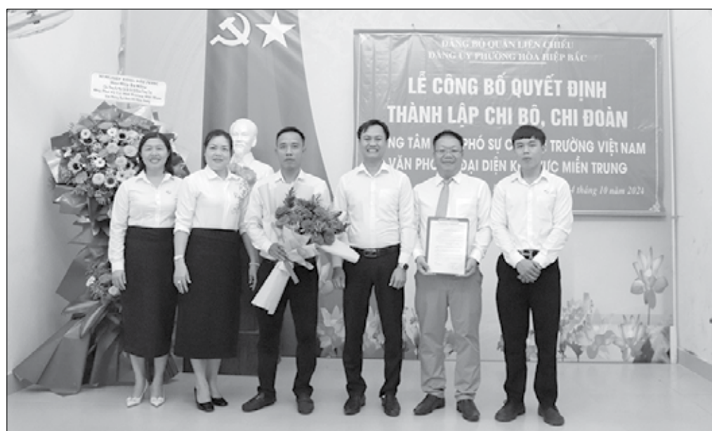
Đảng ủy phường Hòa Hiệp Bắc công bố thành lập Chi bộ Trung tâm Ứng phó sự cố môi trường Việt Nam, văn phòng đại diện khu vực miền Trung.

Từ đầu nhiệm kỳ 2020-2025 đến tháng 7-2024, toàn thành phố doanh nghiệp ngoài khu vực Nhà nước thành lập 24 chi bộ, kết nạp 439 đảng viên mới; thành lập 350 tổ chức Công đoàn và 64 tổ chức Đoàn Thanh niên.