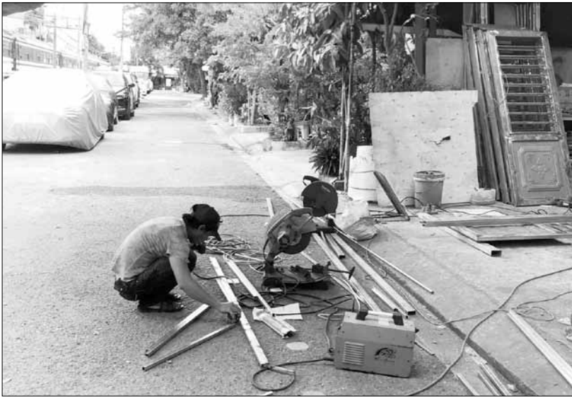
Công ty Phú Cường Thịnh thường xuyên hoạt động lấn chiếm vỉa hè, lòng, lề đường và phun sơn phát tán mùi hôi trong khu dân cư.

Qua "đường dây nóng" Báo Đà Nẵng, ban đọc phản ánh, Công ty Phú Cường Thịnh, trú tại số nhà 75, đường Hà Xuân 1, phường Chính Gián (quận Thanh Khê), trong quá trình hoạt động cơ khí, cắt, hàn và phun sơn làm phát tán mùi hôi ảnh hưởng đến đời sống sinh hoạt, sức khỏe của người dân trong khu vực. Người dân kiến nghị cơ quan chức năng quan tâm xử lý dứt điểm tình trạng này.