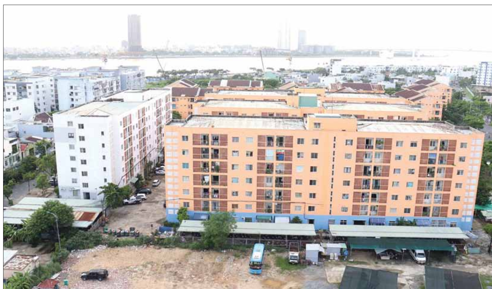
Thành phố đã mở rộng đối tượng, nới điều kiện thuê, mua chung cư nhà ở xã hội. TRONG ẢNH: Các khu chung cư nhà ở xã hội tại quận Sơn Trà.