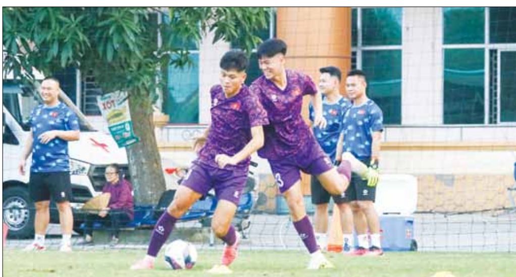
Đội tuyển U17 Việt Nam nỗ lực tập luyện hướng đến trận ra quân với U17 Kyrgyzstan tại vòng loại giải U17 châu Á 2025.