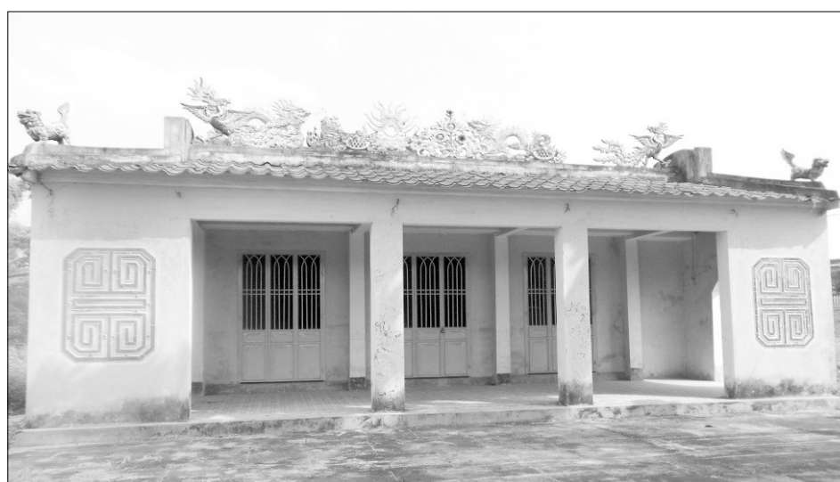
Đình Phú Hòa nhìn từ bên ngoài.

Theo những người cao tuổi của làng, lúc đầu đình chỉ có 3 họ tộc đến khai canh vùng đất này. Do còn quá ít người nên việc thờ cúng dù vốn được coi trọng nhưng điều kiện để thực hiện khá đơn giản. Ngôi đình lúc đầu được dựng vào khoảng cuối thế kỷ XVIII bằng các nguyên liệu sẵn có là tranh, tre, phên nan, nôi hương dùng chỉ là chiếc bát uống nước. Sau đó, đình phải đi dời 3 lần nữa. Lần đầu đi dời vào vào năm 1782. Đình được làm bằng gỗ và lợp tranh, có 4 cột, xung quanh che bằng phên nan. Tuy nhiên, do nơi đây là vùng đất trũng, dễ bị ngập lụt vào mùa mưa nên đến năm 1788,