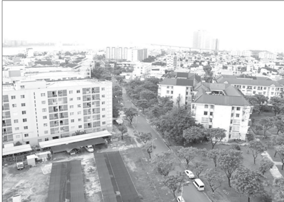
Thành phố đã mở rộng đối tượng, nới điều kiện thuê, mua chung cư nhà ở xã hội. TRONG ẢNH: Một số khu chung cư nhà ở xã hội tại quận Sơn Trà.

UBND thành phố vừa ban hành Quyết định số 47/2024/QĐ-UBND quy định đối tượng, điều kiện được thuê, mua, thuê mua nhà ở xã hội (không áp dụng đối với nhà ở công nhân Khu công nghiệp Hòa Cẩm (giai đoạn 1), các khu ký túc xá sinh viên tập trung thuộc tài sản công trên địa bàn thành phố và Quyết định số 49/2024/QĐ-UBND quy định khung giá dịch vụ quản lý vận hành nhà chung cư trên địa bàn thành phố, cùng có hiệu lực kể từ ngày 25-10-2024.