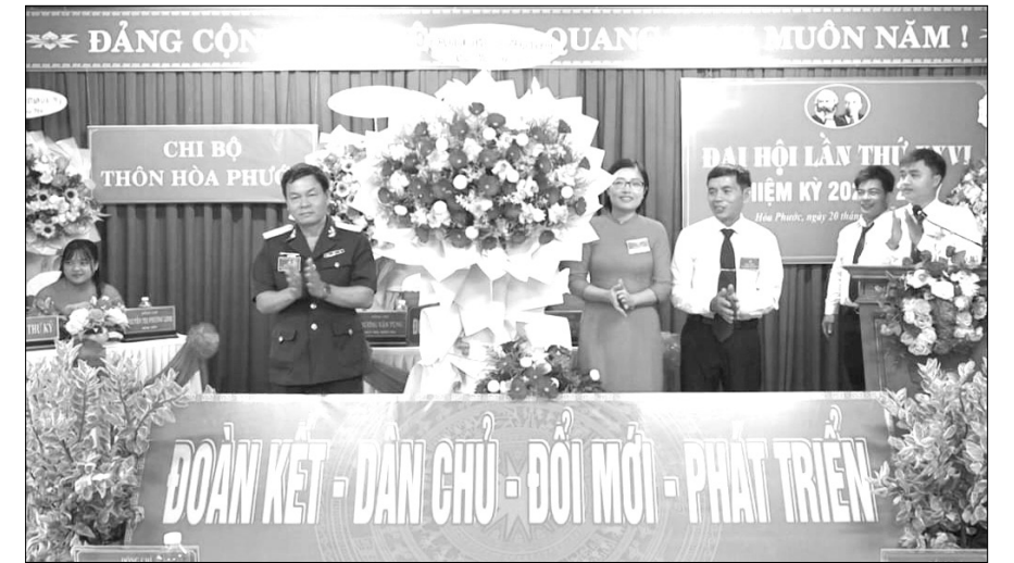
Chi bộ thôn Hòa Phước (xã Hòa Phú) tổ chức đại hội điểm nhiệm kỳ 2025-2027.

Đối với việc nâng cao chất lượng văn kiện đại hội, cán bộ chức trách luận lý lưỡng, sâu sắc các quan điểm, mục tiêu, chủ trương, định hướng của dự thảo văn kiện đại hội đại biểu đảng bộ cấp trên. Công tác nhân sự phải bảo đảm sự lãnh đạo trực tiếp, toàn diện của đảng ủy, ban thường vụ đảng ủy cơ sở và để cao vai trò,