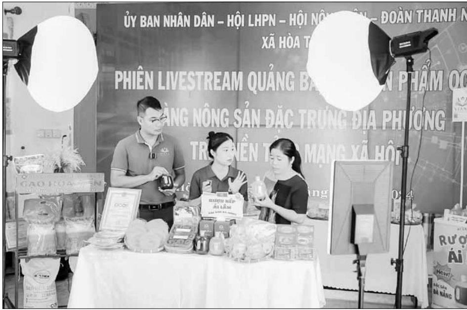
Nông dân xã Hòa Tiến phối hợp các hội, đoàn thể địa phương livestream bán hàng quảng bá nông sản địa phương trên mạng xã hội.