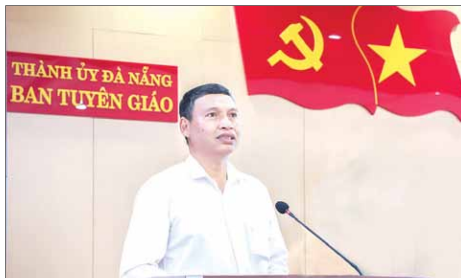
Phó Chủ tịch Thường trực UBND thành phố Hồ Kỳ Minh báo cáo tại hội nghị.

Chiều 22-10, Ban Tuyên giáo Thành ủy tổ chức hội nghị báo cáo viên Thành ủy quý 3-2024.