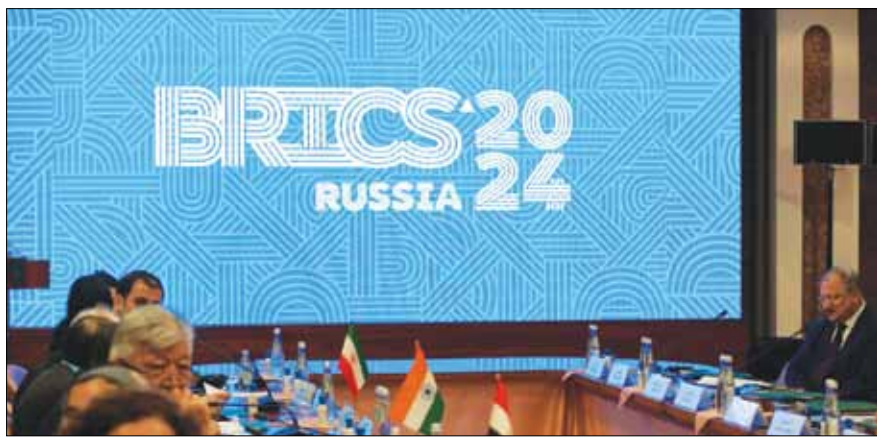
Hội nghị thượng đỉnh BRICS đang diễn ra tại thành phố Kazan (Nga).

Hội nghị thượng đỉnh BRICS diễn ra tại thành phố Kazan (Nga) từ ngày 22 đến 24-10 với chủ đề "Tăng cường chủ nghĩa đa phương vì sự phát triển và an ninh toàn cầu một cách công bằng".