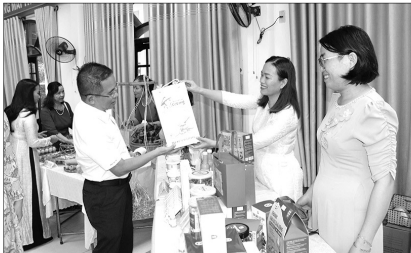
Những mô hình, hoạt động của phụ nữ quận Sơn Trà ngày càng khẳng định vị trí, vai trò lớn trong việc đóng góp vào sự thành công chung của địa phương.