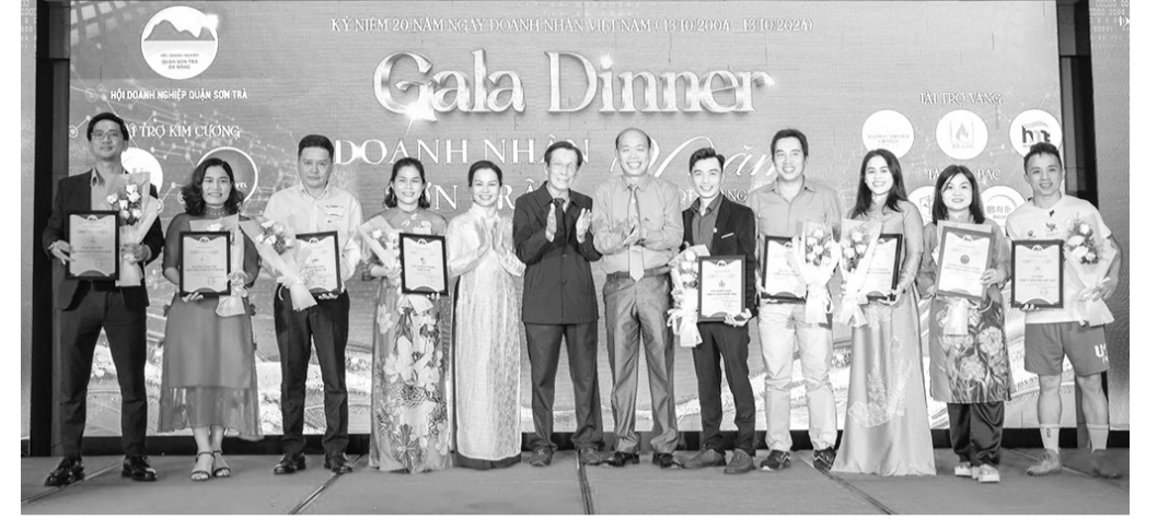
Hội Doanh nghiệp quận Sơn Trà tổ chức kỷ niệm 20 năm ngày Doanh nhân Việt Nam vào giữa tháng 10-2024.

Cộng đồng doanh nghiệp, doanh nhân trên địa bàn quận Sơn Trà có những đóng góp không nhỏ cho phát triển kinh tế - xã hội của địa phương. Để hỗ trợ doanh nghiệp, chính quyền quận tiếp tục triển khai những giải pháp phù hợp, tạo môi trường kinh doanh thuận lợi.