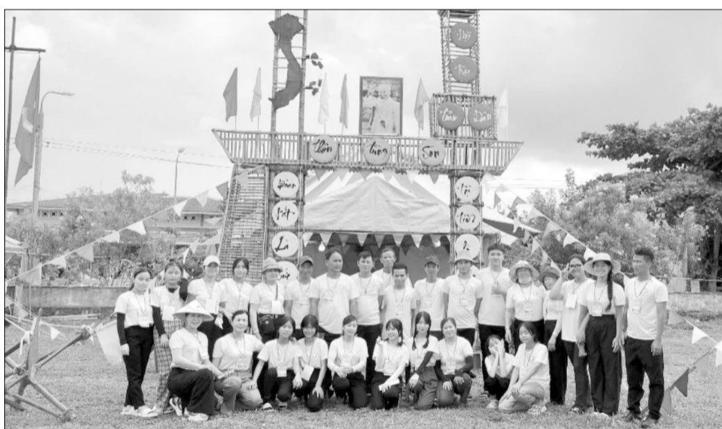
Thôn Tùng Sơn (xã Hòa Sơn, huyện Hòa Vang) tham gia phong trào sôi nổi do địa phương tổ chức.

Theo quyết định của Chủ tịch UBND thành phố, tổ dân phố số 7 (phường Hòa Khánh Bắc, quận Liên Chiểu) được khen thưởng vì thành