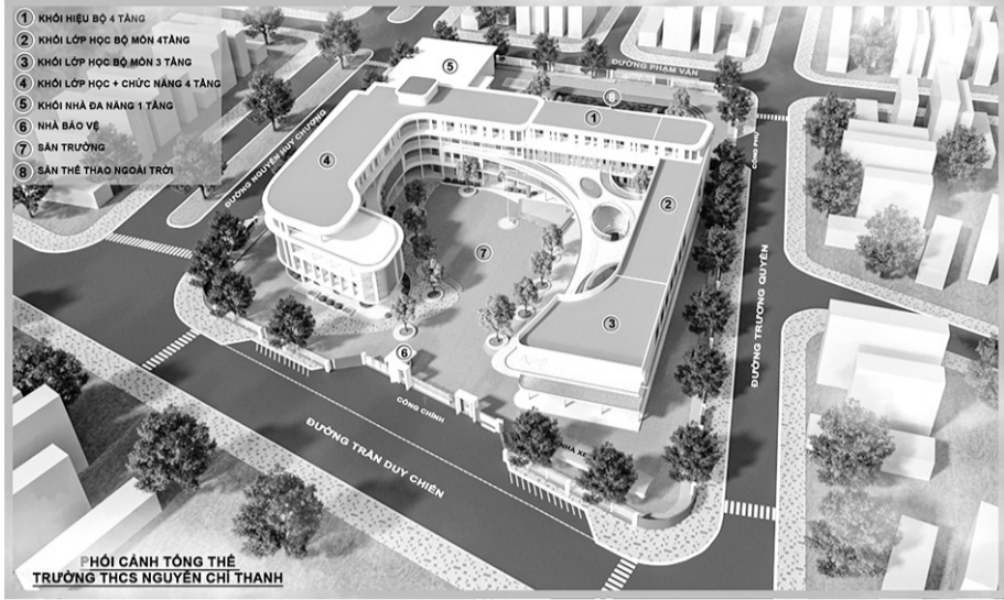
Phối cảnh Trường THCS Nguyễn Chí Thanh đang được quận Sơn Trà triển khai các thủ tục chuẩn bị đầu tư.

Từ cuối năm 2023 đến nay, quận Sơn Trà tập trung triển khai, thực hiện Chỉ thị số 34-CT/TU ngày 27-10-2023 của Ban Thường vụ Thành ủy về tiếp tục đẩy mạnh cải cách hành chính, tăng cường kỷ luật, kỷ cương, khắc phục tình trạng né tránh, đùn đẩy, không làm đúng, đầy đủ chức trách, nhiệm vụ, quyền hạn của một bộ phận cán bộ, đảng viên, công chức, viên chức trong tình hình hiện nay, trong đó có thực hiện các thủ tục hành chính đối với các dự án đầu tư công thuộc thẩm quyền của quận.