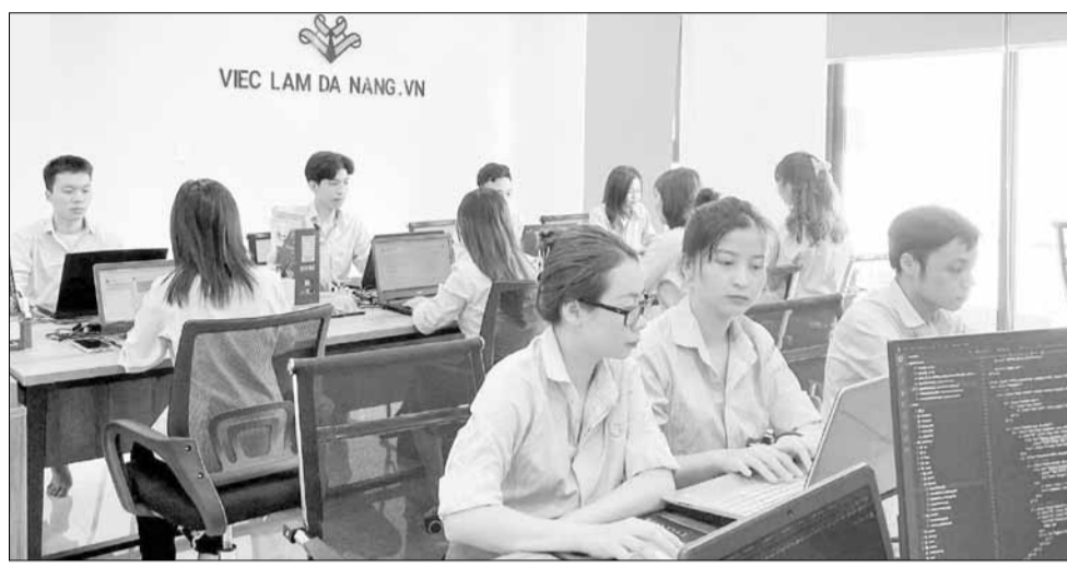
Nhân viên công nghệ thông tin làm việc tại Công ty CP Jobkey.

Tháng 10-2020, Công viên phần mềm Đà Nẵng số 2 được khởi công cơ bản hoàn chỉnh phần xây dựng hạ tầng vào năm 2022. Công trình gồm khối tòa nhà Văn phòng ICT 20 tầng; 2 khối Văn phòng kết hợp trụ sở 8 tầng gồm ICT1 và ICT2 cùng hệ thống sân bãi, đường giao thông nội bộ, cảnh quan cây xanh, hệ thống thoát nước, điện chiếu sáng... với tổng mức đầu tư hơn 900 tỷ đồng. Tuy nhiên, công trình chưa đi vào hoạt động do Công viên phần mềm Đà Nẵng số 2 là tài sản công do Nhà nước quản lý, trong khi đó Chính phủ chưa ban hành quy định về tài sản là kết cấu hạ tầng công thuộc lĩnh vực công nghệ thông tin.