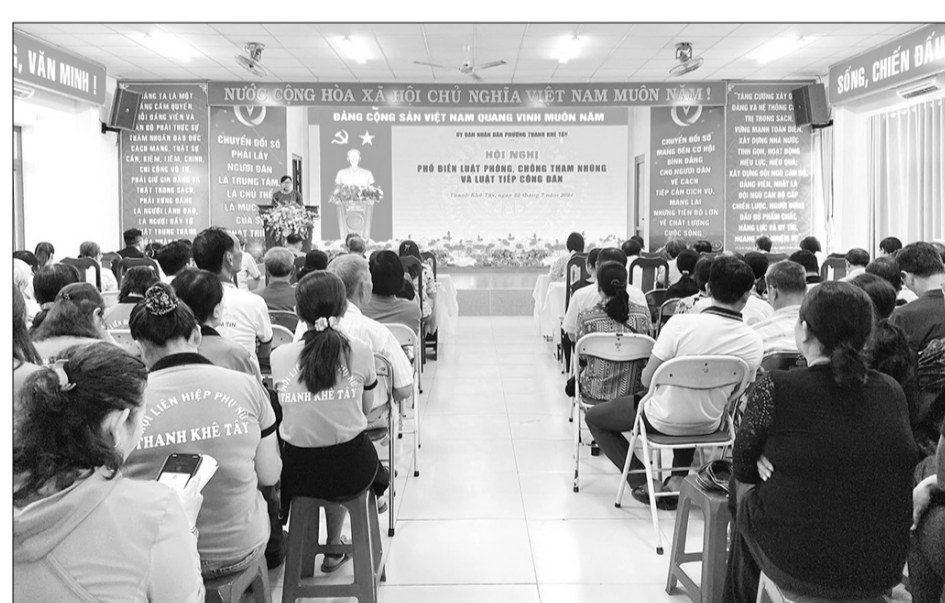
Phường Thanh Khê Tây (quận Thanh Khê) tổ chức hội nghị tuyên truyền phổ biến giáo dục pháp luật.