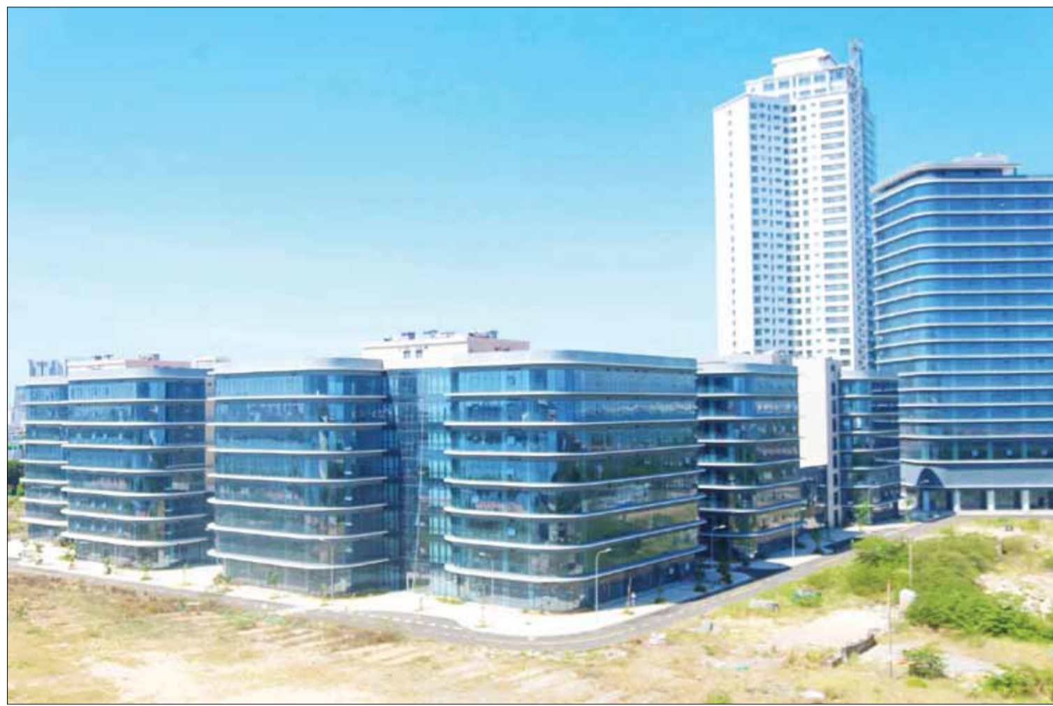
Công viên phần mềm Đà Nẵng số 2 với tổng diện tích đất 28.573 m 2 tại phường Thuận Phước (quận Hải Châu).