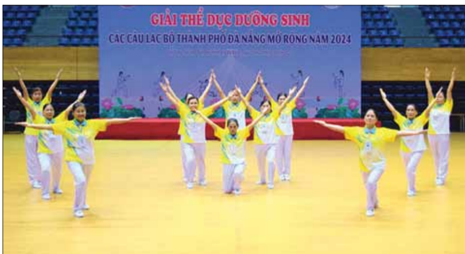
Các vận động viên dự giải thể dục dưỡng sinh các CLB thành phố Đà Nẵng mở rộng năm 2024. Ảnh: P.N

Phong trào thể dục - thể thao trong người trung, cao tuổi lan tỏa rộng trên địa bàn thành phố với nhiều CLB được thành lập, hoạt động sôi nổi, hiệu quả. Để "giữ lửa" phong trào, các đơn vị, địa phương, thành phố thường xuyên tổ chức giải thể thao, tạo điều kiện thi đấu giao lưu, góp phần làm phong phú đời sống tinh thần, nâng cao sức khỏe người trung, cao tuổi.