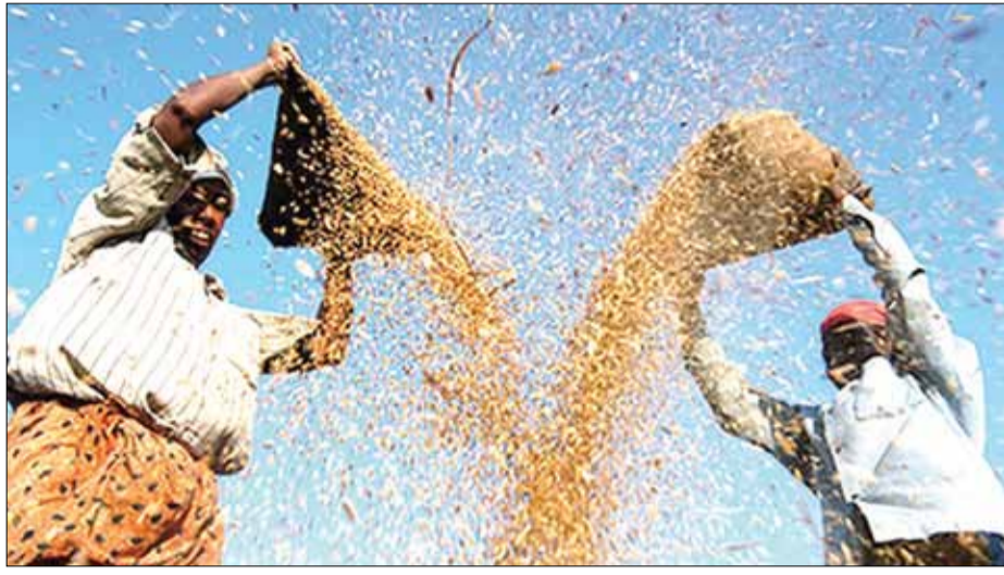
Xử lý gạo sau thu hoạch tại cánh đồng lúa ở Kerala (Ấn Độ).

Quyết định được đưa ra sau khi Ấn Độ cắt giảm thuế xuất khẩu gạo từ 20% xuống 10% vào tháng 9-2024, được kỳ vọng giúp tăng khả năng cạnh tranh của gạo Ấn Độ trên thị trường quốc tế và có thể tác động mạnh tới giá gạo toàn cầu, đặc biệt khi Pakistan cũng vừa dỡ bỏ giá sản xuất gạo tất cả loại gạo.