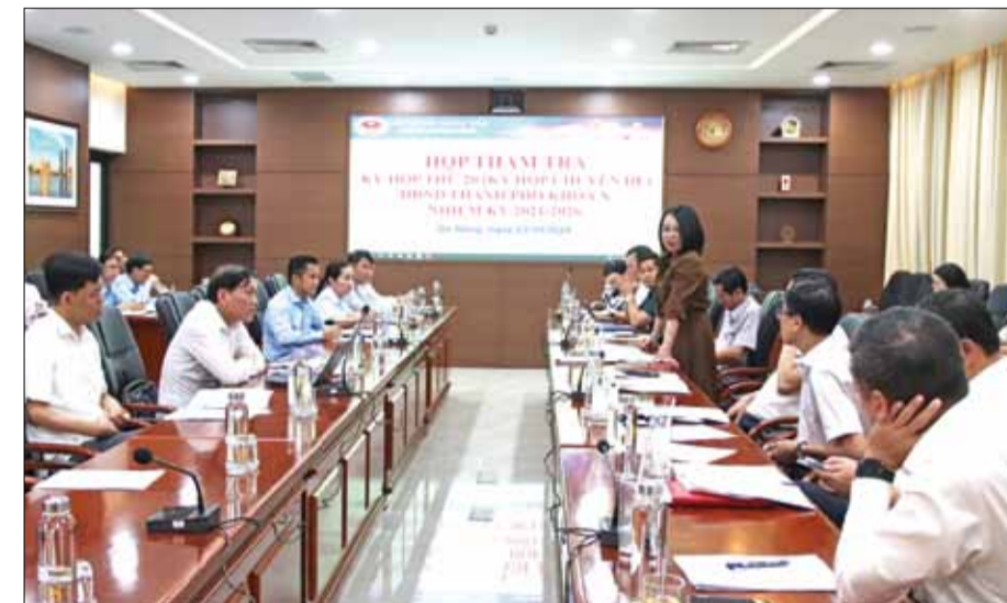
Toàn cảnh phiên họp.

Kinh tế - Ngân sách HĐND thành phố Phan Thị Tuyết Nhung thống nhất một số nội dung về quỹ cho vay liên quan đến phát triển ngành vi mạch, bán dẫn, đồng