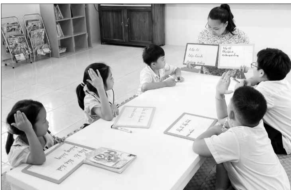
Giáo viên Trường Tiểu học Ngô Gia Tự (quận Sơn Trà) phụ đạo cho học sinh khó khăn để nâng cao kiến thức.