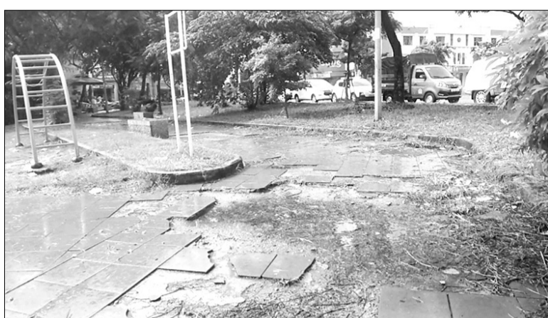
Khu công viên công cộng trên đường Trần Quang Khải, sát cạnh nhà văn hóa phường Thọ Quang (quận Sơn Trà) đang trong tình trạng xuống cấp nghiêm trọng, nhiều vị trí nền gạch bị bong tróc, đọng nước.

Do thiếu sự quan tâm bảo trì, sửa chữa nên tại nhiều công viên vườn dạo, nơi luyện tập thể dục, thể thao công cộng trên địa bàn thành phố, cơ sở vật chất bị xuống cấp, gây mất mỹ quan. Các thiết bị luyện tập thể dục, thể thao bị hư hỏng tiềm ẩn nguy hiểm cho người dân khi tham gia vui chơi, tập luyện.