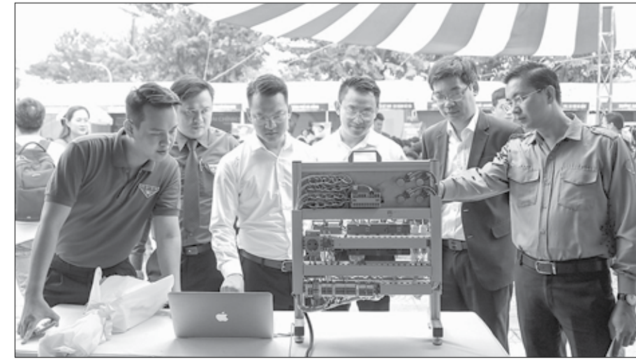
Các đại biểu tham quan gian hàng trưng bày sản phẩm công nghệ trong lĩnh vực chuyển đổi số, vi mạch bán dẫn tại "Festival chuyển đổi số trong thanh - thiếu niên" tháng 10-10-24.

Trong thời đại công nghệ 4.0, chuyển đổi số trở thành yêu cầu tất yếu, tạo động lực phát triển kinh tế - xã hội. Tuổi trẻ thành phố được kỳ vọng là lực lượng đi đầu trong chuyển đổi số, làm chủ công nghệ, đóng góp tích cực trong công cuộc chuyển đổi số quốc gia.