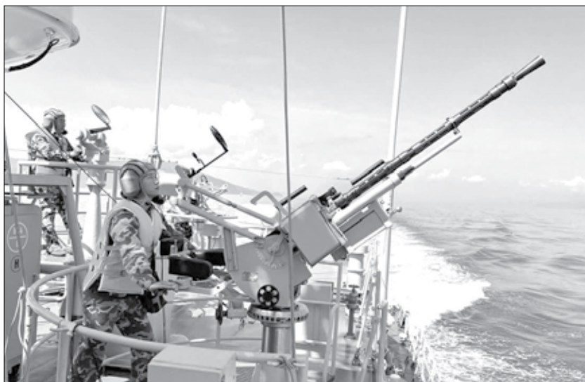
Cán bộ, chiến sĩ Vùng 3 Hải quân tích cực huấn luyện chiến đấu trên biển.

Vùng 3 Hải quân thành lập ngày 26-10-1975, là đơn vị chiến đấu, quản lý, bảo vệ chủ quyền biển, đảo các tỉnh, thành phố duyên hải miền Trung từ đèo Ngang (Quảng Bình) đến đảo Cù Lao Xanh (Bình Định), các đảo ven bờ Bắc Trung Bộ và quần đảo Hoàng Sa; đồng thời sẵn sàng cơ động chi viện bảo vệ quần đảo Trường Sa cũng như các vùng biển trọng điểm và các nhiệm vụ đột xuất khác khi có lệnh; giữ vững môi trường hòa bình, ổn định trên biển và quan hệ hữu nghị với các nước trong khu vực.