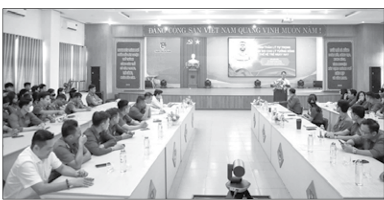
Thành đoàn tổ chức hội nghị chuyên đề "Tinh thần Lý Tự Trọng sáng soi cho lý tưởng sống của thế hệ trẻ ngày nay".

Nhân kỷ niệm 110 năm ngày sinh anh hùng liệt sĩ Lý Tự Trọng (20-10-1914 - 20-10-2024), tuổi trẻ thành phố tổ chức nhiều hoạt động ý nghĩa. Trong đó, chú trọng công tác tuyên truyền thông qua xây dựng các infographic, clip trên mạng xã hội về cuộc đời, tấm gương hy sinh của anh Lý Tự Trọng.