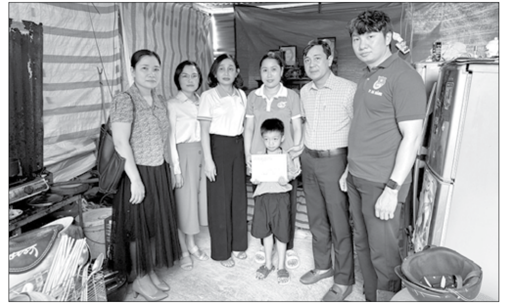
Lãnh đạo, giáo viên, viên chức và người lao động Trường THPT Liên Chiểu trao hỗ trợ cho học sinh trên địa bàn quận.

Dù còn gặp nhiều khó khăn, song được sự quan tâm của các cấp ủy Đảng, tổ chức đoàn thể và toàn thể hội viên, công tác khuyến học, khuyến tài, xây dựng xã hội học tập tại Trường THPT Liên Chiểu có nhiều chuyển biến tích cực và đạt kết quả khả quan. Chi hội khuyến học tham mưu, phối hợp các đơn vị trong và