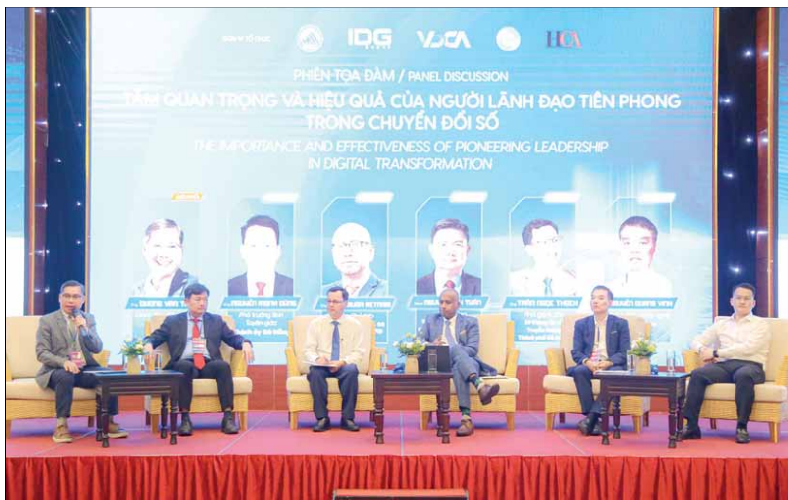
Đại biểu tham dự phiên tọa đàm trong hội thảo quốc gia về Chính phủ số lần thứ 19 - năm 2024 tại Đà Nẵng.