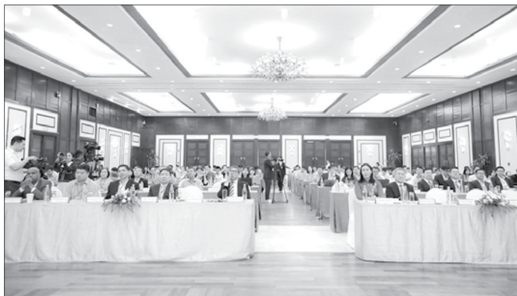
Toàn cảnh hội thảo quốc gia về Chính phủ số lần thứ 19 - năm 2024 tại Đà Nẵng.

Thị Anh Thi cho biết, Đà Nẵng ưu tiên, tập trung phát triển và ứng dụng công nghệ thông tin từ những năm 2000; đưa vào sử dụng nền tảng, hệ thống chính quyền điện tử từ năm 2014. Qua gần 25 năm tập trung phát triển, Đà Nẵng đạt được những kết quả tích cực về nhiều trụ cột số. Tính đến tháng 8-2024, tỷ lệ dịch vụ công trực tuyến toàn trình của thành phố Đà Nẵng cao nhất cả nước với 95% (trung bình các tỉnh, thành là 55%); tỷ lệ hồ sơ xử lý trực tuyến toàn trình là 65% (trung bình các tỉnh, thành là 17%). Kinh tế số phát triển nhanh và đóng góp đáng kể cho GRDP thành phố, cụ thể: năm 2023 kinh tế số đóng góp 20,7% GRDP (vượt mục tiêu năm 2025 là 20%), có 2,3 doanh nghiệp công nghệ số/1.000 dân (cao gấp 3 lần tỷ lệ trung bình cả nước). Ngày 26-6-2024, Quốc hội ban hành Nghị quyết số 136/2024/QH15 về tổ chức chính quyền đô thị và thí điểm một số cơ chế, chính sách đặc thù phát triển thành phố Đà Nẵng; trong đó có các cơ chế, chính sách đột phá nhằm phát triển công nghệ