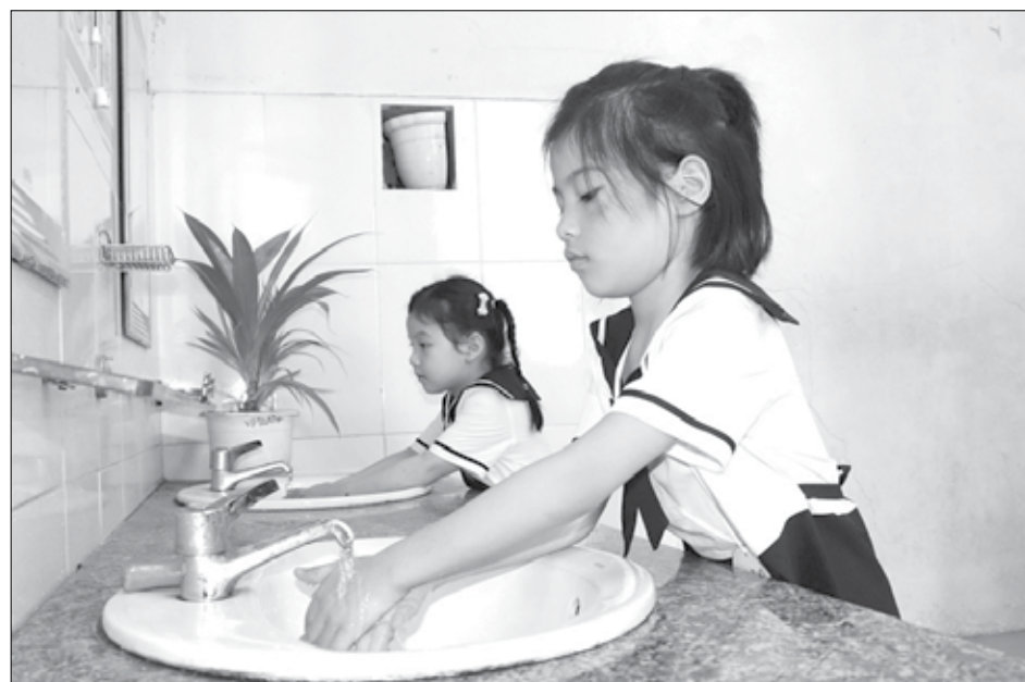
Công tác vệ sinh trường học được các trường chú trọng để bảo đảm môi trường sạch sẽ cho các em. TRONG ẢNH: Học sinh Trường Tiểu học Hoa Lu (quận Thanh Khê) vệ sinh tay trước bữa ăn.

Từ năm học 2023-2024 trở về trước, Trường Tiểu học Hùng Vương (quận Hải Châu) hợp đồng 2 nhân viên làm vệ sinh trường học, mức lương gần 4,7 triệu đồng/người/tháng. Trong đó, nguồn thu