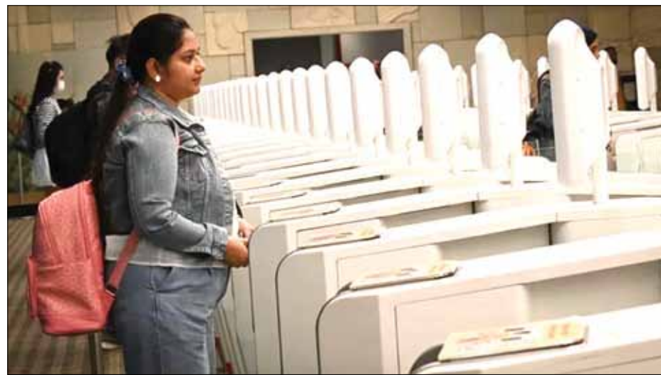
Một hành khách sử dụng thủ tục thông quan không cần hộ chiếu tại sân bay Changi vào ngày 24-10.

Sân bay Changi (Singapore) vừa triển khai toàn diện hệ thống kiểm tra sinh trắc học thay thế hộ chiếu truyền thống, giúp rút ngắn thời gian thông quan từ 25 giây xuống còn 10 giây, đánh dấu bước tiến quan trọng trong việc hiện đại hóa quy trình nhập cảnh tại quốc gia này.