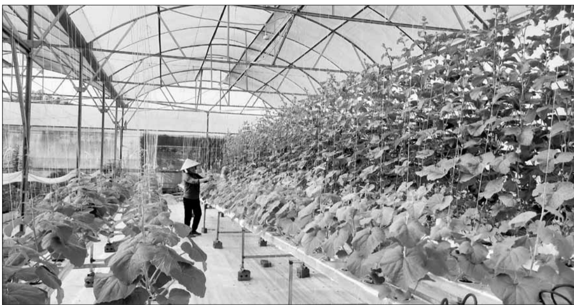
Theo quy hoạch, Đà Nẵng sẽ có 3 vùng sản xuất nông nghiệp ứng dụng công nghệ cao nằm tại huyện Hòa Vang. TRONG ẢNH: Sản xuất tại mô hình nông nghiệp ứng dụng công nghệ cao Ajarum - Farm on smartphone tại xã Hòa Phú, huyện Hòa Vang.

Theo quy hoạch, Đà Nẵng có 3 vùng sản xuất nông nghiệp ứng dụng công nghệ cao nằm tại huyện Hòa Vang, gồm: vùng sản xuất các sản phẩm nông nghiệp an toàn Hòa Khuông - Hòa Phong; vùng nông nghiệp ứng dụng công nghệ cao Hòa Phú; vùng nông nghiệp ứng dụng công nghệ cao Hòa Khuông. Đến nay, kế hoạch sử dụng đất tại 3 vùng quy hoạch này đã được HĐND thành phố thông qua; cả 3 vùng này đã được phê duyệt quy hoạch chi tiết tỷ lệ 1/500. Cụ thể, vùng sản xuất các sản phẩm nông nghiệp an toàn ứng dụng công nghệ cao xã Hòa Phú với diện tích phê duyệt là 20,9ha, tổng diện tích đất quy hoạch là 209.023m 2 . Hiện nay, vùng sản xuất được phê duyệt chủ trương đầu tư với tổng mức