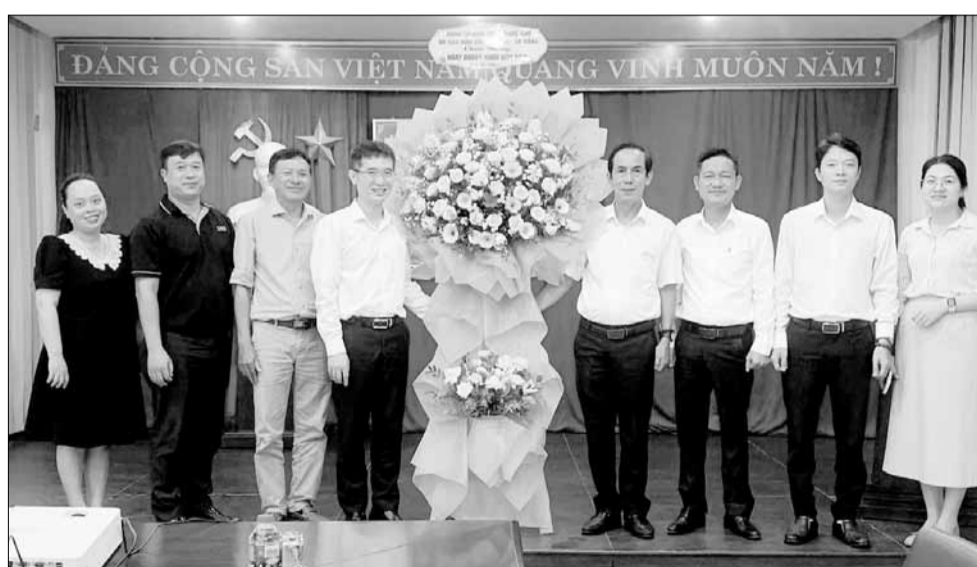
Việc chú trọng đổi mới nội dung, hình thức sinh hoạt đảng trong doanh nghiệp đã phát huy vai trò của đảng viên, góp phần tăng hiệu quả sản xuất, kinh doanh. (TRONG ANH: Lãnh đạo Đảng ủy Khu Công nghệ cao và các khu công nghiệp Đà Nẵng thăm Công ty CP Thép Đà Nẵng nhân kỷ niệm 20 năm ngày Doanh nhân Việt Nam (13-10-2004 - 13-10-2024).)