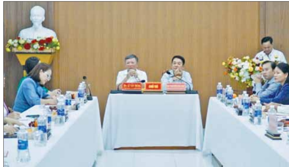
Quang cảnh buổi làm việc.