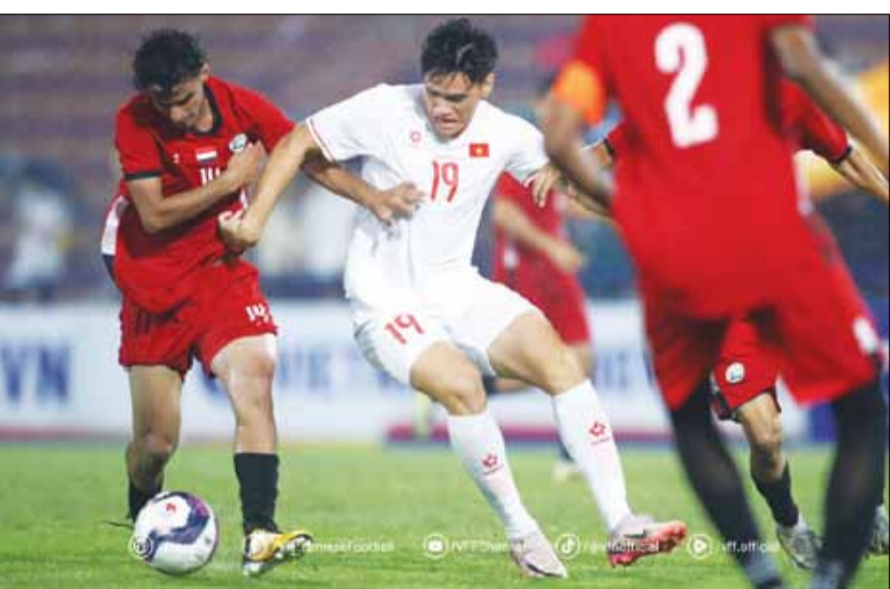
Đội tuyển U17 Việt Nam (áo trắng) có cơ hội cạnh tranh vé dự World Cup U17 sau khi giành vé dự vòng chung kết U17 châu Á năm 2025.

Sau khi đội tuyển U17 nam Việt Nam hoàn thành mục tiêu giành vé dự vòng chung kết U17 châu Á năm 2025, người hâm mộ chờ đợi đội tuyển nữ quốc gia vượt qua chủ nhà Trung Quốc trong cuộc chạm trán diễn ra lúc 18 giờ 35 hôm nay (29-10) để giành chức vô địch giải Chongqing Yongchuan Women's Tournament.