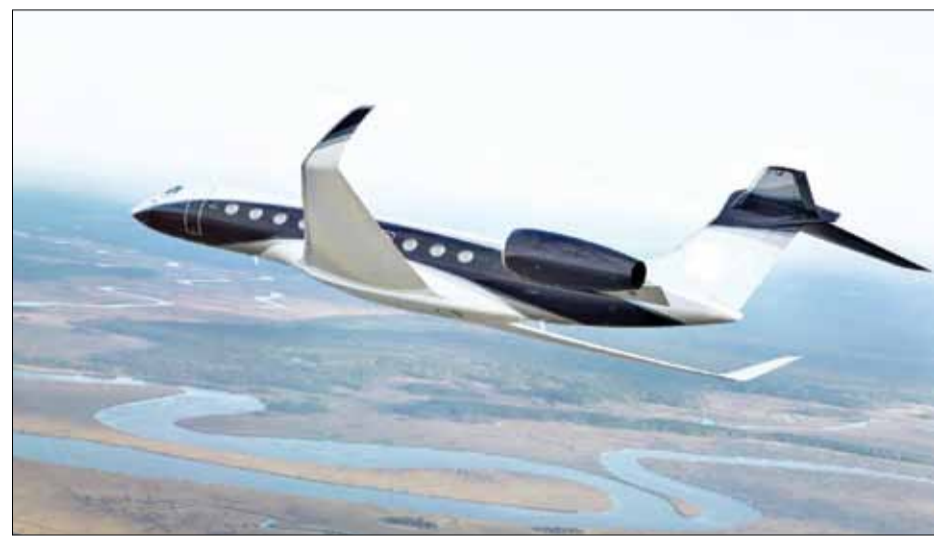
Máy bay cá nhân của các tỷ phú thế giới là tác nhân gây phát thải khí carbon rất lớn.

Nghiên cứu phát hiện, trong vòng chưa đầy 3 giờ đồng hồ, 50 tỷ phú giàu nhất thế giới thải ra lượng khí thải carbon trung bình nhiều hơn so với lượng khí thải carbon trung bình trong cuộc đời của một người bình thường ở Anh. Trung bình, họ thực hiện 184 chuyến bay tổng cộng 425 giờ bằng chuyên