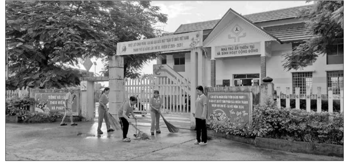
Thu gom chất thải trên địa bàn huyện Hòa Vang.