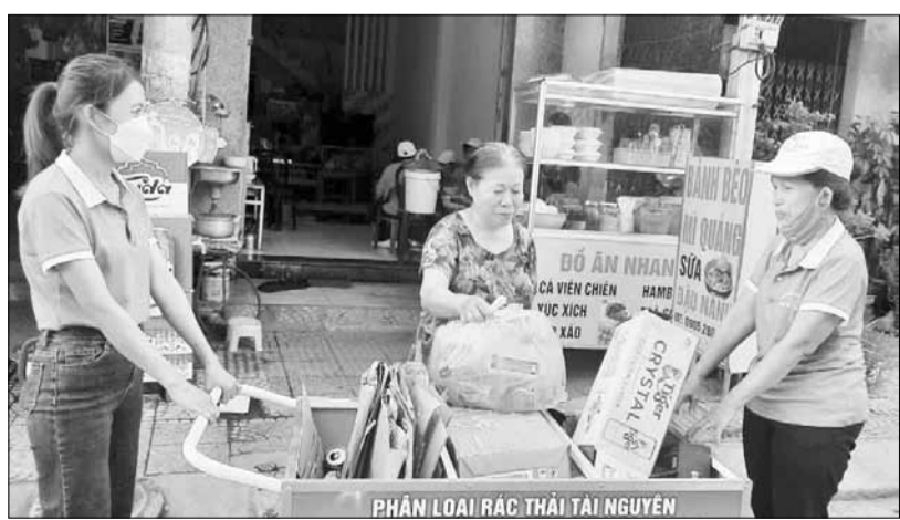
Hội viên phụ nữ phường Hòa Thọ Tây đến từng nhà thu gom rác tái chế.

Hội Liên hiệp Phụ nữ (LHPN) phường Hòa Thọ Tây (quận Cẩm Lệ) triển khai nhiều mô hình, cách làm hay về giữ gìn vệ sinh môi trường mang lại hiệu quả tích cực; nêu cao tinh thần tương thân tương ái, xây dựng lối sống đẹp, văn minh và góp phần thực hiện đề án "Xây dựng Đà Nẵng - Thành phố môi trường" giai đoạn 2021-2030.