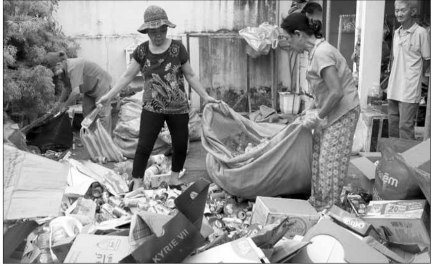
Nhiều khu dân cư, tổ dân phố trên địa bàn thành phố thường xuyên tổ chức thu gom rác tái chế, thúc đẩy phân loại rác tại nguồn.

Từ ngày 1-1-2025, rác sinh hoạt phát sinh từ hộ gia đình, cá nhân được phân loại theo quy định của Luật Bảo vệ môi trường năm 2020.