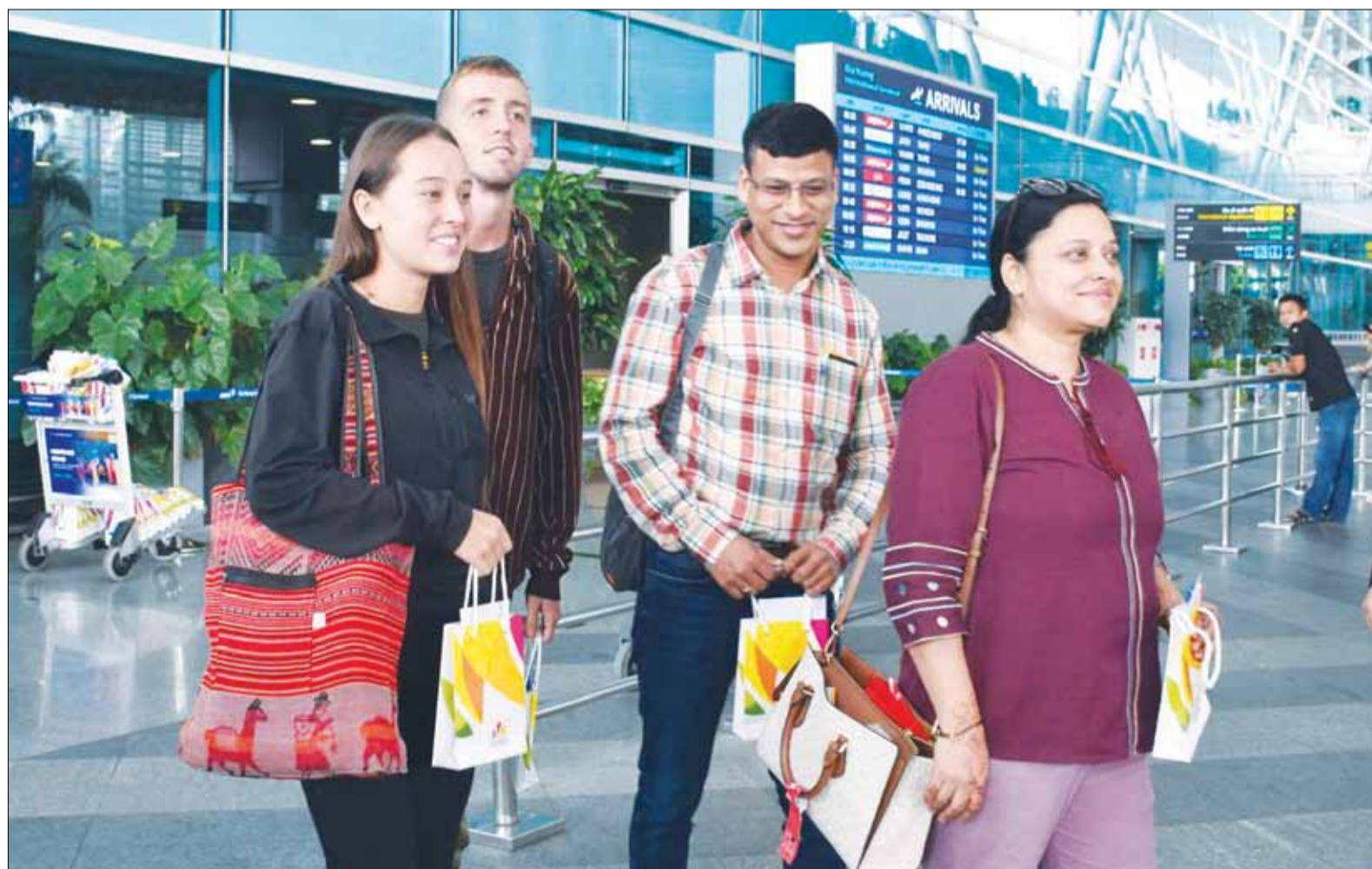
Du khách Ấn Độ đến thành phố tại sân bay quốc tế Đà Nẵng.