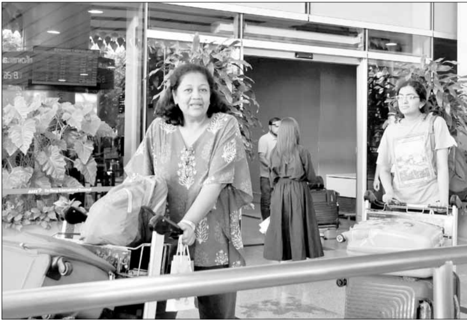
Du khách Ấn Độ đến thành phố qua sân bay quốc tế Đà Nẵng.

Các chuyên gia chuyên khai thác thị trường Ấn Độ cũng cho rằng các doanh nghiệp du lịch của Đà Nẵng nên chủ động làm việc trực tiếp với thị trường thông qua các công ty lữ hành, các đầu mối liên hệ tại Ấn Độ, hoặc tham gia các hội chợ để gặp trực tiếp các đối tác thay vì qua các phương tiện khác. Bên cạnh đó, thay vì phải thuê riêng đầu bếp các cơ sở kinh doanh dịch vụ lưu trú có thể làm việc với các nhà hàng chuyên về ẩm thực Ấn Độ, cung cấp các sản phẩm dịch