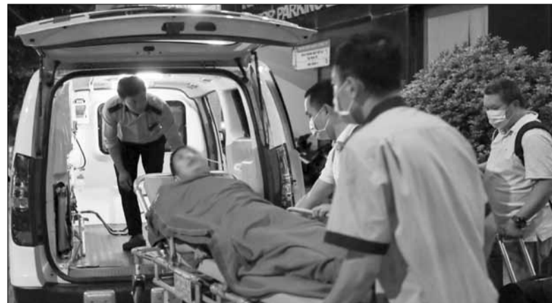
Xe cấp cứu Bệnh viện Đa khoa Gia đình đang vận chuyển bệnh nhân.