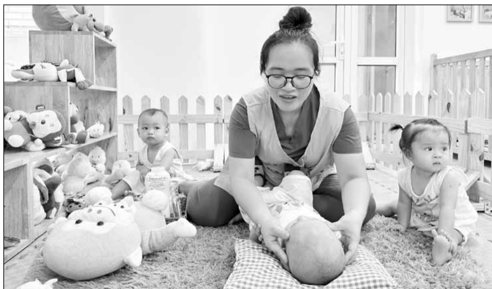
Chăm sóc trẻ từ 6-18 tháng tuổi tại Trường Mầm non Ngọc Lan (quận Hải Châu).

Sau hơn 5 năm triển khai, đề án thí điểm nhân giữ trẻ 6-18 tháng tuổi tại các trường mầm non công lập trên địa bàn thành phố đã mang lại nhiều hiệu quả, bước đầu đáp ứng yêu cầu của phụ huynh.