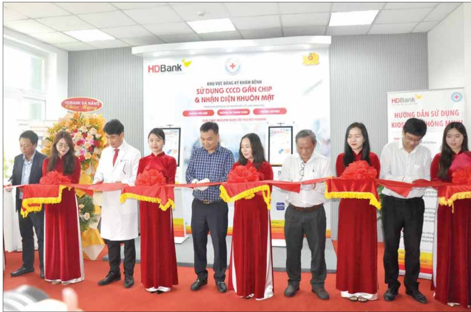
Các đại biểu cắt băng khai trương kiosk y tế thông minh tại Bệnh viện Đà Nẵng.