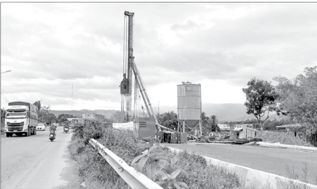
Một đoạn dự án cải tạo, nâng cấp quốc lộ 14B đoạn qua địa bàn thành phố Đà Nẵng.