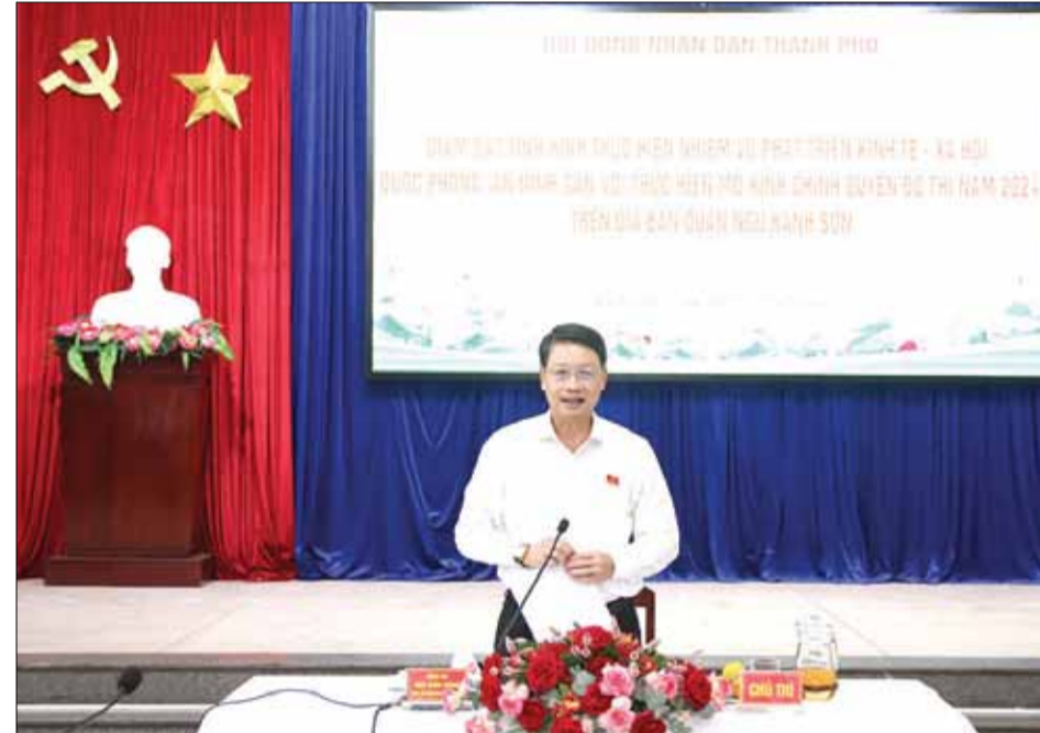
XEM TIẾP TRANG 2

Kết luận buổi làm việc, Chủ tịch HĐND thành phố Ngô Xuân Thăng ghi nhận, đánh giá cao kết quả quận Ngũ Hành Sơn đạt được, nhất là lĩnh vực thu ngân sách; đề nghị quận tiếp thu các ý kiến góp ý của đại diện lãnh đạo các sở, ngành tại buổi giám sát, có giải pháp để giải quyết dứt điểm các nội dung công việc, bảo đảm hoàn thành tốt nhất nhiệm vụ chính trị được giao. Hiện nay, quận còn