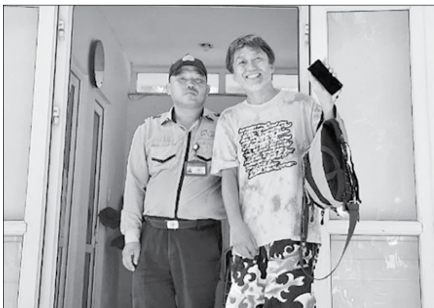
Đại diện Đội Quản lý trật tự du lịch thuộc Ban Quản lý Bán đảo Sơn Trà và các bãi biển du lịch Đà Nẵng trao trả tài sản bị thất lạc cho du khách.

Được triển khai từ đầu năm 2024, mô hình dân vận khéo "Tìm kiếm và trả lại đồ thất lạc cho du khách" do Ban Quản lý bán đảo Sơn Trà và các bãi biển du lịch Đà Nẵng triển khai bước đầu đạt được những kết quả tích cực, góp phần xây dựng hình ảnh thành phố Đà Nẵng thân thiện với du khách.