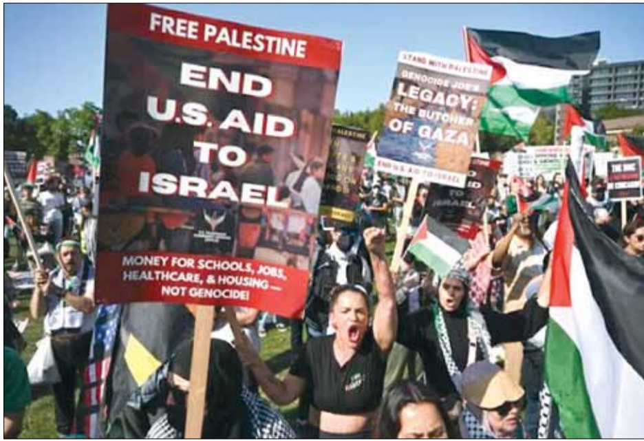
Người biểu tình kêu gọi Mỹ dừng cung cấp viện trợ cho Israel tại Union Park (Mỹ).