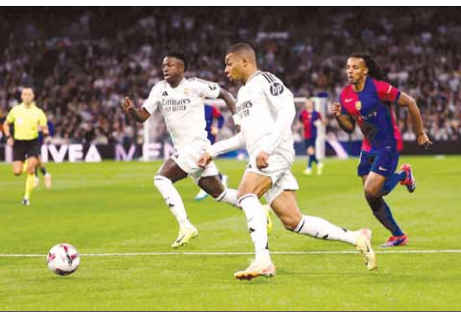
Người hâm mộ chờ đợi Real Madrid (áo trắng) đánh bại AC Milan để lấy lại bản lĩnh của nhà vua.

Lượt trận này, Liverpool tiếp Bayer Leverkusen trên sân nhà, còn Manchester City làm khách trước Sporting Lisbon. Đây là những trận đấu ảnh hưởng đến ngôi đầu bảng xếp hạng bởi 4 đội xếp trong top 8 (nhóm giành vé trực tiếp vào vòng 1/8) chỉ cách nhau 2 điểm. Những ngày qua, báo chí Anh dành lời khen cho HLV của Liverpool - ông Arne Slot. Chiến lược gia người Hà Lan khoác lác khoảng tháng 1-1 trước Brighton ở vòng 10, Arne Slot trở thành HLV đầu tiên trong lịch sử Liverpool giành chiến thắng 8/10 trận đầu tiên tại Ngoại hạng Anh. Đây là kết quả vượt mong đợi, nhất là khi Liverpool mùa sắm rất hạn chế trong mùa hè với 40 triệu euro chi cho công tác tuyển quân. Họ chỉ đưa về những cầu thủ dự bị, trong khi bộ khung chính không thay đổi. Bên cạnh kỷ lục, 3 điểm giúp thầy trò HLV Arne Slot xây chức ngôi đầu trong bối cảnh Manchester City và Arsenal đều thua. Lúc này, Liverpool hơn Manches City 2 điểm và Arsenal 7 điểm. Với lợi thế này, Liverpool tự tin hướng đến mục tiêu đánh bại Bayer Leverkusen để chiếm ngôi đầu bảng của Aston Villa tại Champions League. Liverpool và Aston Villa là hai đội toàn thắng sau 3 trận đấu, nhưng thầy trò HLV Arne Slot xếp sau đối thủ do thua hậu vệ số 17.