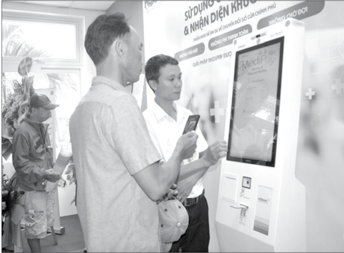
Việc thiết lập kiosk y tế thông minh giúp người dân thuận lợi trong việc đăng ký khám, chữa bệnh tại Bệnh viện Đà Nẵng.