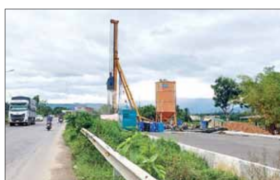
Một đoạn dự án cải tạo, nâng cấp quốc lộ 14B đoạn qua địa bàn thành phố Đà Nẵng.