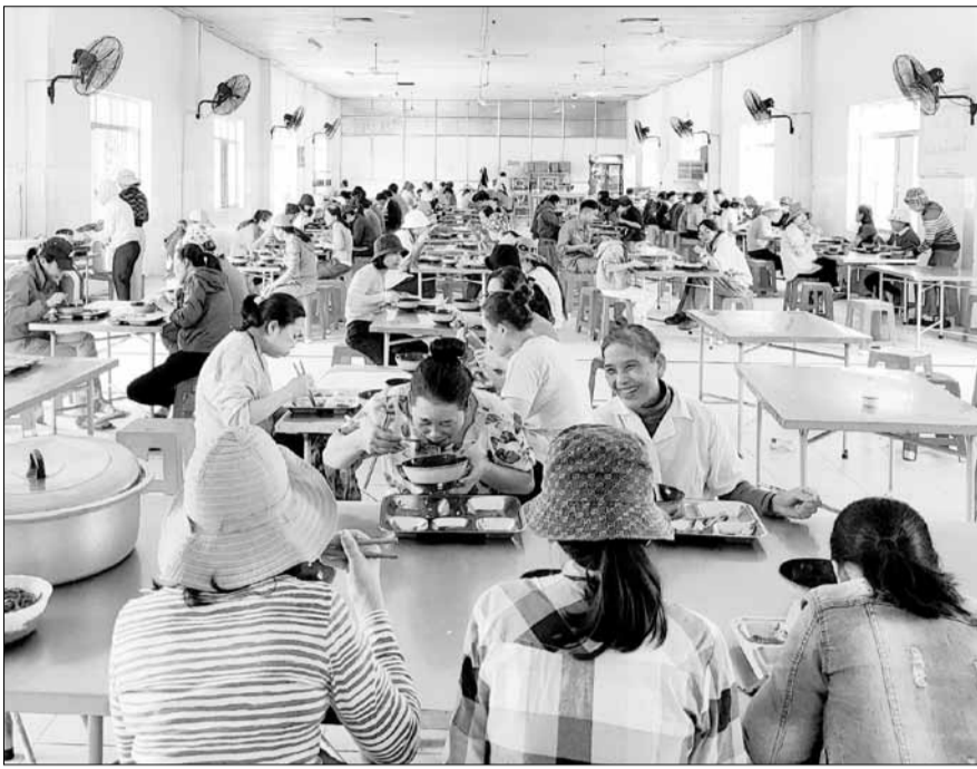
Người lao động Công ty CP Thủy sản và Thương mại Thuận Phước dùng bữa ăn giữa ca.

Tại Công ty TNHH Kiến trúc và Thương mại Á Châu (khu công nghiệp Hòa Khánh), để bảo đảm sức khỏe, dinh dưỡng cho 350 người lao động, công ty có bộ phận bếp phụ trách bữa ăn ca. Giá trị mỗi suất ăn là 23.000 đồng, chưa bao gồm chi phí điện, nước, nhân công. Thực đơn được thay đổi hàng ngày, từ 2 món mặn, 1 món xào, canh và cơm trắng. Vào thứ Tư và thứ Bảy trong tuần, thực đơn sẽ là các món bún, mì, phở nhằm tạo sự ngon miệng cho người lao động. Công ty CP Cao su Đà Nẵng (DRC) đang áp dụng giá bữa ăn ca mức 20.800 đồng/suất cho ca 1, ca 2 và 29.000 đồng/suất cho ca 3, chưa bao gồm các chi phí liên quan. Đại diện văn phòng DRC cho biết, bữa ăn ca do một đơn vị cung cấp thông qua đầu thầu hằng năm. Thực đơn bữa