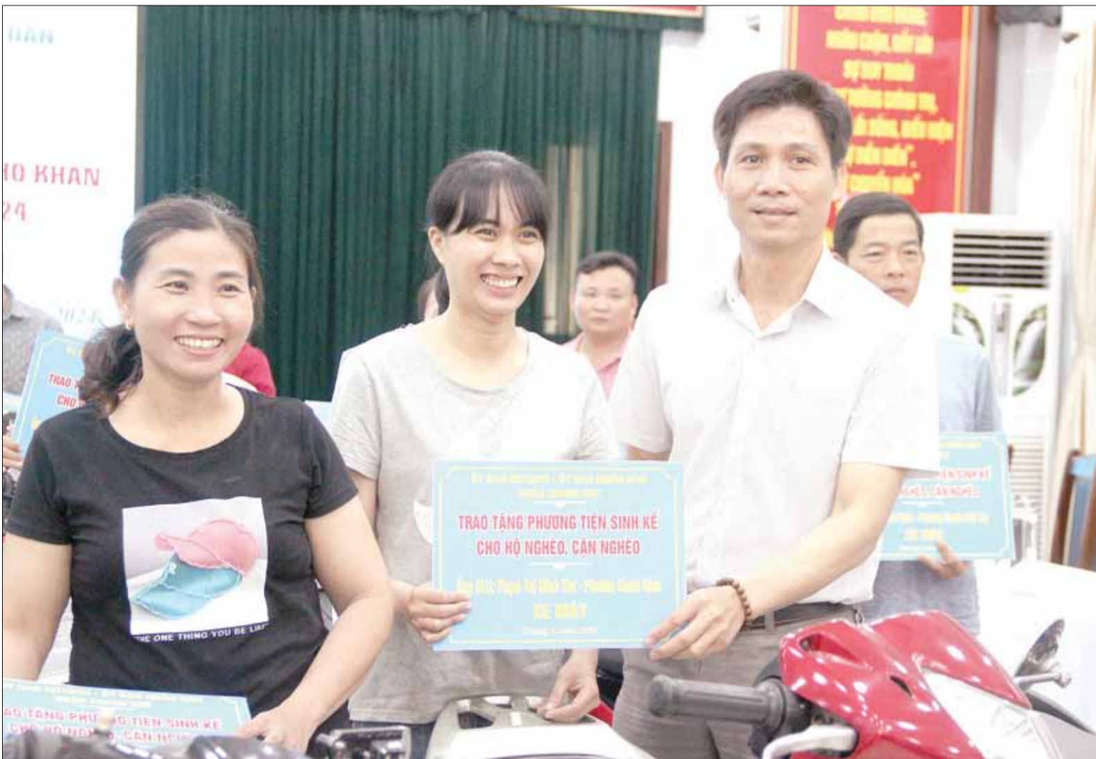
Thành phố dành nhiều chính sách chăm lo an sinh xã hội, nâng cao đời sống người dân. TRONG ẢNH: UBND quận Thanh Khê tổ chức trao sinh kế cho hộ nghèo, hộ cận nghèo.