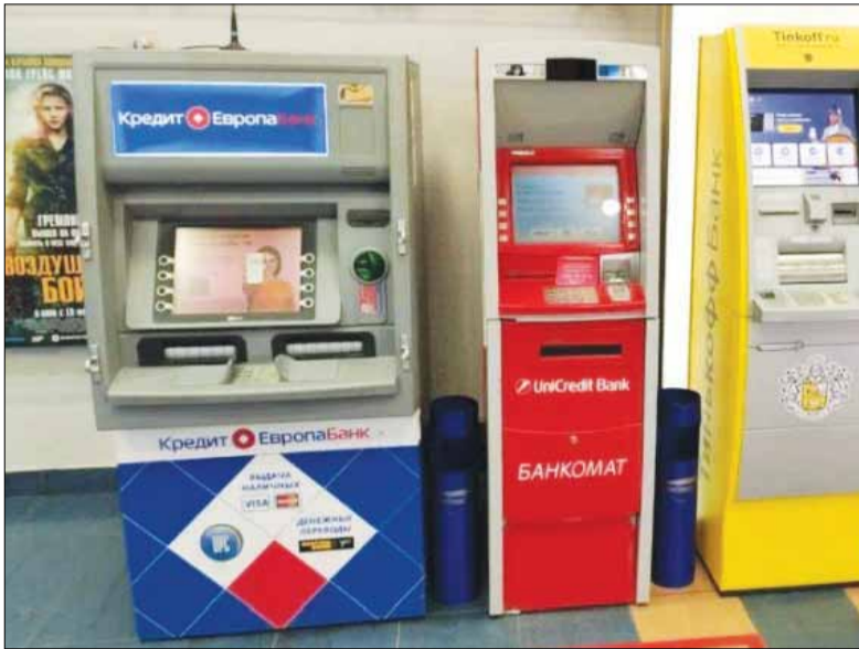
The ngân hàng của Iran có thể sử dụng trong mạng lưới ATM của Nga.

Nga và Iran hoàn tất việc ghép nối các hệ thống thanh toán quốc gia giữa hai bên, qua đó cho phép du khách hai nước sử dụng thẻ ghi nợ trong nước để mua hàng tại mỗi bên. Động thái đánh dấu cột mốc trong hợp tác kinh tế giữa hai quốc gia này.