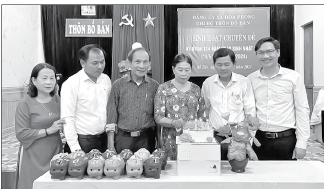
Chi bộ thôn Bồ Bản (xã Hòa Phong) mở heo đất nhân dịp sinh nhật Bác để hỗ trợ các hoàn cảnh khó khăn. Ảnh: PV

Từ khi triển khai Kết luận số 01-KL/TW và Chi thị số 34-CT/TU của Ban Thường vụ Thành ủy về tiếp tục đẩy mạnh cải cách hành chính, tăng cường kỷ luật, kỷ cương, khắc phục tình trạng né tránh, đùn đẩy, quyền làm đúng, đầy đủ chức trách, nhiệm vụ, quyền hạn của một bộ phận cán bộ, đảng viên, công chức, viên chức trong tình hình hiện nay, chi ủy xây dựng nghị quyết chuyên đề triển khai cho đảng viên học tập và kiểm điểm tự soi, tự sửa. Hằng năm, chi bộ xây dựng kế hoạch tài chính và mỗi đảng viên đăng ký kế hoạch cá nhân việc học tập làm theo. Vì vậy, đảng viên trong chi bộ không có trường hợp nào vi phạm 27 biểu hiện suy thoái về đạo đức, lối sống theo tinh