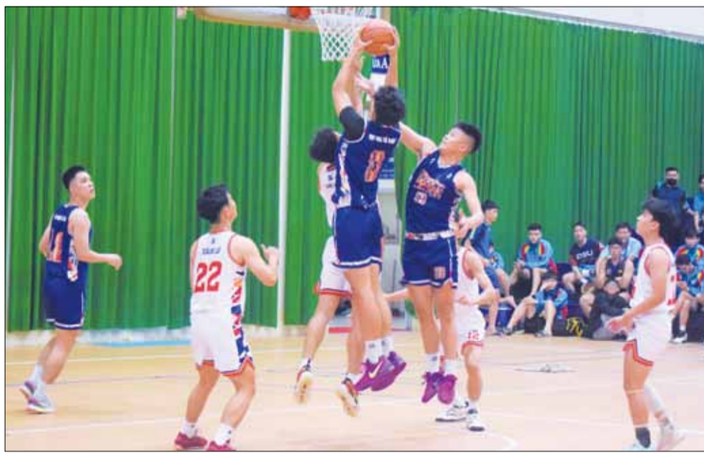
Các vận động viên tranh tài tại giải.

Ngày 12-11, giải bóng rổ sinh viên toàn quốc năm 2024 khu vực miền Trung khởi tranh tại Trung tâm Thể thao Đại học Đà Nẵng. Đây là lần thứ 3 liên tiếp Đại học Đà Nẵng đăng cai tổ chức giải. Với sự góp mặt của các đội bóng mạnh đến từ các trường đại học trong khu vực, giải hứa hẹn hấp dẫn, kịch tính, mang đến những trận cầu mãn nhãn cho người hâm mộ.