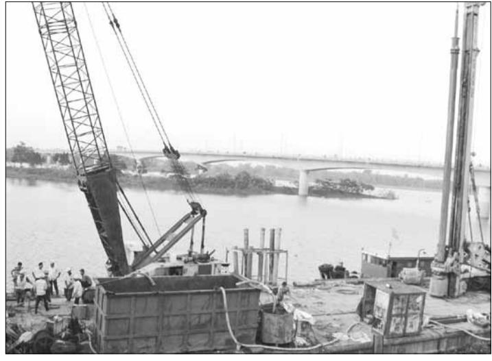
Thi công cầu Cầu Lâu cũ.

Khu Quản lý đường bộ III vừa có văn bản điều chỉnh phương án phân luồng, điều tiết giao thông phục vụ thi công sửa chữa cầu Cầu Lâu mới (bắc qua sông Thu Bồn, nối thị xã Điện Bàn và huyện Duy Xuyên) trên quốc lộ 1A tỉnh Quảng Nam. Như vậy, cùng thời gian này, cả hai cầu Cầu Lâu (cũ và mới) đều được triển khai sửa chữa nên các phương tiện thường xuyên lưu thông qua đây cần nắm rõ thông tin để di chuyển thuận lợi.