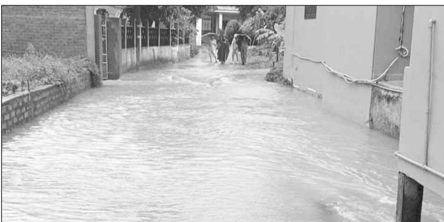
Nước tràn xuống kiệt 11 thuộc tổ 2, thôn Thạch Nham Đông trong trận mưa lớn sáng 5-11.

Sự cố vỡ đập Hồ Dư vào tháng 10-2022 gây ngập lụt nghiêm trọng, ảnh hưởng 117 hộ dân với nhiều nhà cửa bị sập, tài sản bị cuốn trôi đã ám ảnh nhiều người dân xã Hòa Nhơn suốt 2 năm qua. Trong đó, thôn Thạch Nham Đông là một trong những địa bàn chịu thiệt hại nặng nề. Chính vì thế, khi thời tiết diễn biến phức tạp, người dân của thôn không khỏi lo lắng. Theo ông Hùng, khi có thông tin về chủ trương đầu tư hệ thống thoát nước toàn khu vực, người dân hy vọng tình trạng ngập nặng tại khu vực sẽ được khắc phục. Tuy nhiên trong mùa mưa năm 2023, địa bàn tổ 2 và tổ 3 thôn Thạch Nham Đông tiếp tục