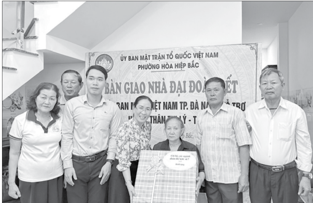
Những chính sách an sinh xã hội vượt trội của thành phố giúp hàng nghìn hộ nghèo, đối tượng yếu thế nâng cao đời sống vật chất, tinh thần. TRONG ẢNH: Ủy ban MTTQ Việt Nam phường Hòa Hiệp Bắc (quận Liên Chiểu) bàn giao nhà đại đoàn kết cho hộ nghèo.