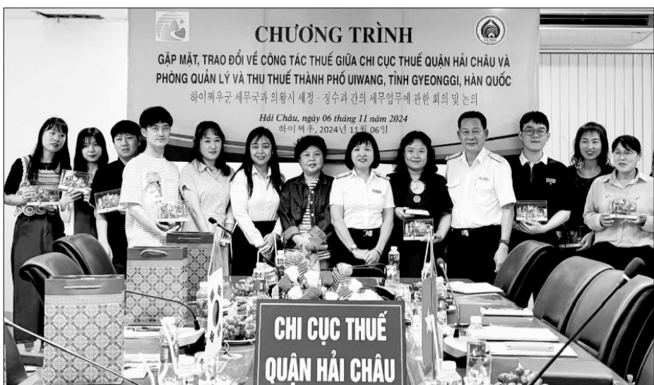
Chi cục Thuế quận Hải Châu, UBND phường Hải Châu 2 tổ chức chương trình gặp mặt, trao đổi kinh nghiệm về công tác thuế với Phòng Quản lý và thu thuế thành phố Uuiwang, tỉnh Gyeonggi, Hàn Quốc để trao đổi kinh nghiệm.

Năm 2024, quận Hải Châu triển khai nhiều giải pháp chống thất thu thuế, nỗ lực tăng thu ngân sách vượt chỉ tiêu thành phố giao. Tính đến cuối tháng 11, quận đã ghi thu 1.230 tỷ đồng, bằng 105% dự toán giao, tăng 106% so với cùng kỳ năm 2023. Dự kiến cả năm 2024, mức thu toàn quận đạt trên 1.300 tỷ đồng, bằng 113% chỉ tiêu giao.