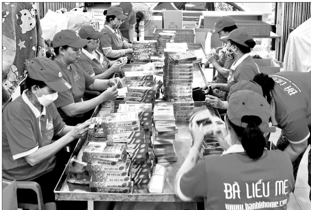
Các cơ sở làm bánh khô mè tại quận Cẩm Lệ đang tất bật cho vụ Tết.