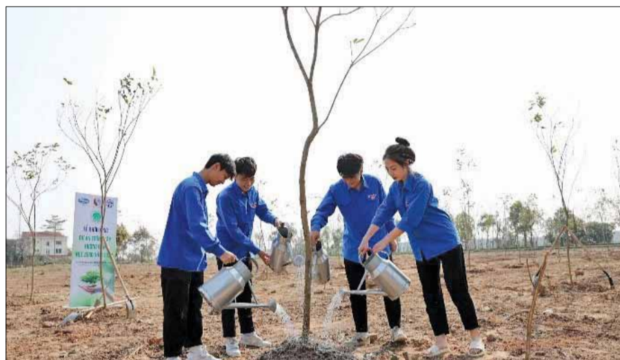
Các hoạt động trồng cây được Vinamilk triển khai đều kêu gọi sự tham gia của nhân viên, đoàn viên thanh niên, cộng đồng...

Net Zero là một trong những chủ đề nóng hổi được đặc biệt quan tâm. Đó cũng là lý do hạng mục "Lãnh đạo xanh" được xây dựng theo các tiêu chí như: Sử dụng tài nguyên hiệu quả, biện pháp giảm thiểu khí thải, ứng dụng công nghệ xanh và sáng kiến phát triển bền vững... Qua đó, vinh danh các doanh nghiệp của châu Á có nhiều thực hành điển hình và nổi bật về chiến lược phát triển bền vững.