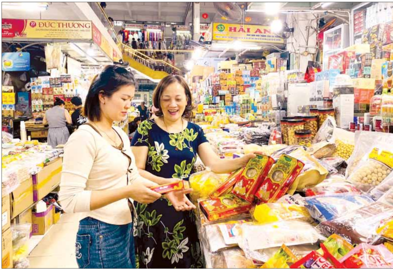
Nhiều sản phẩm OCOP Đà Nẵng được bày bán phục vụ nhu cầu mua sắm cuối năm và dịp Tết sắp đến. TRONG ẢNH: Người dân, du khách chọn mua hàng đặc sản Đà Nẵng tại chợ Hàn.