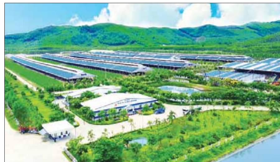
Hệ thống 14 trang trại trên cao nước đang được áp dụng các giải pháp về nông nghiệp bền vững và năng lượng xanh.

tiêu chuẩn quốc tế PAS 2060:2014, bao gồm Nhà máy sữa Nghệ An, Trang trại bò sữa Nghệ An và Nhà máy Nước giải khát Việt Nam. Tổng lượng khí thải được Vinamilk trung hòa là 21.000 tấn CO 2 e (tương đương hơn 2 triệu cây xanh được trồng).