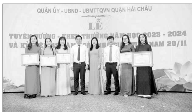
Quận Hải Châu khen thưởng các thầy, cô giáo có thành tích xuất sắc trong dạy học.

Đóng góp vào thành công chung của ngành giáo dục và đào tạo thành phố, ngành giáo dục và đào tạo quận Hải Châu đã xây dựng đội ngũ những người thầy, người cô, tận tâm, tận lực, hết lòng vì sự nghiệp giáo dục, vì học sinh thân yêu.