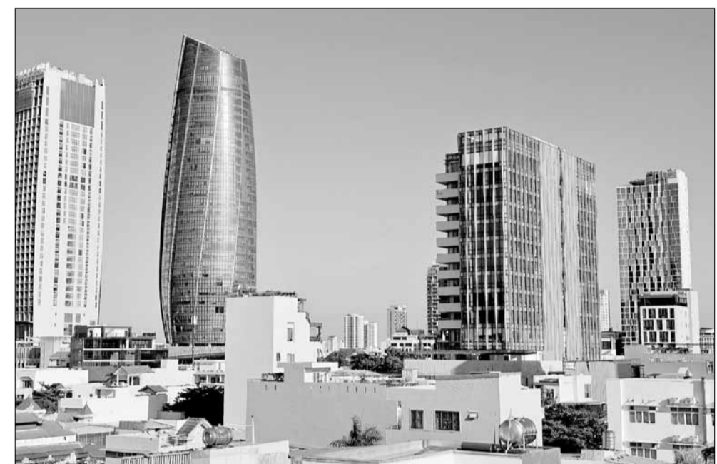
Quận Hải Châu có tốc độ phát triển đô thị nhanh và hiện đại.

khẩu tổ chức thực hiện và điều khoản thi hành trong thời gian đến. Các đơn vị tuyên truyền kết quả, thành tựu, những hạn chế, nguyên nhân và bài học kinh nghiệm về việc triển khai thi điểm mô hình chính quyền đô thị mà thành phố và quận đã triển khai theo Nghị quyết số 119/2020/QH14 của Quốc hội về thi điểm tổ chức mô hình chính quyền đô thị và một số cơ chế, chính sách đặc thù phát triển thành phố Đà Nẵng. Đồng thời biểu dương những cách làm hay, hiệu quả, những tập thể, cá nhân dám nghĩ, dám làm vì lợi ích chung trong quá trình tổ chức triển khai thực hiện của các cấp, các ngành, các địa phương, đơn vị trên tất cả các lĩnh vực của đời sống xã hội. Mặt khác, các hoạt động tuyên truyền về nghị quyết gắn với tuyên truyền kết quả thực hiện các nhiệm vụ