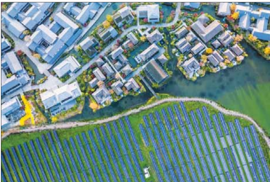
Các thành phố của Trung Quốc đang đóng vai trò quan trọng trong việc phát triển các công nghệ chuyên biệt như năng lượng mặt trời.

Trung Quốc giữ vai trò tiên phong về nghiên cứu khoa học khi một nửa trong số 20 thành phố khoa học hàng đầu thế giới hiện ở Trung Quốc. Đáng chú ý, Bắc Kinh và Thượng Hải chiếm những vị trí dẫn đầu.