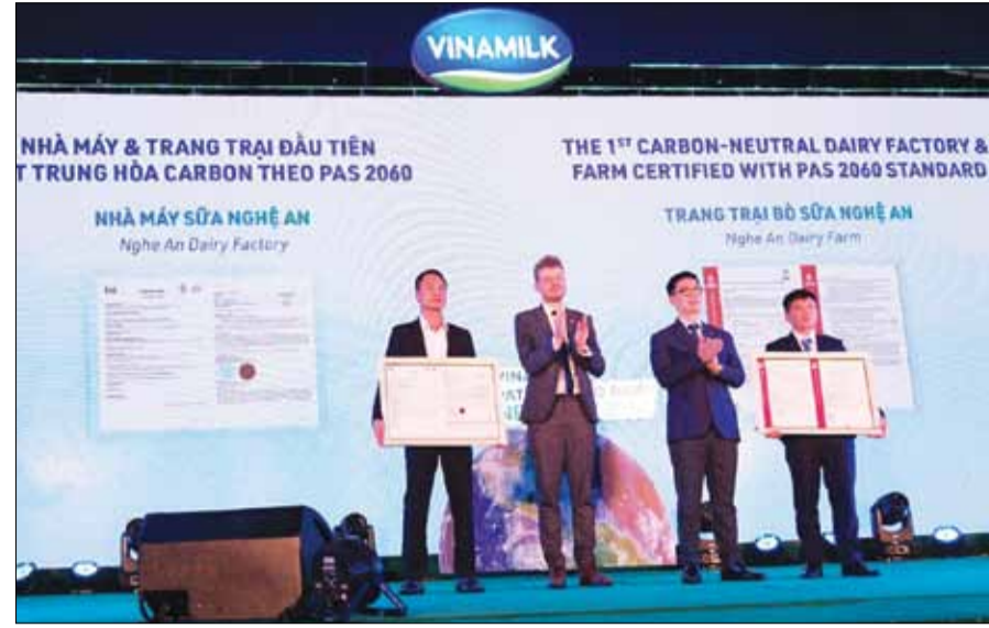
Đến nay, Vinamilk là công ty sữa đầu tiên và duy nhất tại Việt Nam có các nhà máy và trang trại đạt trung hòa Carbon.

Chương trình hành động "Vinamilk Pathways to Dairy Net Zero 2050" được công bố vào năm 2023, trong đó nhấn mạnh cam kết và lộ trình tiến đến mục tiêu phát thải ròng bằng 0 (Net Zero) vào năm 2050. Trong năm đầu tiên sau khi khởi động lộ trình, kết quả bước đầu của Vinamilk có thể kể đến việc sở hữu 3 đơn vị đạt trung hòa carbon theo