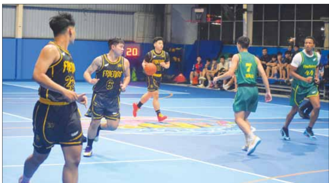
Các vận động viên tranh tài tại giải.

Giải bóng rổ quận Thanh Khê mở rộng năm 2024 đang diễn ra sôi nổi tại sân bóng rổ Chiêu Ứng Tự và sân Trung tâm Văn hóa - Thể thao quận Thanh Khê. Trong lần thứ 3 được tổ chức, giải là sân chơi hấp dẫn cho các CLB bóng rổ mạnh trên địa bàn thành phố tranh tài, góp phần lan tỏa phong trào bóng rổ trong cộng đồng.