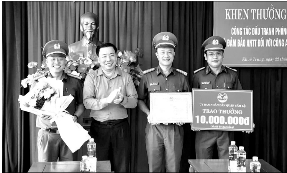
UBND quận Cẩm Lệ khen thưởng đột xuất Công an phường Khuê Trung trong công tác đấu tranh phòng, chống tội phạm.

Với phong trào "Chung tay vì người nghèo", quận vận động tổng nguồn lực dành cho công tác giảm nghèo là hơn 15 tỷ đồng. Từ đây, hỗ trợ xây mới 2 nhà và sửa chữa 16 nhà cho các hộ nghèo, với tổng số tiền 514