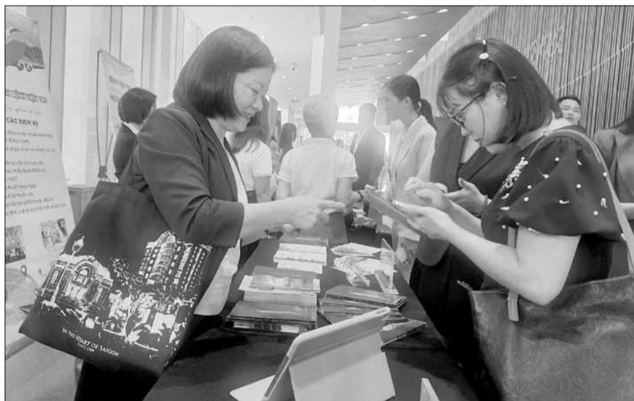
Các cơ sở kinh doanh dịch vụ du lịch quảng bá hình ảnh thông qua ứng dụng QR, thiết bị điện tử tại các hội nghị, triển lãm.

Tương tự, để đáp ứng nhu cầu ngày càng cao của khách hàng về sự tiện lợi và trải nghiệm hiện đại, Việt An Group và các cơ sở dịch vụ thành viên An Spa, Sơn Trà Marina và Du