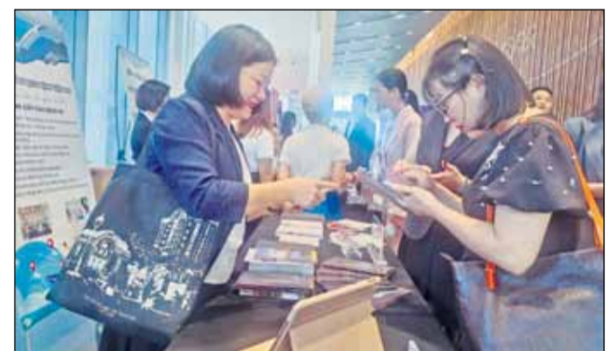
Các cơ sở kinh doanh dịch vụ du lịch quảng bá hình ảnh thông qua ứng dụng QR, thiết bị điện tử tại các hội nghị, triển lãm.