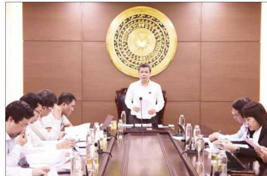
Ban Đô thị thẩm tra các nội dung dự kiến trình kỳ họp cuối năm của HĐND thành phố.

Ban Văn hóa - Xã hội thẩm tra các nội dung liên quan đến việc đặt, đổi tên một số đường và công trình công cộng; hỗ trợ xây mới, sửa chữa nhà ở đối với người có công cách mạng và thân nhân liệt sĩ; quy định giá dịch vụ khám bệnh, chữa bệnh thuộc phạm vi thanh toán của quỹ bảo hiểm y tế, giá dịch vụ khám bệnh, chữa bệnh do ngân sách Nhà nước thanh toán và giá dịch vụ khám bệnh, chữa bệnh không thuộc phạm vi thanh toán của quỹ bảo hiểm y tế mà không phải là dịch vụ khám bệnh, chữa bệnh theo yêu cầu tại các cơ sở khám bệnh, chữa bệnh công lập thuộc thành phố; quy định mức hỗ trợ đối với người hiến máu tình nguyện; quy định chính sách hỗ trợ 100% mức đóng bảo hiểm y tế hộ gia