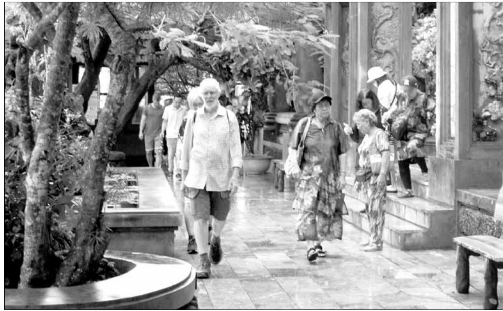
Du khách tham quan danh thắng Ngũ Hành Sơn.