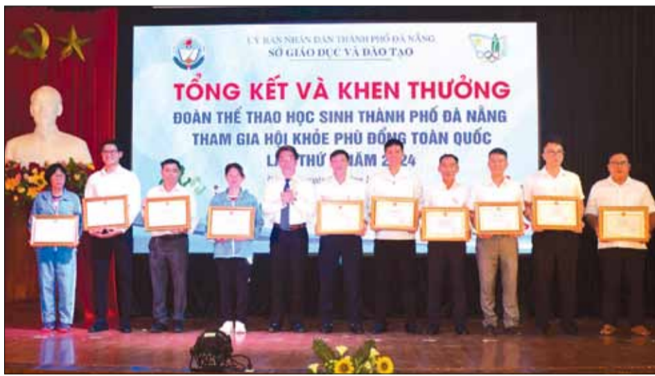
Phó Chủ tịch UBND thành phố Trần Chí Cường trao bằng khen của UBND thành phố cho các cán bộ, giáo viên.

Đến dự và phát biểu tại lễ tổng kết, Phó Chủ tịch UBND thành phố Trần Chí Cường nhấn mạnh, những thành tích các em đạt được là minh chứng rõ rệt cho sự nỗ lực không ngừng nghỉ và khát vọng vươn lên của các em, góp phần khẳng định vị thế của thể thao học đường thành phố tại các giải đấu cấp quốc gia. “Thời gian qua, ngành giáo dục và đào tạo thành phố chủ động phối hợp các cơ quan, ban, ngành tổ chức nhiều hoạt động thể thao có ý nghĩa, thu hút đông đảo học sinh tham gia và đạt được nhiều kết quả tích cực. Tuy nhiên, để thể thao học đường ngày càng phát triển mạnh mẽ hơn nữa, đề nghị ngành giáo dục và đào tạo cùng ngành văn hóa và thể thao tiếp tục nghiên cứu, xây dựng các giải pháp nhằm đẩy mạnh phong trào thể dục - thể thao trong trường học, phát hiện và bồi dưỡng tài năng thể thao, tạo nguồn vận động viên cho các kỳ thi đấu trong tương lai. Đồng thời, chú trọng việc kết hợp giữa giáo dục thể chất và giáo dục đạo đức, kỹ năng sống, giúp các em học sinh phát triển toàn diện cả về kiến thức, đạo đức, thể chất, nâng cao thể trạng và tâm vóc, đáp ứng yêu cầu xây dựng, bảo vệ và phát triển đất nước nói chung và thành phố nói riêng trong thời kỳ mới”, Phó Chủ tịch UBND thành phố nhấn