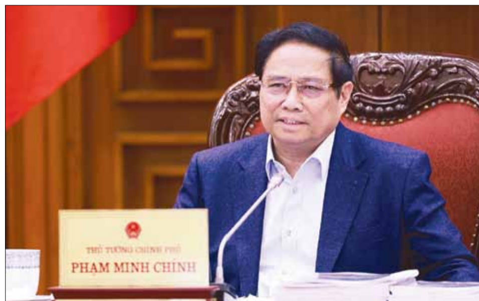
Thủ tướng Phạm Minh Chính phát biểu chỉ đạo.

Kết luận hội nghị, Thủ tướng nhấn mạnh, việc xây dựng đề án hệ thống đường sắt đô thị Hà Nội và Thành phố Hồ Chí Minh nhằm hiện thực hóa Kết luận số 49-KL/TW của Bộ Chính trị về định hướng phát triển giao thông vận tải đường sắt Việt Nam đến năm 2030, tầm nhìn đến năm 2045 và Kết luận số 72-KL/TW của Bộ Chính trị về tiếp tục thực hiện Nghị quyết số 13-NQ/TW của Ban Chấp hành Trung ương Đảng (khóa XI) về xây dựng kết cấu hạ tầng đồng bộ nhằm đưa nước ta cơ bản trở thành nước công nghiệp theo hướng hiện đại nhằm giải quyết ùn tắc giao thông, giảm ô nhiễm môi trường, thúc đẩy tăng trưởng hai con số tại