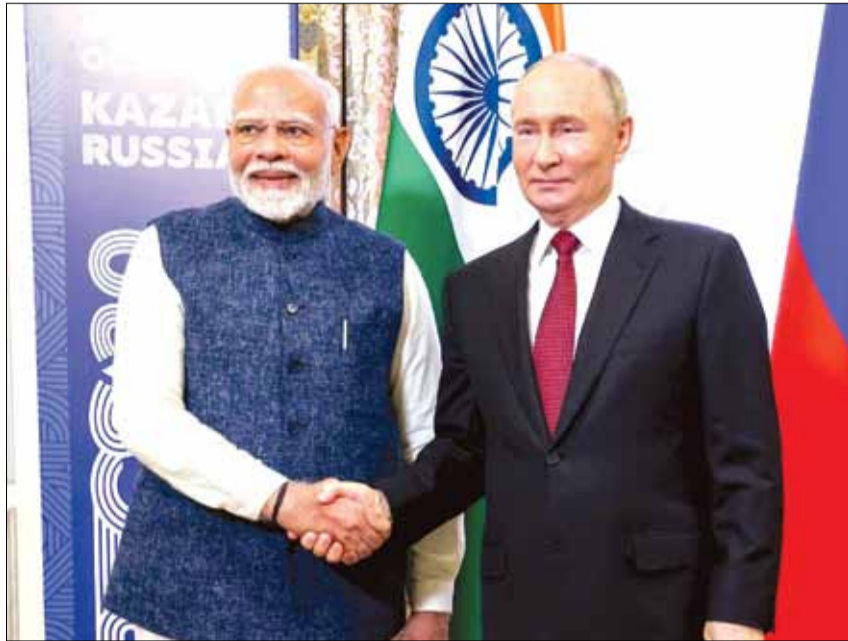
Tổng thống Nga Vladimir Putin (bên phải) và Thủ tướng Ấn Độ Narendra Modi tại hội nghị thượng đỉnh BRICS lần thứ 16 tại Kazan tháng 10-2024.

RT dẫn phát biểu tại diễn đàn đầu tư “VTB Nước Nga đang vẫy gọi” ở Moscow ngày 4-12, Tổng thống Putin nhận định chính sách “Ấn Độ trên hết”, trong đó có sáng kiến “Sản xuất tại Ấn Độ” của Thủ tướng Modi giúp thúc đẩy môi trường tăng trưởng ổn định của quốc gia Nam Á. Với mục tiêu thúc đẩy sản xuất và thu hút đầu tư nước ngoài, sáng kiến trên đóng vai trò quan trọng trong việc củng cố vị thế của Ấn Độ trong nền kinh tế toàn cầu. Điều đáng chú ý là Tổng thống Putin đã so sánh sáng kiến này của Ấn Độ với chương trình thay thế hàng nhập khẩu tương tự ở Nga. Đó cũng là động lực thúc đẩy Moscow xích lại gần hơn và mở rộng đầu tư vào quốc gia Nam Á này. “Chính phủ Ấn Độ, dưới sự dẫn dắt của Thủ tướng Modi đã tạo ra các điều kiện ổn định trên mọi lĩnh vực, bao gồm cả nền kinh tế, với cam kết thực hiện chính sách “Ấn Độ trên hết”. Chúng tôi tin tưởng việc đầu tư vào Ấn Độ chắc chắn sẽ ổn định và mang đến lợi nhuận cao. Do đó, chúng tôi sẵn sàng thành lập một số cơ sở sản xuất nhất định tại Ấn Độ trong thời gian tới”, Tổng thống Putin tuyên bố. Ngày 2-12, Điện Kremlin xác nhận Tổng thống Putin dự kiến thăm Ấn Độ vào năm 2025 theo lời mời của Thủ tướng Modi. Trợ lý Tổng thống Nga Yuri Ushakov cho biết, lịch trình cụ thể sẽ được hoàn thiện và thông báo vào đầu năm 2025.