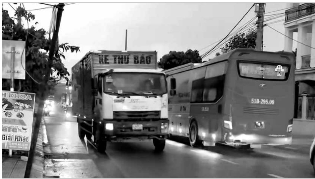
Vào ban đêm, các xe khách, xe tải "né" đường tránh nam Hải Vân - Túy Loan để chuyển hướng vào đường ĐH2.