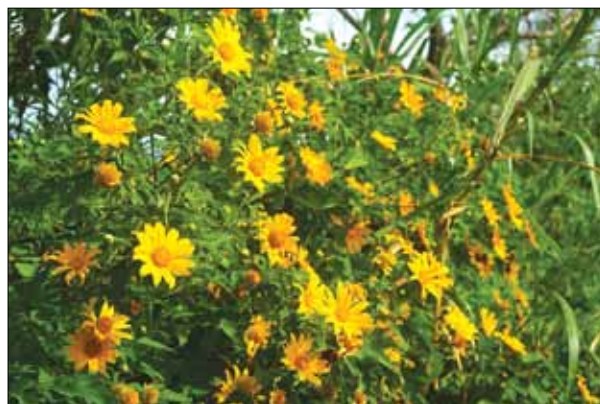
Dã quỳ nở báo hiệu mùa đông se lạnh về với cao nguyên Đà Lạt.