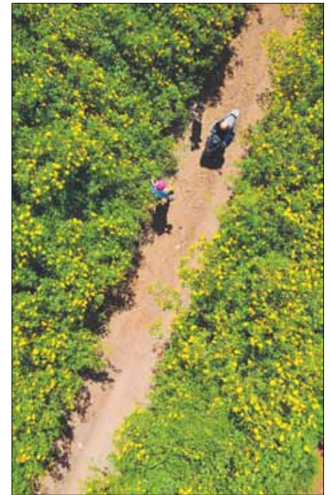
Những con đường dã quỳ len lỏi dưới chân núi.