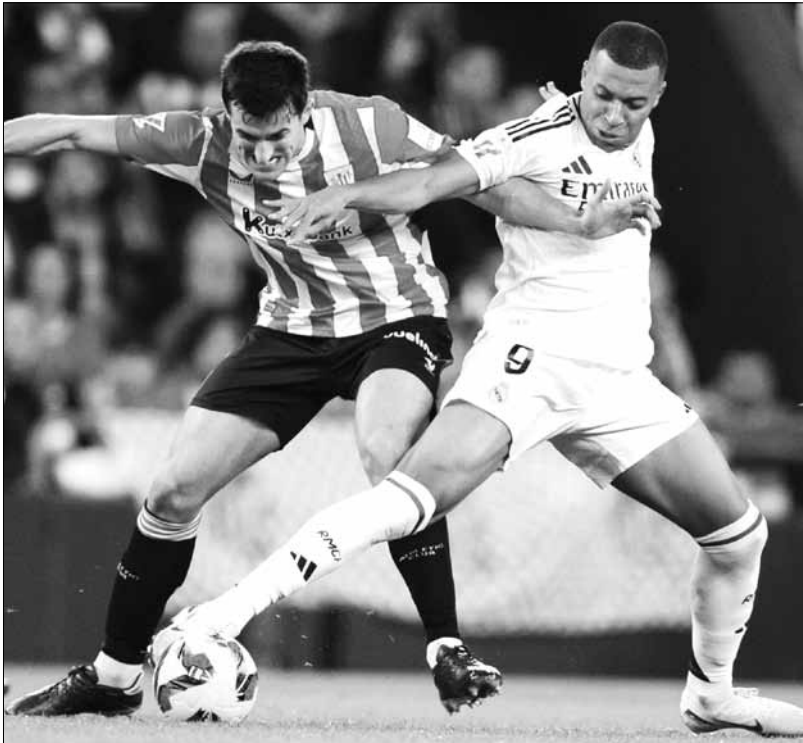
Mbappe tiếp tục gây thất vọng và chịu nhiều sức ép.

Gọi ác mộng với Mbappe cũng có lý bởi người yêu mến anh không lý giải được chuyện gì đang xảy ra trong thực lực của ngôi sao từng lập hat-trick ở trận chung kết World Cup 2022 với 3 lần thành công khi đứng trước chấm 11 mét (cả trong loạt sút luân lưu cân não). Anh chọn cách giải bày kịp thời vì không muốn khán giả nhà kéo dài nỗi ngao ngán, đồng thời hy vọng có thể trấn an họ bằng lời hứa sớm khắc phục. “Một kết quả tồi tệ, một lỗi lầm lớn! Tất cả do tôi chơi kém. Mong mọi người thứ lỗi và hãy chờ xem tôi trở lại!”. Không riêng nỗi vô duyên trước chấm phạt đền, suốt trận, anh cũng bỏ phí các cơ hội mười mười - trong đó có pha mớm bóng sắc gọn từ chân đồng đội Jude Bellingham. Nếu dứt điểm thành công, cục diện có thể đổi thay và Real Madrid không hứng thêm thất bại bẽ bàng trước một đối thủ mà 9 năm rồi chưa bao giờ tìm được hương vị chiến thắng trước họ. Quả là một vấp ngã làm dấy lên bao ngờ vực. Trong 11 trận mới nhất trên mọi đấu trường, đội bóng “hoàng gia” để thua đến 5 trận và đành đứng sau cái bóng của nhiều đối thủ. Ở giải vô địch quốc gia, Real Madrid hiện xếp sau kinh địch Barcelona với 4 điểm cách biệt trong khi ở đấu trường Champions League, họ