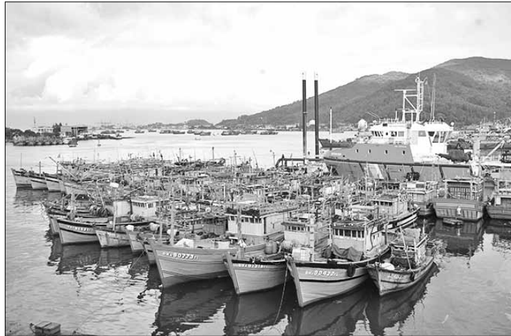
Thành phố nỗ lực tuyên truyền pháp luật để ngư dân vươn khơi có trách nhiệm.

Với cá nhân ông Bình, trên vai trò thành viên Trung đội dân quân biển phường Thọ Quang, tinh thần tuân thủ này còn được bồi đắp trong những chuyến vươn khơi gặp gỡ lực lượng kiểm ngư, cảnh sát biển. "Tổ tiên tôi là từ vùng biển An Bàng tại Hội An (Quảng Nam), những thế hệ trong gia đình