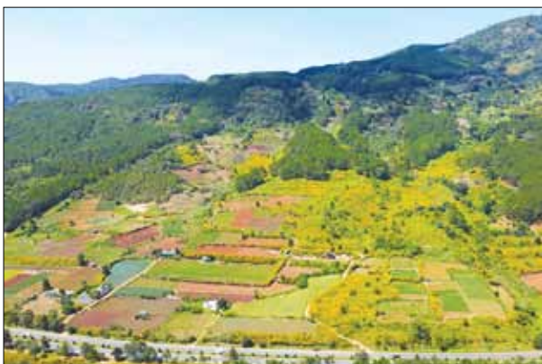
Mùa hoa dã quỳ thường bắt đầu nở từ trung tuần tháng Mười đến cuối tháng Mười Một.