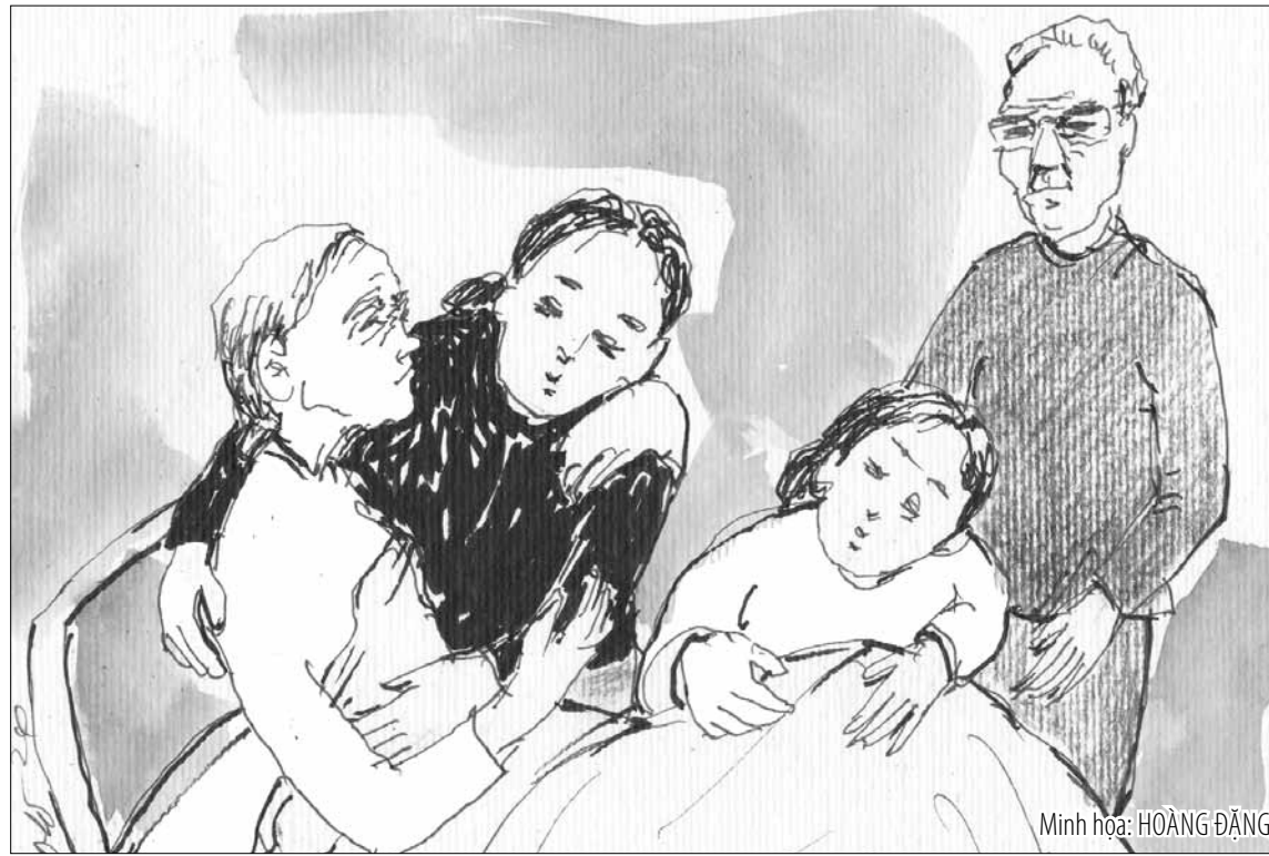
Minh họa: HOÀNG ĐĂNG