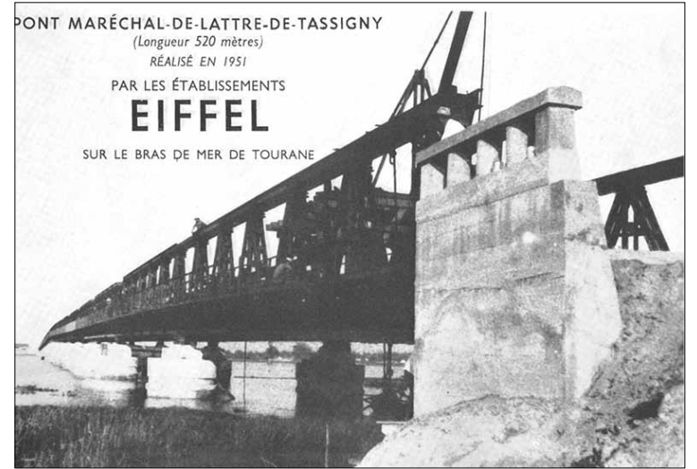
Chiếc cầu do hãng Eiffel nổi tiếng thi công, nối liền hai bờ đông-tây sông Hàn.

2. Tôi có đứa bạn học chung lớp ở trong kiệt Mã Vôi phía đường Hoàng Diệu rủ đi bán dép râu, chỉ mấy ngày hai đứa đã kiếm được chục USD, về đổi ra tiền Việt mua sách vở và ăn hàng vặt.