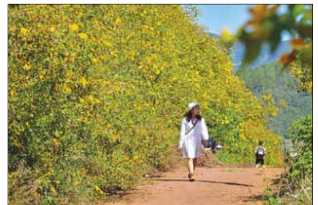
Du khách tham quan đường hoa dã quỳ ở xã Đạ Ròn (huyện Đơn Dương).

Hãy gửi cho chúng tôi những tác phẩm mà các bạn yêu thích. Địa chỉ: maichimai2611@gmail.com