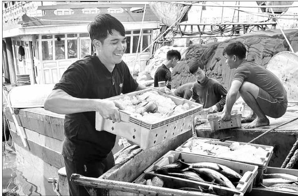
Nhiều giải pháp quyết liệt được triển khai nhằm nâng cao nhận thức của ngư dân trong công tác chống khai thác IUU.

- Chúng ta phải khẳng định rằng, công tác chống khai thác IUU là nhiệm vụ trọng tâm, cấp bách, có ý nghĩa lâu dài đối với sự