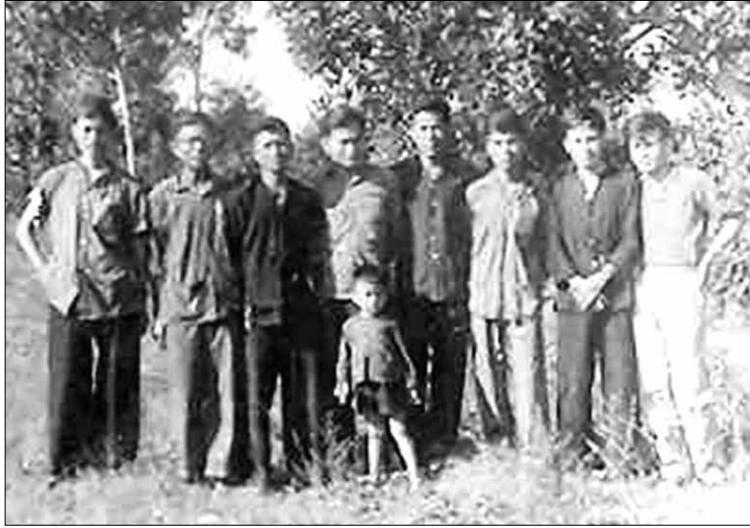
Bức ảnh duy nhất có mặt đầy đủ các nhà báo tại mặt trận Quảng Đà.

là bữa mì Quảng nhưn cá tràu ngon tuyệt và nhớ đời. Nhớ đời bởi sau bữa liên hoan ấy, gần trưa ngày 29-12-1968, một trận bom khốc liệt của không lực Hoa Kỳ ném xuống Long Hội.