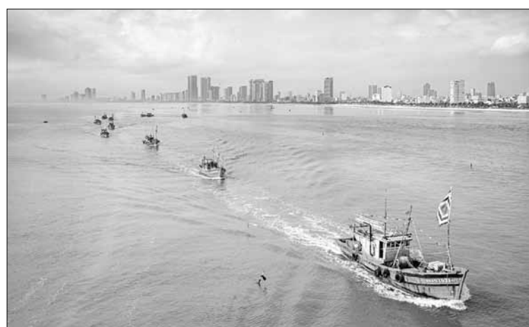
Nhìn nhận rõ lợi ích từ biển nên ngoài mưu sinh phát triển kinh tế, cộng đồng ngư dân luôn đốc lòng với nhiệm vụ bảo vệ nguồn lợi thủy sản.

triển kinh tế, ông và cộng đồng ngư dân luôn đốc lòng với nhiệm vụ bảo vệ nguồn lợi thủy sản. Có như vậy, về lâu dài, nguồn lợi thủy sản sẽ đa dạng, dồi dào, góp phần duy trì sinh kế cho ngư dân cũng như tạo sự hấp dẫn về hệ sinh thái biển thu hút du khách đến với thành phố. “Trong đời sống ngư dân, biển là nhà, là quê hương, bảo vệ biển như bảo vệ bản thân nên từ khi