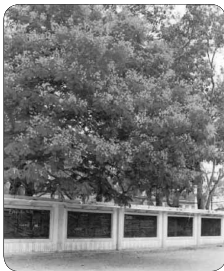
Thơ được "xuất bản" nơi dây băng đen chất liệu xi-măng bên hông sân trường, vào ra đều trông thấy.

Thơ, có hẳn CLB thơ Đại học Ngoại ngữ, do thầy giáo Bùi Trọng Ngoãn giảng dạy bộ môn Phong cách ngôn ngữ Tiếng Việt làm chủ nhiệm, quy tụ đến gần 20 "cây bút" thơ, cả thầy và trò. Thơ được "xuất bản" nơi dây băng đen chất liệu xi-măng bên hông sân trường, vào ra đều trông thấy. Thơ hút