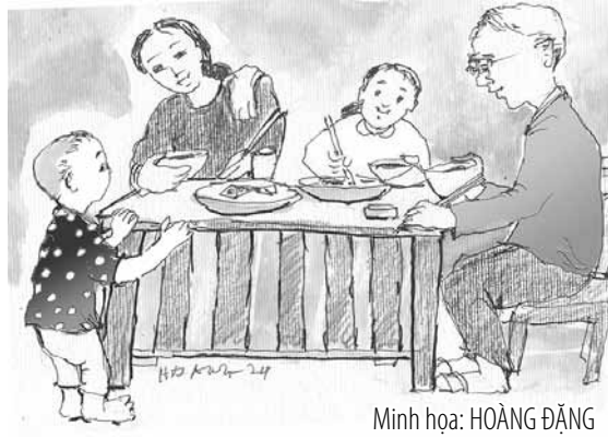
Minh họa: HOÀNG ĐẶNG

Mùa hè, trời nóng, trăng sáng; mẹ thường sai con ngã muốn ngoài sân để vừa ăn vừa hóng mát gió trời lại đỡ tốn đèn dầu. Mùa đông, cả nhà lại ngã muốn gần bếp củi cho đỡ rét. Ánh sáng từ chiếc đèn dầu cũng đủ rọi cho con thấy được sự tảo tần của mẹ, nỗi vất vả của cha. Có những lúc, chỉ một đĩa cá kho, một đĩa thịt mỡ, hay một đĩa trứng rán cũng hóa giấc mơ đủ đầy. Gia