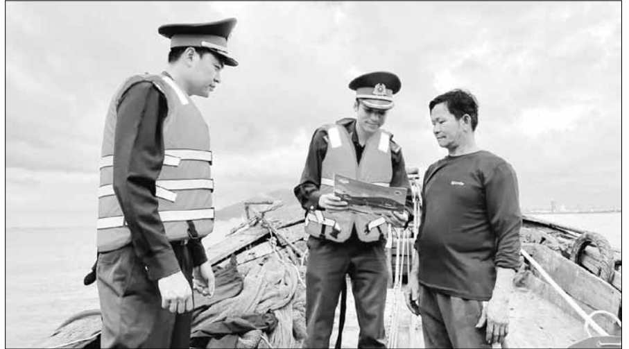
Ngư dân Đà Nẵng được tuyên truyền về lợi ích của việc đăng ký, đăng kiểm tàu cá có chiều dài 6-12m.