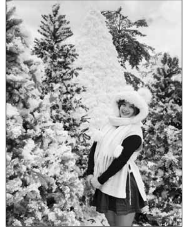
Giới trẻ Đà Nẵng đang chờ đón lễ hội thắp sáng cây thông Noel lần đầu tiên tổ chức hai bên cầu Rồng.

Người dân Đà Nẵng đang háo hức chờ đón lễ hội thắp sáng cây thông Noel sẽ diễn ra lần đầu tiên tại khu vực cảnh quan hai bờ đông, tây cầu Rồng. Lễ hội dự kiến kéo dài 20 ngày, bao gồm các hoạt động văn hóa, vui chơi, giải trí độc đáo nhằm gia tăng trải nghiệm, tạo dấu ấn cho người dân và du khách.