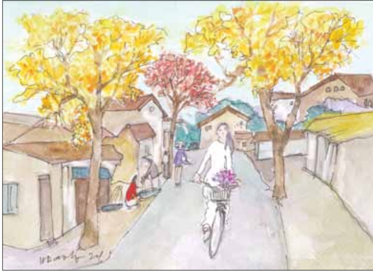
Minh họa: HOÀNG ĐẶNG

Tôi dần cảm nhận được vẻ đẹp của một thành phố trẻ bấy lâu người ta vẫn hay nghĩ về. Khoảng thời gian đặc biệt trong những ngày đến với thành phố đã cho tôi những ấn tượng sâu sắc. Một tâm hồn thích sự từ tốn như tôi đã kịp bắt gặp được những nét đặc trưng phố. Bao con đường tôi đi qua đều khoác những sắc màu riêng biệt, người ta đâu quá vội vã, hối hả để làm một điều gì đó. Người đi trên phố có những khoảnh khắc để quan sát mọi thứ xung quanh, những người bạn trên cùng con đường của mình một cách đúng