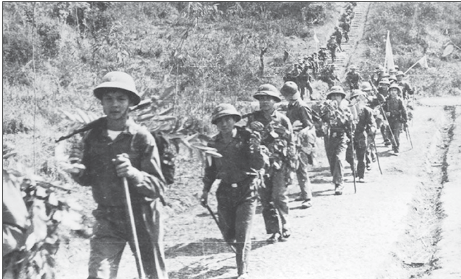
Bộ đội hành quân trên đường Trường Sơn.