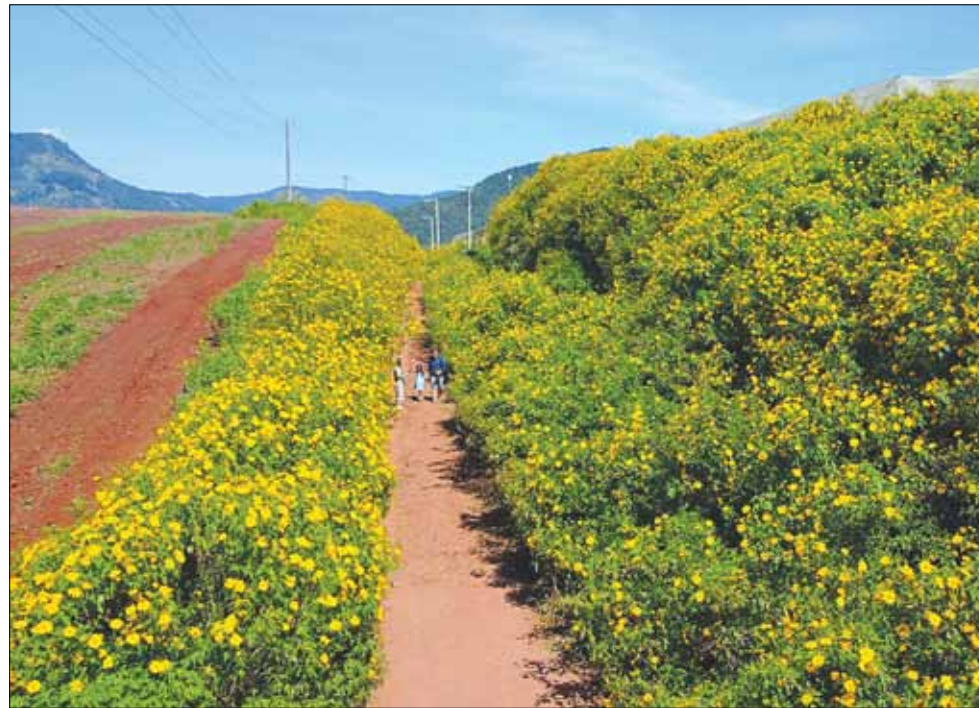
Hoa dã quỳ nở rộ cung đường Cam Ly - Vạn Thành, đèo Tà Nung - Thác Voi, Trại Mát, đèo Prenn...

Đà Nẵng cuối tuần giới thiệu đến độc giả hình ảnh về mùa hoa dã quỳ tại Lâm Đồng qua ống kính của phóng viên Xuân Sơn (Báo Đà Nẵng).