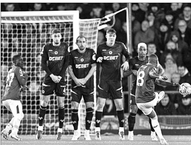
Ashley Young lập siêu phẩm đá phạt ở mốc 39 tuổi và 148 ngày.