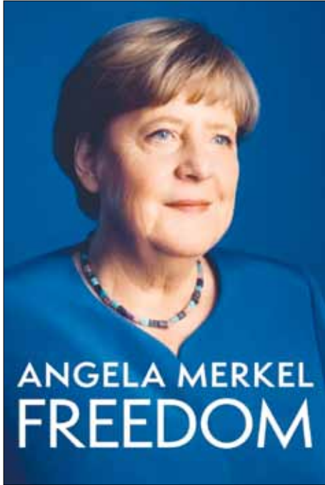
Bìa cuốn hồi ký Freedom (Tự do) của cựu thủ tướng Đức Angela Merkel.

Bà Angela Merkel được nhìn nhận như là một biểu tượng đặc biệt của nền chính trị hiện đại. Là nữ thủ tướng đầu tiên và duy nhất trong lịch sử nước Đức cho đến nay (giai đoạn 2005-2021), bà đã đối mặt với vô số thách thức chưa từng có trong lịch sử của nền kinh tế đầu tàu châu Âu. Từ cuộc khủng hoảng tài chính toàn cầu, khủng hoảng nợ công châu Âu, cuộc khủng hoảng người tị nạn năm 2015, cho đến đại dịch Covid-19. Cuốn hồi ký Freedom ra mắt vào cuối năm 2024 khắc họa những nỗ lực