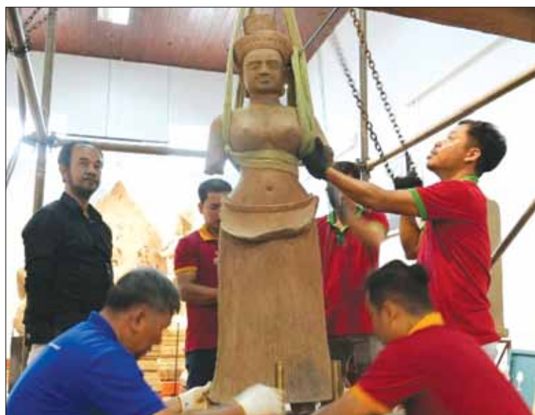
Các nhân viên bảo tàng đang chuẩn bị nhận hiện vật được Hoa Kỳ trả về Campuchia.

C ác tác phẩm được thu hồi bao gồm các cổ vật vốn được trưng bày tại Bảo tàng Nghệ thuật Metropolitan, New York. Trong số đó có một tác phẩm điêu khắc bằng đá sa thạch, mô tả một vũ công thiên