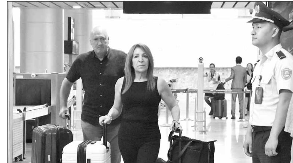
Xúc tiến tại các thị trường trọng điểm, mở rộng các đường bay là cách hiệu quả để thu hút khách đến. TRONG ANH: Du khách quốc tế đến Đà Nẵng qua Sân bay quốc tế Đà Nẵng.

(tỷ lệ 6,44%), Ấn Độ (tỷ lệ 4,7%), Mỹ (tỷ lệ 4,2%), Nhật Bản (tỷ lệ 4,0%), Malaysia (tỷ lệ 2,8%), Australia (tỷ lệ 2,4%). Điều này cho thấy xu hướng dịch chuyển của một số thị trường khách truyền thống sang các điểm đến mới. Do đó, ngành du lịch xây dựng kế hoạch xúc tiến, quảng bá cho từng thị trường trong năm tới. Trong đó, thị trường nội địa tập trung thu hút khách tại các tỉnh miền Trung - Tây Nguyên, các địa phương có đường bay trực tiếp đến Đà Nẵng, trọng tâm là Hà Nội, Hải Phòng, Thành phố Hồ Chí Minh, Cần Thơ, Buôn Ma Thuột và các địa phương lân cận. Ngành cũng hướng đến thu hút phân khúc khách gia đình, khách trẻ, khách có khả năng chi trả cao; tập trung quảng bá, giới thiệu du lịch ẩm thực, sự kiện, âm nhạc, lễ hội, du lịch sinh thái, giải trí... Khách quốc tế thì tùy vào thị hiếu từng thị trường cụ thể để có định hướng quảng bá như với khách Hàn Quốc tập trung khai thác khách gia đình, khách lẻ, khách quay lại tại các địa phương có đường bay trực tiếp (Seoul, Busan, Daegu), mở rộng xúc tiến tại các địa phương mới của Hàn Quốc (Cheongju, Jeonbuk); khách Đài Loan (Trung Quốc) tập trung khai thác khách MICE của các đoàn thể, công ty tại Đài Bắc, mở rộng quảng bá tại các thành phố Cao Hùng, Đài Trung...; khách Trung Quốc tổ chức đón các đoàn famtrip Trung Quốc, hỗ trợ các đơn vị tổ chức các chuyến bay thuê chuyến khai thác khách, tạo tiền đề khôi phục các đường bay thường lệ.