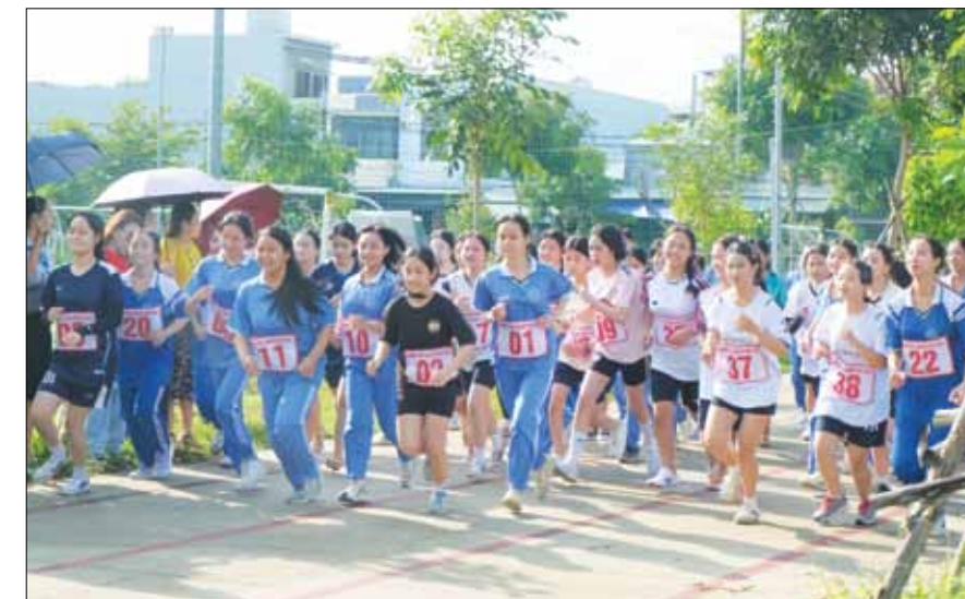
Học sinh hào hứng tranh tài tại giải việt dã do Trường THPT Nguyễn Văn Thoại tổ chức.

Các đơn vị, địa phương cùng trường học trên địa bàn thành phố tổ chức nhiều giải thể thao trong năm học mới với đa dạng các nội dung thi đấu, tạo không khí thi đua sôi nổi, hấp dẫn. Thông qua các giải đấu ở cơ sở, các vận động viên xuất sắc được chọn tranh tài giải cấp thành phố, góp phần nâng cao chất lượng các giải đấu, thúc đẩy sự phát triển của phong trào thể dục - thể thao trong học sinh.