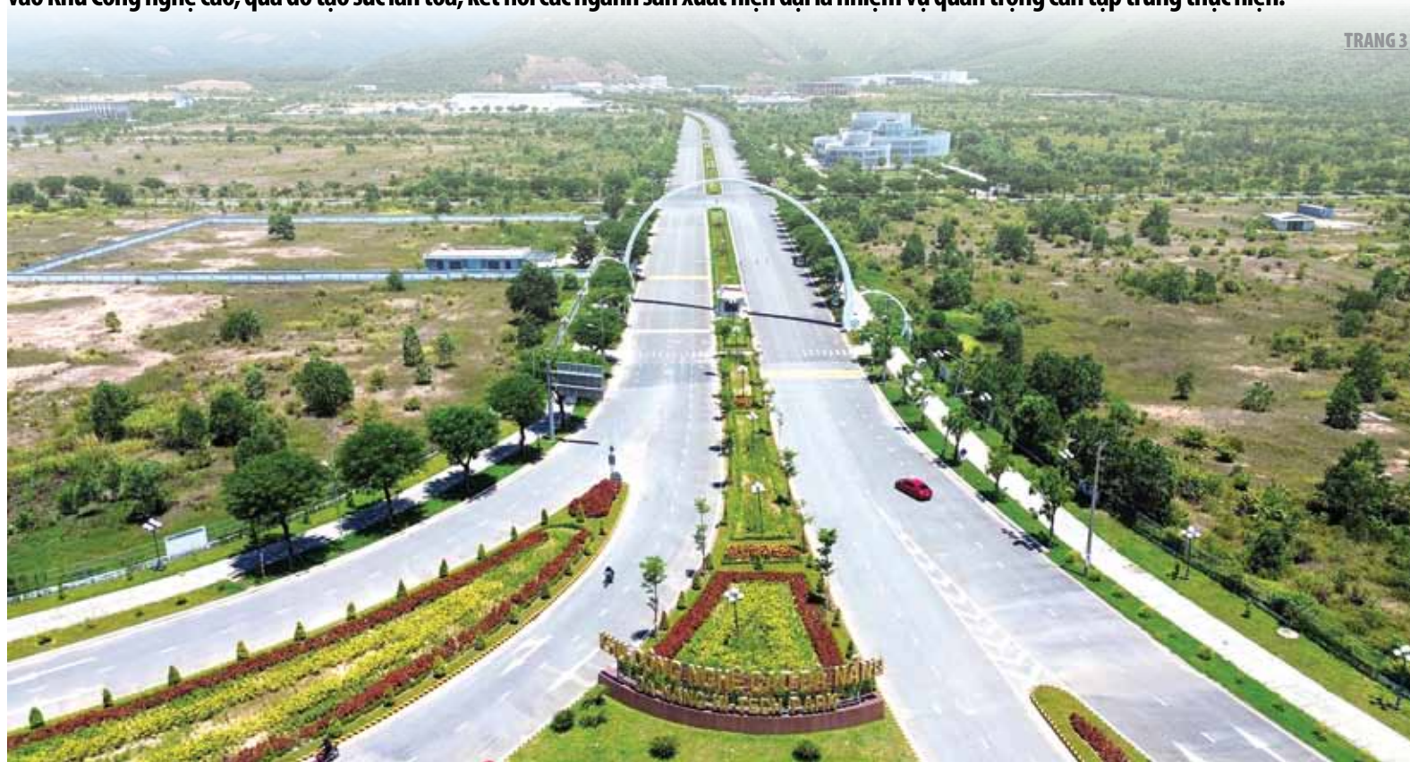
Triển khai các giải pháp thu hút nhà đầu tư vào Khu Công nghệ cao là nhiệm vụ quan trọng được các sở, ban, ngành tập trung thực hiện.

Là 1 trong 3 khu công nghệ cao của cả nước và duy nhất tại miền Trung, Khu Công nghệ cao Đà Nẵng (xã Hòa Liên, huyện Hòa Vang) được xác định là hạ tầng quan trọng để góp phần định vị Đà Nẵng thành trung tâm công nghệ cao. Vì vậy, việc triển khai các giải pháp thu hút các nhà đầu tư vào Khu Công nghệ cao, qua đó tạo sức lan tỏa, kết nối các ngành sản xuất hiện đại là nhiệm vụ quan trọng cần tập trung thực hiện.