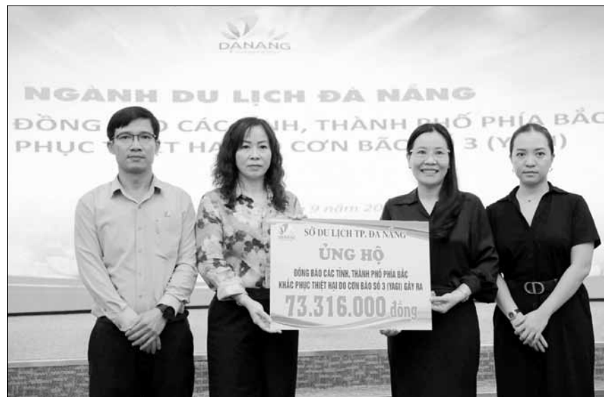
Thực hiện các nhiệm vụ trọng tâm, trong năm nhiều hoạt động tương thân, tương ái đã được Đảng bộ sở triển khai. TRONG ANH: Đại diện lãnh đạo sở trao sổ tiên ủng hộ cho đồng bào miền Bắc bị thiệt hại do cơn bão Yagi hồi tháng 9.

Đảng ủy sở đã chỉ đạo tổ chức đợt sinh hoạt chính trị sâu rộng học tập, quán triệt, tuyên truyền và triển khai thực hiện Chỉ thị số 34-CT/TU ngày 27-10-2024 của Ban Thường vụ Thành ủy về tiếp tục đẩy mạnh cải cách hành chính, tăng cường kỷ luật, kỷ cương, khắc phục tình trạng né tránh, đùn đẩy, không làm đúng, đầy đủ chức trách, nhiệm vụ, quyền hạn