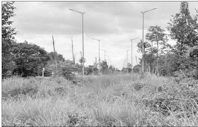
Cây xanh chết khô, nghiêng ngã trên tuyến đường Hòa Phước - Hòa Khương.

Qua đường dây nóng Báo Đà Nẵng, bạn đọc phản ánh hàng trăm cây xanh trên tuyến đường Hòa Phước - Hòa Khương (huyện Hòa Vang) bị chết, mất ngon, nghiêng ngã, cây cỏ mọc um tùm ngay giữa con lươn khiến tuyến đường trở nên nhếch nhác, mất mỹ quan đô thị. Không chỉ vậy, nơi đây còn trở thành nơi chôn chôn thối rữa.