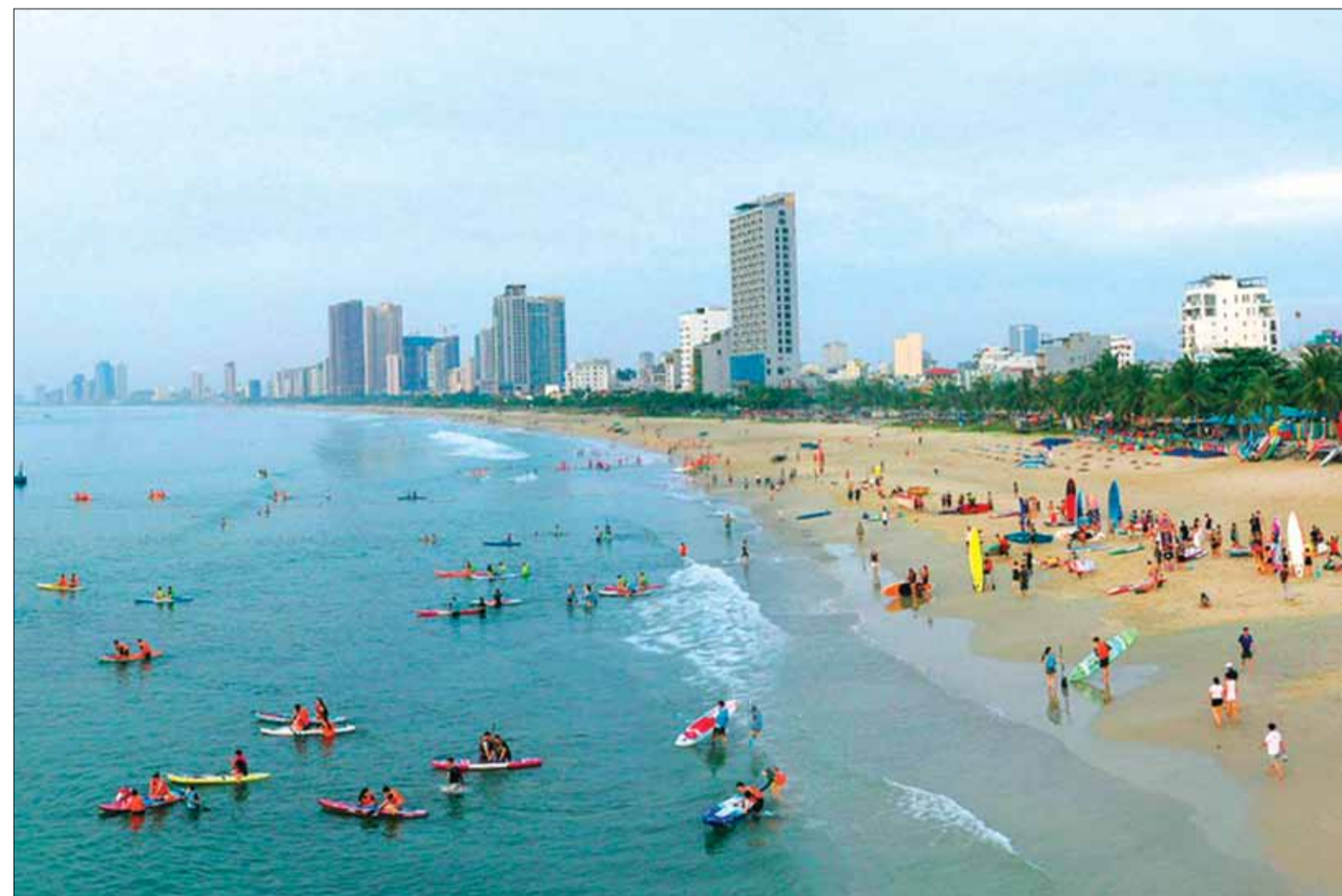
Du lịch biển luôn là sản phẩm chủ lực, thu hút khách du lịch đến với thành phố.