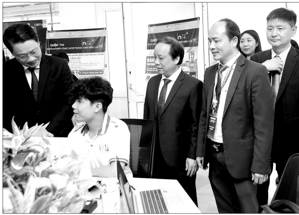
Lãnh đạo thành phố và Đại học Đà Nẵng thăm sinh viên đang học tập tại VKU Fintech Hub.