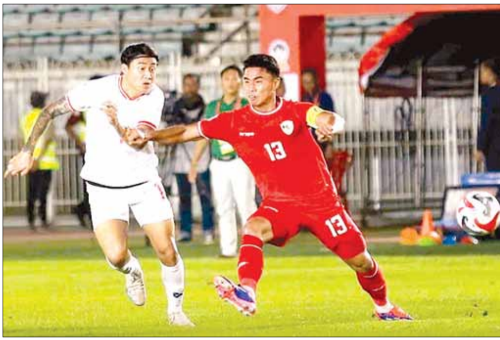
Indonesia (áo đỏ) có cơ hội giành ngôi đầu bảng xếp hạng của đội tuyển Việt Nam nếu có kết quả tốt trước Lào ở lượt trận thứ 2 bảng B.

Hôm nay (12-12), ASEAN Cup 2024 tiếp tục diễn ra với 2 trận đấu hứa hẹn hấp dẫn, kịch tính trong khuôn khổ lượt trận thứ 2 bảng B: Philippines - Myanmar (17 giờ 30), Indonesia - Lào (20 giờ). Trong khi đội tuyển Việt Nam không thi đấu, các đối thủ quyết tâm giành chiến thắng để giành ngôi đầu bảng xếp hạng của thầy trò HLV Kim Sang-sik.