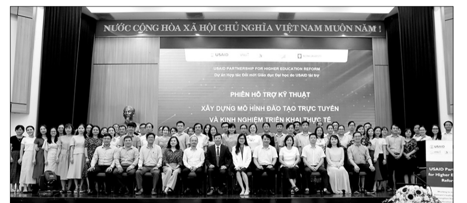
Đại học Đà Nẵng là 1 trong 3 đại học hàng đầu Việt Nam được Chính phủ đầu tư cho tham gia dự án Hợp tác đổi mới giáo dục đại học (PHER), qua đó nâng cao chất lượng đào tạo và đội ngũ.

Bên cạnh đó, xu thế gắn kết đào tạo và thực tiễn đáp ứng nhu cầu sử dụng trên thị trường lao động ngày càng cạnh tranh cao, Đại học Đà Nẵng khuyến khích, tạo cơ chế để thu hút, có thêm nguồn giảng viên, chuyên gia đến từ các doanh nghiệp, bệnh viện. Điển hình như Trường Y Dược thông qua mối quan hệ hợp tác viện - trường thường xuyên bổ nhiệm, phát huy đội ngũ y bác sĩ từ các bệnh viện