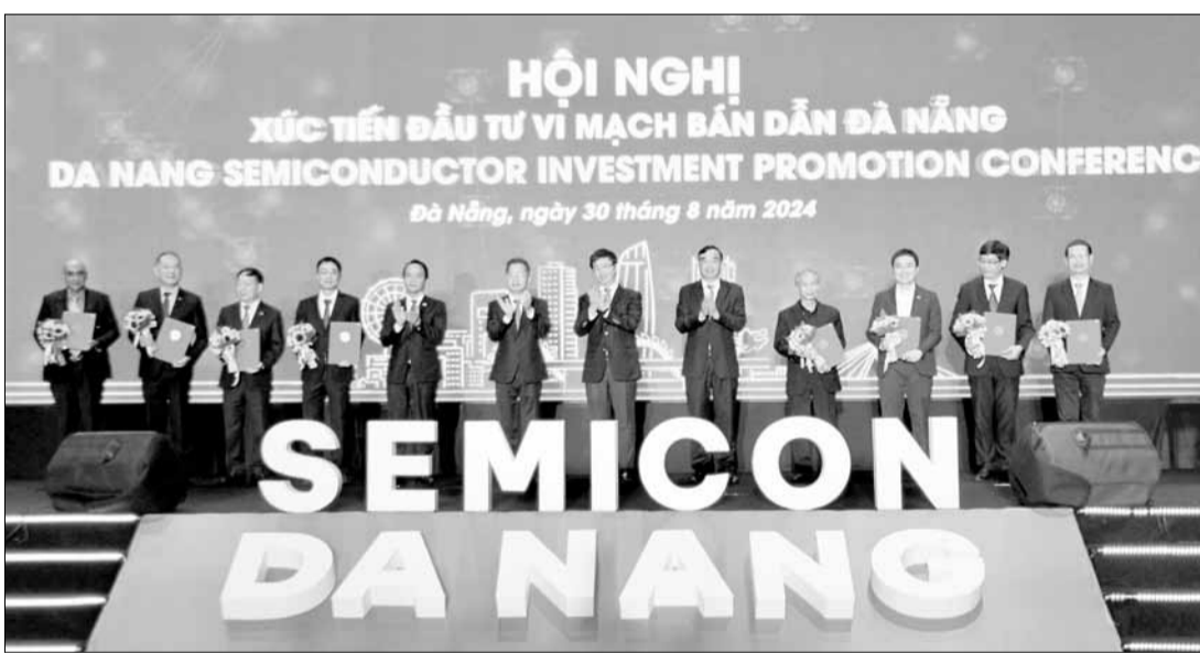
Thành phố Đà Nẵng tổ chức hội nghị xúc tiến đầu tư vào lĩnh vực vi mạch bán dẫn.

Xác định phát triển nhân lực bền vững trên cơ sở liên kết "3 nhà": nhà nước - nhà trường - nhà doanh nghiệp, thành phố phối hợp với Viện Công