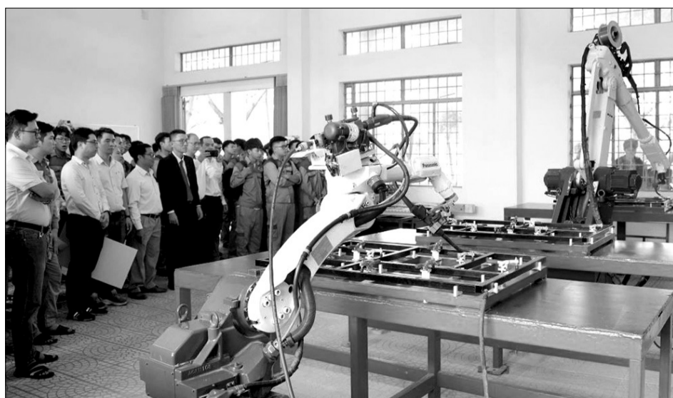
Trường Đại học Bách khoa hợp tác Công ty Cổ phần Tập đoàn Trường Hải hỗ trợ robot hàn tự động để sinh viên thực hành.