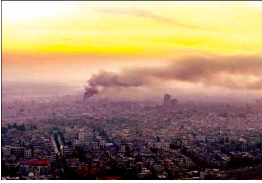
Khói bốc lên sau cuộc không kích của Israel tại Damascus ngày 10-12.

Được sự hỗ trợ của các nhóm đối lập, ông al-Bashir đã tiến hành cuộc họp nội các đầu tiên với sự tham gia của chính quyền lâm thời và các cơ quan từ chính phủ dưới thời ông al-Assad. Điều này phản ánh tín hiệu lạc quan trong quá