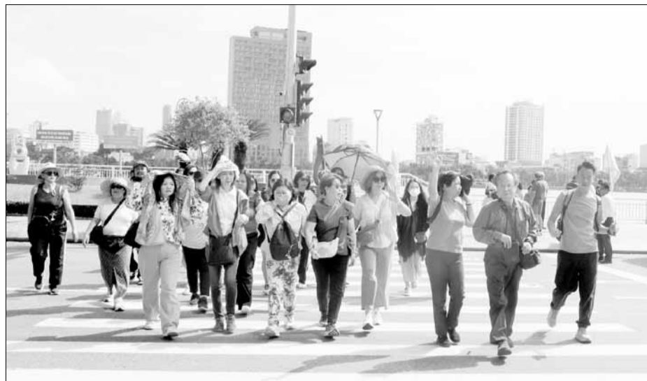
Khách du lịch đến Đà Nẵng tăng vượt bậc trong năm 2024.

Năm 2024 có 23 đường bay đến Đà Nẵng (7 đường bay nội địa và 16 đường bay quốc tế thường kỳ), tần suất trung bình 111 chuyến bay/ngày đến Đà Nẵng, trong đó 52 chuyến quốc tế, 59 chuyến nội địa. Ước cả năm có khoảng hơn 40.000 chuyến bay đến Đà Nẵng, hơn 4 triệu lượt khách, tăng 19.000 chuyến bay, nội địa ước đạt hơn 21.000 chuyến bay (tăng 1,1% so với năm 2023 và phục hồi 81,8% so với năm 2019). Lượt khách đến bằng đường hàng không trong năm 2024 ước đạt hơn 6,5 triệu lượt, tăng 5,4% so với năm 2023 và phục hồi 84,3% so với năm 2019. Năm 2024, thành phố mở lại các đường bay nội địa (Buôn Ma Thuột, Phú Quốc), đường bay quốc tế (Viêng Chăn - Lào, Ahmedabad - Ấn Độ);