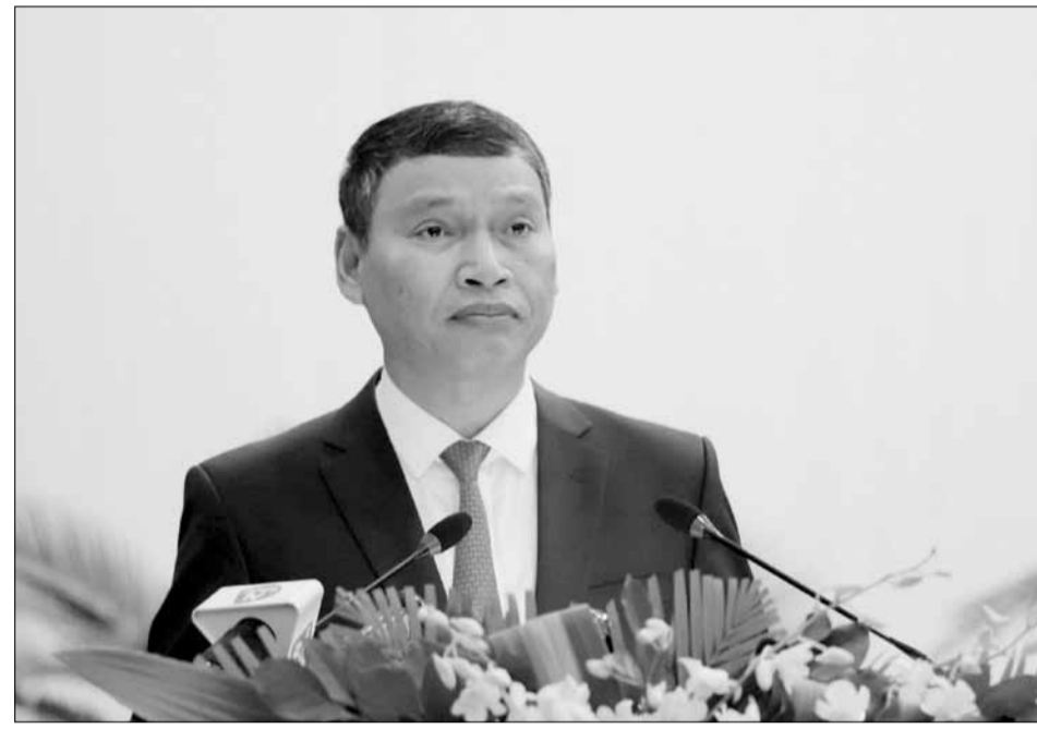
Phó Chủ tịch Thường trực UBND thành phố Hồ Kỳ Minh báo cáo tình hình kinh tế - xã hội, quốc phòng - an ninh năm 2024 và phương hướng, nhiệm vụ năm 2025.

Thành phố tiếp tục phát triển lĩnh vực dịch vụ, du lịch, nghiên cứu điều chỉnh Đề án định hướng phát triển du lịch thành phố Đà Nẵng đến năm 2030, tầm nhìn đến năm 2045; tiếp tục đẩy mạnh phát triển công nghiệp, hoàn thành lựa chọn nhà đầu tư kinh doanh kết cấu hạ tầng. Thành phố tiếp tục cải thiện môi trường đầu tư, kinh doanh, tăng cường thu hút đầu tư trong và ngoài nước. Đồng thời, thực hiện tốt công tác quản lý đầu tư - xây dựng cơ bản, tập trung đơn đốc, đẩy nhanh tiến độ, phấn đấu hoàn thành, khởi công các dự án, công trình chào mừng các ngày lễ lớn trong năm 2025; thực hiện tốt công tác quản lý quy hoạch, đô thị, triển khai thực hiện Quy hoạch thành phố Đà Nẵng giai đoạn 2021-2030, tầm nhìn đến năm 2050; thẩm định, trình phê duyệt các quy hoạch phân khu xây dựng khu chức năng, quy hoạch chuyên ngành hạ tầng kỹ thuật còn lại. Năm 2025, thành phố tiếp tục giải quyết và phát triển các lĩnh vực văn hóa - xã hội; tăng cường các