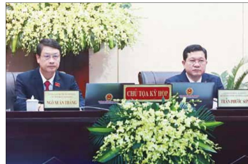
Chủ tịch HĐND thành phố Ngô Xuân Thắng, Phó Chủ tịch Thường trực HĐND thành phố Trần Phước Sơn đồng chủ tọa kỳ họp.

phố tiếp tục đạt nhiều kết quả trên các mặt công tác, tăng trưởng kinh tế; khởi công, khánh thành, đưa vào sử dụng nhiều dự án, công trình quan trọng; các chương trình an sinh xã hội được duy trì thực hiện với nhiều