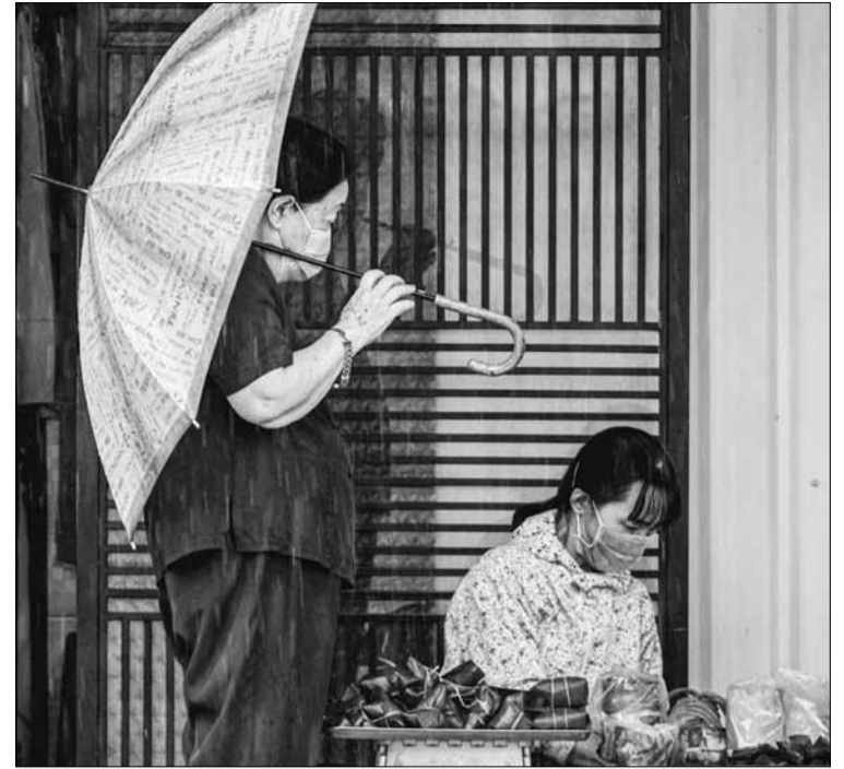
Mùa đông khiến người ta nhớ đến những món bánh bình dị của bà, của mẹ.

Những mùa đông trôi qua, ông Sinh nhận ra những giá trị gắn kết trong gia đình. Ông nhớ tiếng mẹ