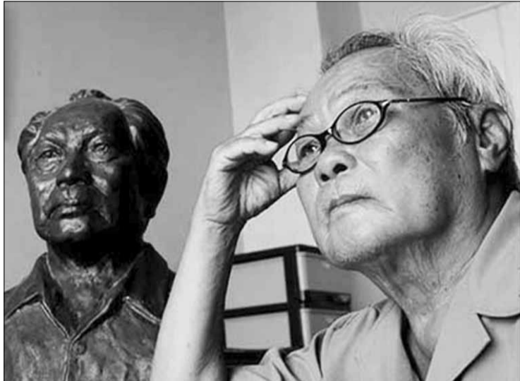
Nhà văn Nguyễn Quang Sáng (1932-2014).