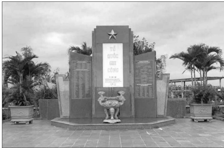
Nhà bia ghi danh các anh hùng liệt sĩ bên di tích Đò Khách.

Ông Đò Khách là hậu duệ đời thứ 13 thuộc phái nhì, chi