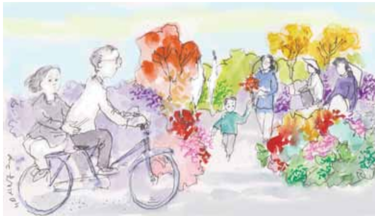
Minh họa: HOÀNG ĐẶNG

Tháng Mười hai trong ký ức tôi là mùa của những bông hoa cải vàng trên triền đồi với những ngày chạy nhảy vui đùa dưới ánh mặt trời nhạt nắng. Tôi nhớ nội tôi, nhớ