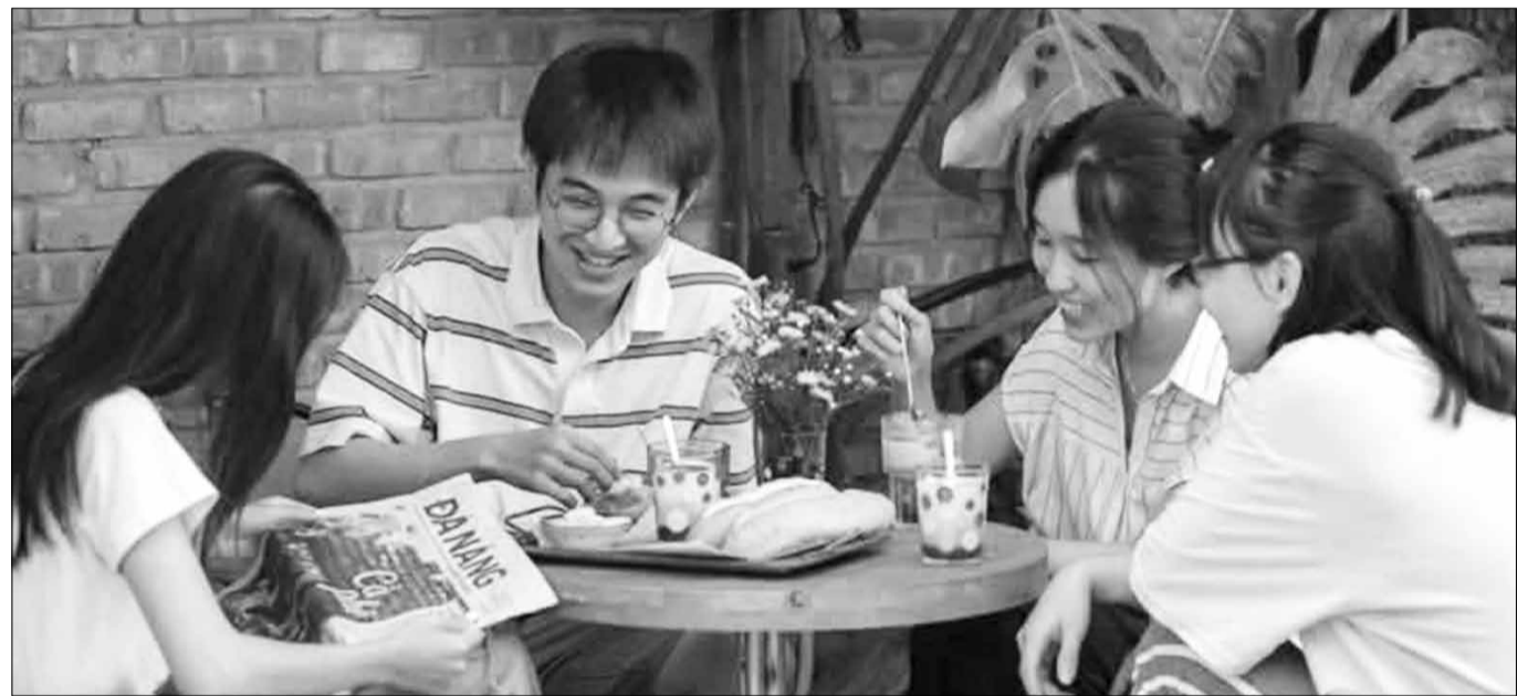
Uống cà phê mùa đông là trải nghiệm quen thuộc của người Đà Nẵng.

Người Đà Nẵng, như nhiều nơi khác ưa thích cảm giác nhâm nhi cà phê vào mỗi sáng. Trong những ngày đông se lạnh này, xuống phố, gặp gỡ bạn bè, người thân và thưởng thức ly cà phê nóng hổi là trải nghiệm đầy cảm xúc cho mọi thế hệ. Ly cà phê có thể gắn với những câu chuyện ký ức hay đôi khi chỉ là thói quen thường nhật.