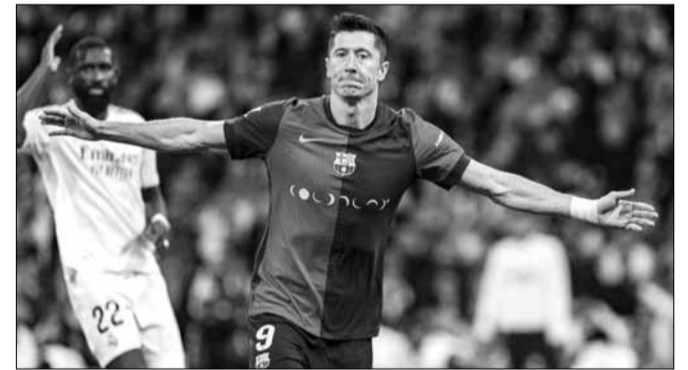
Robert Lewandowski lập cú đúp trong trận thắng Real Madrid.

Robert Lewandowski không ít lần khẳng định chưa bao giờ dám so sánh mình với Lionel Messi hay Cristiano Ronaldo. Câu nói khiêm tốn đó của tiền đạo Ba Lan lại trở thành cái cớ để nhiều người mỉa mai anh lúc phong độ sa sút ở mùa giải vừa qua. Ở tuổi 35, Lewy chỉ có 19 bàn cho Barcelona mùa giải La Liga 2023-2024 là lần đầu tiên kể từ mùa giải 2015-2016 ghi ít hơn 20 bàn/mùa. Họ cho rằng ở tuổi này, Messi biết gác lại những vinh hoa ở trời Âu để sang Mỹ chơi cho Inter Miami. Cũng tầm độ tuổi này, Ronaldo chọn cách qua Saudi Arabia chơi cho Al Nassr sau khi đạt thỏa thuận chấm dứt hợp đồng trước thời hạn với Manchester United do sa sút phong độ. Nhiều người còn đồn đoán chuyện Barcelona sau khi sa thải HLV Xavi Hernandez cũng sẽ tìm cách bán Lewandowski.