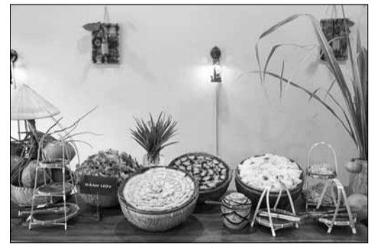
Không gian dành cho món bánh ước tại Mạ - Bánh quê.

Không gian quán mộc mạc với bàn ghế gỗ, mâm tre lót lá chuối xanh cùng ánh sáng ấm áp từ những chiếc đèn lồng tre, nơi từng món ăn được chế biến kỹ lưỡng và trình bày đẹp mắt khiến thực khách không khỏi thích thú khi lựa chọn. Bữa tiệc bánh quê tại đây mang lại cảm giác gần gũi với khá nhiều món bánh truyền thống như bánh bèo, bánh lọc dẻo mịn hay ram ít giòn tan, tạo nên hương vị hài hòa quen thuộc. Bạn sẽ thấy thú vị với đĩa bánh lọc trong veo lấp ló nhân tôm đỏ au, những bánh bèo nhỏ xinh nằm gọn trong chén được phủ một lớp ruốc tôm và hành phi thơm lừng. Trong khi đó, ram ít là món ăn kết hợp giữa sự giòn tan của lớp ram bên ngoài và dẻo mềm của bột nếp bên trong. Tại đây, mỗi món bánh quê như kể lại câu chuyện riêng gắn với ký ức tuổi thơ của nhiều người, nhiều thế hệ.