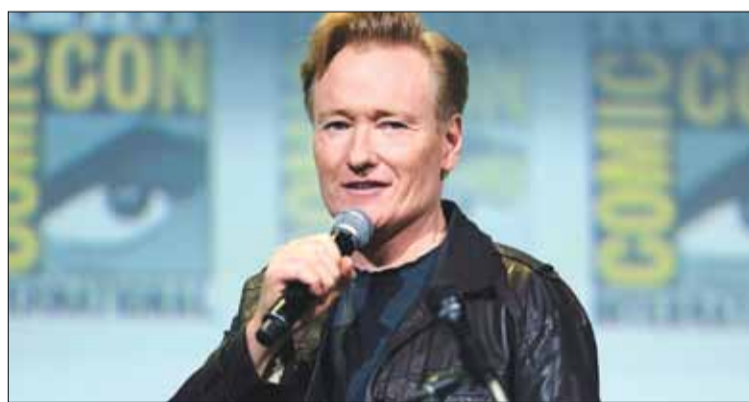
Với tài năng và kinh nghiệm của Conan O'Brien, lễ trao giải Oscar lần thứ 97 hứa hẹn sẽ mang đến cho khán giả một đêm đáng nhớ.