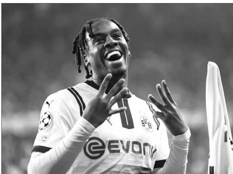
Jamie Gittens ra đấu đã có 9 bàn thắng cho Borussia Dortmund.