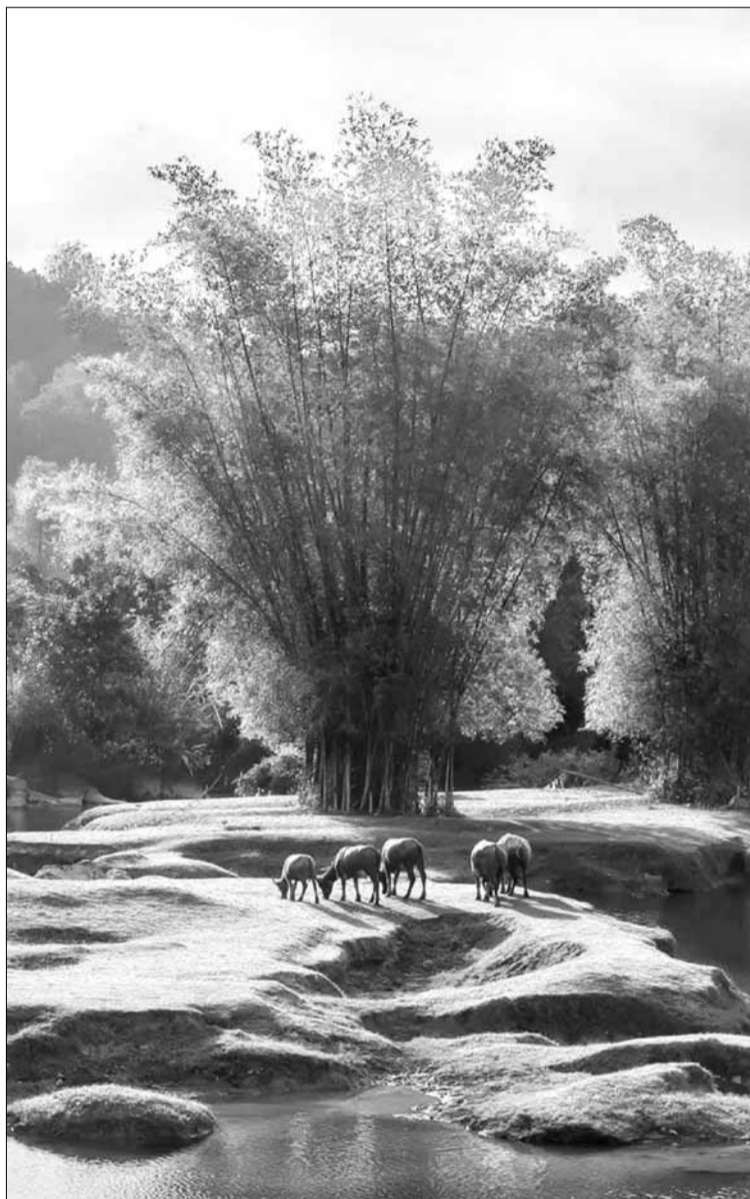
Y thức về mùa vụ thường không rõ bằng cảm nhận về thời tiết, mưa nắng, dầu ai cũng biết rằng mùa xuân hoa nở, mùa hè oi nóng, mùa thu mây thắm ngang trời, còn mùa đông thì ẩm ướt và giá lạnh.

Nhà có ba anh chị em. Anh cả lớn hơn tôi tám tuổi và chị hơn tôi bốn, các anh chị đi làm xa tận ngoài Hàn (Đà Nẵng), còn tôi một mình ở nhà, lấu lấu cả nhà sum họp. Tôi nhớ, lúc trời chạng vạng trước khi ăn cơm tối chị hay bắt tôi đứng trên một tảng đá tảng, vốn là con đội cột nhà hồi trước, chị múc nước và kỳ các kê chân dính bùn của tôi.