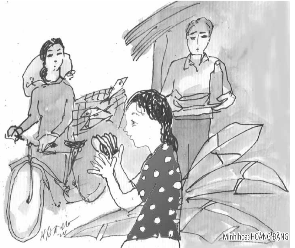
Minh họa: HOÀNG ĐĂNG

- Anh chủ bảo đi từ mừng bốn Tết. Chuyển ra khơi đầu năm thường rất bội thu, cứ thả lưới ở đâu là dính cá ở đó. Mẹ nhớ năm ngoái không, tàu đi được gần 40 hải lý thì trúng đậm mẻ cá bẹ và cá sòng hơn năm tấn, bán gần nửa tỷ đồng. Năm nay cầu