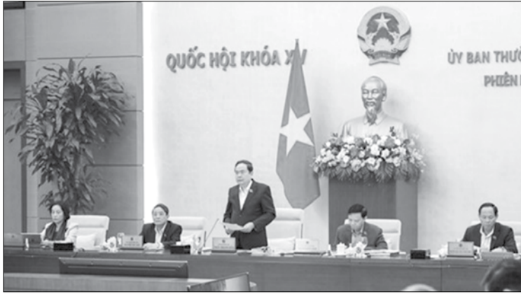
Chủ tịch Quốc hội Trần Thanh Mẫn phát biểu khai mạc phiên họp.

Ngày 1-12, tại hội nghị toàn quốc quán triệt, triển khai tổng kết việc thực hiện Nghị quyết số 18-NQ/TW của Ban Chấp hành Trung ương Đảng (khóa XII) một số vấn đề về tiếp tục đổi mới, sắp xếp tổ chức bộ máy của hệ thống chính trị tinh gọn, hoạt động hiệu lực, hiệu quả