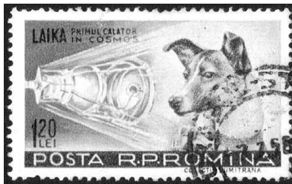
Chó Laika trên một con tem của Tiểu vương quốc Ajman, nay thuộc UAE.

Cuối năm 1951, chú chó tên Bobik cũng "bỏ trốn" trước giờ bay và không quay lại. Những người lên kế hoạch chuyến bay đã "nhặt" được một con chó đang lang thang gần một