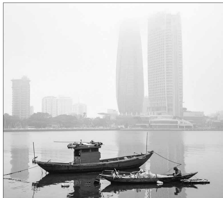
Năm Thìn mà lại mưa thuận gió hòa là hiếm thấy. Mùa đông năm nay đã ấm dần.

tình đói khổ, những cô chú tuổi thiếu niên hằng ngày phải gánh đôi trật ra đồng lượm phân trâu về đổi gạo để có cái ăn cho những người già. Những người phụ nữ thì ru rú trong nhà, ngồi xe chỉ và dệt vải bằng những khung cửi thủ công vừa sửa lại sau ngày hồi cư rồi gánh đi bán lén để mua thức ăn và thuốc chữa bệnh cho người ốm đau. Gia đình tôi, sau ba cái tang của ông cố nội, cố ngoại và bà nội tôi, cha tôi phải gánh đôi bầu giả đi buôn, lánh xuống phố Hội đi ở đợ để vừa trốn lính vừa kiếm tiền cho gia đình... Thời điểm đó, dân