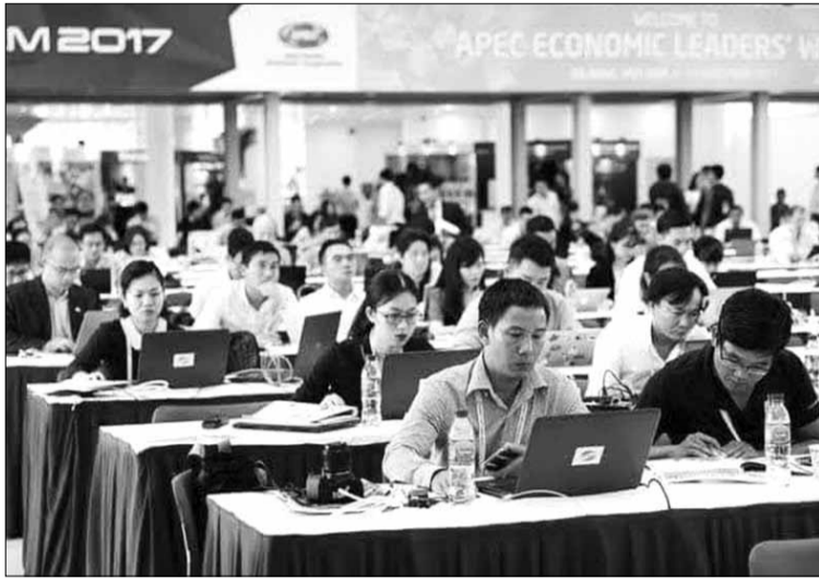
Phóng viên Báo Đà Nẵng tác nghiệp tại Trung tâm Báo chí Quốc tế, phục vụ Tuần lễ Cấp cao APEC 2017.

Tháng 11-2024, Diễn đàn Hợp tác kinh tế châu Á - Thái Bình Dương (APEC) lần thứ 35 diễn ra tại Peru. Trong lịch sử 35 lần tổ chức hội nghị APEC, Việt Nam đăng cai hai lần vào năm 2006 tại Thủ đô Hà Nội (lần thứ 14) và năm 2017 tại thành phố Đà Nẵng (lần thứ 25).