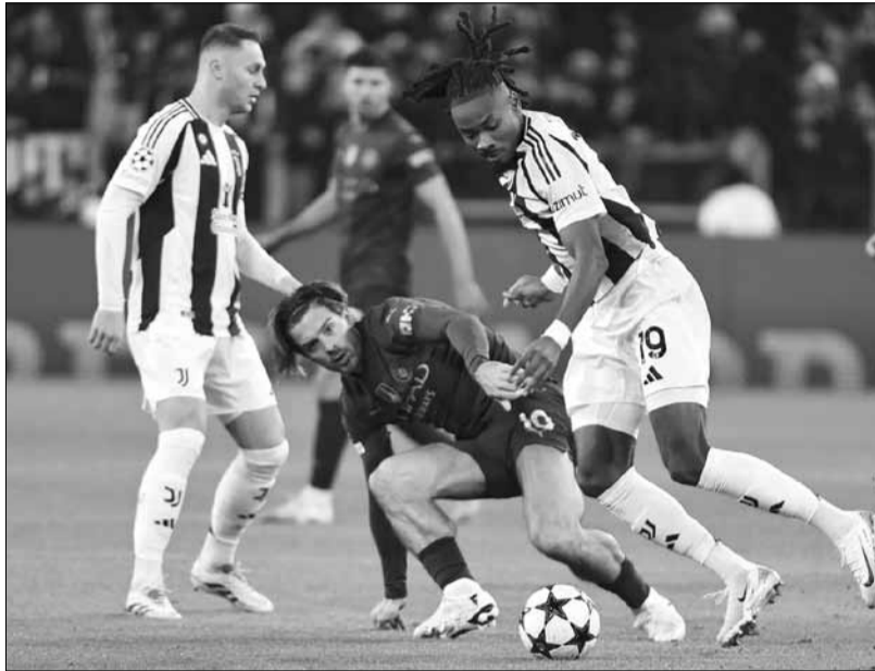
Man City lại gục ngã.

Trong giọng bình có phần đặc thắng, Carragher nhấn mạnh rằng hiện nhà cầm quân được biết đến như một trong những nhân vật thành công nhất của sân cỏ đương đại đang đối diện với một cảnh huống mà ông chưa hề gặp hoặc nghĩ tới trong sự nghiệp, nhất là sau lúc ký vào bản hợp đồng tiếp tục ở lại Etihad. 10 trận gần nhất trên mọi đấu trường, Manchester City thua đến 7 trận, chỉ duy nhất một chiến thắng 3-0 trước Nottingham Forest ở Giải ngoại hạng Anh. Có đến 8 trận đội bóng nhà bị thủng lưới trên sân đối phương, chuỗi dài nhất mà đời làm huấn luyện viên của mình, Pep chưa hề gánh chịu trước đó. “Là người thành công, không chỉ khi đến với đất Anh mà ở nhiều sân cỏ các nước khác,