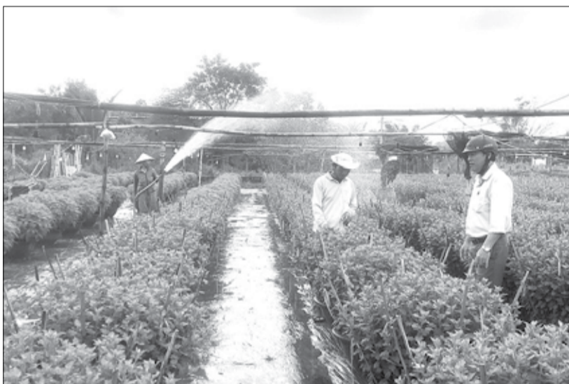
Sản xuất vụ hoa Tết 2025 tại vùng hoa Nhơn Thọ.

Nghề làm mây tre đan được người dân thôn Tân Hạnh (xã Hòa Phước) giữ gìn, phát triển trong nhiều năm qua, mang lại thu nhập ổn định và giải quyết việc làm cho nhiều người tại địa phương. Những sản phẩm được người dân sản xuất như thang, bàn ghế, giường được tiêu thụ trên địa bàn thành phố và thị xã Điện Bàn (tỉnh Quảng Nam). Theo ông Trần Toàn, Trưởng thôn Tân Hạnh, trước đây, các hộ làm mây tre đan trên địa bàn khá đông nhưng thiếu sự liên kết, sản phẩm đầu ra nhỏ lẻ, không có người đứng ra bao tiêu nên hiệu quả kinh tế chưa cao. Ngoài ra, một số hộ muốn mở rộng quy mô sản xuất nhưng thiếu vốn. Trước thực