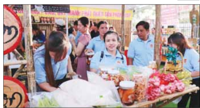
Hội viên Hội Nông dân quận Cẩm Lệ hưởng ứng tham gia Phiên chợ nông sản và sản phẩm OCOP.