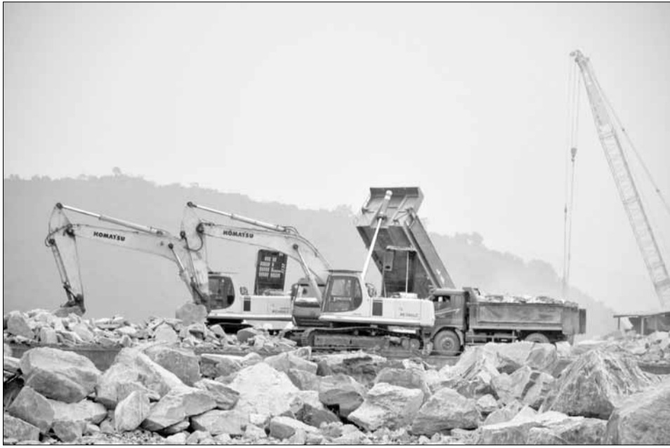
Thi công tại dự án Bến cảng Liên Chiểu (phần cơ sở hạ tầng dùng chung).

Chỉ còn hơn 1 tháng nữa để hoàn thành kế hoạch giải ngân vốn đầu tư công năm 2024 trong khi áp lực về khối lượng công việc và kế hoạch vốn phải giải ngân lớn, vì vậy, đây là thời điểm để các ban quản lý, các sở, ban, ngành, địa phương "chạy nước rút" về đích.