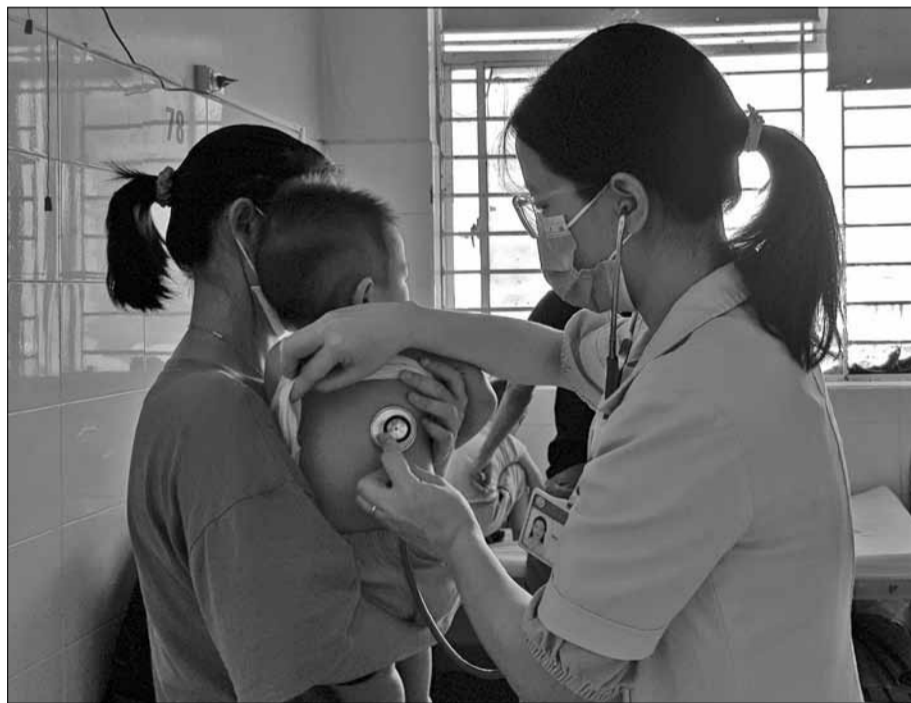
Y bác sĩ Bệnh viện Phụ sản - Nhi Đà Nẵng thăm khám, điều trị cho các bệnh nhi mắc các bệnh về hô hấp, truyền nhiễm.

Nhằm tăng tỷ lệ bao phủ các vắc-xin trong chương trình tiêm chủng mở rộng và chủ động phòng ngừa các bệnh truyền nhiễm, ngành y tế thành phố triển khai hoạt động kiểm tra tiến sử và tiêm chủng bù liều vắc-xin cho trẻ nhập học tại các cơ sở giáo dục mầm non, tiểu học.