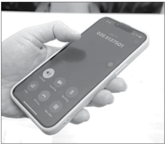
Một cuộc gọi giả danh nhân viên Điện lực Liên Chiểu để ngỏ khách hàng kết bạn qua Zalo để gửi thông tin thanh toán tiền điện.

Hàng trăm triệu đồng trong tài khoản ngân hàng của khách hàng tại miền Trung - Tây Nguyên đã bị mất sạch chỉ vì làm theo hướng dẫn của kẻ giả danh nhân viên điện lực. Chỉ trong nửa tháng qua, đã có 4 trường hợp bị lừa đảo, trong đó có 3 trường hợp bị mất gần 600 triệu đồng.