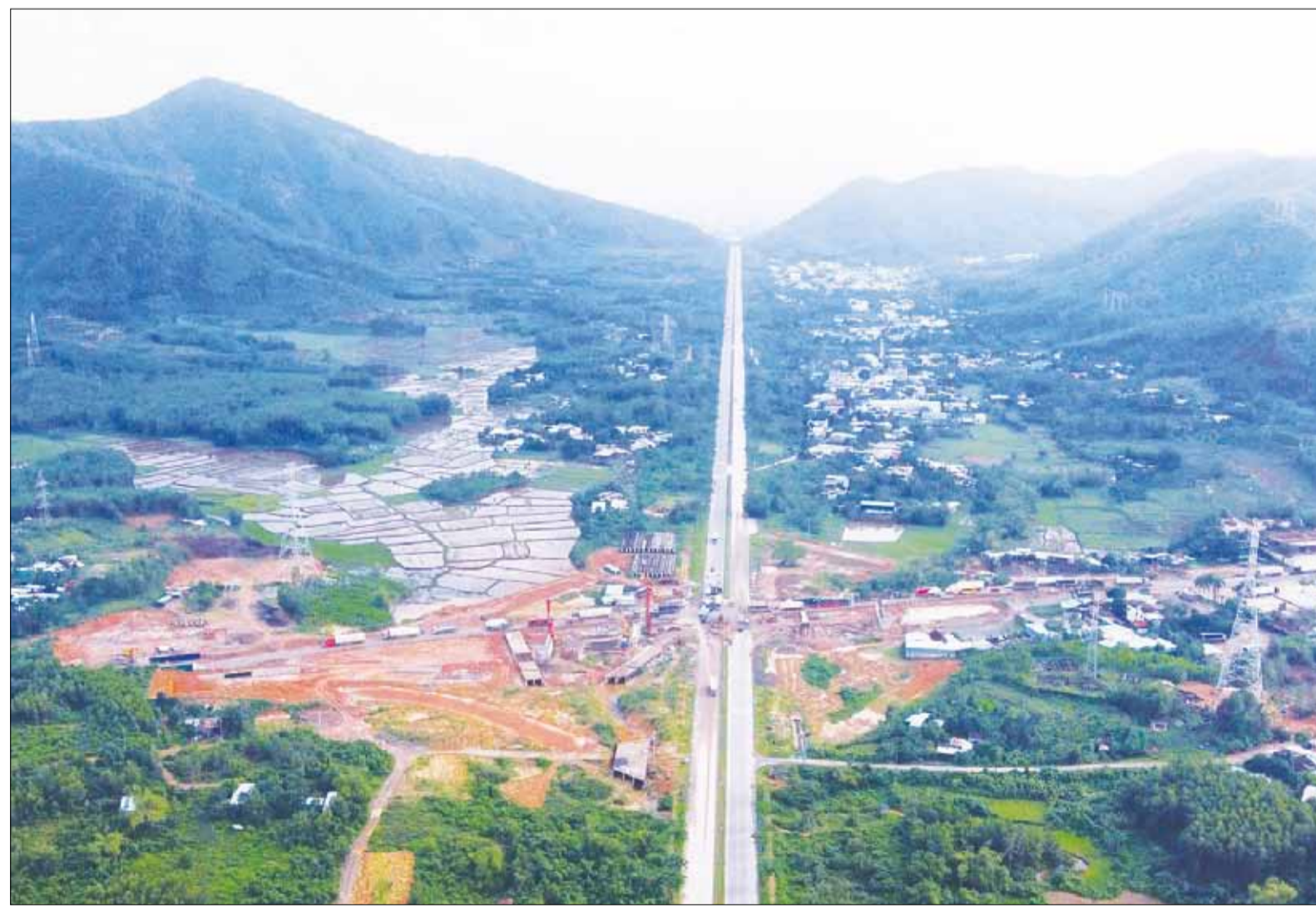
Tuyến cao tốc Hòa Liên - Túy Loan tại nút giao với đường Hoàng Văn Thái đang được thi công.