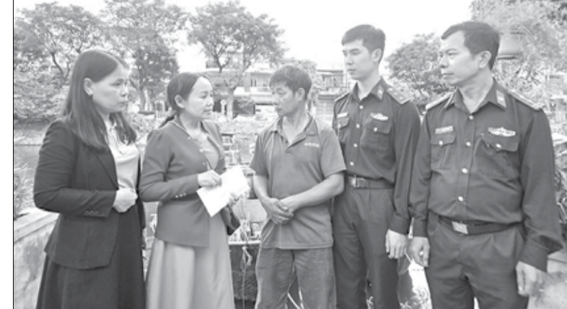
Đại diện Hội Nông dân phường Thanh Khê Tây (quận Thanh Khê) và Đồn Biên phòng Phú Lộc thăm hỏi, trao hỗ trợ cho ngư dân gặp khó khăn.

Cụ thể hóa Nghị quyết số 46-NQ/TW của Bộ Chính trị về đổi mới, nâng cao chất lượng hoạt động của Hội Nông dân Việt Nam, đáp ứng yêu cầu nhiệm vụ cách mạng trong giai đoạn mới, Hội Nông dân phường Thanh Khê Tây (quận Thanh Khê) hướng mạnh về cơ sở, hỗ trợ kịp thời, tạo niềm tin, điểm tựa vững chắc cho hội viên.