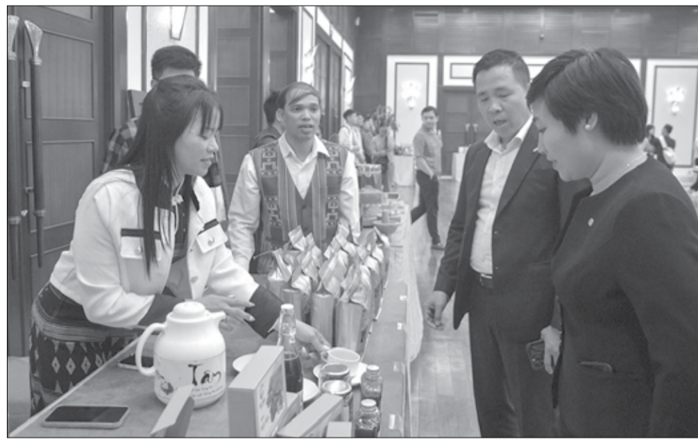
Sản phẩm trà dây được trưng bày và giới thiệu tại chương trình tọa đàm "Văn hóa trà Việt".

Ở nước ta, từ lâu trà đã có mặt trong đời sống hàng ngày và các nghi lễ quan trọng, đặc biệt là không thể thiếu trong những cuộc gặp gỡ bạn bè và các dịp lễ hội.