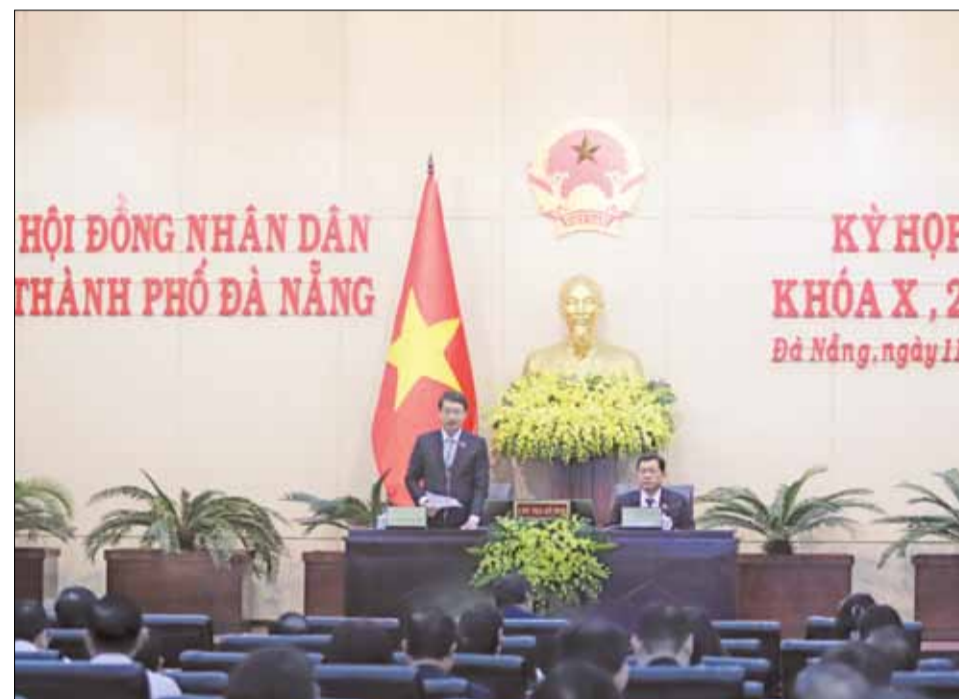
Quang cảnh kỳ họp.