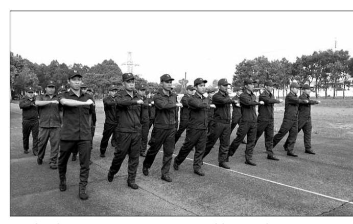
Cán bộ chiến sĩ Trường Quân sự Quân khu 5 tập luyện.

Một trong các hoạt động trọng tâm đó là quán triệt, triển khai thực hiện nghiêm mục tiêu, chỉ tiêu, giải pháp về đổi mới, nâng cao chất lượng giáo dục - đào tạo trong tình hình mới; tập trung triển khai hiệu quả kế hoạch giáo dục và đào tạo, tổ chức tiếp nhận, đào tạo cho hơn 5.000 học viên các đối tượng; kịp thời điều chỉnh, bổ sung, xây dựng 45 chương trình đào tạo các đối tượng phù hợp với nhiệm vụ, sát thực tế theo hướng "chuẩn hóa, hiện đại hóa". Đội ngũ giáo viên tích cực khai thác, ứng dụng phương tiện dạy học hiện đại vào quá trình giảng dạy; 100% bài giảng lý luận được biên soạn hội đủ 3 tiêu chí "Dạy học tích cực, sơ đồ tư duy và giáo án điện tử"; quá trình đào tạo gắn với truyền thống kinh nghiệm chiến đấu, kinh nghiệm trong quản lý, chỉ huy và chuyên môn kỹ thuật; tổ chức tốt các hoạt động bồi trợ, hội thảo cấp tiểu đoàn, đại đội và giáo dục khoa học xã hội và nhân văn kết hợp với giáo dục chính trị trong dạy học nhằm nâng cao chất lượng đào tạo cho các đối tượng học viên.