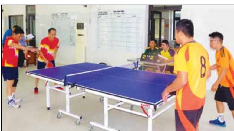
Các vận động viên tranh tài môn bóng bàn trong khuôn khổ giải thể thao do Ban Chỉ huy Quân sự quận Cẩm Lệ tổ chức.

Chào mừng kỷ niệm 80 năm ngày thành lập Quân đội nhân dân Việt Nam (22-12-1944 - 22-12-2024) và 35 năm ngày hội Quốc phòng toàn dân (22-12-1989 - 22-12-2024), các đơn vị, địa phương trên địa bàn thành phố tổ chức nhiều giải thể thao, tạo khí thế thi đua sôi nổi, góp phần hoàn thành tốt nhiệm vụ được giao.