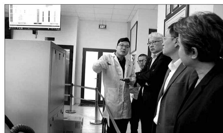
Các chuyên gia Úc cùng Trung tâm Hỗ trợ Khởi nghiệp đổi mới sáng tạo tham quan khu sản xuất chip tại Công ty CP Trung Nam EMS, Khu Công nghệ cao Đà Nẵng.