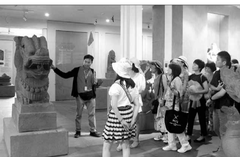
Du khách tham quan Bảo tàng Điều khắc chàm.

Văn hóa là nền tảng tinh thần, vừa là mục tiêu vừa là động lực cho sự phát triển kinh tế. Kết luận số 79-KL/TW của Bộ Chính trị về tiếp tục thực hiện Nghị quyết số 43-NQ/TW của Bộ Chính trị (khóa XII) về xây dựng và phát triển thành phố Đà Nẵng đến năm 2030, tầm nhìn đến năm 2045 nêu rõ: đầu tư phát triển văn hóa, con người đồng bộ, ngang tầm với phát triển kinh tế, đưa hình ảnh thành phố Đà Nẵng văn minh, đậm đà bản sắc dân tộc đến gần hơn với bạn bè quốc tế... Kế thừa và phát huy những giá trị văn hóa xứ Quảng, đến nay việc hình thành và xây dựng con người Đà Nẵng với bản sắc văn hóa riêng đã có những kết quả nhất định.