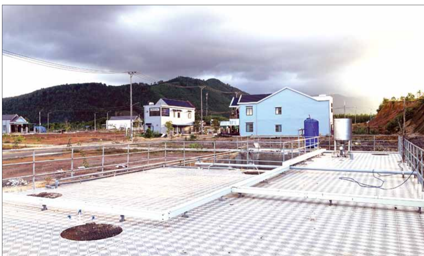
Luật Đất đai năm 2024 quy định, khu tái định cư phải hoàn thiện các điều kiện về hạ tầng kỹ thuật, hạ tầng xã hội đồng bộ.