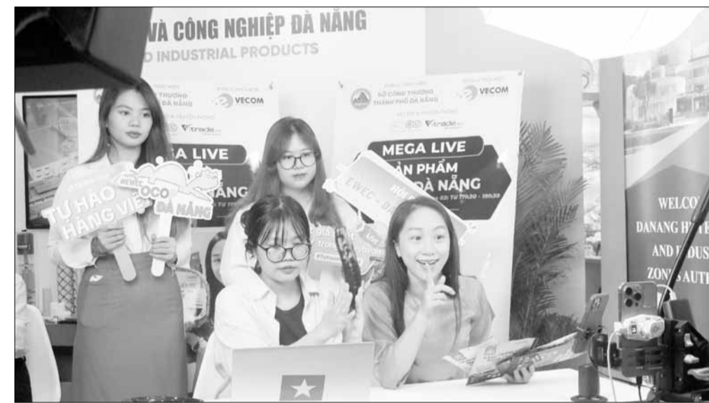
Nhiều chương trình hỗ trợ tiểu thương livestream, bán hàng trực tuyến được triển khai trên địa bàn thành phố Đà Nẵng.

Theo Phòng Kinh tế quận Liên Chiểu, từ tháng 11-2024, quận phối hợp Hiệp hội Thương mại điện tử Việt Nam, khu vực miền Trung - Tây Nguyên và các đơn vị giải pháp thương mại điện tử, chuyển đổi số triển khai kế hoạch tổ chức các