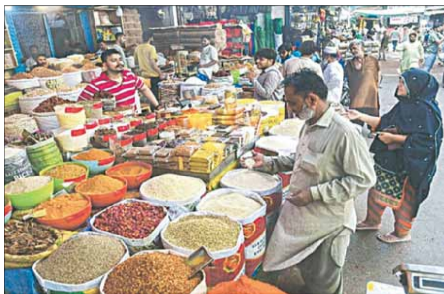
Xu hướng giảm giá hàng hóa được kỳ vọng hỗ trợ kiểm soát lạm phát toàn cầu.

Xu hướng giảm giá dầu được hỗ trợ bởi những thay đổi cơ bản trong cung cầu toàn cầu. Về cầu, WB ghi nhận nhu cầu dầu mỏ chậm lại đáng kể. Tiêu thụ dầu dự kiến chỉ tăng khoảng 1 triệu thùng/ngày trong năm 2024-2025, tốc độ tăng trưởng dưới 1% - thấp hơn nhiều so với mức tăng 2 triệu thùng/ngày trong năm 2023. Đáng chú ý, đã tăng trưởng tiêu thụ dầu toàn cầu giảm liên tục trong thập kỷ qua. Về cung, thị trường đang chứng kiến sự đa dạng hóa mạnh mẽ của nguồn cung với sự vươn lên của các nước ngoài nhóm OPEC+. Sản lượng dầu toàn cầu dự kiến đạt khoảng 105 triệu thùng/ngày năm 2025, tăng 2 triệu thùng/ngày so với năm 2024. Phần lớn mức tăng này đến từ Brazil, Canada, Guyana và Mỹ, trong khi sản lượng của OPEC+ chỉ tăng nhẹ.