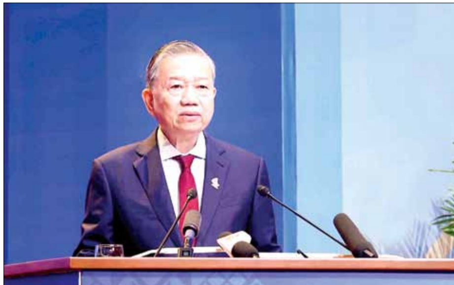
Tổng Bí thư Tô Lâm phát biểu chỉ đạo Đại hội IX Hội Liên hiệp Thanh niên Việt Nam.

tựu vĩ đại sau gần 80 năm lập nước và gần 40 năm thực hiện công cuộc đổi mới, với thời cơ, vận hội mới, ý Đảng đang