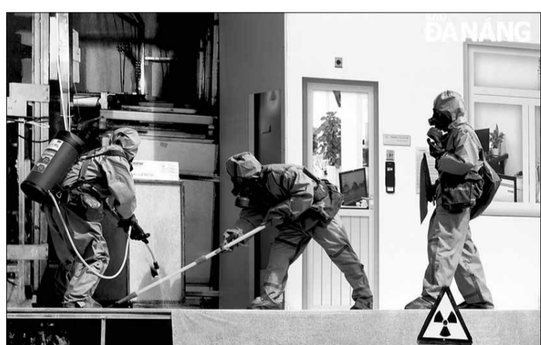
Đà Nẵng diễn tập ứng phó sự cố bức xạ, hạt nhân vào cuối tháng 7-2024.

Ý thức được vai trò của khoa học và công nghệ đối với sự phát triển chung của thành phố, năm 2024, Sở Khoa học và Công nghệ (KH&CN) cụ thể hóa nhiều chủ trương, chính sách, đẩy mạnh nghiên cứu khoa học gắn với chuyển giao ứng dụng; hỗ trợ phát triển doanh nghiệp và thúc đẩy thị trường, quản lý Nhà nước trên các lĩnh vực.