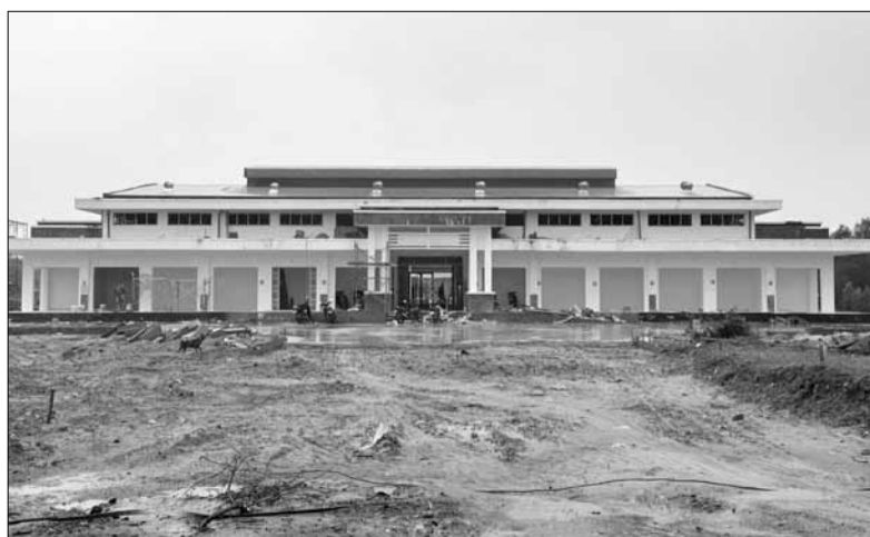
Chợ Hòa Hiệp Bắc đang được gấp rút thi công để hoàn thành, bàn giao đúng tiến độ.