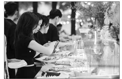
Phục vụ hơn 250 món ăn, chuỗi ẩm thực tại đây thể hiện sự giao thoa hoàn hảo giữa đặc sản ba miền cũng như tinh hoa ẩm thực quốc tế.

Phục vụ hơn 250 món ăn, chuỗi ẩm thực tại đây thể hiện sự giao thoa hoàn hảo giữa đặc sản ba miền cũng như tinh hoa ẩm thực quốc tế. Trong đó nổi bật là bữa tiệc buffet hải sản với những món ăn được chế biến cầu kỳ, hấp dẫn. Thực khách thoải mái thưởng thức tôm, cua, ốc, ghẹ, hải nướng phô mai, sashimi cá hồi, cá ngừ đại dương hay salad, lẩu hải sản và những món hầm, xào theo công thức đa dạng, mới mẻ. Đặc biệt, với ai thích ăn cá nóc, hải sâm nhưng không thể tự tay chế biến vẫn có thể thưởng thức món lẩu cá nóc, lẩu hải sâm cơm cháy hoặc cá nóc nấu cà ri, nướng muối ớt.