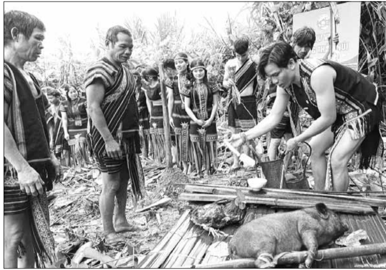
Nghi thức cúng thần Núi của người Xơ Đăng.

Dựng Nêu xong, mọi người chỉnh tề trang phục truyền thống rục rịch cùng nhau lần lượt bước vào khoảng sân trước nhà làng tạo thành đội hình múa Chiêu. Nam mặc áo, mặc khố. Nữ mặc váy và đeo hạt cườm. Điệu múa Chiêu của thiếu nữ Xơ Đăng với đôi tay hướng lên trời cầu xin và đón nhận sự che chở của thần linh cho bản làng yên vui, tránh