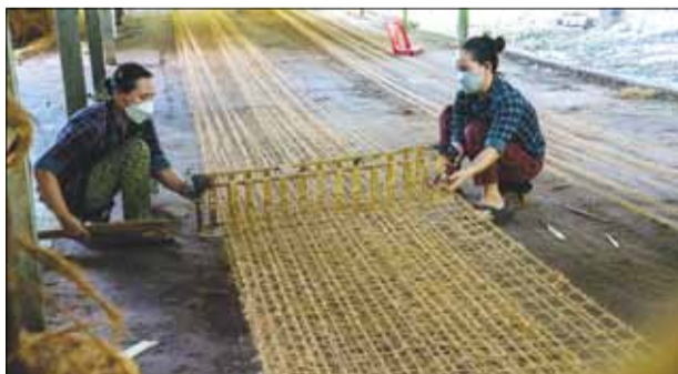
Thảm xơ dừa được dệt hai lớp, chiều dài 10m. Hai người thợ sẽ làm chung một khung dệt.