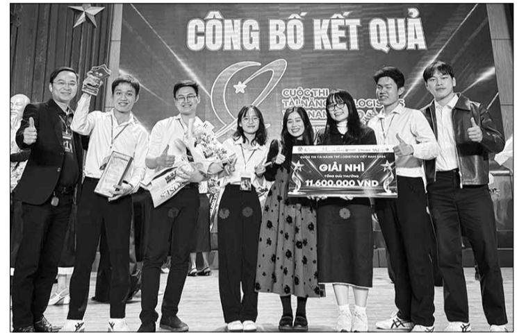
Đội tuyển Logisayhi đến từ Đại học Duy Tân đã xuất sắc giành giải Nhì, cuộc thi Tài năng trẻ Logistics Việt Nam 2024 vừa diễn ra tại Hà Nội.

Nhờ tính năng ưu việt, mô hình "Chuỗi cung ứng và giải pháp thu gom rác thải điện tử thông qua nền tảng HiE tại thành phố Đà Nẵng" của đội tuyển Logisayhi đến từ Đại học Duy Tân đã xuất sắc giành giải Nhì, cuộc thi Tài năng trẻ Logistics Việt Nam 2024 vừa diễn ra tại Hà Nội.