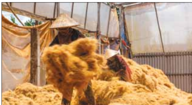
Dưới cái nắng gay gắt hơn 11 giờ, họ nhanh tay cào cào, quét quét để mẻ xơ dừa được đều, khô nhanh.