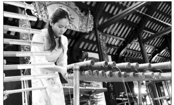
Nghệ nhân biểu diễn đàn klông-pút tại Hội quán Vịnh, Nha Trang tại khu du lịch Hòn Chông.

Khi chơi đàn người chơi hơi khom người khum hai bàn tay lại, cách xa miệng ống khoảng 10cm và vỗ để luồng hơi từ hai bàn tay phát ra lùa vào miệng ống. Hơi sẽ làm chuyển động cột khí bên trong bật ra ngoài tạo thành âm thanh. Nghĩa là, người sử dụng không cần chạm tay vào nhạc cụ.