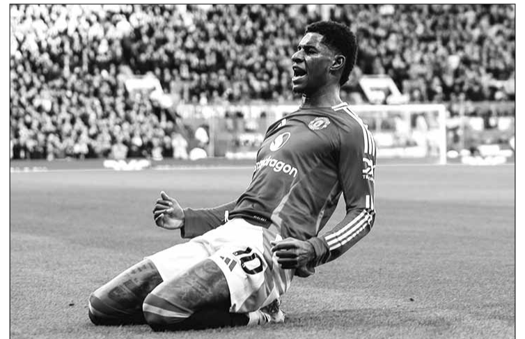
Ngày rời Manchester United của Rashford không còn xa.

Ở Old Trafford hiện có một Amad Diallo chơi bùng nổ, một Garnacho dù còn chệch choạc nhưng đầy tiềm năng, một Højlund đang được kỳ vọng trở thành “Gyokeres mới” của HLV Amorim và còn nhiều cái tên mới sẽ được phía INEOS đưa về trong tương lai gần. Có thể hiểu cơ hội của Rashford không còn nhiều. Có lẽ đó là lý do để anh khẳng định trong cuộc phỏng vấn với Henry Winter: “Tôi nghĩ mình đã sẵn sàng cho thử thách mới trên hành trình tiếp theo (...) Khi rời