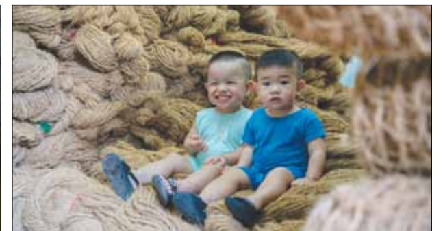
Với ưu điểm nổi trội và tính ứng dụng cao, thảm xơ dừa hiện là mặt hàng thủ công mỹ nghệ được ưa chuộng trên thị trường.

Hãy gửi cho chúng tôi những tác phẩm mà các bạn yêu thích. Địa chỉ: maichimai2611@gmail.com