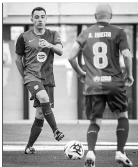
Bộ đôi huyền thoại Xavi-Iniesta lại sát cánh trên sân cỏ gần 10 năm.