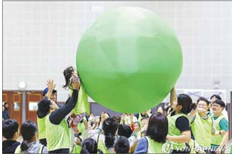
Các em nhỏ đang vui chơi với quả bóng bay khổng lồ tại sự kiện thúc đẩy phát thải carbon bằng 0 ở miền nam Seoul, ngày 10-12-2023.

Giai đoạn 2014-2018, Hàn Quốc triển khai hàng loạt sáng kiến nhằm thay đổi cơ cấu kinh tế theo hướng thân thiện hơn với