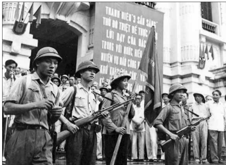
Lễ xuất phát của đoàn thanh niên xung phong Hà Nội lên đường chống Mỹ, cứu nước, tổ chức ở Nhà hát Lớn Hà Nội, ngày 11-7-1969.