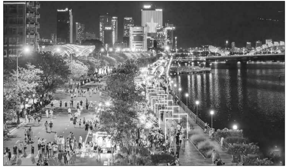
Đà Nẵng rất thành công trong việc thu hút du khách nhưng để tạo sức hấp dẫn thường xuyên, bền vững thì vẫn cần quan tâm hơn về việc xây dựng dịch vụ chất lượng và sự kết nối chân thành.

Trong khi đó, sự cố của United Airlines (một hãng hàng không của Mỹ) vào năm 2017 đã trở thành bài học đáng nhớ về thái độ phục vụ khách hàng. Cụ thể, hãng hàng không này gặp phải chỉ trích nặng nề khi một hành khách bị kéo lê ra khỏi máy bay do tình trạng quá tải vé. Video ghi lại cảnh tượng này nhanh chóng lan truyền trên mạng xã hội, gây ra làn sóng phẫn nộ trên toàn cầu. Hình ảnh hành khách bị đối xử thô bạo không chỉ gây ra sự phẫn nộ từ