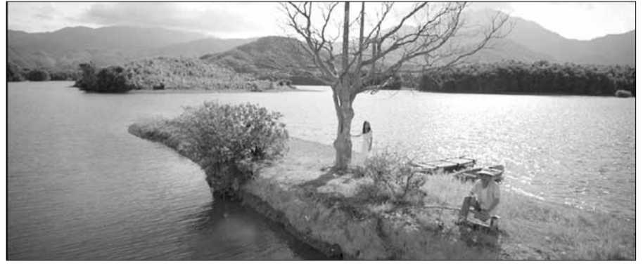
Bối cảnh của phim "Yêu em bất chấp" là thành phố Đà Nẵng đẹp lung linh và lãng mạn.

Điện ảnh là một trong những sản phẩm công nghiệp văn hóa đang rất được thế giới chú trọng và săn đón, mang lại hiệu quả rất lớn, không chỉ về tiền mà còn về quảng bá hình ảnh của một thành phố,