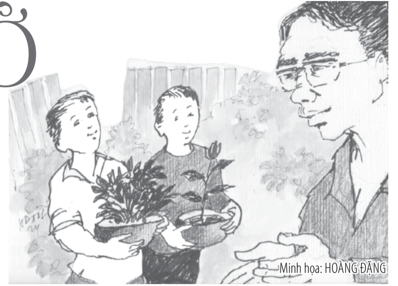
Minh họa: HOÀNG ĐĂNG

- Mây khờ quá nhe, bông mai nở trên cành mai sao nở trên cành cây này được!