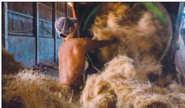
Sau khi tách, vỏ dừa được cho vào máy để lấy chỉ xơ dừa ra.