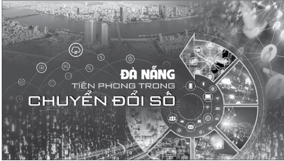
Chuyển đổi số không thể thành công nếu như không hình thành được cộng đồng cư dân số, không thể xây dựng chính quyền số nếu thiếu các công dân số.

Hẳn là không ai ngây thơ nghĩ rằng cứ hễ được sống trên một thành phố thông minh thì rồi mình cũng sẽ trở thành người thông minh. Nhưng điều rõ ràng là sức lôi cuốn của những lối sống ngày càng văn minh/ thông minh