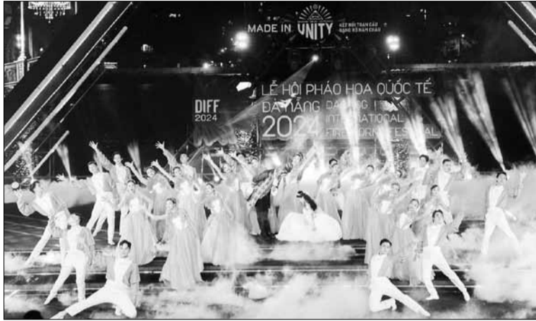
Lễ hội pháo hoa quốc tế là sự kiện văn hóa nổi bật, hấp dẫn tại thành phố Đà Nẵng suốt 16 năm qua.

- Đà Nẵng là thành phố trẻ, năng động với nguồn tài nguyên văn hóa đa dạng gắn liền với danh lam thắng cảnh, các di tích, lịch sử làng nghề. Đặc biệt, trong số 7 di sản văn hóa