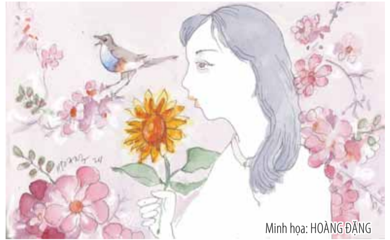
Minh họa: HOÀNG ĐĂNG

Có lần chứng kiến bạn mình vẫn trang điểm thật xinh đẹp, bước ra đường với diện mạo tươi tắn nhất, tôi không thể hình dung là cách đây chỉ vài tuần, bác sĩ vừa thông báo là thời gian sống của nó không còn nhiều. Sau thoáng chốc ngạc nhiên, tôi cảm thấy khâm phục nó, khâm phục bản lĩnh khi đối diện với biến cố, khâm phục sự lạc quan và biết cách sống trọn vẹn từng giây phút của bạn mình. Từ đó, tôi nhận ra,