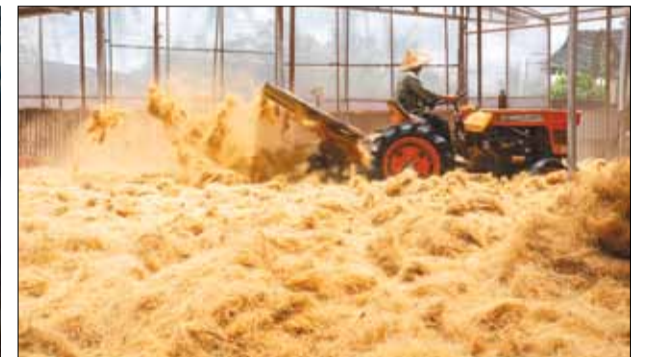
Những người chuyên phơi chỉ xơ dừa chỉ làm việc vào ban ngày - khi trời nắng.