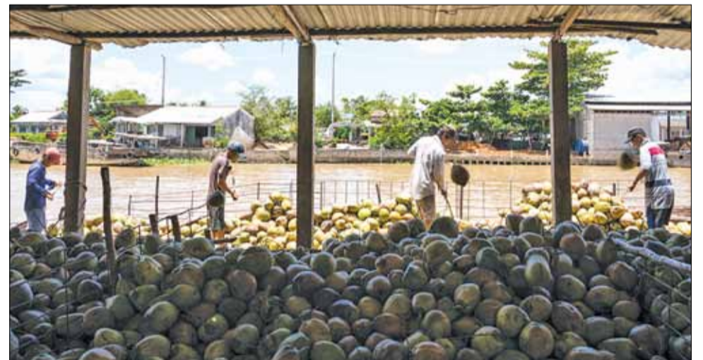
Ngày ngày, thuyền cập bến, xuất bến đều chở đầy ắp những vỏ dừa khô.

Đà Nẵng cuối tuần mời bạn tìm hiểu quá trình sản xuất thảm xơ dừa qua chùm ảnh của tác giả Mộc Trà (Đà Nẵng).