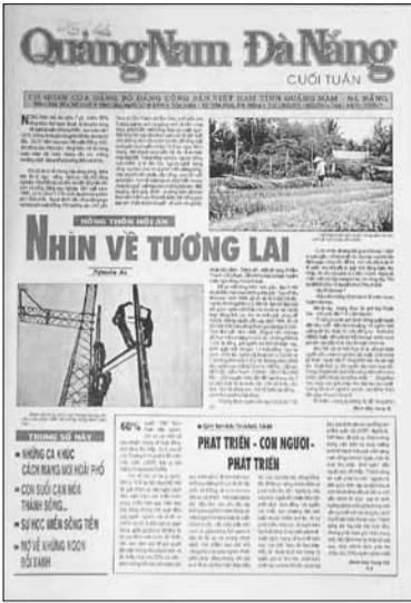
Thời gian đã qua, không còn nhớ số lượng phát hành ngày ấy, nhưng sự háo hức chờ đợi của độc giả khi số tờ Báo Quảng Nam - Đà Nẵng cuối tuần xuất hiện ở các sạp báo tại Thành phố Hồ Chí Minh, bạn đọc phía Nam đón nhận trong sự yêu thích là một kỷ ức khó phai trong sự nghiệp làm báo.