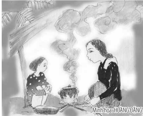
Minh họa: HOÀNG ĐĂNG

Nhớ khói bếp hay chính là tôi nhớ hình bóng mẹ tôi cứ mỗi sớm, khi tiếng gà gáy sáng vừa dứt, mẹ tôi đã dậy. Rồi cứ thế, tiếng gáo múc nước va vào lu nước lạnh canh, tiếng vo gạo sần sật và lửa được nhen lên, bóng mẹ tôi chờn vờn trên vách. Khói bếp thơm nồng lan khắp nhà, mẹ tôi