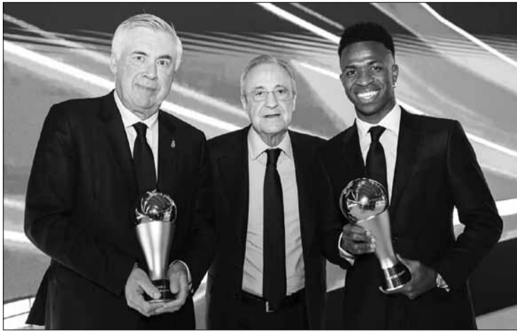
Vinicius (bìa phải) chụp ảnh lưu niệm cùng Chủ tịch Perez và HLV Ancelotti tại Lễ trao giải thưởng FIFA The Best năm 2024.

Chỉ là nhân vật phụ của tiệc hội hoành tráng do FIFA tổ chức mỗi năm một lần nhưng cảm xúc của Alejandro Garnacho- người đoạt giải thưởng Puskas với bàn