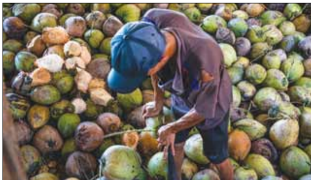
Dừa khô sau khi được các cơ sở thu mua sẽ được tách phần vỏ. Người thợ dùng công cụ dao sắt, cứng được dựng cố định vào trụ cố định để tách đôi.