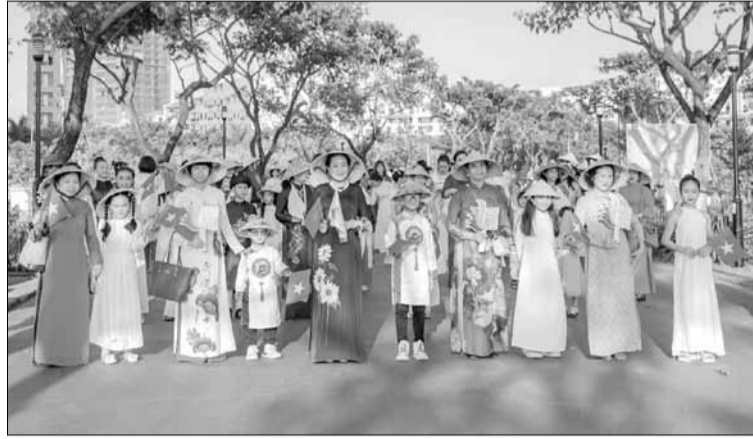
Câu lạc bộ Di sản áo dài Việt Nam tại Đà Nẵng trình diễn áo dài trên đường phố.

Đà Nẵng có nhiều thuận lợi để phát triển thời trang khi là thành phố du lịch. Bên cạnh đó, Đà Nẵng có nguồn nhân lực trẻ cho ngành thiết kế thời trang với Đại học Duy Tân là đơn vị đào tạo đầu tiên. "Ở góc độ cá nhân, tôi mong muốn thành phố