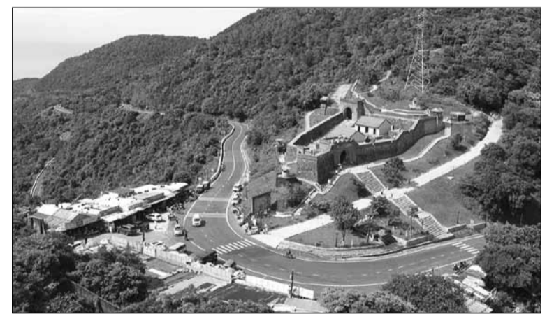
"Đệ nhất hùng quan" Hải Vân Quan sau hơn 2 năm trùng tu đã mở cửa, thu hút du khách trong nước và quốc tế đến thưởng ngoạn.

Đà Nẵng sở hữu kho tàng văn hóa như: di tích quốc gia đặc biệt Ngũ Hành Sơn (danh thắng Ngũ Hành Sơn), Thành Điện Hải, Bảo tàng Đà Nẵng, Bảo tàng Điêu khắc Chăm, Bảo tàng Mỹ thuật Đà Nẵng... Ngoài ra,