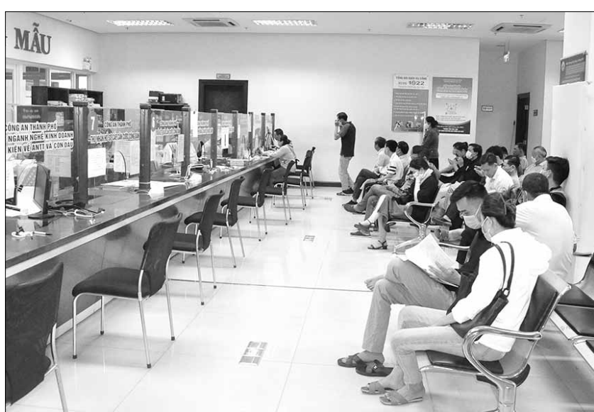
Người dân làm thủ tục ở bộ phận "Một cửa" của Sở Giao thông vận tải tại Trung tâm Hành chính thành phố.