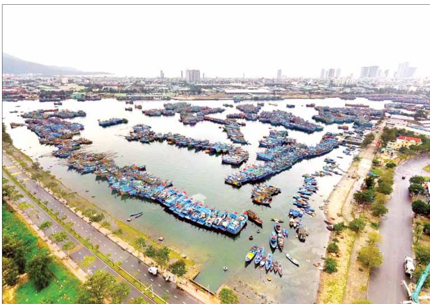
100% tàu cá ra - vào cảng cá Thọ Quang được theo dõi, giám sát đúng quy định.