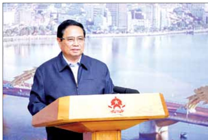
Thủ tướng Chính phủ Phạm Minh Chính phát biểu kết luận phiên họp.

Theo báo cáo tại phiên họp, năm 2024, tình hình kinh tế - xã hội của Đà Nẵng tiếp tục phát triển tích cực với nhiều điểm sáng