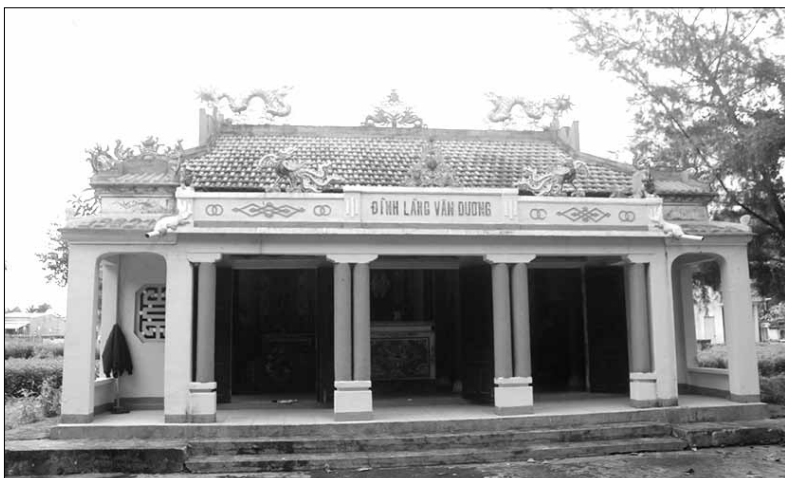
Trái qua bao biến thiên của lịch sử, đình làng Văn Dương vẫn giữ được nét kiến trúc truyền thống.

Đình làng Văn Dương được khởi dựng lần đầu khoảng thời gian dưới thời chúa Nguyễn Phúc Trứ (1725-1738) tại vị trí "vườn đình" xây xóm Làng. Lúc này, đình được xây dựng bằng các vật