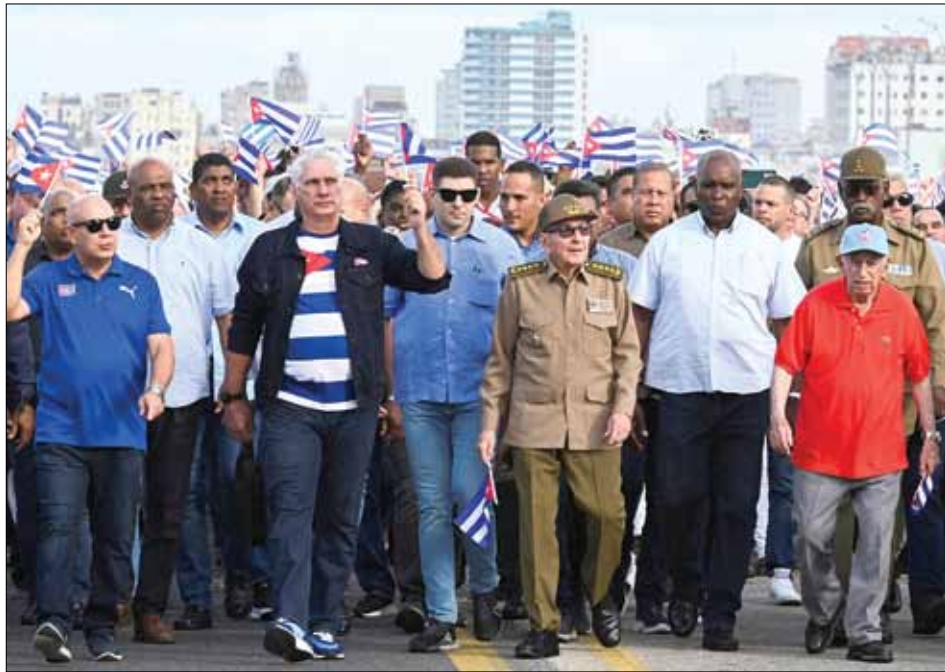
Lãnh đạo Cuba và người dân đi bộ dọc bờ biển Malecon trong cuộc biểu tình ở Havana vào ngày 20-12.

Theo truyền thông Cuba, nhiều nhân viên y tế đã tham gia cuộc biểu tình. Trong