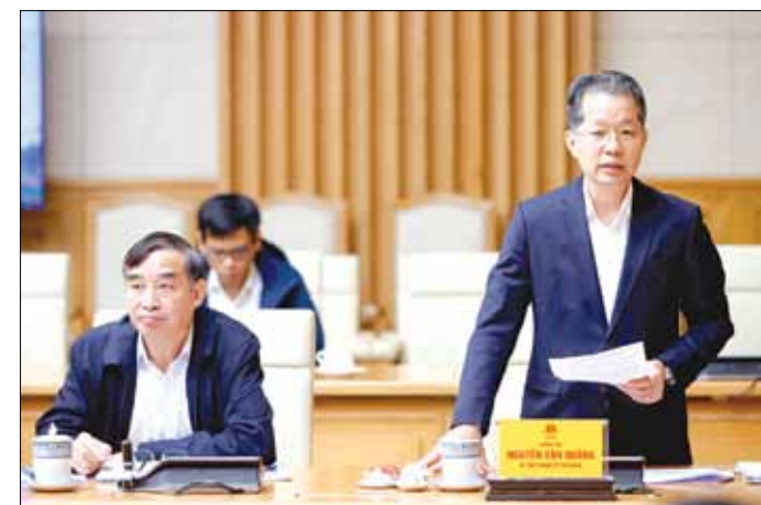
Bí thư Thành ủy Nguyễn Văn Quảng phát biểu tại phiên họp.

trên các lĩnh vực. Nổi bật là tổng sản phẩm xã hội trên địa bàn (GRDP) ước tăng 7,51% so với năm 2023; cao hơn trung bình cả nước, xếp thứ 2/5 thành phố, xếp thứ 3 trong vùng kinh tế trọng điểm miền Trung và xếp thứ 29/63 cả nước. Tổng thu ngân sách Nhà nước trên địa bàn ước đạt 25.760,4 tỷ đồng, vượt 33,3% dự toán HĐND thành phố giao và tăng 20% so với năm 2023. Tổng vốn đầu tư phát triển trên địa bàn ước đạt 32,85 nghìn tỷ đồng,