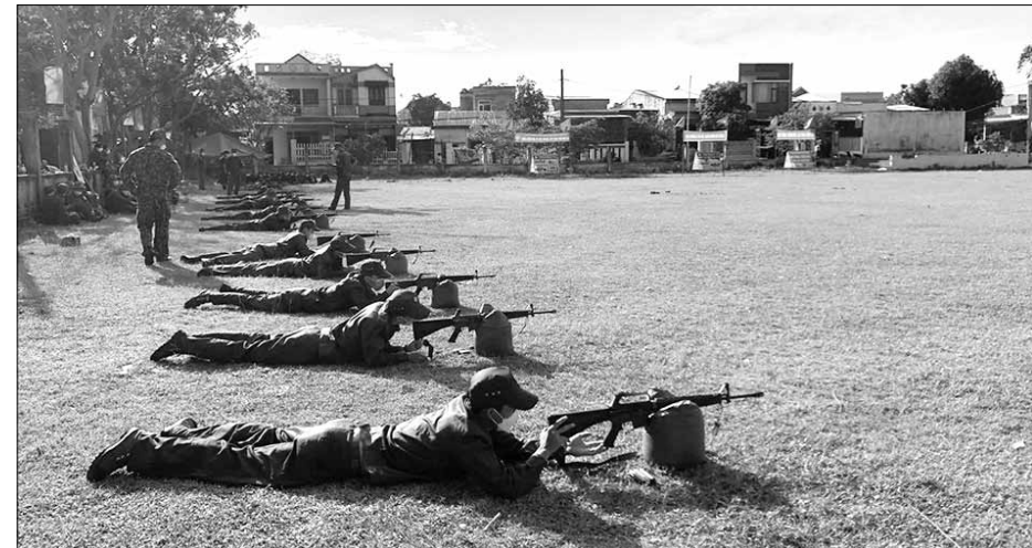
Ban Chỉ huy Quân sự huyện Hòa Vang tập trung đổi mới nội dung, phương pháp huấn luyện lực lượng dân quân tự vệ theo phương châm "cơ bản, thiết thực, chất lượng" và sẵn sàng chiến đấu.

Năm 2024, Ban Chỉ huy Quân sự huyện Hòa Vang tập trung xây dựng lực lượng vũ trang gắn với thực hiện "3 khâu đột phá", đẩy mạnh học tập, làm theo tư tưởng, đạo đức, phong cách Hồ Chí Minh và cuộc vận động "Phát huy truyền thống, cống hiến tài năng, xứng danh Bộ đội Cụ Hồ thời kỳ mới".