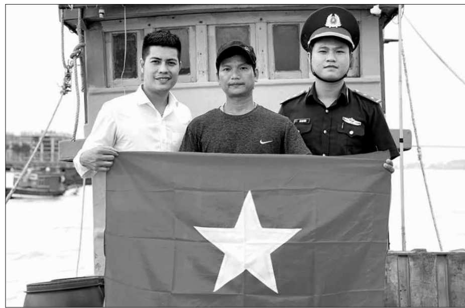
Ngoài nhận hỗ trợ các chính sách để yên tâm vươn khơi, ngư dân được trang bị kiến thức bảo vệ nguồn lợi hải sản lâu dài và nâng cao ý thức khai thác đúng nơi quy định. TRONG ANH: Bộ đội Biên phòng tặng cờ Tổ quốc cho ngư dân.