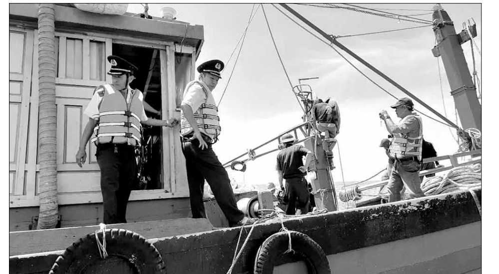
Cơ quan chức năng thành phố tăng cường kiểm tra tàu khai thác thủy sản, chống khai thác bất hợp pháp.

Trong năm, đơn vị tổ chức 7 lớp tuyên truyền Nghị định số 37/2024/NĐ-CP của Chính phủ về việc sửa đổi, bổ sung một số