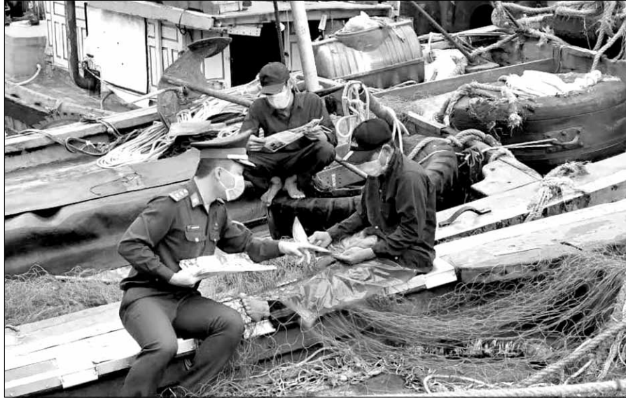
Cán bộ chiến sĩ Đồn Biên phòng Sơn Trà đóng hàng tuyên truyền cùng ngư dân vươn khơi bám biển.

Tính đến hết tháng 11-2024, Sở Nông nghiệp và Phát triển nông thôn (NN&PTNT) ghi nhận 126/1.545 tàu cá có chiều dài lớn nhất từ 6m trở lên trên địa bàn thành phố không đủ điều kiện hoạt động khai thác thủy sản. Trong đó, có 36 tàu cá "3 không" (tàu phát sinh không đăng ký, đăng kiểm, giấy phép khai thác thủy sản). Các đơn vị, địa phương đang khẩn trương đẩy nhanh tiến độ làm thủ tục cấp các giấy tờ liên quan cho số tàu nói trên; đồng thời tăng cường theo dõi, giám sát đối với những tàu cá nguy cơ cao vi phạm quy định khai thác IUU. Theo Sở NN&PTNT, định kỳ hàng tuần, thông tin về chủ tàu, hiện trạng hoạt động, vị trí neo đậu... của tàu được cơ quan chức năng cập nhật, tổng hợp và lập danh sách tàu cá không đủ điều kiện hoạt động khai thác thủy sản, gửi về các địa phương và lực lượng Bộ đội Biên phòng (BĐBP) biết và tổ chức theo dõi, giám sát. Lập, đăng tải danh sách tàu cá có nguy cơ cao vi phạm khai thác IUU lên cơ sở dữ liệu trên hệ thống giám sát tàu cá.