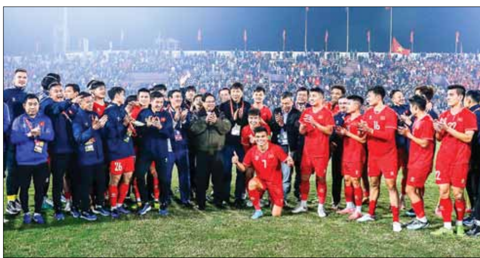
Thủ tướng Phạm Minh Chính chúc mừng đội tuyển Việt Nam sau trận thắng Myanmar.