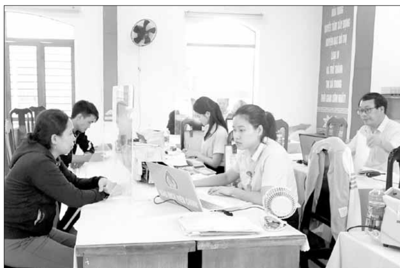
UBND thành phố ủy thác 50 tỷ đồng sang Ngân hàng Chính sách xã hội để cho vay đoàn viên công đoàn khó khăn. TRONG ẢNH: Phiên giao dịch tháng 12 của Ngân hàng Chính sách xã hội tại xã Hòa Phước (huyện Hòa Vang). Ảnh: M.QUẾ

Năm 2024, UBND thành phố ủy thác 50 tỷ đồng sang Ngân hàng Chính sách xã hội (NHCSXH) để thực hiện Nghị quyết số 33/2024/NQ-HĐND ngày 30-7-2024 của HĐND thành phố quy định về ủy thác nguồn vốn ngân sách qua Chi nhánh NHCSXH thành phố Đà Nẵng cho vay đoàn viên công đoàn là cán bộ, công chức, người hoạt động không chuyên trách, người lao động có hoàn cảnh khó khăn trên địa bàn.