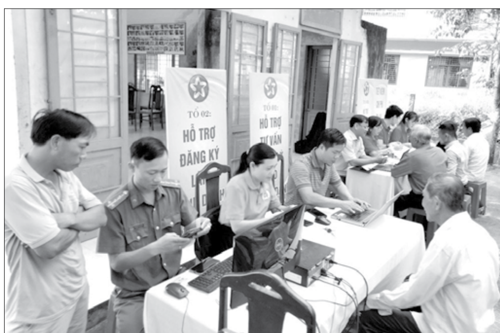
Đội tình nguyện công tác viên cải cách hành chính xã Hòa Sơn hỗ trợ, hướng dẫn người dân triển khai đăng ký thủ tục hành chính trực tuyến.

Giải pháp tuyên truyền thông qua "Ngày hội chuyển đổi số - Cải cách hành