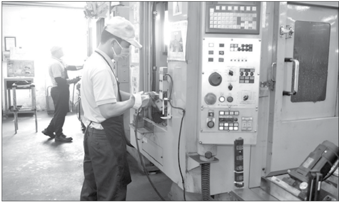
Nhà đầu tư, doanh nghiệp sẽ gặp nhiều thuận lợi khi Ban Quản lý Khu Công nghệ cao và các khu công nghiệp Đà Nẵng được bổ sung thêm chức năng, nhiệm vụ, quyền hạn theo Nghị quyết số 136/2024/QH15 của Quốc hội. TRONG ẢNH: Công nhân đang làm việc tại Nhà máy sản xuất của Công ty TNHH Tokyo Keiki Precision Technology tại Khu Công nghệ cao Đà Nẵng.

Từ tháng 2-2019, Ban Quản lý Khu Công nghệ cao và các khu công nghiệp Đà Nẵng được UBND thành phố ủy quyền thực hiện thẩm định, phê duyệt báo cáo đánh giá tác động môi trường đối với các dự án tại Khu Công nghệ cao Đà Nẵng và các khu công nghiệp Đà Nẵng được bổ sung thêm chức năng, nhiệm vụ, quyền hạn theo Nghị quyết số 136/2024/QH15 của Quốc hội. TRONG ẢNH: Công nhân đang làm việc tại Nhà máy sản xuất của Công ty TNHH Tokyo Keiki Precision Technology tại Khu Công nghệ cao Đà Nẵng.