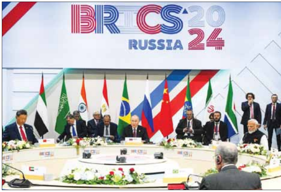
Quang cảnh cuộc họp tại hội nghị thượng đỉnh BRICS năm 2024 tại Kazan (Nga).

Belarus, Bolivia, Indonesia, Kazakhstan, Thái Lan, Cuba, Uganda, Malaysia và Uzbekistan chính thức trở thành đối tác của Nhóm các nền kinh tế mới nổi hàng đầu thế giới (BRICS) từ ngày 1-1-2025. Điều này cho thấy sức hấp dẫn không ngừng tăng của khối đối với các quốc gia đang tìm kiếm cơ hội hợp tác đa phương.