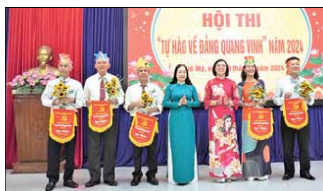
Các đội thi được tặng hoa và cờ lưu niệm tại hội thi "Tự hào về Đảng quang vinh" do Đảng ủy phường Khuê Mỹ tổ chức.