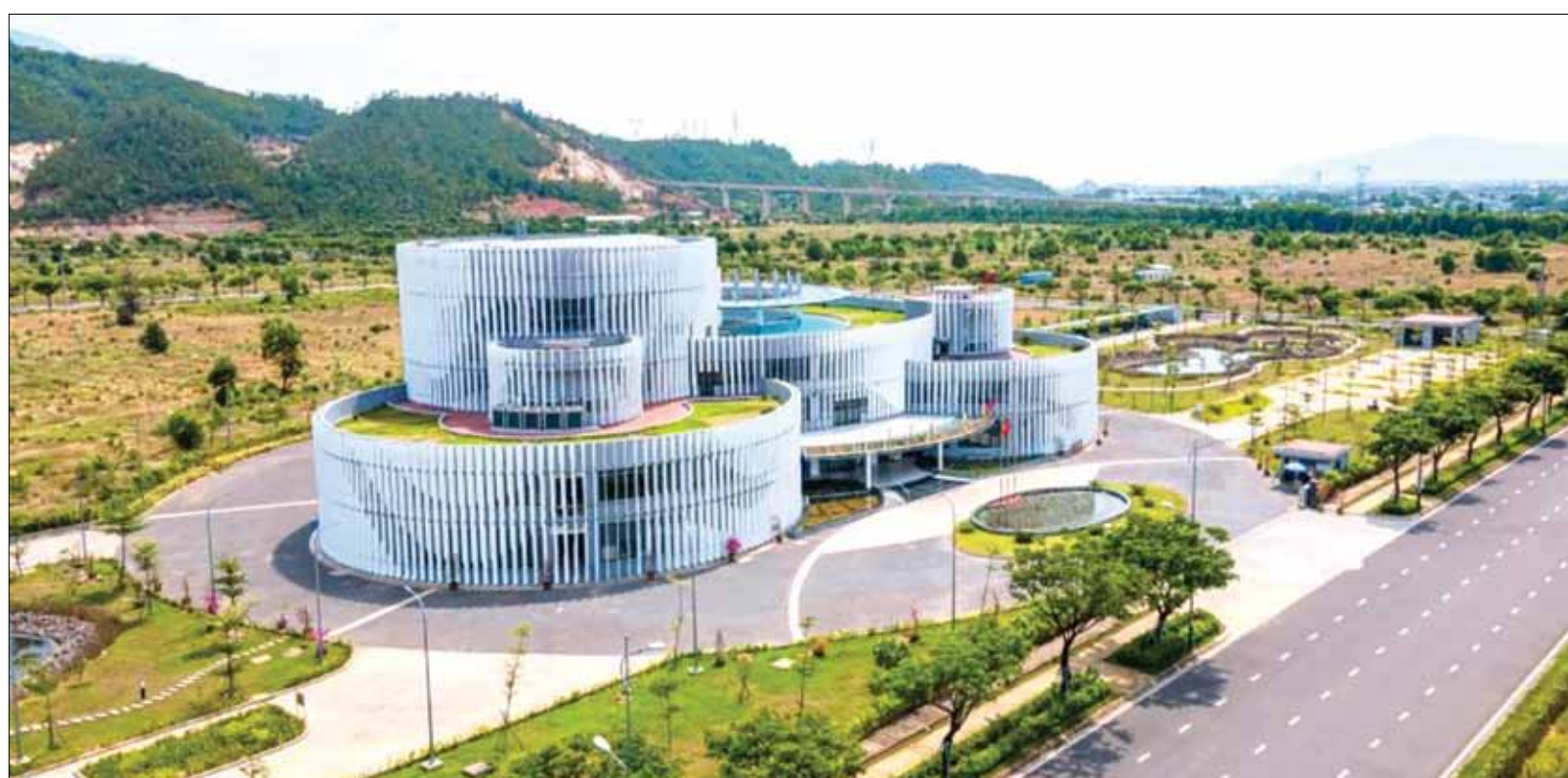
Ban Quản lý Khu Công nghệ cao và các khu công nghiệp Đà Nẵng đang được đề nghị bổ sung chức năng, nhiệm vụ, quyền hạn theo quy định tại Nghị quyết số 136/2024/QH15 của Quốc hội nhằm nâng cao hiệu quả thực hiện cơ chế "một cửa, tại chỗ". TRONG ẢNH: Tòa nhà làm việc của Ban Quản lý Khu Công nghệ cao và các khu công nghiệp Đà Nẵng.