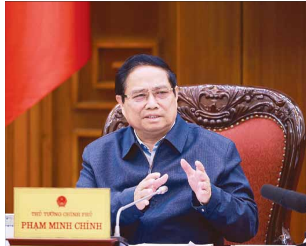
Thủ tướng Phạm Minh Chính chủ trì phiên họp lần thứ 6 về sắp xếp bộ máy của Chính phủ.

Theo Ban Chỉ đạo, công tác sắp xếp tổ chức bộ máy của hệ thống chính trị được các bộ, cơ quan ngang bộ, cơ quan thuộc Chính phủ triển khai khẩn trương, cơ bản hoàn thiện để án. Theo đó, dự kiến bộ máy của Chính phủ sẽ được tinh gọn từ 30 xuống còn 21 đầu mối gồm: 13 bộ, 4 cơ quan ngang bộ và 4 cơ quan thuộc Chính phủ. Các bộ, cơ quan ngang bộ, cơ quan