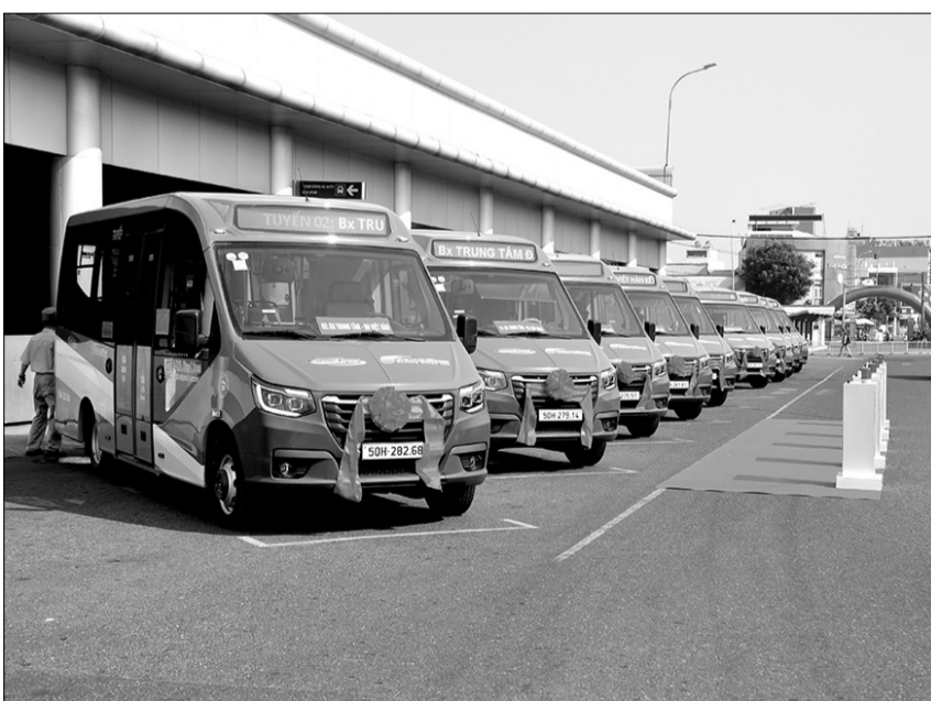
Khai trương tuyến buýt Đà Nẵng - Hội An và Đà Nẵng - Tam Kỳ.

Theo Sở Giao thông vận tải, nhằm tăng cường hiệu quả của hệ thống xe buýt, hạn chế ùn tắc, sẽ xây dựng các giải pháp hạn chế phương tiện cá nhân, tăng cường kiểm soát trật tự vỉa hè, không sử dụng vỉa hè để đỗ xe, trông giữ xe mà ưu tiên cho người đi bộ. Sở cũng kiểm soát chặt chẽ việc đậu, đỗ như: cấm, hạn chế đậu đỗ trên các tuyến đường trung tâm, mở rộng thu phí đầu tư cho xe buýt trợ giá của thành phố không nhiều. Cụ thể, so sánh với tỷ lệ dân cư thì tỷ lệ trợ giá của hệ thống xe buýt Đà Nẵng chỉ 30.000 đồng/người, còn Thành phố Hồ Chí Minh hơn 170.000 đồng/người và Hà Nội hơn 230.000 đồng/người. Trong khi đó, lượng hành khách trước thời điểm Covid-19 tăng từ