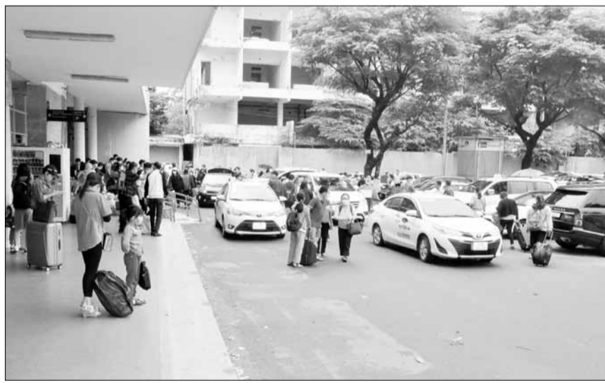
Hành khách đến thành phố qua ga Đà Nẵng.

Trong những ngày này, việc tìm kiếm vé máy bay, tàu hỏa đi lại trong dịp Tết khá khó khăn, trong khi đó giá vé cũng tăng, giảm "bất thường" tùy theo chặng.