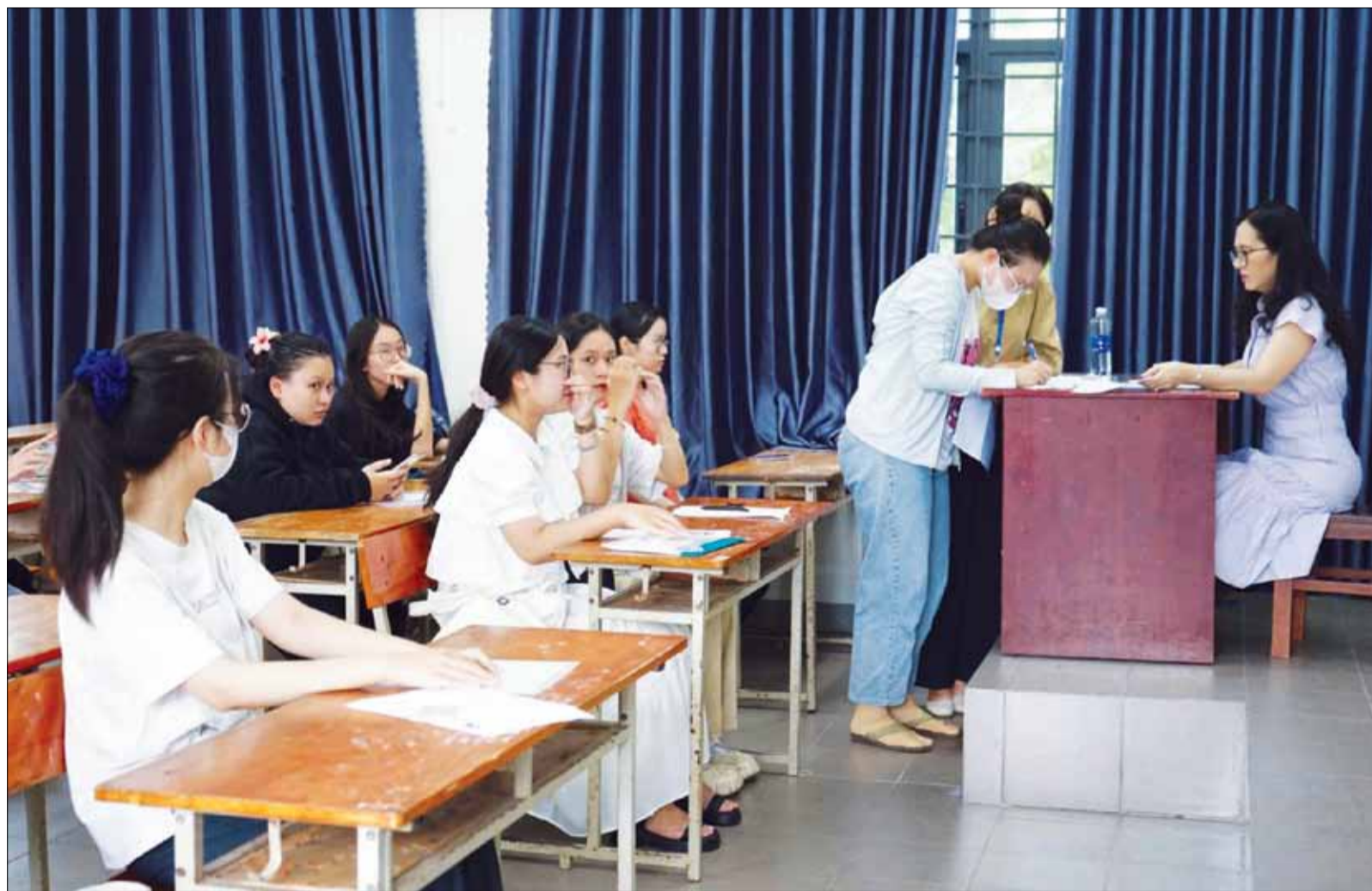
Thí sinh tập trung nghe quy chế trước khi bước vào kỳ thi tốt nghiệp THPT 2024.