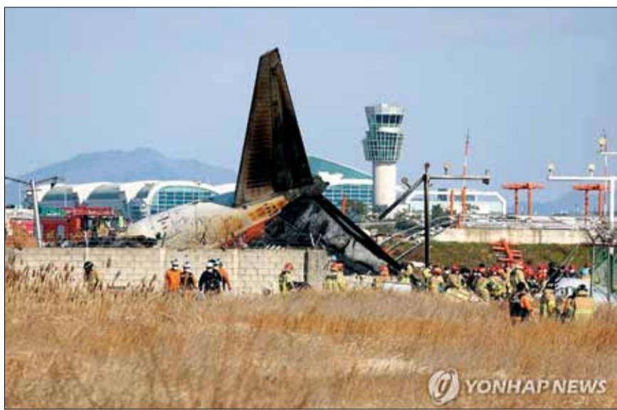
Công tác cứu hộ sau vụ tai nạn máy bay tại sân bay quốc tế Muan ngày 29-12 năm 2024.

Theo Yonhap, máy bay trượt khỏi đường băng trong khi hạ cánh, đâm vào tường rào tại sân bay quốc tế Muan (tỉnh Jeolla Nam) và bốc cháy lúc 9 giờ 7 phút ngày 29-12, khiến 179 hành khách và phi hành đoàn thiệt mạng. Trong 181 người trên máy bay, chỉ có 2 người Thái Lan, còn lại là công dân Hàn Quốc. "Sau khi máy bay đâm vào tường, hành khách bị văng ra khỏi máy bay. Do đó, cơ hội sống sót cực kỳ thấp. Máy bay đã gần như bị phá hủy hoàn toàn, ngoại trừ phần đuôi và rất khó để nhận dạng người chết", Yonhap dẫn lời quan chức cơ quan cứu hỏa cho biết. Hai người may mắn sống sót sau khi được cứu ra khỏi phần đuôi của máy bay, bộ phận duy nhất còn giữ chút hình dạng do chưa bị lửa thiêu rụi. Cả hai đều là tiếp viên trên chuyến bay và đang được điều trị tại bệnh viện.