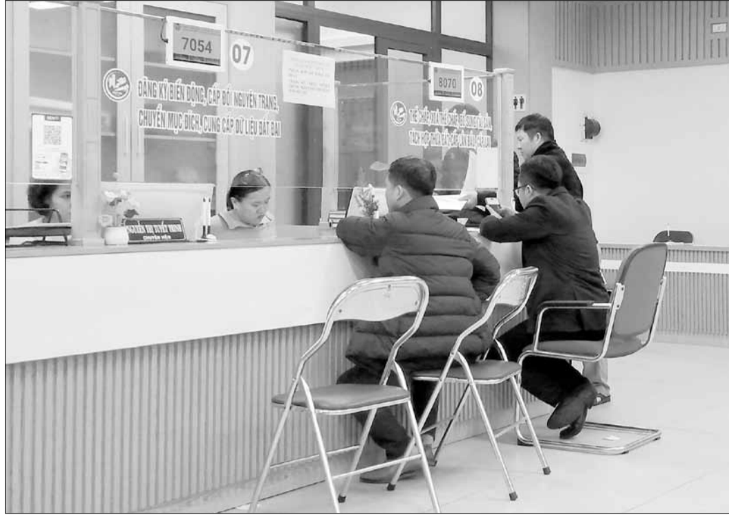
Người dân đến làm thủ tục đất đai vào những ngày cuối tháng 12-2024.

Văn phòng Đăng ký đất đai thành phố đang phối hợp các đơn vị liên quan chuẩn bị các điều kiện cần thiết để tạo điều kiện thuận lợi cho các hộ gia đình, cá nhân làm các thủ tục liên quan đến cấp giấy chứng nhận quyền sử dụng đất, đăng ký biến động, thế chấp và các giao dịch về đất đai sau khi sắp xếp địa giới hành chính. Đồng thời, hạn chế nhất những ảnh hưởng và không để công tác giải quyết thủ tục hành chính về đất đai bị gián đoạn do thay đổi địa giới hành chính.