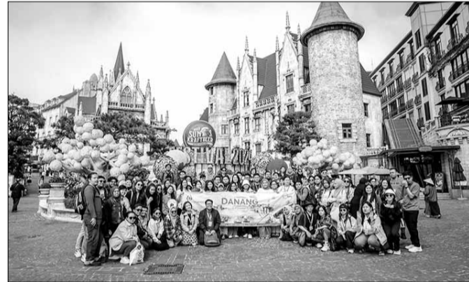
Hoạt động du lịch tiếp tục phát triển mạnh mẽ, khởi sắc, là điểm sáng trong phát triển kinh tế thành phố. TRONG ANH: Du khách tham quan Sun World Bà Nà Hills.

Năm 2024, tổng sản phẩm xã hội trên địa bàn (GRDP) thành phố Đà Nẵng ước tăng 7,51% so với năm 2023, xếp thứ 2 trong khối 5 thành phố trực thuộc Trung ương, xếp thứ 3 trong vùng kinh tế trọng điểm miền Trung, trong đó giá trị gia tăng khu vực dịch vụ ước tăng 7,7%; khu vực công nghiệp - xây dựng ước tăng 7,7%; khu vực nông - lâm nghiệp - thủy sản ước tăng 2%. Quy mô kinh tế (giá hiện hành) ước đạt 151.300 tỷ đồng, mở rộng hơn 17.000 tỷ đồng so với năm 2023. GRDP bình quân đầu người đạt 4.725 USD. Kim ngạch xuất khẩu hàng hóa ước đạt 1,92 tỷ USD, tăng 3,2%. Tổng thu ngân sách Nhà nước ước đạt 25.760 tỷ đồng, bằng 133,3% dự toán HĐND thành phố giao và tăng 19,9% so với năm 2023.