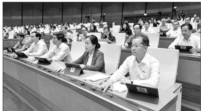
Đoàn đại biểu Quốc hội thành phố Đà Nẵng biểu quyết thông qua Nghị quyết số 136/2024/QH15.

Ngày 26-6-2024, Quốc hội ban hành Nghị quyết số 136/2024/QH15 về tổ chức chính quyền đô thị và thị trường một số cơ chế, chính sách đặc thù phát triển thành phố Đà Nẵng, đánh dấu mốc quan trọng, thể hiện sự quan tâm sâu sắc của Đảng, Quốc hội và Chính phủ đối với thành phố Đà Nẵng. Với việc cho phép thành phố triển khai chính thức chính quyền đô thị từ ngày 1-1-2025 cùng với việc hoàn thiện tổ chức bộ máy, cơ chế hoạt động của chính quyền đô thị và áp dụng một số cơ chế, chính sách đặc thù vượt trội, lần đầu tiên được áp dụng trong nước, Nghị quyết số 136/2024/QH15 là văn kiện quan trọng để thành phố Đà Nẵng phát huy mọi tiềm năng, lợi thế, khơi thông nguồn lực, tạo đột phá phát triển trong giai đoạn tới. Đây cũng là bước ngoặt quan trọng để thành phố tiến tới hoàn thành những mục tiêu trước mắt và lâu dài được nêu trong các nghị quyết của Trung ương Đảng, Quốc hội và quyết định của Chính phủ nhằm xây dựng và phát triển thành phố Đà Nẵng đến năm 2030, tầm nhìn đến năm 2045.