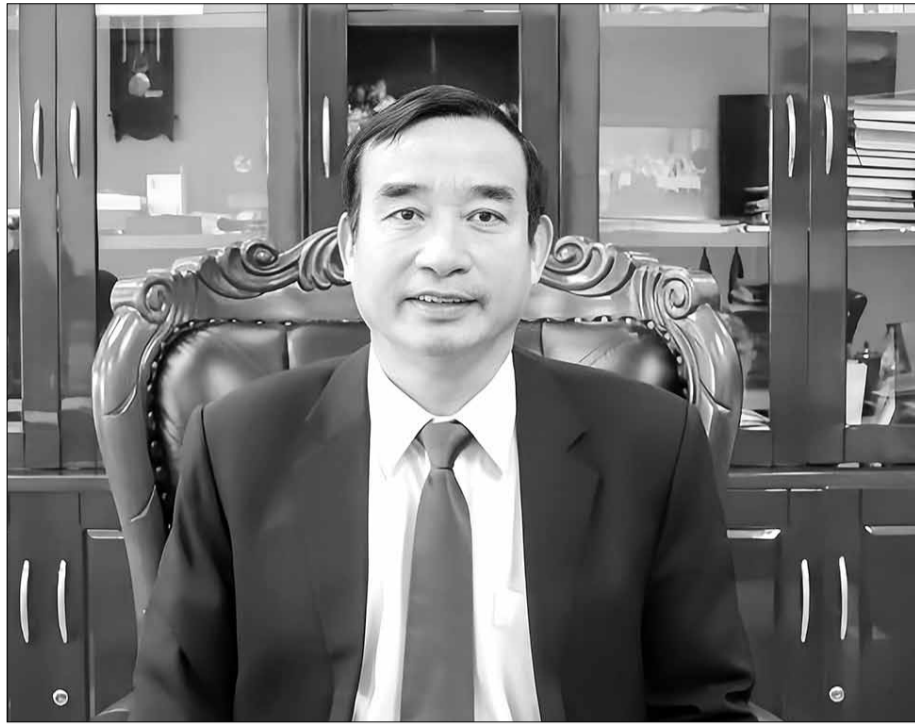
Phó Bí thư Thành ủy, Chủ tịch UBND thành phố Đà Nẵng Lê Trung Chinh.

Một dấu ấn đặc biệt của năm 2024 đối với thành phố Đà Nẵng là năm được Trung ương ban hành nhiều cơ chế, chính sách tạo động lực phát triển kinh tế - xã hội. Theo đó, Bộ Chính trị đã ban hành Kết luận số 79-KL/TW ngày 13-5-2024 về tiếp tục thực hiện Nghị quyết số 43-NQ/TW của Bộ Chính trị (khóa XII) về xây dựng và phát triển thành phố Đà Nẵng đến năm 2030, tầm nhìn đến năm 2045. Bộ Chính trị cũng ban hành Thông báo số 47-TB/TW ngày 15-11-2024 kết luận về việc xây dựng Trung tâm tài chính