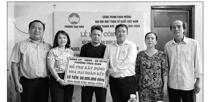
Năm 2024, thành phố tiếp tục dành nhiều nguồn lực chăm lo an sinh xã hội. TRONG ANH: Trao kinh phí hỗ trợ xây dựng nhà cho hộ nghèo trên địa bàn quận Thanh Khê.

Ngày 13-12, tại kỳ họp thứ 21, HĐND thành phố khóa X thông qua nghị quyết quy định mức hỗ trợ kinh phí xây dựng mới hoặc cải tạo, sửa chữa nhà ở đối với người có công cách mạng và thân nhân liệt sĩ trên địa bàn thành phố. Theo đó, ngoài mức hỗ trợ theo quy định của Thủ tướng Chính phủ, ngân sách thành phố hỗ trợ thêm 40 triệu đồng/hộ đối với trường hợp xây mới nhà ở; 10 triệu đồng/hộ đối với trường hợp cải tạo, sửa chữa nhà ở. Dự kiến có 800 hộ được hỗ trợ, tổng kinh phí 14 tỷ đồng. Trong đó, có 200 hộ xây mới, kinh phí hỗ trợ 8 tỷ đồng và 600 hộ cải tạo, sửa chữa, kinh phí hỗ trợ 6 tỷ đồng. Không chỉ đối tượng người có công, từ ngày 1-7, thành phố nâng mức hỗ trợ xây mới nhà cho hộ nghèo lên 80 triệu đồng/nhà (trước đây là 50 triệu đồng/nhà); hỗ trợ sửa chữa nhà ở cho hộ nghèo lên tới 30 triệu đồng/nhà (trước đây là 20 triệu đồng/nhà).