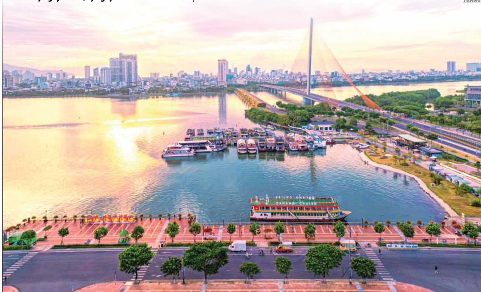
Dấu ấn đặc biệt của năm 2024 đối với thành phố Đà Nẵng là được Trung ương ban hành nhiều cơ chế, chính sách đặc thù tạo động lực phát triển kinh tế - xã hội. TRONG ẢNH: Đồ thị Đà Nẵng phát triển năng động.

Công bố sắp xếp đơn vị hành chính cấp phường tại quận Hải Châu, Sơn Trà, Thanh Khê