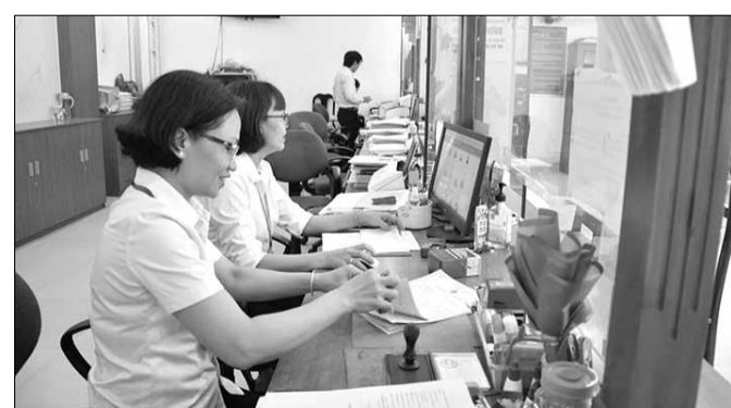
Công chức bộ phận "Một cửa" phường Thạch Gián (quận Thanh Khê) giải quyết yêu cầu về thủ tục hành chính của công dân.

Theo Nghị quyết số 1251/NQ-UBTVQH15 của Ủy ban Thường vụ Quốc hội về việc sắp xếp đơn vị hành chính cấp huyện, cấp xã của thành phố Đà Nẵng giai đoạn 2023-2025, kể từ ngày 1-1-2025, thành phố Đà Nẵng có 8 đơn vị hành chính cấp huyện, gồm 6 quận và 2 huyện; 47 đơn vị hành chính cấp xã, gồm 36 phường và 11 xã.