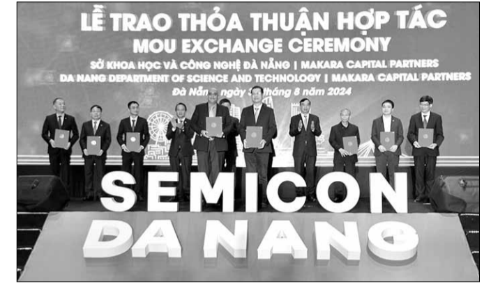
Trong khuôn khổ "Ngày Vi mạch bán dẫn Đà Nẵng năm 2024", nhiều thỏa thuận, biên bản ghi nhớ hợp tác giữa Đà Nẵng với các đối tác, doanh nghiệp, nhà đầu tư được ký kết.

Trong hai ngày 29 và 30-8, UBND thành phố tổ chức sự kiện "Ngày Vi mạch bán dẫn Đà Nẵng năm 2024". Đây là lần đầu tiên sự kiện được tổ chức, đánh dấu cột mốc mới trong hành trình phát triển của thành phố. Ngày vi mạch bán dẫn Đà Nẵng năm 2024 nhằm quảng bá tiềm năng, lợi thế, cơ hội đầu tư của Đà Nẵng trong lĩnh vực vi mạch bán dẫn để các doanh nghiệp, nhà đầu tư trong