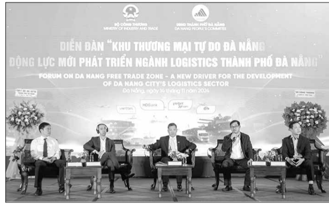
Thành phố tổ chức diễn đàn "Khu thương mại tự do Đà Nẵng - động lực mới phát triển ngành logistics thành phố Đà Nẵng.

Nghị quyết số 136/2024/QH15 của Quốc hội về tổ chức chính quyền đô thị và thị trường một số cơ chế, chính sách đặc thù phát triển thành phố Đà Nẵng cho phép thành phố thị điểm thành lập khu thương mại tự do. Việc thị điểm khu thương mại tự do là nền tảng ban đầu, từ đó có cơ sở thực hiện xây dựng, hoàn thiện hệ thống pháp luật để các địa phương khác có thể áp dụng, dẫn hình thành khu thương mại tự do phù hợp với điều kiện phát triển kinh tế ở Việt Nam. Việc hình thành Khu thương mại tự do Đà Nẵng là cơ sở góp phần thu hút mạnh mẽ dòng vốn đầu tư nước ngoài (FDI) vào Đà Nẵng và vùng động lực miền Trung, thúc đẩy phát triển kinh tế - xã hội của vùng và cả nước.