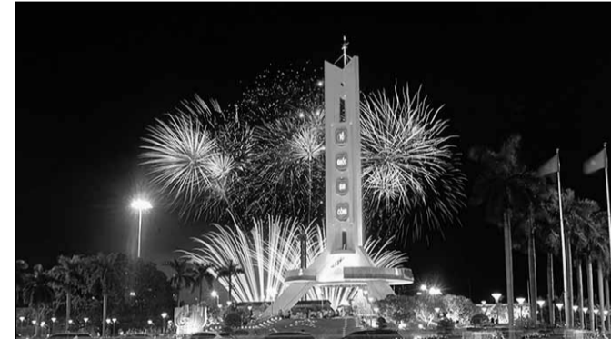
Công trình nâng cấp, tôn tạo Đài Tưởng niệm thành phố và cải tạo, mở rộng Quảng trường 29-3 là tình cảm, trách nhiệm và kết quả của sự nỗ lực, tinh thần vì sự phát triển của thành phố của Đảng bộ, chính quyền, nhân dân thành phố.

Ngày 13-5, thành phố tổ chức thông xe tuyến đường vành đai phía tây (đoạn từ quốc lộ 14B đến đường Hồ Chí Minh). Tuyến đường hoàn thành khớp nối hoàn chỉnh hệ thống đường vành đai bao quanh thành phố. Đồng thời kết nối mạng lưới giao thông Đà Nẵng với giao thông khu vực các tỉnh miền Trung - Tây Nguyên thông qua các tuyến đường quốc lộ 1A, quốc lộ 14B, đường Hồ Chí Minh và hệ thống đường trục ngang của thành phố. Trước đó, ngày 30-1, thành phố khánh thành 3 công trình: nâng cấp, cải tạo đường ĐT 601, tuyến đường ĐH2 từ Hòa Nhơn và đường vành đai phía tây 2 (đoạn từ đường số 8 đến nút giao cuối tuyến). Ngày 30-8, UBND thành phố tổ chức khánh thành công trình nâng cấp, tôn tạo Đài tưởng niệm thành phố và cải tạo, mở rộng Quảng trường 29-3.