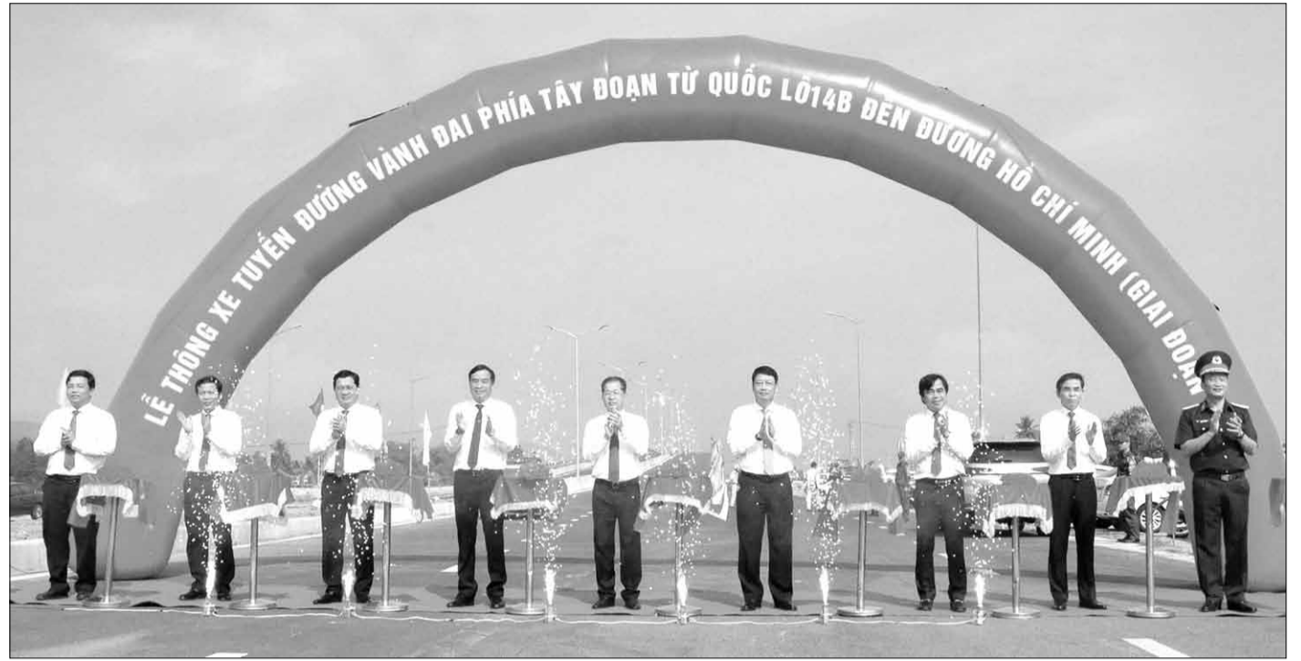
Lãnh đạo thành phố cắt băng thông xe tuyến đường vành đai phía tây đoạn từ quốc lộ 14B đến đường Hồ Chí Minh.

Theo đó, UBND thành phố chủ động, bám sát các cơ quan Trung ương như Quốc hội, Chính phủ, các bộ ngành để đề xuất cụ thể hóa chủ trương của Bộ Chính trị về việc áp dụng chính thức mô hình chính quyền đô thị và nghiên cứu đề xuất các cơ chế, chính sách đặc thù vượt trội cho thành phố. Qua gần 6 tháng nghiên cứu, xúc tiến khẩn trương, trách nhiệm của các sở, ban, ngành thành phố và sự hỗ trợ tích cực của các cơ quan Trung ương, ngày 26-6-2024, Quốc hội đã ban hành Nghị quyết số 136/2024/QH15. Đây là những cơ sở chính trị và pháp lý quan trọng giúp cho thành phố phát huy tiềm năng, lợi thế, tạo bước đột phá trong phát triển kinh tế - xã hội thời gian đến.