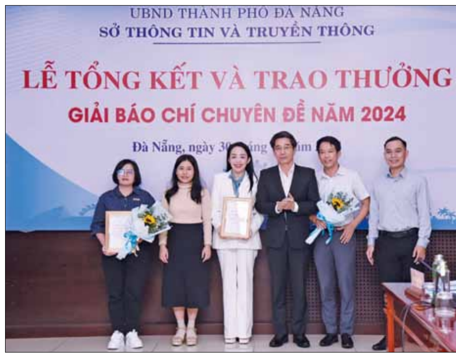
Phó Chủ tịch UBND thành phố Trần Chí Cường (thứ 3, bên phải) trao giải Nhất Giải Báo chí Tuyên truyền về Chuyển đổi số của thành phố Đà Nẵng cho nhóm tác giả của Báo Đà Nẵng.