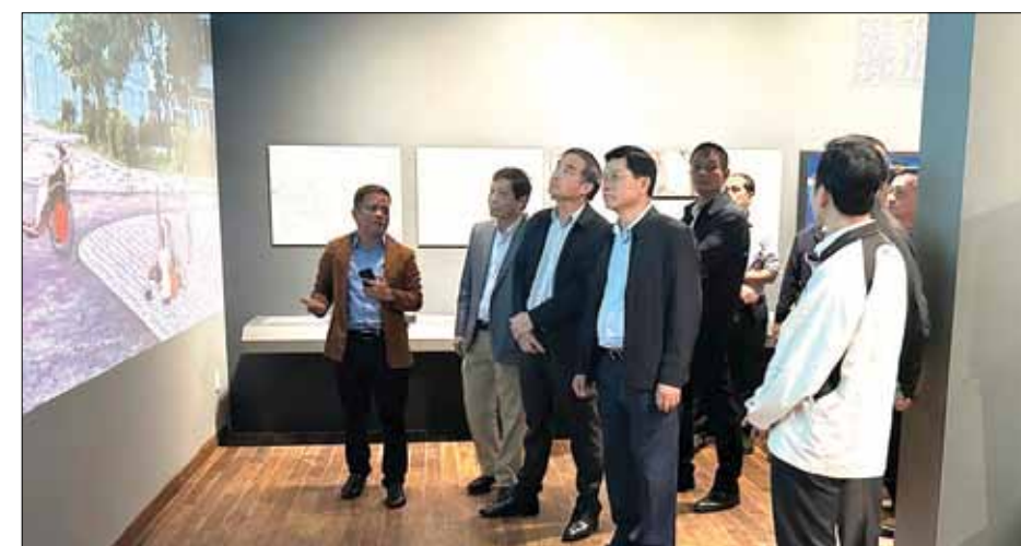
Chủ tịch UBND thành phố Lê Trung Chinh (thứ 3, bên trái) và Phó Chủ tịch Thường trực HĐND thành phố Trần Phước Sơn (thứ 4, bên trái) kiểm tra thực tế dự án Cải tạo hệ thống thoát nước, hạ ngầm cáp thông tin, điện chiếu sáng đường Hùng Vương.

Sáng 2-1, Chủ tịch UBND thành phố Lê Trung Chinh và Phó Chủ tịch Thường trực HĐND thành phố Trần Phước Sơn kiểm tra thực tế dự án Cải tạo hệ thống thoát nước, hạ ngầm cáp thông tin, điện chiếu sáng đường Hùng Vương -