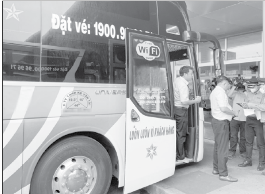
Lực lượng Thanh tra giao thông (Sở Giao thông vận tải) kiểm tra hoạt động của xe khách tại Bến xe Trung tâm Đà Nẵng.

Tương tự, ngày 24-12-2024, anh H.T.T đặt vé giường nằm của nhà xe T.H.S đi tuyến Đà Nẵng - huyện Tân Kỳ (Nghệ An) cho ngày đi 28-12-2024 và được báo giá 350.000 đồng/