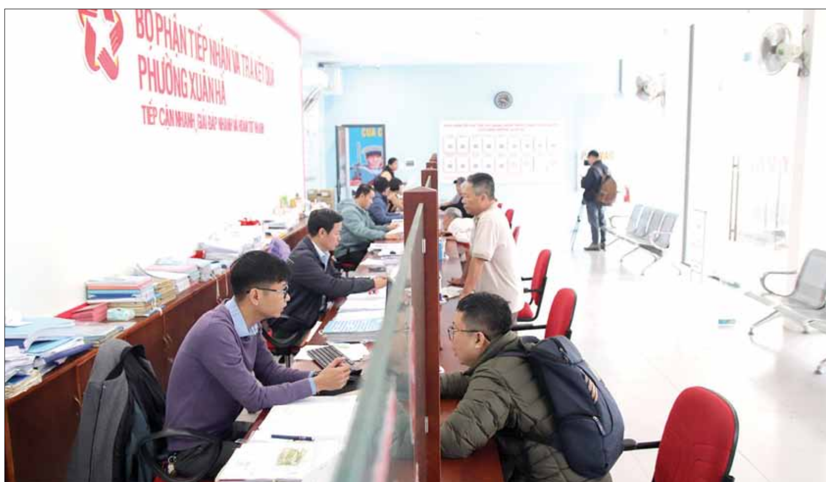
Ngày từ ngày đầu đi vào hoạt động, các phường mới trên địa bàn quận Thanh Khê, Hải Châu, Sơn Trà đã chủ động tiếp nhận, giải quyết các yêu cầu về thủ tục hành chính cho tổ chức, công dân bảo đảm thông suốt, hiệu quả. TRONG ẢNH: Giao dịch tại bộ phận "Một cửa" phường Xuân Hà sáng 2-1.