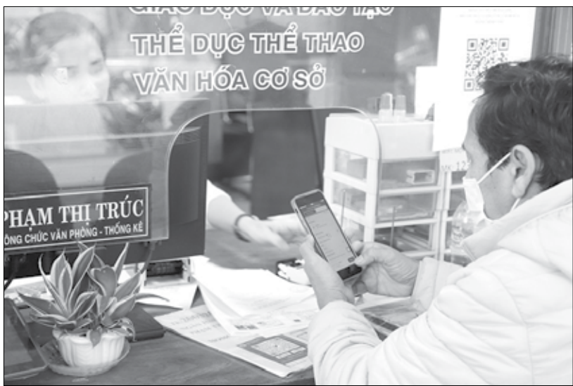
Ngày từ ngày đầu đi vào hoạt động, các phường mới trên địa bàn quận Thanh Khê, Hải Châu, Sơn Trà đã chủ động tiếp nhận, giải quyết các yêu cầu về thủ tục hành chính cho tổ chức, công dân bảo đảm thông suốt, hiệu quả.

Ngày 2-1, các phường mới sáp nhập theo Nghị quyết số 1251/NQ-UBTVQH 15 của Ủy ban Thường vụ Quốc hội về việc sắp xếp đơn vị hành chính cấp huyện, cấp xã của thành phố Đà Nẵng giai đoạn 2023 - 2025 chính thức đi vào hoạt động. Qua ghi nhận của Báo Đà Nẵng, mọi hoạt động bảo đảm thông suốt, thuận lợi.