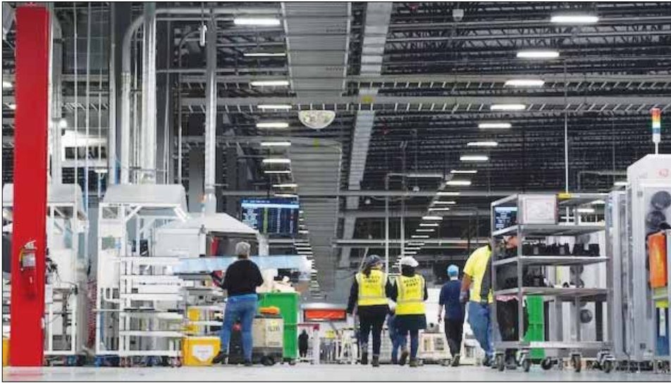
Công nhân tại nhà máy sản xuất năng lượng mặt trời QCells ở Dalton, Georgia (Mỹ).

Kinh tế toàn cầu sẽ duy trì tốc độ tăng trưởng vào năm 2025 khi các ngân hàng trung ương lớn thực hiện một loạt các đợt cắt giảm lãi suất trong bối cảnh nền kinh tế Mỹ vẫn mạnh mẽ, theo dự báo của các chuyên gia trên thế giới.