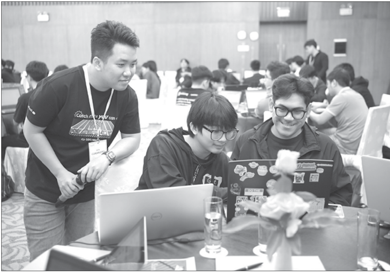
Thành phố hiện có khoảng 2,3 doanh nghiệp công nghệ số/1.000 dân, đứng thứ 2 cả nước. TRONG ANH: Các lập trình viên tham gia cuộc thi Devfest năm 2024 do cộng đồng công nghệ Google Developer Group miền Trung tổ chức.

Về kinh tế số, doanh thu hoạt động thông tin và truyền thông ước đạt 18.486 tỷ đồng, tăng 8,9% so với năm 2023. Kim ngạch xuất khẩu phần mềm đạt 159 triệu USD, tăng 7,6% so với năm 2023. Thành phố hiện có khoảng 2,3 doanh nghiệp công nghệ số/1.000 dân (đứng thứ 2 cả nước, tỷ lệ trung bình cả nước 0,7 doanh nghiệp công nghệ số/1.000 dân). Tổng nhân lực công nghệ thông tin khoảng 53.000 người, chiếm 8,5% tổng lực lượng lao động thành