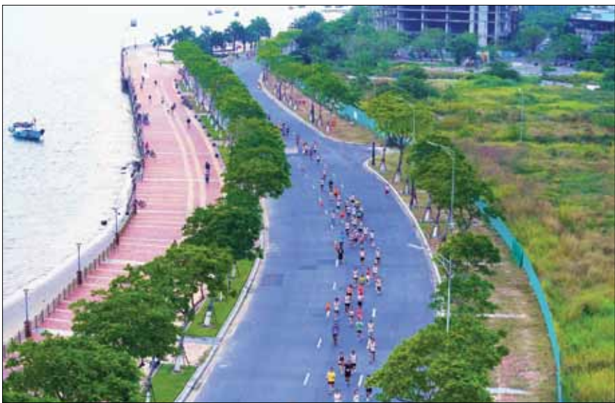
Phong trào thể thao trên địa bàn thành phố lan tỏa sâu rộng, thu hút đông đảo người dân tập luyện, thi đấu thường xuyên. TRONG ẢNH: Các vận động viên tham gia giải Marathon quốc tế Đà Nẵng năm 2024.