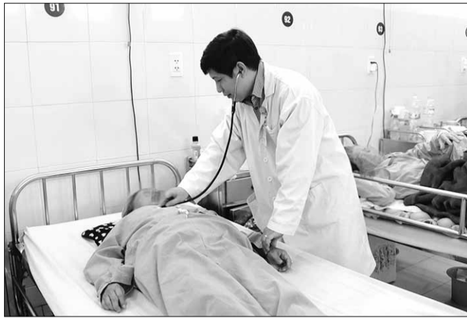
Khi thời tiết chuyển lạnh, số lượng bệnh nhân cao tuổi đến khám và nhập viện điều trị tại Bệnh viện Đà Nẵng tăng.

Theo các bác sĩ, vào mùa lạnh, bệnh nhân cao tuổi thường mắc các bệnh về đường hô hấp như viêm phế quản, viêm phổi và bệnh về đường tiêu hóa như nhiễm trùng đường ruột; các bệnh lý tim mạch như huyết áp cao, suy tim và đột quỵ; các bệnh về xương khớp. So với những nhóm tuổi khác, việc điều trị cho bệnh nhân cao tuổi khó