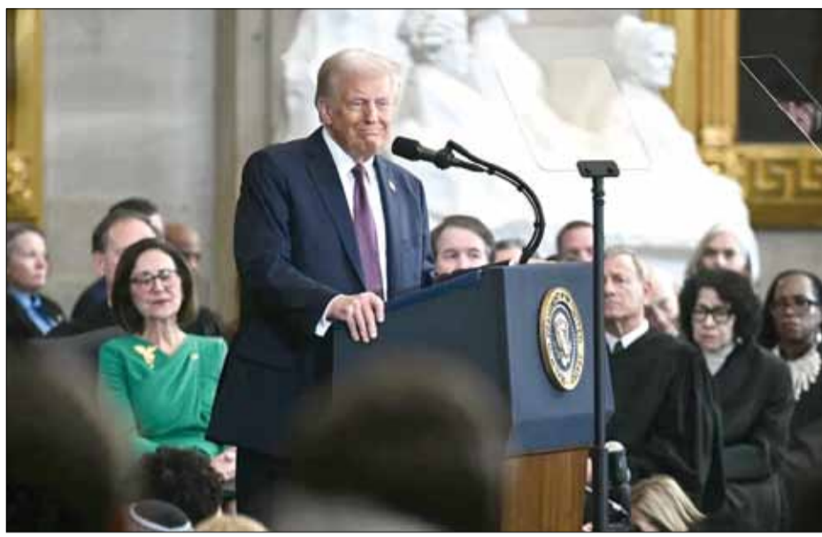
Ông Donald Trump phát biểu nhậm chức Tổng thống Mỹ ngày 20-1.