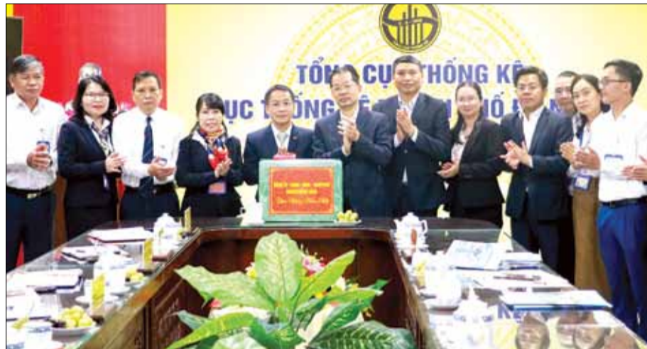
Bí thư Thành ủy Nguyễn Văn Quảng (thứ 6, bên trái sang) chúc mừng năm mới các bộ, ngành, đơn vị và người lao động Cục Thống kê.

Ngày 21-1, phát biểu khi đến thăm, chúc Tết Cục Thống kê thành phố, Ủy viên Trung ương Đảng, Bí thư Thành ủy, Trưởng đoàn Đại biểu Quốc hội thành phố Nguyễn Văn Quảng ghi nhận, biểu dương năm 2024, ngành thống kê thành phố đạt nhiều kết quả tốt. Thời gian tới, ngành thống kê cần tập