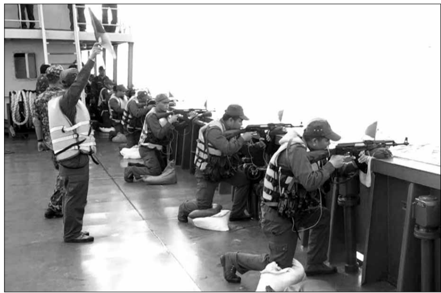
Hải đội dân quân thường trực, Bộ Chỉ huy Quân sự thành phố phối hợp chặt chẽ các lực lượng sẵn sàng chiến đấu, giữ vững chủ quyền biển đảo, bảo vệ mùa Xuân bình yên cho nhân dân.

Năm 2024 khép lại với nhiều kết quả xuất sắc, thành tích ấn tượng của lực lượng vũ trang (LLVT) thành phố trong các mặt công tác quốc phòng, quân sự địa phương, xây dựng cơ quan, đơn vị vững mạnh toàn diện "mẫu mực tiêu biểu", xây dựng "thế trận lòng dân" vững chắc, đáp ứng yêu cầu sẵn sàng bảo vệ Tổ quốc trong mọi tình huống. Trước thềm năm mới 2025, LLVT thành phố quyết tâm hoàn thành thắng lợi mọi chỉ tiêu, nhiệm vụ đề ra.