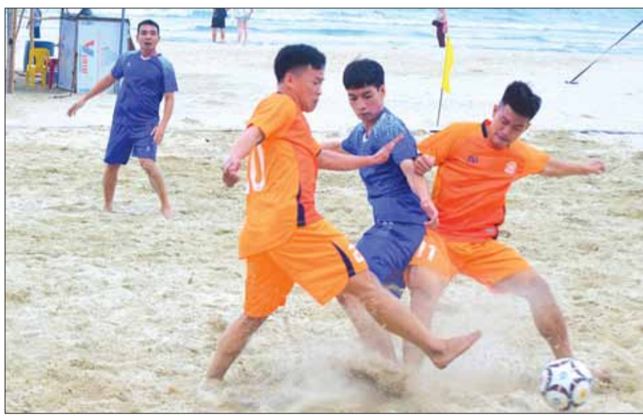
Dịp Tết Nguyên đán Ất Tỵ 2025, quận Thanh Khê sẽ tổ chức giải bóng đá bãi biển.