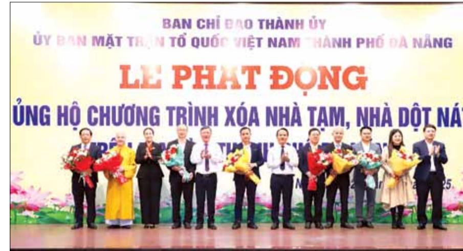
Lãnh đạo thành phố tiếp nhận, tặng hoa cảm ơn 8 tổ chức ủng hộ tại lễ phát động.