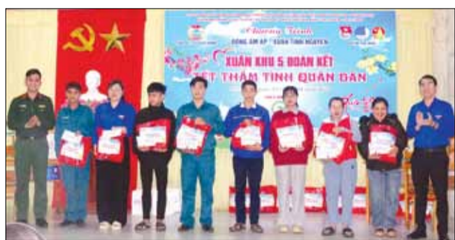
Đoàn thanh niên lực lượng vũ trang thành phố tặng quà Tết Ất Tỵ 2025 cho hộ nghèo, chiến sĩ dân quân khó khăn xã Hòa Bắc (huyện Hòa Vang) trong chương trình "Xuân khu 5 đoàn kết - Tết thăm tình quân dân" 2025.