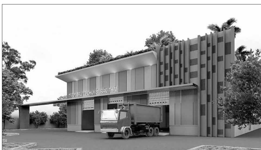
Mô hình Trạm trung chuyển rác khu vực quận Cẩm Lệ được khởi công và xây dựng trong năm 2025.

Ghi nhận tại phường Hòa Xuân, Xí nghiệp Môi trường Cẩm Lệ 2 (Công ty CP Môi trường đô thị Đà Nẵng) đã phối hợp triển khai phương án cơ giới hóa thu gom rác thải bằng xe ép rác thế hệ mới loại nhỏ vào ban đêm rồi đưa về trạm trung chuyển rác trên đường Lê Thanh Nghị, giúp nâng cao chất lượng vệ sinh môi trường trên địa bàn phường. Đầu năm 2025, trạm trung chuyển rác khu vực quận Cẩm Lệ (trên địa bàn phường Hòa Xuân) được khởi công xây dựng thêm tỷ lệ cơ giới hóa và tăng suất thu gom