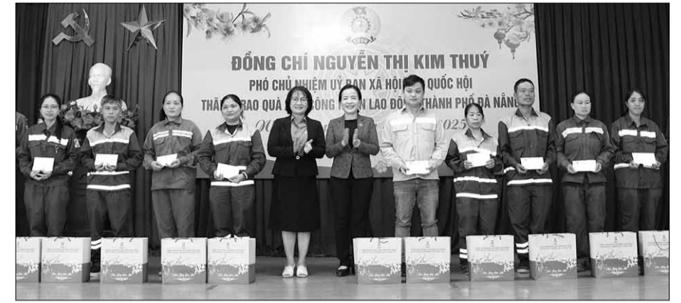
Phó Chủ nhiệm Ủy ban Xã hội của Quốc hội Nguyễn Thị Kim Thủy (thứ 6, bên trái sang) đến thăm, tặng quà và động viên công nhân Công ty CP Môi trường đô thị Đà Nẵng giữ gìn vệ sinh môi trường sạch, đẹp phục vụ Tết Ất Tỵ.

Nhằm bảo đảm vệ sinh môi trường và cảnh quan đô thị sạch, đẹp để phục vụ Tết Nguyên đán Ất Tỵ 2025, Công ty CP Môi trường đô thị Đà Nẵng đã và đang huy động tất cả phương tiện cơ giới cùng toàn bộ cán bộ, nhân viên, công nhân tổng dọn vệ sinh đường phố, khu vực công cộng và thu gom, vận chuyển rác tại các quận, huyện.