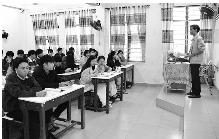
Theo khảo sát sơ bộ, Trường THPT Trần Phú có hơn 600 học sinh đăng ký Ngoại ngữ là môn thi tự chọn trong kỳ thi tốt nghiệp THPT 2025.

Kỳ thi tốt nghiệp THPT 2025 đang đến gần với nhiều thay đổi trong cả cách thức, môn thi lẫn cấu trúc đề thi. Trong đó, môn Ngoại ngữ có nhiều thay đổi liên quan đến đề thi và quy định sử dụng chứng chỉ Ngoại ngữ để miễn thi, học sinh cần hết sức lưu ý.