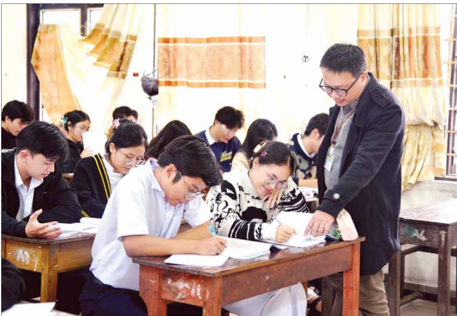
Học sinh lớp 12 Trường THPT Trần Phú trong một tiết học.