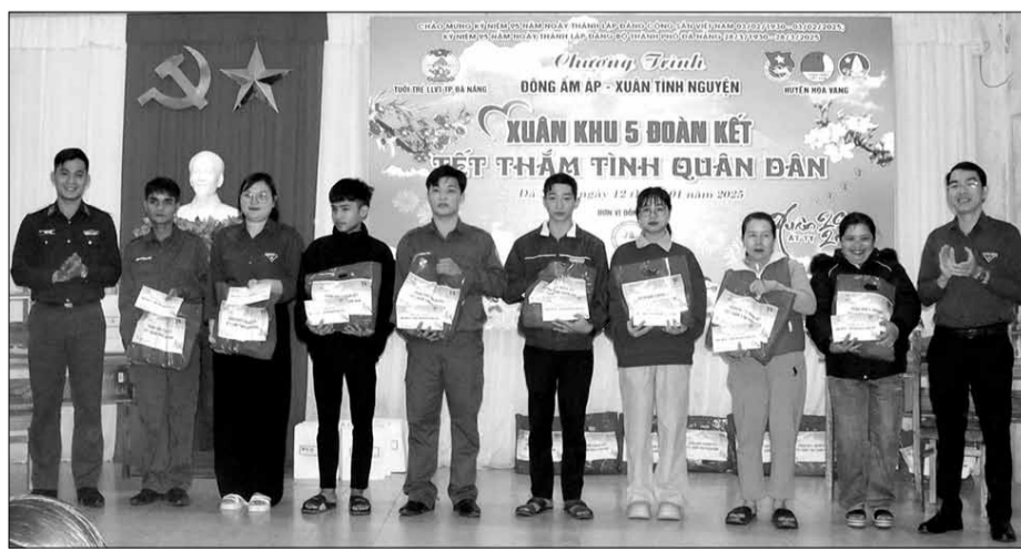
Đoàn thanh niên lực lượng vũ trang thành phố tặng quà Tết Ất Tỵ 2025 cho hộ nghèo, chiến sĩ dân quân khó khăn xã Hòa Bắc (huyện Hòa Vang) trong chương trình "Xuân khu 5 đoàn kết - Tết thăm tình quân dân" 2025.

Tại xã Hòa Bắc, Đoàn thanh niên LLVT thành phố phối hợp Ban Chỉ huy Quân sự huyện Hòa Vang tổ chức chương trình "Xuân Khu 5 Đoàn kết - Tết thăm tình quân dân". Những năm qua, đời sống của phần lớn bà con đồng bào dân tộc thiểu số sinh sống tại đây khởi sắc, thu nhập ổn định nhờ sản xuất nông nghiệp, trồng cây gây rừng. Tuy nhiên, vẫn còn không ít gia đình có hoàn cảnh khó khăn. Tuổi trẻ LLVT thành phố phối hợp chính quyền địa phương trao tặng 30 phần quà cho các hộ nghèo và học sinh vượt khó, góp phần mang đến niềm vui, động viên tinh thần để bà con yên tâm, phấn khởi đón Tết dù đây, an vui. Đón bộ đội về với quê hương, sự phấn khởi hào hứng hiện rõ trên ánh mắt, nụ cười từ người già đến trẻ nhỏ. Bên những cánh mai rừng khoe