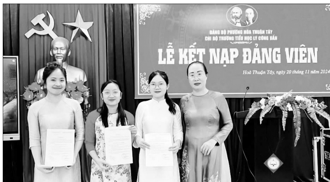
Một trong những điểm nổi bật của ngành giáo dục trong triển khai thực hiện Chỉ thị số 34-CT/TU, đó là nỗ lực triển khai thực hiện công tác xây dựng Đảng, đặc biệt là tạo nguồn phát triển đảng viên mới. TRONG ẢNH: Chi bộ Trường Tiểu học Lý Công Uẩn, quận Hải Châu tổ chức lễ kết nạp đảng.

Đồng thời yêu cầu các đảng ủy cơ sở trực thuộc gắn việc thực hiện Chỉ thị số 34-CT/TU với Nghị quyết Trung ương 4 (khóa XI, XII); Kết luận số 21-KL/TW của Ban Chấp hành Trung ương Đảng (khóa XII) về đẩy mạnh xây dựng, chỉnh đốn Đảng và hệ thống chính trị. Toàn thể cán bộ, viên chức, đảng viên phải tiến hành viết bản cam kết thực hiện Chỉ thị số 34-CT/TU gắn với chức trách, nhiệm vụ được giao. Người đứng đầu cấp ủy, cơ quan, đơn vị chịu trách nhiệm chỉ đạo rà soát, bổ sung các nội dung cam kết của từng cán bộ, viên chức, đảng viên trước khi xác nhận, nhất là để rà các biện pháp khắc phục, ngăn chặn, đẩy lùi 10 biểu hiện; thường họp ban thanh không vi phạm thì có trách nhiệm đề xuất giải pháp, góp phần ngăn chặn, đẩy lùi các biểu hiện. Đặc biệt, từng cơ quan, đơn vị chịu trách nhiệm kiểm tra, đánh giá kết quả thực hiện cam kết của cán bộ, viên chức, đảng viên, xác định đây là tiêu chí đánh giá quan trọng trong công tác thi đua, luân chuyển, điều động, bổ nhiệm cán bộ.