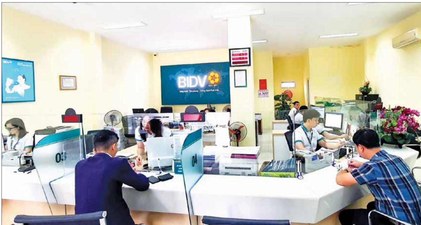
Hoạt động giao dịch tại Ngân hàng TMCP Đầu tư và Phát triển Việt Nam - BIDV chi nhánh Đà Nẵng.