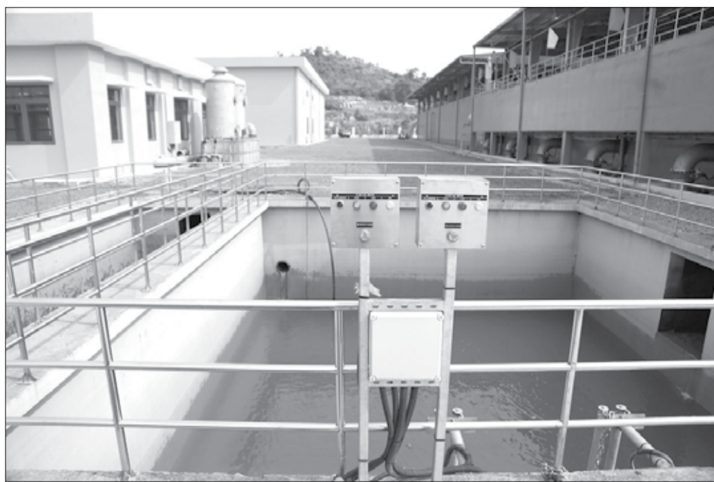
Nhà máy nước Hòa Liên đi vào hoạt động đã bổ sung trung bình 80.000m 3 /ngày, đêm vào hệ thống phân phối nước cho thành phố.

Để bảo đảm cấp nước ổn định cho người dân cũng như các hoạt động của thành phố, Dawaco đã triển khai nhiều giải pháp đồng bộ trong năm 2025. Trước hết, chúng tôi tối ưu hóa vận hành các nhà máy nước, tăng cường kiểm tra, giám sát hoạt động của các nhà máy, trạm bơm nhằm nâng cao hiệu quả cấp nước. Đồng thời, công ty tiếp tục đầu tư phát triển