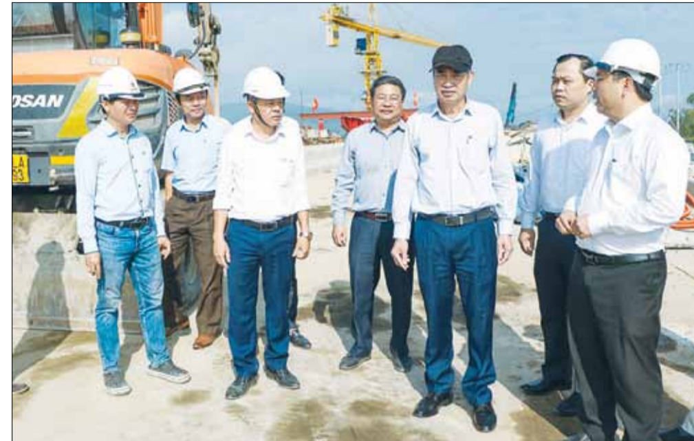
Chủ tịch UBND thành phố Lê Trung Chinh (thứ 3, bên phải) yêu cầu các đơn vị chuẩn bị kỹ lưỡng phương án tổ chức thông xe.