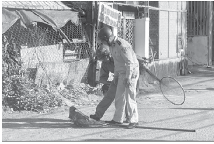
Tổ bắt, xử lý chó thả rông phường Thanh Khê Tây ra quân xử lý vi phạm.

Qua đường dây nóng Báo Đà Nẵng, bạn đọc phản ánh tình trạng chó, mèo thả rông vẫn diễn ra phổ biến trên địa bàn thành phố, tiềm ẩn nguy cơ mất an toàn cho người dân, du khách. Đồng thời, ảnh hưởng vệ sinh môi trường và mỹ quan đô thị. Từ thực tế này, địa phương cần có thêm giải pháp tăng cường hiệu quả hoạt động của các đội bắt và xử lý chó, mèo thả rông.