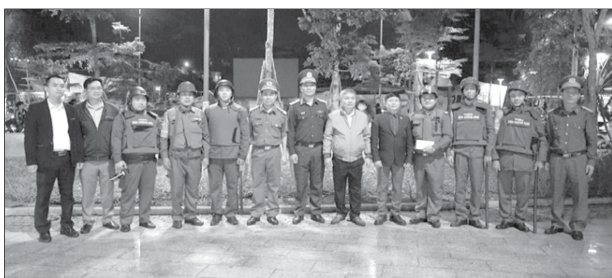
Lãnh đạo quận Hải Châu thăm, động viên lực lượng tuần tra 8394 phường Hòa Cường Nam đang thực hiện nhiệm vụ tại công viên Bình An.

Phong trào toàn dân bảo vệ an ninh Tổ quốc trên địa bàn thành phố ngày càng phát triển sâu rộng. Các cơ quan, đơn vị, địa phương thường xuyên củng cố, nhân rộng và phát huy hiệu quả các mô hình tiên tiến. Trong đó, chú trọng đa dạng các hình thức tuyên truyền, phối hợp tuần tra kiểm soát nhằm thu hút, tập hợp đông đảo cán bộ, đảng viên và các tầng lớp nhân dân tích cực tham gia phòng, chống tội phạm và tệ nạn xã hội.