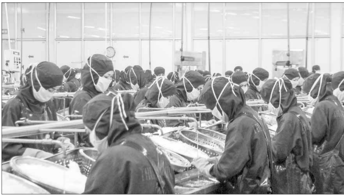
Đẩy mạnh kết nối ngân hàng - doanh nghiệp để thúc đẩy tín dụng tăng trưởng. TRONG ẢNH: Sản xuất tại Công ty CP Thủy sản và Thương mại Thuận Phước.

Tại hội nghị đẩy mạnh tín dụng ngân hàng, góp phần thúc đẩy tăng trưởng kinh tế do Ngân hàng Nhà nước Việt Nam tổ chức tại Đà Nẵng ngày 12-3, các tổ chức tín dụng, doanh nghiệp đề xuất các giải pháp kết nối ngân hàng - doanh nghiệp hiệu quả, đồng thời tạo điều kiện thuận lợi trong tiếp cận vốn tín dụng của người dân, doanh nghiệp.