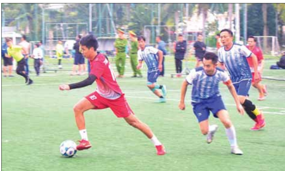
Nhiều giải đấu được tổ chức với chất lượng chuyên môn cao góp phần đưa phong trào bóng đá phát triển. TRONG ẢNH: Các vận động viên tranh tài tại giải bóng đá Thanh niên sinh viên Việt Nam năm 2025.

Phong trào bóng đá trên địa bàn thành phố phát triển mạnh, thu hút đông đảo thành phần, lứa tuổi tập luyện, thi đấu. Đáng chú ý, nhiều giải đấu phong trào được tổ chức thường xuyên với chất lượng chuyên môn cao, đáp ứng nhu cầu vui chơi thể thao của các vận động viên.