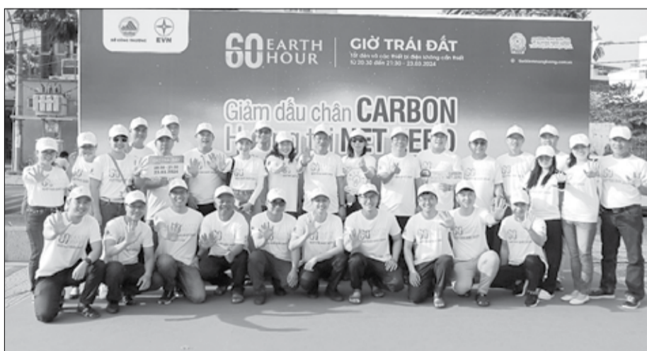
Cán bộ công nhân viên PC Đà Nẵng tích cực hưởng ứng sự kiện Giờ Trái đất.

Giờ Trái đất 2025 diễn ra từ 20 giờ 30 đến 21 giờ 30 thứ Bảy, ngày 22-3-2025 mang thông điệp “Chuyển dịch xanh - Tương lai xanh” với mong muốn tất cả người dân, cộng đồng và doanh nghiệp cùng chung tay, góp sức ứng phó với biến đổi khí hậu, bảo vệ môi trường, tiết kiệm năng lượng, hướng tới một tương lai xanh và bền vững.